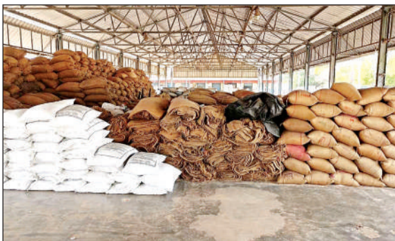
आवंटित नीलामी चबूतरा में डंप व्यापारियों का माल। अमृत विचार

अमृत विचार। कस्बे की नवीन गल्ला मंडी में गेहूं खरीद केंद्रों के लिए नीलामी चबूतरा संख्या चार आवंटित किया गया है। लेकिन पूरे चबूतरे में व्यापारियों का माल डंप होने से गेहूं खरीद के लिए जगह नहीं है। मंडी सचिव का तर्क है कि अभी केंद्र खोलने के लिए जगह दी गई है। जरूरत पड़ने पर इसको खाली कराया जाएगा।