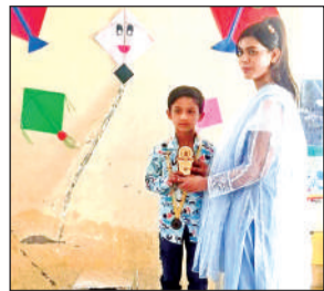
छात्र को सम्मानित करती शिक्षक।

विद्यालय हाल में सभी कक्षाओं की क्लास टीचर्स अलग अलग बैठे नजर आए, जिन्होंने कक्षा में पढ़ने वाले बच्चों और उसके अभिभावकों को एक एक कर बुलाते हुए स्टूडेंट के शैक्षणिक प्रगति पर चर्चा की। इस मौके पर बच्चों के अलावा उसके अभिभावकों से विद्यालय परिसर गुलजार रहा। पीटीएम बैठक के दौरान सभी कक्षाओं की