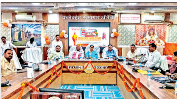
कार्यक्रम के दौरान मौजूद सदर विधायक, डीएम व अन्य।

अमृत विचार। जनपद में महिला सशक्तिकरण की दिशा में एक महत्वपूर्ण पहल करते हुए 603 नव चयनित आंगनवाड़ी सहायिकाओं को नियुक्ति पत्र वितरित किए गए। इस अवसर पर 192 आंगनवाड़ी कार्यकर्त्रियों एवं 27 मुख्य सेविकाओं को स्मार्टफोन भी प्रदान किए गए। कार्यक्रम का आयोजन कलेक्ट्रेट स्थित मानस सभागार में किया गया, जहां योगी आदित्यनाथ के लखनऊ स्थित लोकभवन सभागार से संबोधन का सजीव प्रसारण भी दिखाया गया।