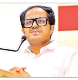
आंगनबाड़ी कार्यकर्ताओं को संबोधित करते जिलाधिकारी पुलकित गर्ग।

कार्यक्रम का शुभारंभ जिलाधिकारी पुलकित गर्ग के साथ जनप्रतिधियों, अधिकारियों ने दीप प्रज्वलन से किया। इस दौरान मुख्यमंत्री के संबोधन का सीधा सजीव प्रसारण भी देखा गया। जिलाधिकारी ने इन कर्मचारियों को बधाई देते हुए कहा कि आंगनबाड़ी केंद्रों पर आम जनमानस का भरोसा निरंतर बढ रहा है। उन्होंने व्यक्तिगत उदाहरण सझा