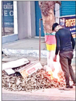
बस स्टैंड के पास कूड़े को जलाना कर्मों।

अमृत विचार। कस्बे में नगर पालिका परिषद की लापरवाही का एक और वीडियो सोशल मीडिया पर वायरल हो रहा है। इस वीडियो में नगर पालिका के ही कर्मचारी बस स्टैंड के पास मैन रोड किनारे इकट्ठा किए गए कूड़े को जलाते हुए नजर आ रहे हैं। गौरतलब हो कि नेशनल ग्रीन ट्रिब्यूनल और प्रदूषण नियंत्रण बोर्ड के स्पष्ट निर्देश हैं कि कूड़े को खुले में जलाना अपराध है। इससे वायु प्रदूषण तो फैलता ही है, साथ ही आग लगने और जहरीली गैसों के फैलने का खतरा भी बना रहता है। ताज्जुब की बात यह है कि नगर पालिका द्वारा हर वार्ड में कूड़ा इकट्ठा करने के लिए कूड़ा गाड़ी और ट्रैक्टर भेजे जाते हैं। इसके