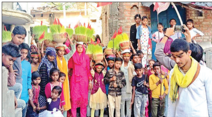
बेरी गांव में जवारा जुलूस निकालते ग्रामीण।

कुरारा (हमीरपुर)। क्षेत्र के बेरी गांव में पारंपरिक आस्था और श्रद्धा के साथ जवारा का विर्सजन जुलूस घूमघूम से निकाला गया। इस दौरान गांव का माहौल पूरी तरह भक्तिमय हो गया और बड़ी संख्या में श्रद्धालु शामिल हुए। जुलूस में महिलाएं सिर पर जवारे लेकर भक्ति गीत गाती हुईं चल रही थीं। वहीं पुरुष और युवा भी बद्ध-चढ़कर शामिल हुए। ढोल-नगाड़ों और जयकारों के बीच पूरा गांव आस्था में सराबोर नजर आया। ग्रामीणों ने बताया कि यह परंपरा वर्षों से चली आ रही है, जिसमें क्षेत्र के लोग बद्ध-चढ़कर भाग लेते हैं। जुलूस गांव के विभिन्न मार्गों से होकर गुजरा, जहां जगह-जगह लोगों ने पुष्प वर्षा कर श्रद्धालुओं का स्वागत किया। कार्यक्रम के दौरान सुरक्षा और व्यवस्था बनाए रखने के लिए स्थानीय प्रशासन भी सतर्क रहा। जुलूस शांतिपूर्ण ढंग से संपन्न हुआ।