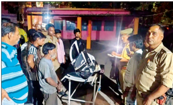
अस्पताल में मौजूद लोगों की भीड़।