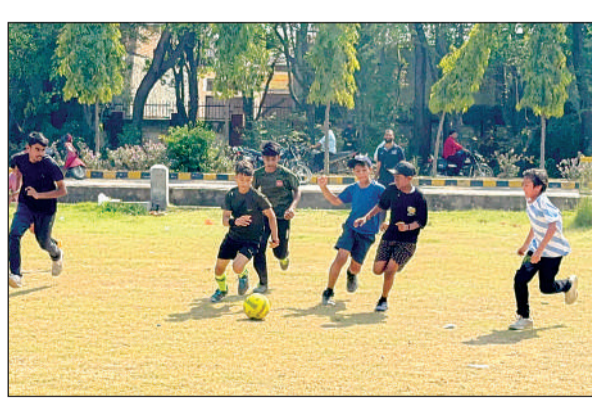
फुटबाल खेलते खिलाड़ी।

अमृत विचार । आयुर्विज्ञान विश्वविद्यालय के सामने स्थित मैदान में डॉ. भीमराव आंबेडकर फाउंडेशन की तीन दिवसीय खेलकूद प्रतियोगिता के पहले दिन ही बच्चों ने शानदार खेल का प्रदर्शन किया। फुटबॉल और क्रिकेट मुकाबलों में खिलाड़ियों ने दमखम दिखाते हुए दर्शकों को रोमांचित कर दिया।