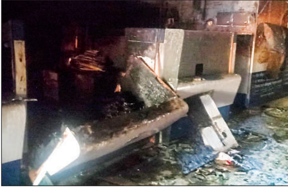
कंप्यूटर और अन्य सामान की यह हो गई हालत।