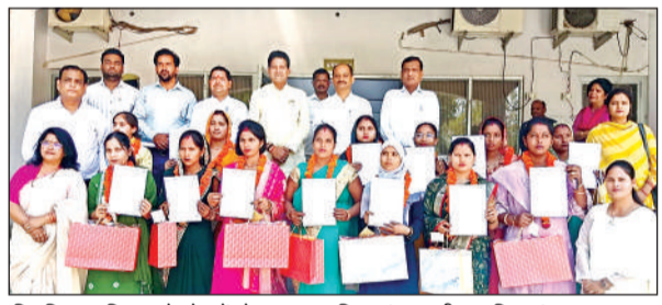
नियुक्ति पत्र लिए कलेक्ट्रेट में मौजूद नवचयनित आंगनवाड़ी सहायिकाएं, भाजपा जिलाध्यक्ष, डीएम, सीडीओ व डीपीओ।

छत के कुंडे से गले में फंदा डाल कर आत्महत्या कर ली। मौत की जानकारी पर परिजनो में कोहराम मच गया। आनन-फानन में पुलिस को सूचना देकर शव को उतारा गया। पुत्र का शव देखकर मां का रो रोकर बुरा हाल है। मां ने थाने में प्रार्थना पत्र देते हुए बताया कि मेरे पुत्र की पत्नी का मोहल्ले के ही एक लड़के से प्रेम प्रसंग था जिसकी जानकारी उसने पुत्रवधू के पिता व मां एवं पुत्रवधू के भाई को दी लेकिन उनके द्वारा उसे नहीं समझाया गया, जिसके चलते मेरे पुत्र व बहू में आए दिन बाद विवाद होता रहता था। इसीके चलते रविवार को आपस में विवाद हुआ और पुत्र ने कमरे में जाकर फंदा लगाकर आत्महत्या कर ली। पुलिस ने मृतक की मां की तहरीर पर जांच पड़ताल प्रारंभ कर दी है।