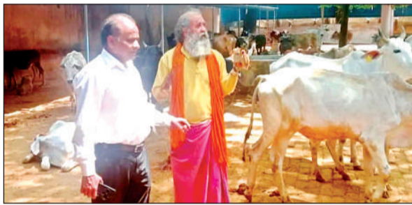
गौशाला का निरीक्षण करते एसडीएम।