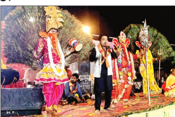
जागरण के दौरान झांकी प्रस्तुत करते कलाकार।