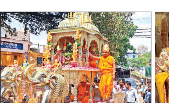
रथ पर सवार भगवान महावीर की प्रतिमाला।

सोमवार को शहर के छिपट्टी मोहल्ला स्थिति जैन मंदिर से भगवान महावीर स्वामी की भव्य शोभा यात्रा निकाली गई। रथ पर सवार भगवान महावीर की सोने की प्रतिमा को पूरे शहर के मोहल्लों छिपट्टी से निकल कर हाजीगंज, हरदेवगंज, पाटानाला, लाखन चौराहा, मिठाईगली, छाटा चौराहा, फर्श रोड, शब्जी मण्डी से निकाली