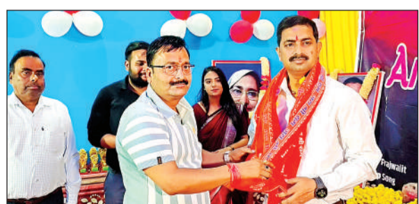
एमएलसी का सम्मान करते आयोजक।

स्कूल के वार्षिकोत्सव में विद्यालय के बच्चों ने नृत्य संगीत की शानदार प्रस्तुति देते हुए अपनी