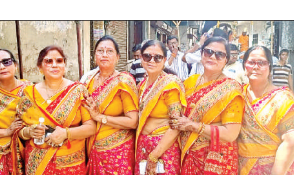
अमृत विचार यात्रा में शामिल महिला भक्त।

गई। यात्रा शहर में भ्रमण करने के बाद जैन मंदिर पहुंच कर समाप्त हुई। यात्रा का शहर में जगह जगह स्वागत किया गया। वहीं लोगों ने कई स्थानों पर पूजा की। बच्चों ने कई स्थानों पर जलपात्र की व्यवस्था की थी। यात्रा में पुरुषों के अलावा महिलाएं शामिल रहीं। कन्नौज नगर