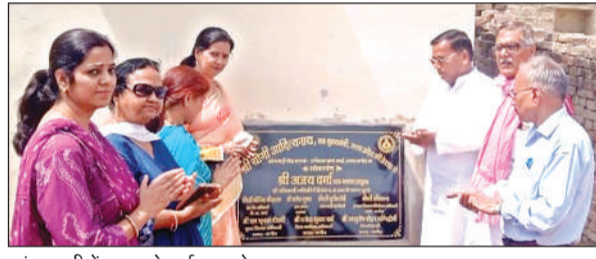
आंगनवाड़ी केंद्र का लोकार्पण करते ब्लाक प्रमुख व अन्य।

है। मच्छरों का भी प्रकोप जारी है। लोगों को चाहिये के मौसम के अनुसार मच्छरों से बचाव करें। फुल आस्तीन के कपड़े पहनें। हां सके तो मच्छरदानी का प्रयोग करें। घर व घर के आसपास पानी न रुकने दें। ताजे फलों के अलावा ताजा खाना खायें। लस्सी या शिकंजी का प्रयोग करें। बुखार होने पर तत्काल सरकारी अस्पताल में पहुंच कर डॉक्टर की सलाह ले कर जांच कराते हुए उपचार लें। खुद किसी दवा का प्रयोग बिना डॉक्टर की सलाह से न लें।