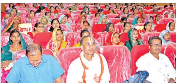
इस मौके पर मौजूद नवनि्युक्त कर्मी और अन्य लोग।