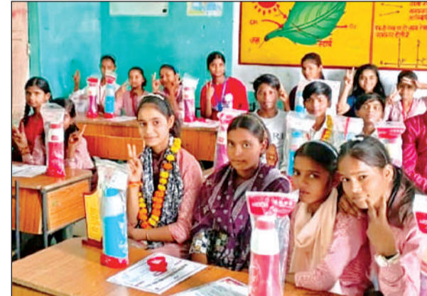
कंपोजिट विद्यालय किनौरा में उपहार व मेडल पाने के बाद खुशी जताने छात्र-छात्राएं।