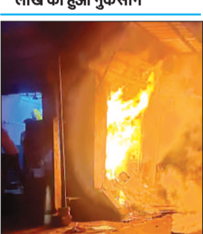
दुकान में लगी आग का दृश्य।

मिलते ही वह मौके पर पहुंचे, जहां तकरीबन सैकड़ों की संख्या में आसपास के लोग और कोतवाली पुलिस पहले से मौजूद थे।