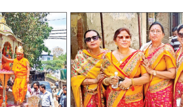
अमृत विचार यात्रा में शामिल महिला भक्त।