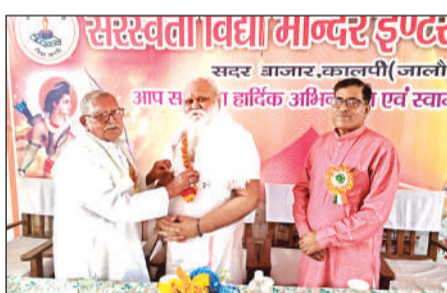
मुख्य अतिथि को सम्मानित करते आयोजक।