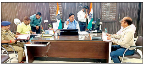
बैठक के दौरान निर्देश देते डीएम।