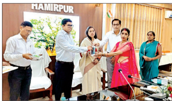
आंगनबाड़ी कार्यकर्ताओं को स्मार्टफोन देते विधायक व डीएम। अमृत विचार

अमृत विचार। कलेक्ट्रेट स्थित सभागार में राट विधायक मनीषा अनुरागी व जिलाधिकारी घनश्याम मीना की उपस्थिति में बाल विकास सेवा एवं पुच्छाहार विभाग की नव नियुक्त 12 आंगनबाड़ी कार्यकर्त्रियों एवं 23 सहायिकाओं को नियुक्ति पत्र वितरित किए गए। वहीं 38 आंगनबाड़ी कार्यकर्त्रियों एवं 16 मुख्य सेविकाओं को स्मार्टफोन का वितरण किया गया। साथ ही नवनिर्भित 06 आंगनबाड़ी केन्द्रों को लोकार्पण किया गया। इस अवसर पर लखनऊ में मुख्यमंत्री की उपस्थिति में प्रादेशिक स्तर