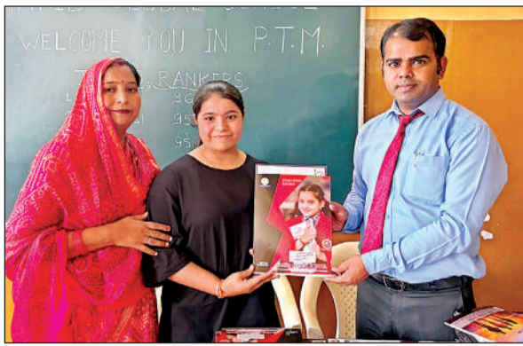
छात्रा को सम्मानित करते शिक्षक।