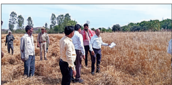
खेत में क्रॉप कटिंग करती टीम।

उपजिलाधिकारी टीम के साथ ग्राम पंचायत करहराकला के गाटा संख्या 2 में पहुंचे और गेहूं की क्रॉप कटिंग कराई। इस दौरान ग्रामीण भी मौजूद रहे। उन्होंने बताया कि प्रधानमंत्री फसल बीमा योजना के अंतर्गत सीसीई एग्री एप के जरिए 43.3 वर्ग मीटर फसल की क्रॉप कटिंग कराई गई, जिससे 13.820 किग्रा. उपज हासिल हुई, जबकि