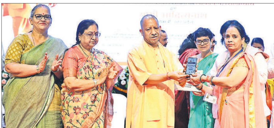
लखनऊ :लोक भवन सभागार में आंगनबाड़ी कार्यकर्त्री को नियुक्ति पत्र प्रदान करते मुख्यमंत्री योगी।

मुख्यमंत्री योगी लोकभवन में सोमवार को 69,804 आंगनबाड़ी कार्यकर्त्रियों व मुख्य सेविकाओं को स्मार्टफोन और 18,440 कार्यकर्त्रियों व सहायिकाओं को नियुक्ति पत्र वितरण कार्यक्रम में बोल रहे थे। उन्होंने 450 करोड़ रुपये से अधिक लागत वाली विभिन्न बाल विकास एवं महिला कल्याण परियोजनाओं का लोकार्पण व शिलान्यास भी किया। उन्होंने स्पष्ट कहा कि जब आंगनवाड़ी केंद्रों को स्मार्ट बनाया जा रहा है, तो वहां कार्य करने वाली महिलाओं