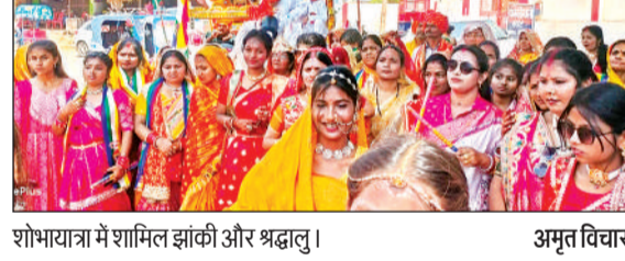
शोभायात्रा में शामिल झांकी और श्रद्धालु।

अनुशासन और त्वरित निस्तारण की प्रतिबद्धता को दर्शाती है।