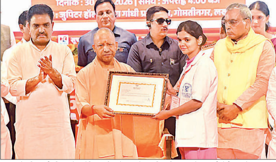
लखनऊ के इंदिरा गांधी प्रतिष्ठान में आयोजित कार्यक्रम में छात्रा को छात्रवृत्ति का वितरण करते मुख्यमंत्री योगी, साथ में अन्य।

मुख्यमंत्री सोमवार को इंदिरा गांधी प्रतिष्ठान में कक्षा 9-10 और दशमोत्तर के 27,99,982 विद्यार्थियों के खातों में 3350 करोड़ रुपये की छात्रवृत्ति व शुल्क प्रतिपूर्ति का अंतरण किया। उन्होंने गरीब परिवारों के मुख्य अर्जक की मृत्यु होने पर राष्ट्रीय पारिवारिक लाभ योजना के अंतर्गत 33,334 आश्रित परिवारों को भी 100 करोड़ रुपये की सहायता राशि भी सीधे खातों में भेजी। कार्यक्रम को संबोधित करते हुए मुख्यमंत्री योगी ने समाजवादी पार्टी के नेताओं