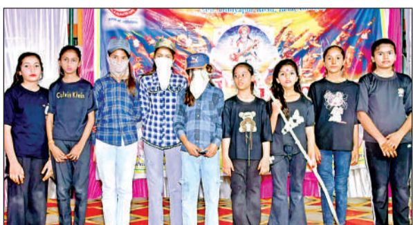
वार्षिकोत्सव में कार्यक्रम के दौरान मौजूद बच्चे।

अमृत विचार। कस्बा स्थित वीणा वादिनी शिशु मंदिर विद्यालय में धूमधाम से द्वितीय वार्षिकोत्सव मनाया गया।