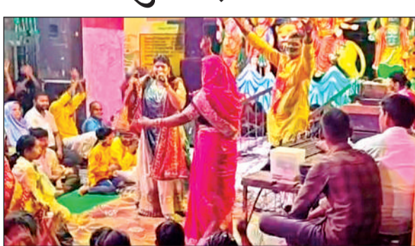
अपनी प्रस्तुति देते कलाकार।