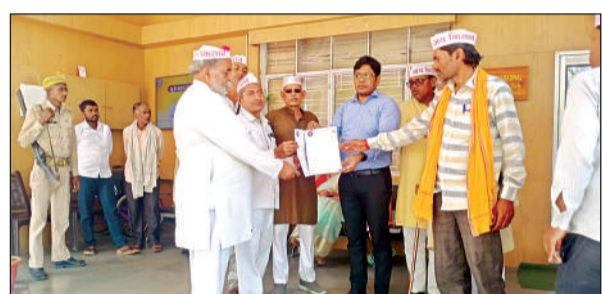
एसडीएम को ज्ञापन सौंपते किसान नेता।