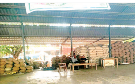
गेहूं खरीद केंद्र में पसरा सन्नाट।