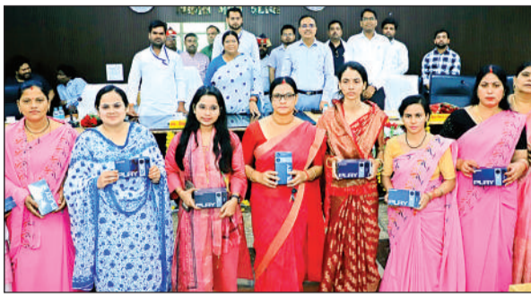
स्मार्ट फोन के साथ कार्यकत्रियों साथ में सदर विधायक व डीएम