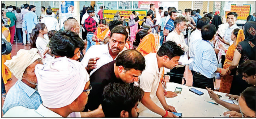
जिला अस्पताल में मरीजों की लगी भीड़।