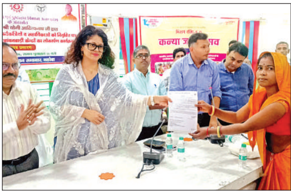
आंगनबाड़ी कार्यकर्ता को नियुक्ति पत्र देती डीएम।

विकास भवन में आयोजित कार्यक्रम में नवनियुक्ति पांच आंगनबाड़ी कार्यकर्ताओं व विकासखंड चरखारी की 43 सहायिकाओं को नियुक्ति पत्र वितरित