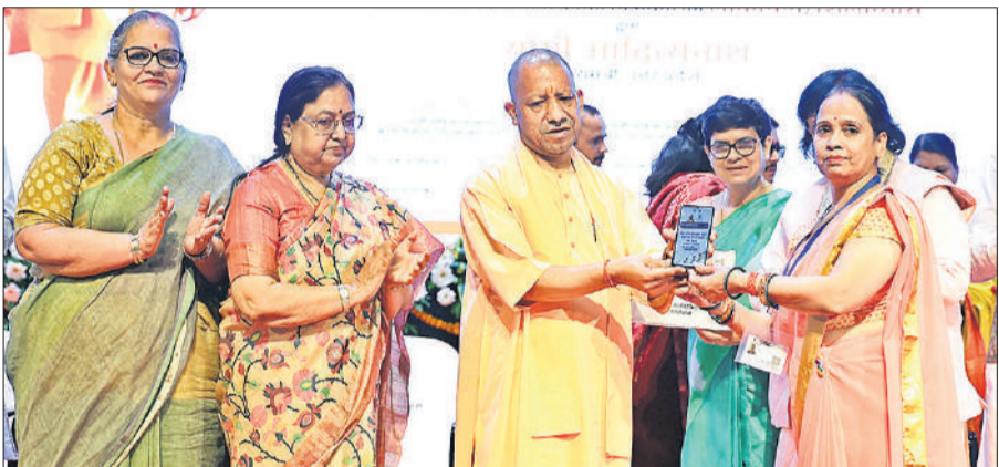
लखनऊ : लोक भवन सभागार में आंगनबाड़ी कार्यकर्त्री को नियुक्ति पत्र प्रदान करते मुख्यमंत्री योगी।

अमृत विचार : मुख्यमंत्री योगी आदित्यनाथ ने सोमवार को आंगनबाड़ी व्यवस्था में बड़े बदलाव करते हुए पांच हजार कार्यकर्त्रियों और 60 हजार सहायिकाओं की भर्ती समेत मानदेय में बढ़ोतरी का एलान किया। उन्होंने 'स्मार्ट सैलरी' व्यवस्था लागू करने की बात कहते हुए विभाग को जल्द प्रस्ताव तैयार करने के निर्देश दिए। मुख्यमंत्री ने कहा कि भर्ती प्रक्रिया पूरी तरह पारदर्शी होगी और 'न पर्वी-न खर्ची' के आधार पर चयन किया जाएगा।