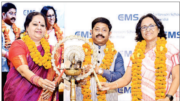
दीप प्रज्वलन कर कार्यक्रम का उद्घाटन करते कैबिनेट मंत्री नंद गोपाल गुप्ता नदी।

पिक एण्ड ड्रॉप स्टैण्ड होगा, जहाँ निजी वाहन, ऑटो रिक्शा सवारी उतार सकेंगे, बैठा सकेंगे। कोई भी व्यक्ति बिना ड्यूटी कार्ड या टिकट के स्टेडियम के अन्दर प्रवेश नहीं करेगा, पकड़े जाने पर सख्त कार्यवाही की जायेगी एवं अनाधिकृत प्रवेश दण्डनीय अपराह होगा। सिक्का, ईयरफोन, ज्वलनशील पदार्थ आदि आईसीसी/वीसीसीआई के निर्देशानुसार प्रति: प्रतिबंधित है। स्टेडियम के आस पास रहने वाले लोगों से अपील है कि मैच देखने के लिये स्टेडियम की तरफ जायें अन्यथा अन्य वैकल्पिक मार्गों का प्रयोग करें। दर्शकों से अपील है कि 19:30 बजे से प्रारम्भ हो रहे मैच के लिये 18:00 बजे से 20:00 बजे तक का पीक आवर से बचते हुये उसके पूर्व अथवा बाद में आने का प्रयास करें।