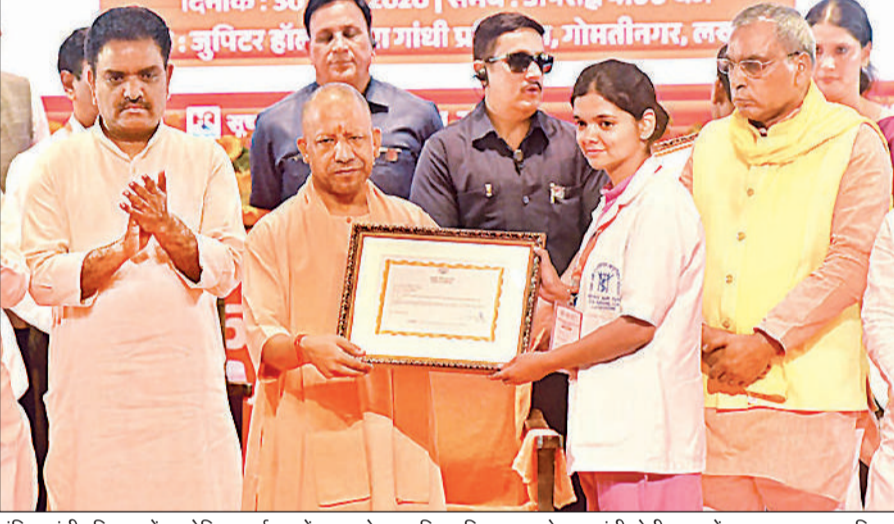
इंदिरा गांधी प्रतिष्ठान में आयोजित कार्यक्रम में छात्रा को छात्रवृत्ति का वितरण करते मुख्यमंत्री योगी, साथ में अन्य।

मुख्यमंत्री सोमवार को इंदिरा गांधी प्रतिष्ठान में कक्षा 9-10 और दशमोत्तर के 27,99,982 विद्यार्थियों के खातों में 3350 करोड़ रुपये की छात्रवृत्ति व शुल्क प्रतिपूर्ति का अंतरण किया। उन्होंने गरीब परिवारों के मुख्य अर्जक की मृत्यु होने पर राष्ट्रीय पारिवारिक लाभ योजना के अंतर्गत 33,334 आश्रित परिवारों को भी 100 करोड़ रुपये की सहायता राशि भी सीधे खातों में भेजी। कार्यक्रम को संबोधित करते हुए मुख्यमंत्री योगी ने समाजवादी पार्टी के नेताओं