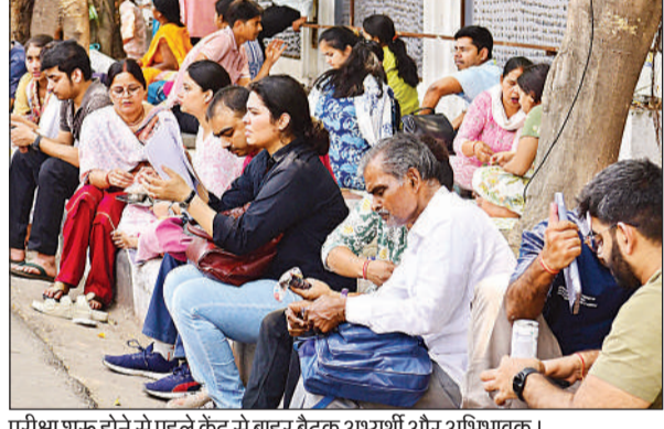
परीक्षा शुरू होने से पहले केंद्र से बाहर बैठक अभ्यर्थी और अभिभावक।

अर्थव्यथियों का कहना था कि प्रश्नपत्र अनुमान से अधिक कठिन था, लेकिन गत वर्ष मुख्य परीक्षा दे चुके छात्रों के लिए यह अपेक्षाकृत आसान रहा। दूसरे प्रश्नपत्र में भारत