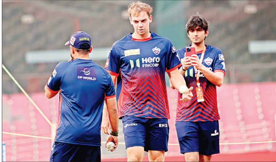
अभ्यास करते हुए दिल्ली के खिलाड़ी।

पिछले सीजन में 329 रन बनाकर खुद को एक भरोसेमंद फिनिशर के रूप में स्थापित किया था। एलएसजी की बल्लेबाजी लाइवअप अनुभव और आक्रामकता का मजबूत मिश्रण है। यदि ये सभी खिलाड़ी फॉर्म में रहे, तो टीम किसी भी गेंदबाजी आक्रमण को ध्वस्त करने का दम रखती है। अब देखा होगा कि यह दमदार बल्लेबाजी इकाई मैदान पर किस हद तक अपना जलवा बिखेर पाती है।