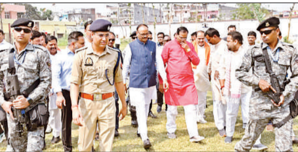
सीएचसी निरीक्षण करते उपमुख्यमंत्री ब्रजेश पाठक।

अमृत विचार: उप मुख्यमंत्री ब्रजेश पाठक ने सोमवार को जनपद भ्रमण के दौरान द लर्निंग वर्ल्ड स्कूल के उद्घाटन कार्यक्रम से पूर्व सामुदायिक स्वास्थ्य केंद्र (सीएचसी) फाजिलनगर का निरीक्षण किया। इस दौरान उन्होंने अस्पताल में उपलब्ध स्वास्थ्य सेवाओं, साफ-सफाई व्यवस्था तथा मरीजों को प्रदान की जा रही सुविधाओं का स्थलीय निरीक्षण कर आवश्यक दिशा-निर्देश दिए। उप मुख्यमंत्री ने सर्वप्रथम ओपीडी, इमरजेंसी वार्ड, दवा वितरण केंद्र,