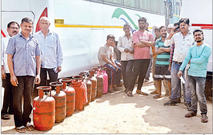
स्टेशन रोड स्थित एपीसेन रोड पर भारतीय ज्योति गैस सर्विस पर गैस सिलेंडर लेने को लगी लम्बी लाइन।