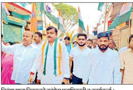
तिरंगा यात्रा निकालते कांग्रेस पदाधिकारी व कार्यकर्ता।