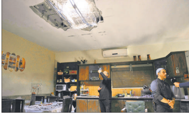
इजराइल के शेफाराम शहर में ईरान के मिसाइल हमले के बाद क्षतिग्रस्त एक घर।

ईरान सामरिक रूप से महत्वपूर्ण होर्मुज जलडमरूमध्य पर कड़ा नियंत्रण करने की तैयारी में है। ईरानी सांसद एक ऐसा विधेयक लाने की कोशिश कर रहे हैं जो पारगमन शुल्क (ट्रांजिट टोल) और गुजरने वाले जहाजों के लिए अनिवार्य मंजूरी सहित एक नई नियामक प्रणाली पेश करेगा। वरिष्ठ ईरानी सांसद अलाउद्दीन बोरुजेर्दी ने कहा कि इस कानून को ईरानी संसद (मजलिस) की ओर से जल्द मंजूरी मिलने की उम्मीद है और यह कानून लागू होने के बाद ईरान की अनुमति के बिना किसी भी जहाज को इस जलमार्ग से गुजरने नहीं दिया जाएगा। प्रस्तावित कानून के तहत, जलडमरूमध्य से गुजरने वाले जहाजों को सुरक्षा और संबंधित सेवाओं के बदले शुल्क देना होगा। एएसएन टीवी चैनल ने बोरुजेर्दी के हवाले से कहा, होर्मुज जलडमरूमध्य पर हमारा पूर्ण नियंत्रण है। मजलिस द्वारा विधेयक अपनाए जाने के बाद जल्द एक नई प्रणाली इस जलमार्ग को नियंत्रित करेगी। यह कदम ईरानी संसद की नागरिक मामलों की समिति के अध्यक्ष मोहम्मद रजा रजाई कूची की पिछली टिप्पणियों के बाद आया