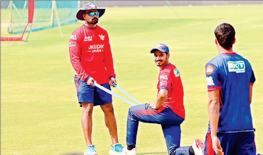
अभ्यास करते हुए एलएसजी के खिलाड़ी।