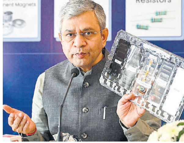
नई दिल्ली में 'इलेक्ट्रॉनिक्स कंपोनेंट मैन्युफैक्चरिंग स्कीम' पर आयोजित एक कार्यक्रम में संबोधित करते हुए केंद्रीय मंत्री अश्विनी वैष्णव।

मंत्री ने उद्योग को 15 दिन की समय सीमा दी है, जिसके भीतर कंपनियों को यह बताना होगा कि उन्होंने उत्पाद डिजाइन, 'सिक्स सिग्मा' मानक, प्रतिभा विकास और