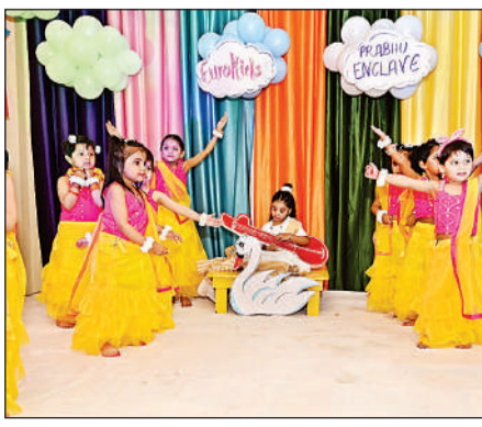
वार्षिकोत्सव में सांस्कृतिक कार्यक्रम प्रस्तुत करते बच्चे।