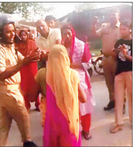
कल्याणपुर गांव में पुलिस कर्मियों से उलझती महिलाएं और विवाद के बाद थाने से पहुंची अतिरिक्त फोर्स।