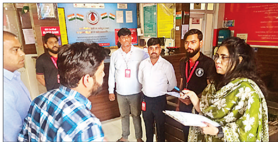
ब्लड बैंक में जांच के दौरान पूछताछ करती एफएसडीए टीम की सदस्य।

सबसे गंभीर बात यह रही कि कई स्थानों पर कोई डॉक्टर मौजूद नहीं था। इसके अलावा, खून के संग्रहण और वितरण से जुड़ा कोई ठोस रिकॉर्ड भी नहीं मिला। यह भी स्पष्ट नहीं था कि खून किसने दिया