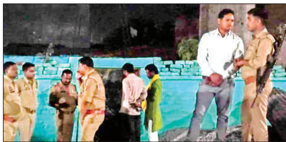
मौके पर जांच करती पुलिस