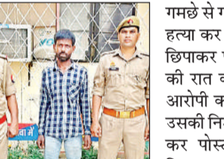
आरोपी को जेल भेजती पुलिस।