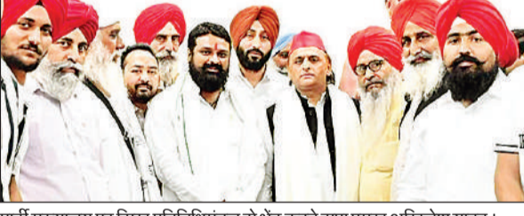
पार्टी मुख्यालय पर सिख प्रतिनिधिमंडल से भेंट करते सपा प्रमुख अखिलेश यादव।

सोमवार को पार्टी मुख्यालय में जिलों से आए कार्यकर्ताओं को सपा प्रमुख सम्बोधित कर रहे थे, उन्होंने कहा कि सपा कार्यकर्ताओं की जिम्मेदारी है, विधानसभा चुनाव को 2024 के लोकसभा चुनाव से भी