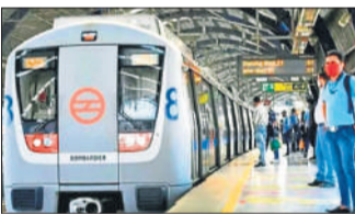
● मेट्रो के इंतजार में प्लेटफॉर्मों पर इकट्ठी हुई यात्रियों की भारी भीड़

नई दिल्ली। दिल्ली मेट्रो की येलो लाइन के विश्वविद्यालय मेट्रो स्टेशन पर एक यात्री के पटरी पर गिर जाने के कारण मेट्रो सेवाएं करीब डेढ़ घंटे तक बाधित रहीं। इस बीच मेट्रो का इंतजार कर रहे यात्रियों की प्लेटफॉर्मों पर थपी भीड़ इकट्ठी हो गई गई। दिल्ली मेट्रो रेल कॉर्पोरेशन (डीएमआरसी) ने एक्स पर एक पोस्ट में कहा, विश्वविद्यालय मेट्रो स्टेशन पर एक यात्री के पटरी पर होने के कारण येलो लाइन पर ट्रेन सेवाओं के संचालन में देरी हुई। डीएमआरसी ने कहा कि घटना के बाद सुरक्षा कारणों से येलो लाइन पर ट्रेन सेवाओं को नियंत्रित किया गया, जिससे सुबह के