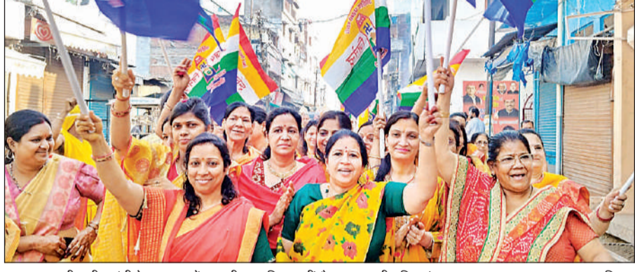
भगवान महावीर की जयंती के उपलक्ष्य में पालकी यात्रा निकालती जैन समाज की महिलाएं।