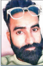
आरके आंद राश कारोबारी

पुरुष के भीतर एक ऐसी जगह होती है, जहां वह खुद भी आसानी से नहीं पहुंच पाता। बाहर की दुनिया में वह चलता-फिरता, बोला-बताया, फैसले लेता हुआ दिखाई देता है, लेकिन भीतर कहीं एक शांत, गोल-सी जगह होती है, जहां उसके अपने नियम चलते हैं। उस जगह में प्रवेश करना ऐसा होता है, जैसे किसी बंद कमरे में