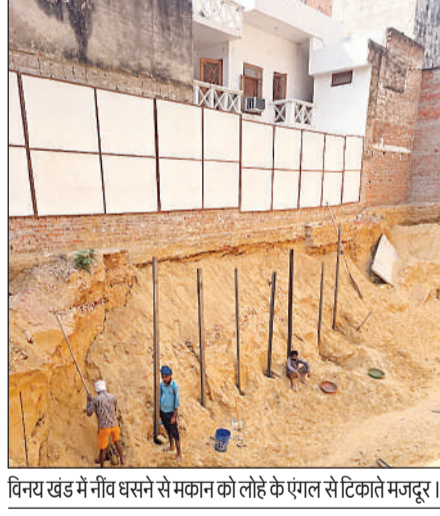
विनय खंड में नींव धसने से मकान को लोहे के ंगल से टिकाते मजदूर।