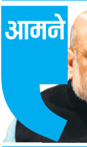
अमित शाह केंद्रीय गृहमंत्री

ट्रंप के कार्यकाल के दौरान अपनाई गई नीतियों, जैसे- सख्त आवाज नीति, नस्लीय मुद्दों पर विवादाित टिप्पणियां और मीडिया व न्यायपालिका के साथ टकराव ने अमेरिकी समाज को गहरे स्तर पर विभाजित किया। उनके समर्थक, जहां उन्हें एक मजबूत राष्ट्रवादी नेता के रूप में देखते हैं, वहीं आलोचक उन्हें लोकतांत्रिक संस्थाओं के लिए खतरा मानते हैं। यही विभाजन आज सड़कों पर दिखाई दे रहा है। नॉट माई प्रेसिडेंट और नो किंग्स जैसे नारों का उभार यह दर्शाता है कि एक बड़ा वर्ग सत्ता के प्रति असहमत को खुलकर व्यक्त कर रहा है। यह स्थिति लोकतंत्र के लिए एक दोधारी तलवार की तरह है। एक ओर यह असहमति की स्वतंत्रता को दर्शाती है, वहीं दूसरी ओर यह प्रतिनिधित्व के