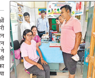
सीएचसी खलीलाबाद में किशोरियों को एचपीवी टीका लगाकर शुभारंभ करते स्वास्थ्य कर्मचारियों।