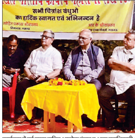
कार्यक्रम में पूर्व मुख्य सचिव आलोक रंजन व अन्य पदाधिकारी।