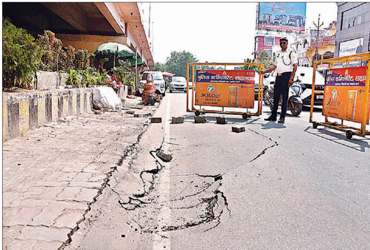
गोमती नगर स्थित हुआइया चौराहे के पास सोमवार को मुख्य सड़क बंद हुई। इससे एक पट्टी में आवागमन बाधित हो गया। हादसे की आशंका के चलते ट्रैफिक पुलिस कर्मियों ने घंसे हिस्से में बैरिकेडिंग लगा दी। देर शाम तक सड़क की मरम्मत करने जिम्मेदार विभाग के कर्मचारी नहीं पहुंचे थे।