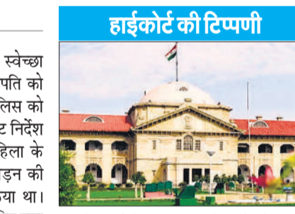
हाईकोर्ट की टिप्पणी