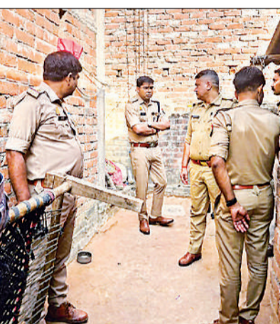
हत्या के बाद घर में साक्ष्यों की तलाश करती पुलिस टीम और गमजदा बेटे मृतक के परिजन व रिश्तेदार।

अमृत विचार: बंथरा के खांडेदेव गांव में रविवार रात नशे में धुत दो भाई ने सोते समय राड से हमला कर छोटे भाई की हत्या कर दी। ग्रामीणों की सूचना पर पहुंची पुलिस ने जांच पड़ताल कर साक्ष्य जुटाए और आरोपी को घर से ही दबोच लिया। पुलिस ने मां की तहरीर पर रिपोर्ट दर्ज कर ली है।