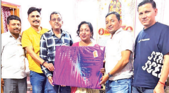
सेवानिवृत्ति पर काठगोदाम डिपो की कर्मचारी के सम्मानित करते रोडवेज कर्मचारी।