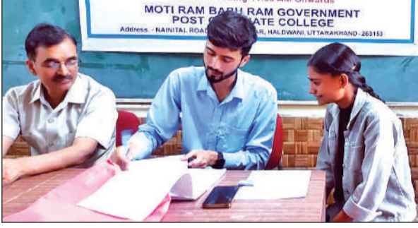
एमबीबीजी कॉलेज में प्लेसमेंट ड्राइव के दौरान इंटरव्यू देती अभ्यर्थी।