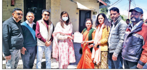
रानीखेत में संयुक्त मजिस्ट्रेट को ज्ञापन सौंपते कांग्रेसी।

अमृत विचार: कांग्रेसजनों ने संयुक्त मजिस्ट्रेट के माध्यम से मुख्यमंत्री को ज्ञापन सौंपकर मुख्यमंत्री राहत कोष की धनराशि प्रशासन की निगरानी में वितरित किए जाने की मांग उठाई है। ज्ञापन में कहा गया कि संज्ञान में आया है कि मुख्यमंत्री राहत कोष एवं अन्य राहत कोषों से वास्तविक पात्र व्यक्तियों को मिलने वाली सहायता राशि राजनीतिक दबाव के कारण प्रभावित हो रही है और जरूरतमंदों तक समय पर नहीं पहुंच पा रही है। कांग्रेसजनों ने कहा कि मुख्यमंत्री राहत कोष का उद्देश्य आपदा, बीमारी एवं अन्य विषम