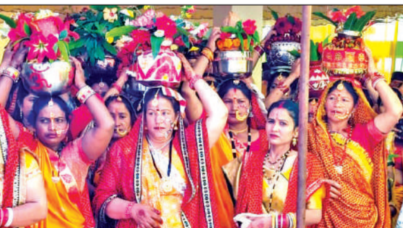
दिनेशपुर में भव्य कलश यात्रा निकालती महिलाएं।