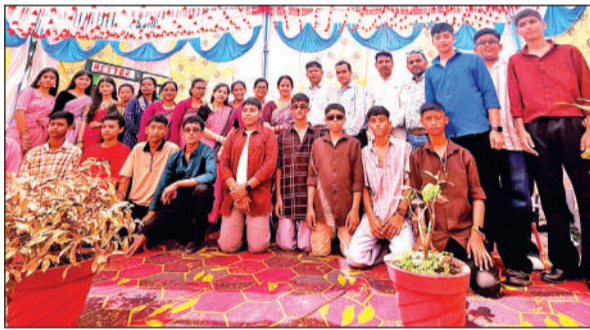
नव चेतना स्कूल में आयोजित विदाई समारोह में उपस्थित बच्चे और प्रबंधक।