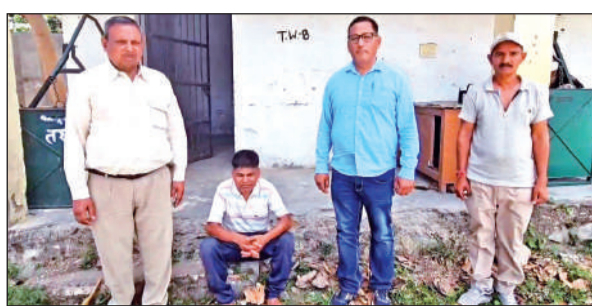
दो कर्मियों द्वारा पकड़ा गया आरोपी।