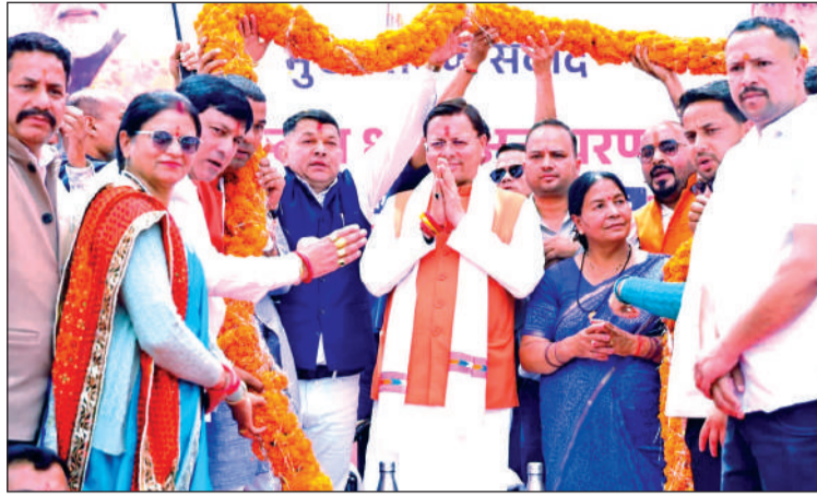
चम्पावत में मुख्य सेवक संवाद के दौरान मुख्यमंत्री पुष्कर सिंह धामी का अभिनंदन करते स्थानीय जनप्रतिनिधि।

मुख्यमंत्री ने कहा कि वर्तमान समय विज्ञान और नवाचार का युग है और सरकार का उद्देश्य है कि प्रदेश की प्रत्येक बेटी विज्ञान एवं तकनीक के क्षेत्र में आगे बढ़े। विज्ञान केवल एक विषय नहीं, बल्कि समस्याओं के समाधान और प्रगति का सबसे सशक्त माध्यम है। जब बेटियां विज्ञान के क्षेत्र में नेतृत्व करेंगी, तभी एक सशक्त और समृद्ध उत्तराखंड का निर्माण