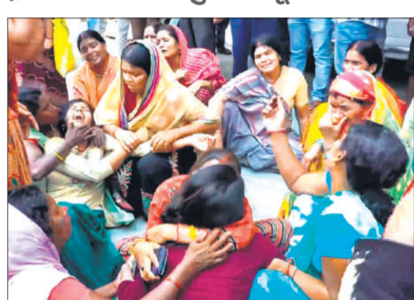
नालंदा : शीतला माता मंदिर परिसर में भगदड़ मचने के बाद मची चीत्कार।

बिहार के नालंदा जिले में दीपनगर थानाक्षेत्र के मधुड़ा गांव में प्राचीन शीतला माता मंदिर में मंगलवार सुबह भगदड़ मचने से आठ श्रद्धालुओं की मौत हो गई। घायलों को नजदीकी अस्पतालों में भर्ती कराया गया है, जहां कुछ की हालत गंभीर बताई जा रही है। इस घटना के बाद मंदिर परिसर और अस्पताल में अफरा-तफरी का माहौल नजर आया। बता दें कि नालंदा में ही राष्ट्रपति का वीआईपी मूवमेंट भी था, इसलिए सुरक्षा व्यवस्था में हजारों कर्मियों तैनात थे।