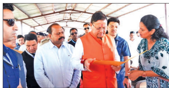
खटीमा में आमजन की समस्याएं सुनते मुख्यमंत्री पुष्कर सिंह धामी।

देहरादून: मुख्यमंत्री पुष्कर सिंह धामी को केनरा बैंक के जनप्रतिनिधियों और आम लोगों से मुलाकात कर उनकी समस्याएं सुनीं और अधिकारियों को त्वरित समाधान के निर्देश दिए। उन्होंने कहा कि सरकार की प्राथमिकता जनसमस्याओं का शीघ्र निस्तारण है इसलिए अधिकारी हर शिकायत को गंभीरता से लें। खास तौर पर गैस की उपलब्धता को लेकर उन्होंने भरोसा दिलाया कि स्थिति नियंत्रण में है और किसी भी तरह