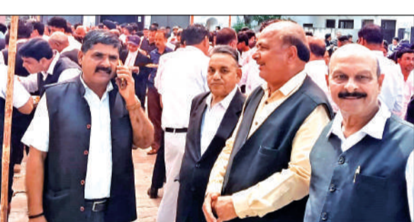
काशीपुर में ईद मिलान समारोह में मौजूद अधिवक्ता। ● अमृत विचार

काशीपुर: नई बसें नहीं मिलने से रोडवेज डिपो मियाद पूरी कर चुकी बसों से यात्रियों को यात्रा करा रहा है। जिससे दुर्घटनाओं की संभावनाएं बढ़ रही हैं। वर्तमान समय में डिपो की सात साल पुरानी हो चुकी बसें सड़कों पर दौड़ रही हैं। डिपो की ओर से नई बसों की मांग की गई है, लेकिन डिपो को बसें नहीं मिल पाई हैं। रोजाना चार हजार से अधिक यात्री इन पुरानी बसों में सफर करने के लिए मजबूर हैं। काशीपुर डिपो के बेड़े में 49 बसें शामिल हैं। इनमें से 18 बसें दिल्ली रूट पर चलती हैं। यह बसें सात लाख किलोमीटर या फिर सात साल पुरानी हो चुकी हैं। डिपो की ओर से नई बसों की मांग की गई है, लेकिन अभी तक उन्हें बसें नहीं मिली हैं। ऐसे में यात्रियों को पुरानी बसों में ही सफर करना पड़ रहा है।