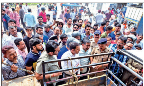
इंडेन गैस एजेंसी में लोगों को समझाते पुलिस कर्मी। ● अमृत विचार

मंगलवार को काशीपुर बाईपास रोड स्थित इंडेन गैस एजेंसी में कई लोग सिलेंडर लेकर पहुंचे। गैस सिलेंडर नहीं मिलने पर लोगों ने आक्रोश जताया। इस बीच