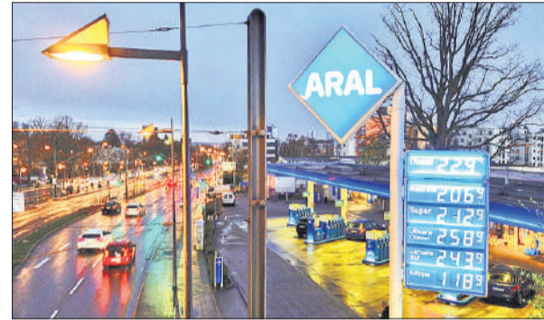
जर्मनी के फ्रैंकफर्ट शहर में सोमवार को एक पेट्रोल पंप पर प्रदर्शित ईंधन की कीमतें।

हूती ने कहा- बाब अल-मंडेब बंद होने के बाद 200 डॉलर हो जाएगी तेल की कीमत