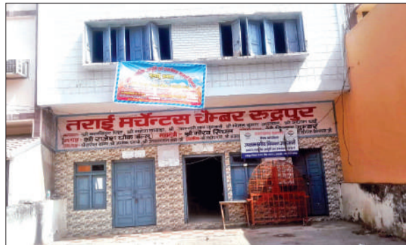
गल्ला मंडी में खुला खाद्य विभाग का क्रय केंद्र। ● अमृत विचार

अमृत विचार: कुमाऊं में आधी-अधूरी तैयारियों के बीच आज से गेहूं की खरीद शुरू हो जाएगी। इसके लिए कुमाऊं में 123 क्रय केंद्र खोले जाने हैं। हालांकि अभी क्रय केंद्रों पर पूरी तरीके से व्यवस्था नहीं की गयी है। यहां तक की एजेंसियों के गेहूं खरीद के लक्ष्य तक निर्धारित नहीं किए गये हैं। ऐसे में पहले दिन किसी भी क्रय केंद्र में गेहूं की खरीद होना संभव नजर नहीं आ रहा है। यहां बता दें कि गेहूं खरीद के लिए कुमाऊं में 123 क्रय केंद्र खोले गये हैं। इसमें जनपद ऊधमसिंह नगर में 108 क्रय केंद्र स्थापित किए गये हैं। इसमें खाद्य