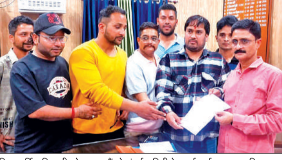
जिला पूर्ति अधिकारी को ज्ञापन सौंपते संघर्ष वाहिनी के कार्यकर्ता।

इधर बागेश्वर जन संघर्ष वाहिनी ने जिला पूर्ति अधिकारी को ज्ञापन सौंपकर रोस्टर के अनुसार गैस वितरण की मांग की है। संगठन ने चेतावनी दी कि तीन दिन के भीतर व्यवसायिक कोटा उपलब्ध नहीं कराया गया तो कार्यालय में तालाबंदी की जाएगी। संघर्ष वाहिनी के पदाधिकारियों ने बताया कि कई स्थानों पर गैस वाहन पहुंचने से