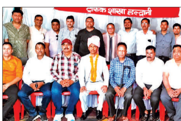
हल्द्वानी रोडवेज स्टेशन में आयोजित विदाई कार्यक्रम के दौरान मौजूद कर्मचारी।