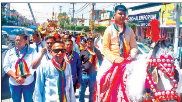
बाजपुर में निकली शोभायात्रा में शामिल अश्वरोहण की मनोरम झांकी।