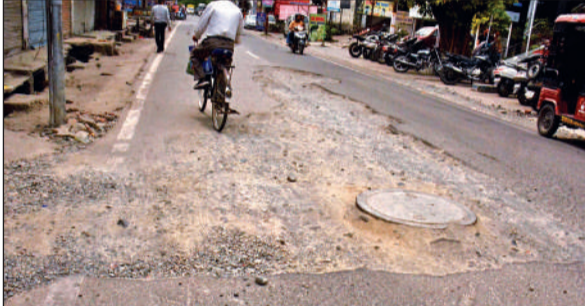
रामपुर रोड स्थित सरगम सिनेमा के पास कार शो रूम के सामने टूटी पड़ी सड़क।

जानकारी के अनुसार, सीवर निर्माण कार्य के दौरान सड़क को खोदकर यहां चैंबर भी बनाया गया है। लेकिन चैंबर सड़क की सतह से ऊपर उठा हुआ है, जिससे गुजरने वाले वाहनों को भारी दिक्कतों का सामना करना पड़ रहा है। खासकर रात के समय यह स्थिति और भी खतरनाक हो जाती है, जब कम रोशनी में वाहन चालकों को चैंबर