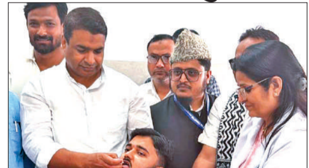
मेडिकल कॉलेज में हज यात्रियों का टीकाकरण करते स्वास्थ्य कर्मी। ● अमृत विचार

मंगलवार को शिविर में उत्तराखंड राज्य हज समिति के अध्यक्ष ने कहा कि उत्तराखंड राज्य समिति लगातार हज यात्रियों की सुविधा और व्यवस्थाओं को बेहतर बनाने के प्रयास में अग्रसर है। जिसके लिए मुख्यमंत्री पुष्कर सिंह धामी का मार्गदर्शन और सहयोग मिल रहा है। उत्तराखंड