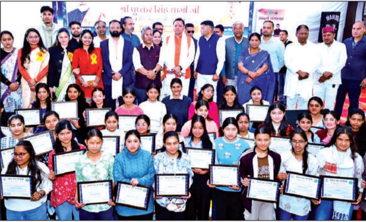
चम्पावत में शी फॉर स्टेम कार्यक्रम में सम्मानित किए गए विद्यार्थी।

माध्यम से बालिकाओं में वैज्ञानिक सोच का विकास हो रहा है तथा प्रदेश में विकसित हो रहे साइंस एवं इनोवेशन केंद्र भविष्य में विद्यार्थियों के लिए महत्वपूर्ण सिद्ध होंगे। सीएम ने कहा कि प्रधानमंत्री नरेंद्र मोदी के मार्गदर्शन में भारत विज्ञान और तकनीक के क्षेत्र में निरंतर प्रगति कर रहा है और कोरोना वैक्सीन, चंद्रयान-3 तथा आदित्य एल1 जैसी उपलब्धियां इसका प्रमाण हैं। किसी भी राष्ट्र की प्रगति उसके विज्ञान एवं प्रौद्योगिकी के विकास पर निर्भर करती है।