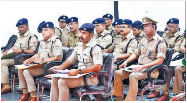
एडीजी की समीक्षा बैठक में उपस्थित पुलिस अधिकारी। ● अमृत विचार

के कामकाज की सख्त समीक्षा करते हुए स्पष्ट संदेश दिया कि कानून व्यवस्था में किसी भी तरह की लापरवाही अब बर्दाशत नहीं की जाएगी। बैठक में दोनों जिलों के रावापत्रित अधिकारियों के कार्यों का बारीकी से विश्लेषण किया गया। एडीजी ने लंबित विवेचनाओं,