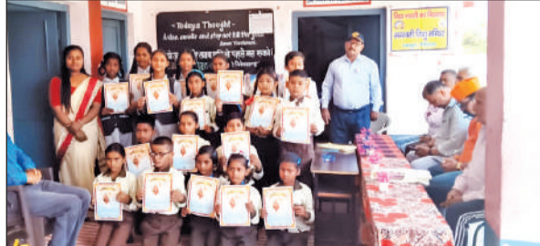
कालाहूरी में सम्मानित किए गए मेधावी विद्यार्थी।