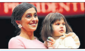
● अमेरिका की द्वितीय महिला ने कहा परेशान होते हैं तो सलाह लेते हैं जेडी

वाशिंगटन। अमेरिका की द्वितीय महिला उषा वेंस ने कहा है कि वह हर मुद्दे पर अपने पति से सहमत नहीं होतीं। उषा ने कहा कि ऐसा संभव नहीं है कि दोनों हर मुद्दे पर एक राय रखें। उषा ने कहा कि वह खुद को अपने पति और अमेरिकी उपराष्ट्रपति जेडी वेंस की भरोसेमंद सलाहकार मानती हैं, खासकर तब जब वे किसी ऐसे मुद्दे पर निर्णय ले रहे हों जो व्यक्तिगत रूप से महत्वपूर्ण हो। पहली भारतीय-अमेरिकी द्वितीय महिला उषा ने एक साक्षात्कार में कहा कि वह और उनके पति हर मुद्दे पर एक जैसी राय नहीं रखते हैं, लेकिन असहमति बातचीत के लिए खुला अवसर देती है। उषा वेंस ने कहा, हमारे बीच हर समय बातचीत होती रहती है। उन्होंने कहा,