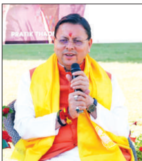
देहरादून में शासकीय आवास पर नॉर्थ ईस्ट के छात्रों के साथ संवाद करते मुख्यमंत्री पुष्कर सिंह धामी।

वहीं, अरुणाचल प्रदेश के एक छात्र द्वारा उत्तराखंड और उत्तर-पूर्वी राज्यों के बीच सांस्कृतिक आदान-प्रदान पर पूछे गए प्रश्न के उत्तर में मुख्यमंत्री ने कहा कि दोनों क्षेत्रों की भौगोलिक एवं सांस्कृतिक परिस्थितियाँ काफी हद तक समान