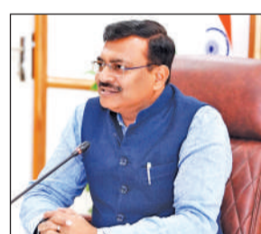
मुख्य सचिव आनंद बर्द्धन।

मंगलवार को सचिवालय में राजधानी में कानून व्यवस्था को लेकर गृह और पुलिस विभाग के वरिष्ठ अधिकारियों के साथ बैठक में मुख्य सचिव ने निर्देश दिए कि देहरादून शहर और उसके आसपास