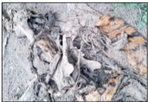
बाघिन का क्षत-विक्षत कंकाल।