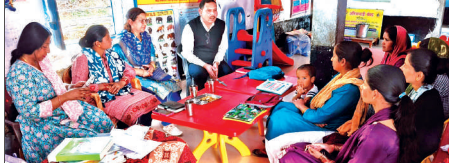
आंगनबाड़ी केंद्र मटेला का निरीक्षण करते डीपीओ।