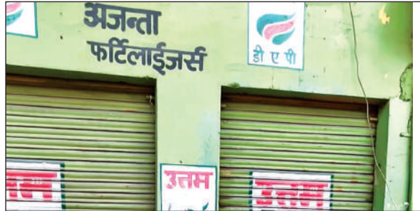
अजंता फर्टिलाइजर्स की दुकान।