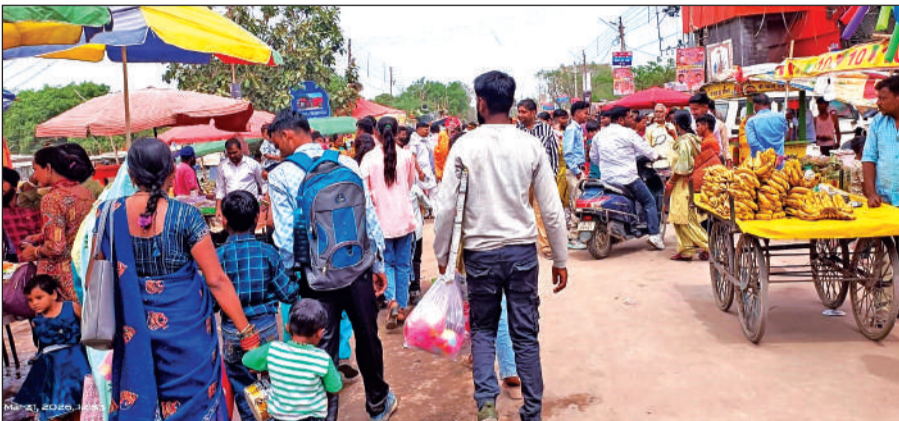
काशीपुर में चैती मेले में पॉलीथिन में सामान ले जाता एक युवक।

दरअसल बीते चार-पांच सालों से प्रशासन चैती मेले का आयोजन करता आ रहा है। हर साल मेले को स्वच्छ रखने के लिये मेला प्रशासन कई प्रकार के प्रतिबंध लगाता है। इसमें सबसे प्रमुख पर्यावरण को नुकसान पहुंचाने वाली पॉलीथिन भी शामिल है। लेकिन इक्का-दुक्का चालान करने के बाद प्रशासन ही इस ओर ध्यान नहीं देता। नतीजतन हर साल मेला समाप्त होने के बाद मेले परिसर में जहां-तहां हजारों की मात्रा में पॉलीथिन बिखरी नजर आती है। इस बार भी प्रशासन ने मेले में पॉलीथिन