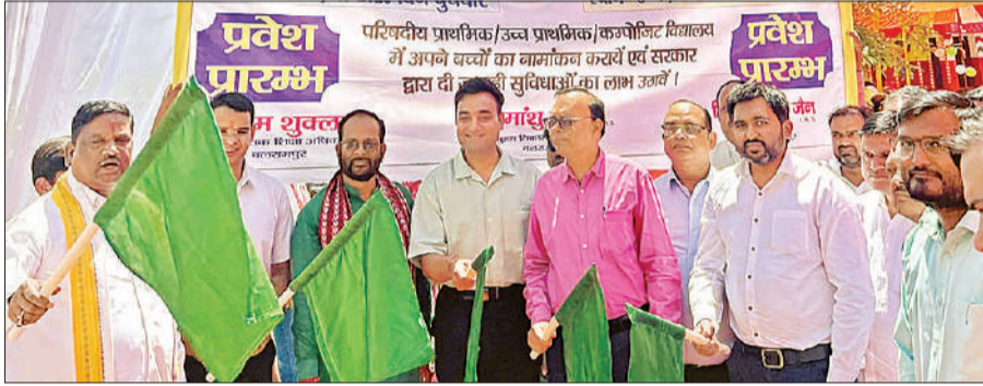
स्कूल चलो रैली को झंडी दिखाकर रवाना करते विधायक, डीएम व अन्य लोग।