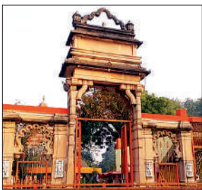
जयप्रभा ग्राम का मुख्य द्वार।

अमृत विचार : जिले में ग्रामीण विकास को नई दिशा देने के उद्देश्य से शासन ने ऐतिहासिक ‘जयप्रभा ग्राम’ को 17वें विकास खंड के रूप में विकसित करने की पहल की है। इस संबंध में ग्राम्य विकास आयुक्त ने डीएम से प्रस्ताव मांगा है। डीएम ने जिला विकास अधिकारी को प्रक्रिया पूरी कर शीघ्र प्रस्ताव शासन को भेजने के निर्देश दिए हैं।