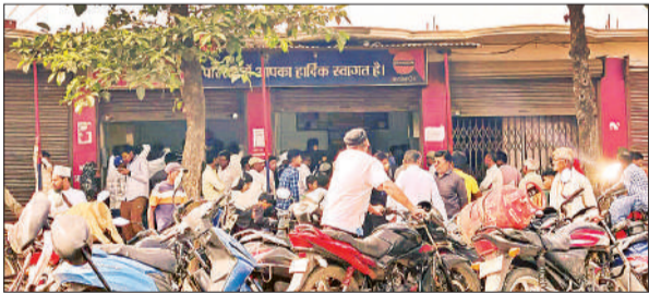
गैस एजेंसी के बाहर लगी उपभोक्ताओं की भीड़।

करनैलगंज, अमृत विचार : नगर की मनोकामना इंडेन गैस एजेंसी पर अनियमितता व लोड न मिलने से रसोई गैस की आपूर्ति बाधित हो गई है। करीब तीन हजार उपभोक्ताओं की बुकिंग अन्य गैस वितरकों के यहां स्थानांतरित किए जाने के बावजूद समस्या का समाधान नहीं हो सका है। मंगलवार को उपभोक्ता दिनभर गैस एजेंसियों का चक्कर काटते रहे। हालांकि सकरौरा इंडेन एजेंसी पर जिन उपभोक्ताओं की बुकिंग थी, उन्हें सिलेंडर उपलब्ध कराया गया। यहां