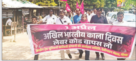
प्रदर्शन करते ट्रेड यूनियन के कार्यकर्ता।