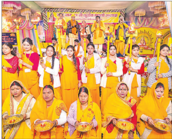
सरस्वती शिशु मंदिर में संस्कार महायज्ञ करते गायत्री परिवार के लोग।