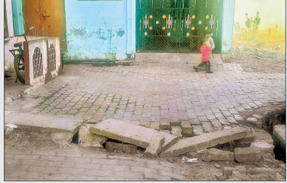
नगर पालिका की नालियों के टूटे ढक्कन।

पटेल नगर में टूटी नालियों के ढक्कन बने हादसे का सबब