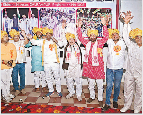
विद्यालय के वार्षिकोत्सव में मौजूद अतिथि।

सांस्कृतिक कार्यक्रम में बच्चों ने दिखायी प्रतिभा