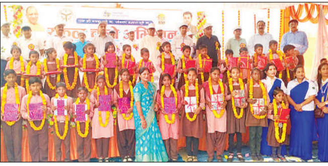
स्कूल चलो अभियान का किया गया शुभारंभ।