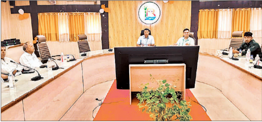
बलरामपुर महोत्सव के कार्यक्रमों के बारे में जानकारी देते डीएम और अन्य।