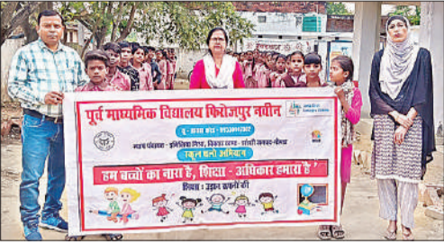
पूर्व माध्यमिक विद्यालय फिरोजपुर नवीन में रैली निकालते बच्चे।