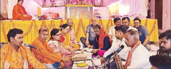
हनुमान जन्मोत्सव पर पाठ करते श्रद्धालु।