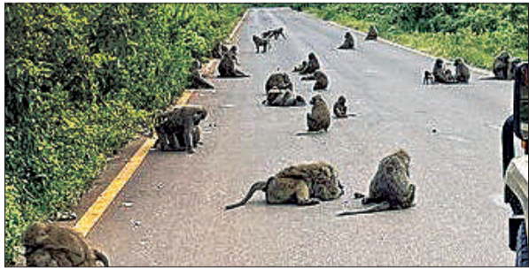
मनकापुर - नवाबगंज मार्ग पर टिकरी जंगल के बीच सड़क पर बैठे बंदर।

है। यह वाक्या एक दिन का नहीं बल्कि आए दिन देखने व सुनने को मिलती है। यह बेजुबानों की मदद नहीं उन्हें मौत के मुँह में डकेलना है। वन्यजीव संरक्षण अधिनियम, 1972 की धारा 11 में वन्यजीवों को कुछ भी खिलाना अपराध बताया गया है क्योंकि एक तो वन्यजीवों को उनके बेहतर स्वास्थ्य के लिए उनके प्राकृतिक भोजन को ही खाना चाहिए और दूसरा ये कि उन्हें नियमित भोजन देने से वे भोजन ढूंढने की क्षमता खो देते हैं। प्रकृति में अपना कार्य नहीं कर पाते और आसानी से भोजन मिलने से उनका शारीरिक श्रम कम होता है जो बीमारियों को भी न्यौता देता है। नेचर क्लब के एक दल