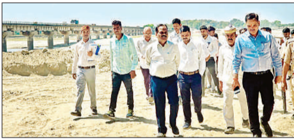
भूमि का स्थलीय निरीक्षण करते अधिकारी। अमृत विचार

तहसीलदार पयागपुर का कहना है कि सभी संबंधित विभाग के अधिकारियों से बात हुई है। जल्द से जल्द किसानों की सभी समस्याओं का समाधान करा दिया जाएगा।