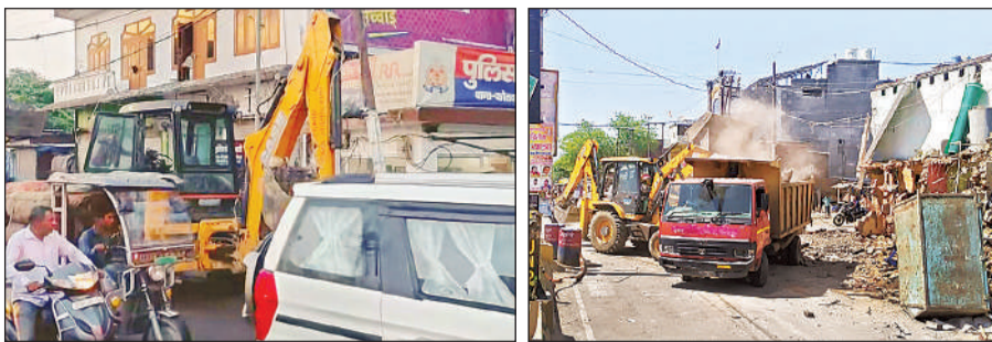
मण्डी चौकी तोड़ती जेसीबी एवं ध्वस्तिकरण के बाद मलबा भरती जेसीबी।

अमृत विचार: डीएम डॉ. राजा गणपति आर. ने शासन और प्रशासन दोनों की मंशा स्पष्ट कर दी कि नियम और कानून सबके लिए एक हैं। ऐसे में शहर की मण्डी चौकी को उसके स्थान से हटाया गया, जेसीबी की मदद से आसपास का अतिक्रमण भी दूर करके मलबे को हटाने का कार्य दिन भर जारी रहा।