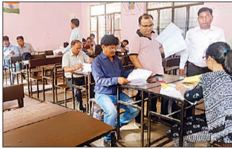
मूल्यांकन की संख्या का हिसाब मिलाते परीक्षक व डिप्टी हेड।

बुधवार को डॉ. जीनाथजी दयाल बालिका इंटर कॉलेज में हाईस्कूल के 13 डिप्टी हेड व 21 परीक्षकों ने 423 कापियों का मूल्यांकन किया। जीआईसी में हाईस्कूल के 24 डिप्टी हेड व 132 परीक्षकों ने 2005 कापियों का मूल्यांकन किया। अटल बिहारी इंटर कॉलेज में इंटर