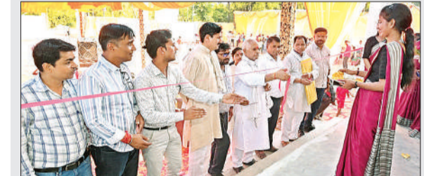
शुभारंभ करते संस्थापक एवं सेवानिवृत्त पशुघन अधिकारी।