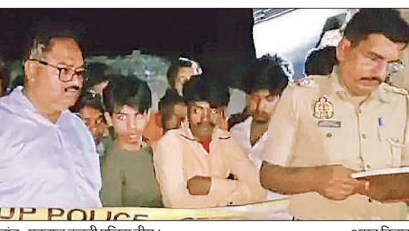
जांच-पड़ताल करती पुलिस टीम।