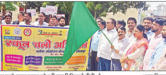
स्कूल चलो प्रचार वाहन को हरी झण्डी दिखाते बीडीओ।