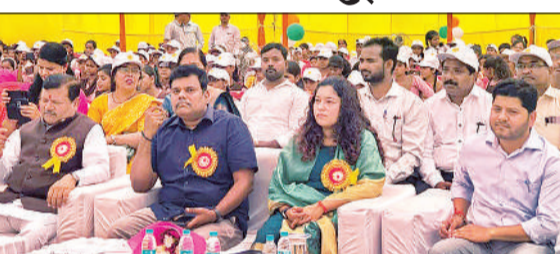
कार्यक्रम के दौरान उपस्थित नगर विकास राज्यमंत्री, डीएम व अन्य।