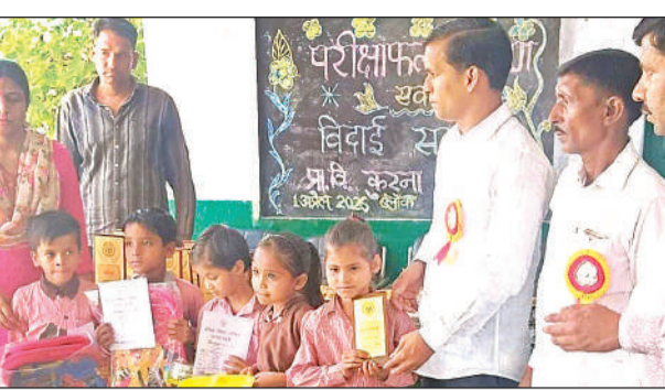
विद्यालय परिवार के साथ पुरस्कृत बच्चे।