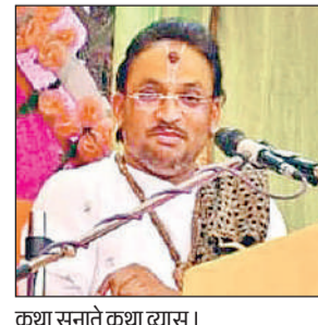
कथा सुनाते कथा व्यास।

हरदोई, अमृत विचार। इन दिनों तमाम जागरूकता के बावजूद लोग साइबर ठगी का शिकार हो रहे हैं। पुलिस ने मार्च माह में साइबर थाने में दर्ज तीन व पिहानी में दर्ज एक मामले में पीड़ितों को 11 लाख तीन सौ पैंतीस रुपये की धनराशि वापस कराई। शहर कोतवाली साइबर थाने में एक पीड़ित ने मामले को दर्ज कराया था, जिस पर पुलिस ने सफाई की। पीड़ितों को 11 लाख तीन सौ पैंतीस रुपये की धनराशि वापस कराई। एक और मामले में दो लाख तथा 15 हजार रुपये साइबर क्राइम थाने ने पीड़ितों को वापस कराए। इसी प्रकार पिहानी थाने में एक पीड़ित के 48, 500 रुपये पुलिस ने वापस कराए।