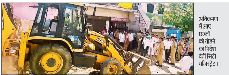
अतिक्रमण में आए छज्जों को तोड़ने का निर्देश देती सिटी मजिस्ट्रेट।