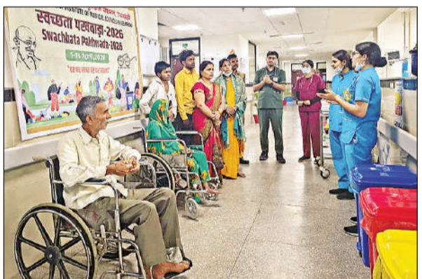
एम्स में स्वच्छता पखवाड़ा के बारे में जानकारी देते स्वास्थ्य कर्मी। अमृत विचार