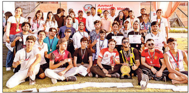
सीयू यूपी एथलेटिक्स मीट में शानदार प्रदर्शन करने वाले छात्र-छात्राएं।