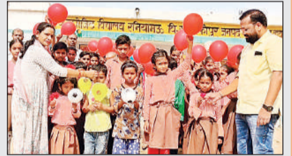
तिलक लगा व गुलाब देकर बच्चों का स्वागत करते शिक्षक।