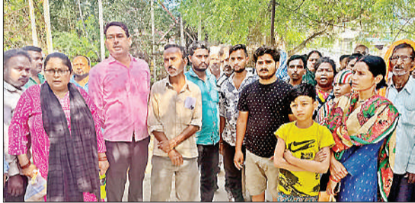
पावर हाउस में मौजूद उपभोक्ता।

अमृत विचार: शहर के कब्बाखेड़ा पावर हाउस पर उपभोक्ताओं को परेशानी का सामना करना पड़ रहा है। बुधवार को बिलिंग काउंटर का सर्वर ठप होने से दिन भर बिल जमा करने की प्रक्रिया बाधित रही। भोपण गर्मी में लोग घंटों लाइन में लगाकर सर्वर आने का इंतजार करते रहे। लेकिन उन्हें खाली हाथ लौटना पड़ा। सर्वर की खराबी का सबसे अधिक असर स्मार्ट मीटर वाले उपभोक्ताओं पर पड़ा। बिना किसी पूर्व सूचना के बिजली कटने से परेशान उपभोक्ता जब बिल जमा करने पहुंचते तो वहां सर्वर न होने की बात कहकर उन्हें घंटों खड़ा रखा गया। बिजली गुल रहने से कई मोहल्लों में पानी का