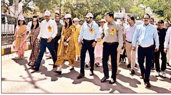
अधिकारियों के साथ पैदल चलकर स्कूल चलो का संदेश देते डीएम।