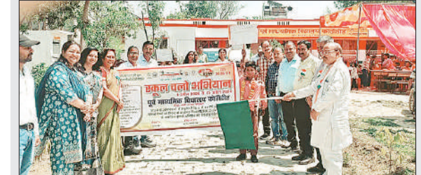
रेली को ही झंडी दिखाते एमएलसी व अन्य अतिथि।