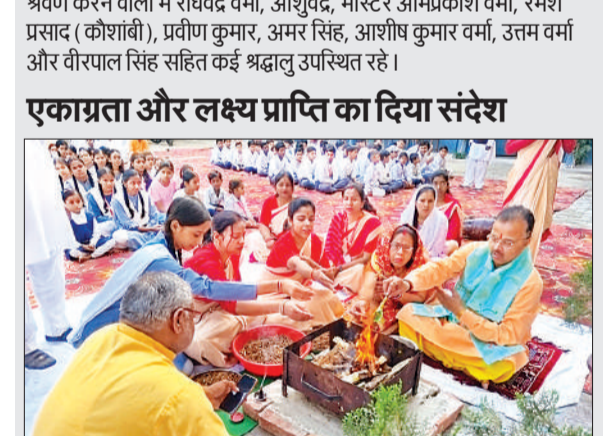
हवन-पूजन करते प्रधानाचार्य व अन्य।