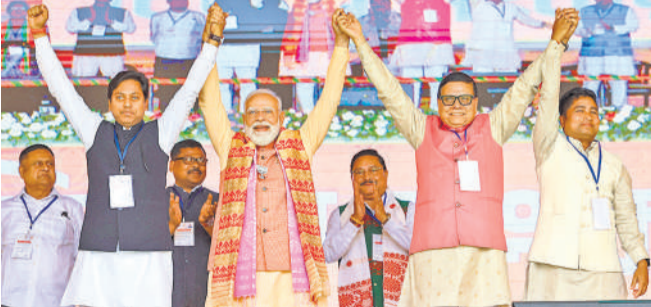
असम के गोगामुख में एक जनसभा के दौरान स्थानीय प्रत्याशियों के साथ प्रधानमंत्री नरेंद्र मोदी।

बिस्वनाथ जिले के बेहाली में एक अन्य रैली को संबोधित करते हुए प्रधानमंत्री ने आरोप लगाया कि कांग्रेस ने असम के संसाधनों के साथ न्याय नहीं किया। जबकि भाजपा राज्य की विविध संघदा का इस्तेमाल उसके विकास के लिए कर रही है।