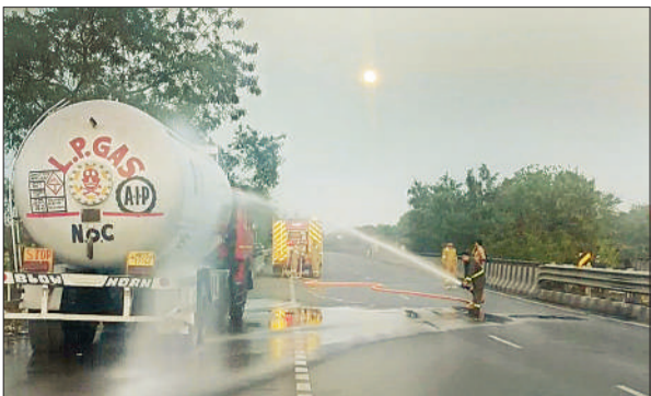
गैस टैंकर पर पानी डालते अग्निशमन कर्मचारी।