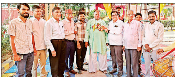
मुखिस्तान की गठित नई सरकार।