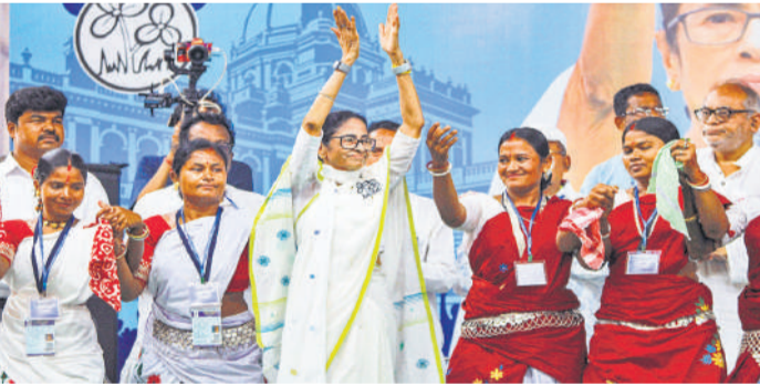
प. बंगाल के बीरभूम में एक जनसभा के दौरान लोगों का अभिवादन स्वीकार करती सीएम ममता बनर्जी।