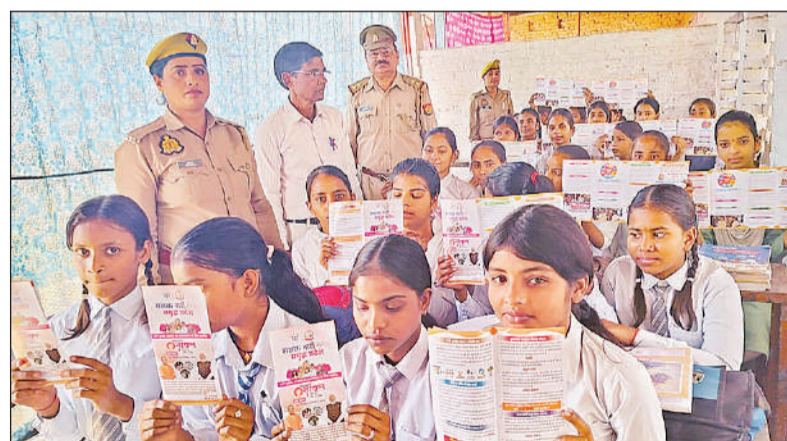
मल्लावां में चौपाल लगाकर बालिकाओं को जागरूक करती पुलिस टीम।