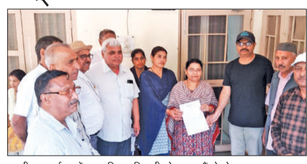
एसडीएम कार्यालय में प्रशासनिक अधिकारी को ज्ञापन सौंपते लोग।

इसी क्रम में इंकलाबी मजदूर केंद्र, प्रगतिशील महिला एकता केंद्र, उत्तराखंड परिवर्तन पार्टी, समाजवादी लोक मंच और परिवर्तनकामी छात्र संगठन के कार्यकर्ता उपजिलाधिकारी कार्यालय पर एकत्र हुए। यहां प्रदर्शन कर राष्ट्रपति को संबोधित ज्ञापन प्रशासनिक अधिकारी को सौंपा गया और चारों नए लेबर कोड्स को रद्द करने की मांग की