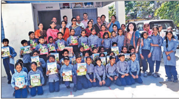
देवलचौड़ के सरकारी स्कूल में किताबों के साथ विद्यार्थी, पार्षद व शिक्षक।

अभिभावकों ने बताया कि सीबीएसई की ओर से हर बार सिलेबस बदला जाता है। जिससे नए शैक्षणिक सत्र में पुरानी किताबें कबाड़ में चली जाती हैं। हर साल किताबों में कुछ न कुछ बदलाव किया जाता है। ताकि प्रत्येक सत्र में अभिभावकों से किताबों के नाम पर मोटी रकम वसूली जा सके। अभिभावक इसे लेकर पूर्व में भी शिक्षा विभाग के अधिकारियों से बातचीत कर चुके हैं, लेकिन आज तक इस पर कोई निर्णय नहीं लिया गया।