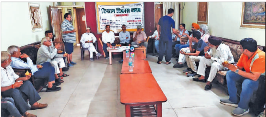
काशीपुर में आयोजित मासिक बैठक में चर्चा करते किसान। ● अमृत विचार