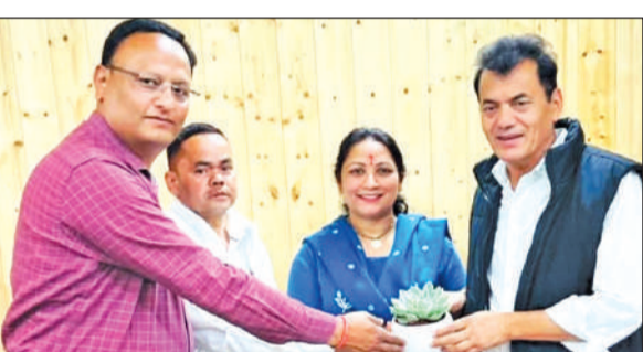
ब्लॉक प्रमुख से मुलाकात करतीं नगर पालिका अध्यक्ष।

एसएसपी बुधवार रात नैनीताल रोड पर भ्रमण पर थे। इस दौरान उन्होंने देखा कि जजी परिसर के पास बस के इंजन से लपटें निकल रही हैं। तत्काल उन्होंने बस रुकवाई और पेट्रोल पंप से अग्निशामक यंत्र लाकर करीब 10 मिनट में आग पर काबू पाया। बस में 15 यात्री थे। चालक ने एसएसपी को बताया कि बस फ्लेट ज्यादा गर्म होने के कारण स्पाकिंग कर गए होंगे जिस वजह से आग लग गई। गनीमत रही कि एसएसपी ने समय रहते तत्परता दिखाई और बड़ा हादसा बच गया।