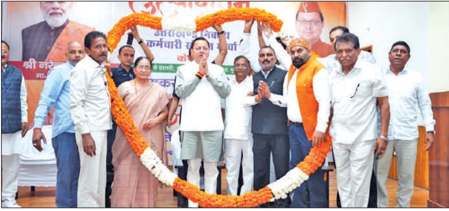
आभार रैली में मुख्यमंत्री पुष्कर सिंह धामी का अभिनंदन करता उत्तराखंड निकाय कर्मचारी संयुक्त मोर्चा।

मुख्यमंत्री ने इस अवसर पर कहा कि किसी भी राज्य के विकास में कर्मचारियों की भूमिका अत्यंत महत्वपूर्ण होती है और नगर निकाय कर्मचारियों की जिम्मेदारी विशेष रूप से अहम है। उन्होंने कहा कि निकाय कर्मियों के अथक प्रयासों से ही शहरों और कस्बों में स्वच्छता एवं बुनियादी सुविधाएं सुचारु रूप से संचालित होती हैं। उन्होंने कोविड-19 महामारी के दौरान कर्मचारियों द्वारा निभाई गई जिम्मेदारी और सेवा भाव को सराहते हुए इसे मानवता की उत्कृष्ट मिसाल बताया।