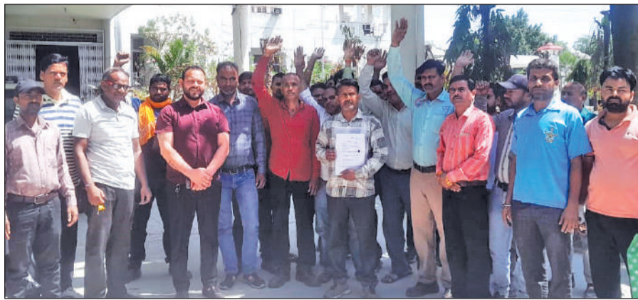
कलेक्ट्रेट में प्रदर्शन करते श्रमिक।

बुधवार को ऐरा श्रमिक संगठन के बैनर तले कई श्रमिक कलेक्ट्रेट परिसर पहुंचे। इस