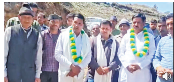
ओखलकांडा के किटौड़ा में ब्लॉक प्रमुख और पूर्व विधायक का स्वागत करते ग्रामीण।

इसके बाद सुबह 8 बजे से पहले ही अतिक्रमण हटाने की कार्रवाई पूरी कर ली गई। वन विभाग ने मौके से बरामद सामान को रेंज कार्यालय में जमा कर दिया है।