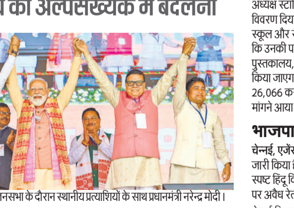
असम के गोगामुख में एक जनसभा के दौरान स्थानीय प्रत्याशियों के साथ प्रधानमंत्री नरेंद्र मोदी।

प्रधानमंत्री नरेंद्र मोदी ने बुधवार को आरोप लगाया कि अगर कांग्रेस असम में सत्ता में आई तो वह घुसपैठियों की रक्षा के लिए कानून लाएगी, लेकिन भारतीय जनता पार्टी (भाजपा) और उसके सहयोगी ऐसा होने नहीं देंगे। मोदी ने धेमाजी जिले के गोगामुख में एक चुनावी रैली को संबोधित करते हुए कहा कि कांग्रेस का लक्ष्य बहुसंख्यक समुदाय को अल्पसंख्यक में बदलना और घुसपैठियों का एक स्थायी वोट बैंक बनाना है। उन्होंने कहा कि 2014 में भाजपा के सत्ता में आने से पहले कांग्रेस ने केन्द्र में नया कानून लाने की कोशिश की थी, लेकिन राष्ट्रीय जनतांत्रिक गठबंधन (राजग) ने उसका विरोध किया था।