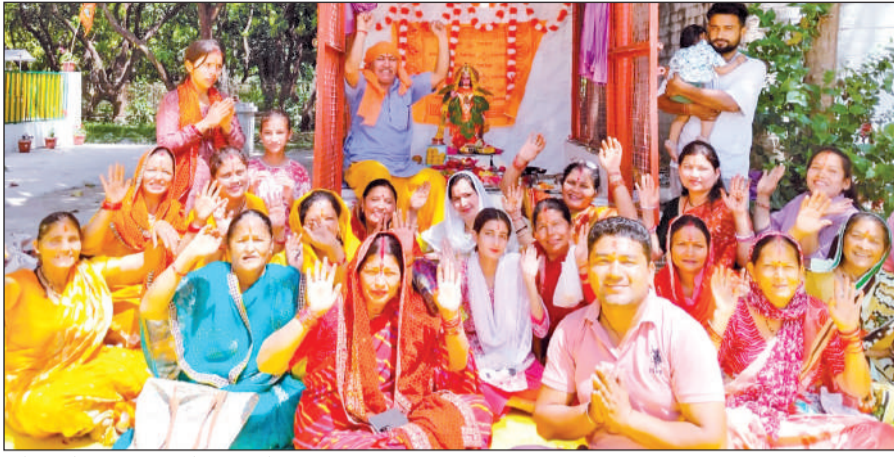
दिनेशपुर के हरिपुरा मंदिर में भजन गाते श्रद्धालु।