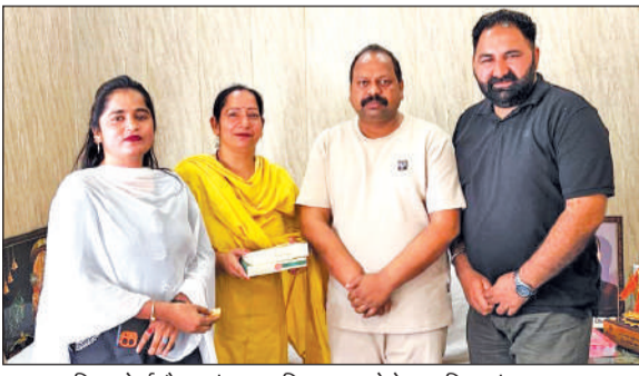
भाजपा महिला मोर्चा नौसर मंडल का विस्तार करने के बाद जिला पंचायत अध्यक्ष।