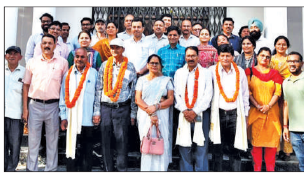
सेवानिवृत्त हुए चार शिक्षकों को विदाई देते प्रवक्ता।