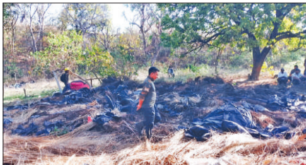
चोरगलिया में इसी स्थान से हटाया गया अतिक्रमण।