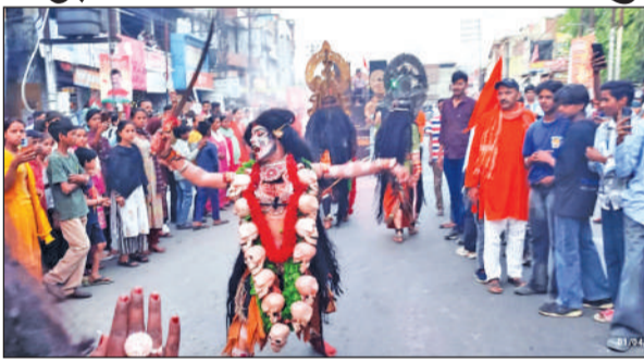
श्री हनुमान जन्मोत्सव पर शहर में निकाली गई शोभायात्रा।