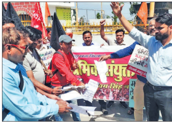
बाटा चौक पर श्रम कोड्स की प्रतियां फूँकते श्रमिक संगठनों के पदाधिकारी।

इसके अलावा इन संहिताओं के मसौदा तैयार करने से पूर्व या इस दौरान ट्रेड यूनियनों से कोई परामर्श नहीं किया गया। इतने गंभीर मुद्दे पर जो देश के कार्यबल के जीवन से जुड़ा है, लंबे समय से भारतीय श्रम सम्मेलन भी नहीं बुलाया गया। यह अंतरराष्ट्रीय श्रम मानकों का उल्लंघन है,