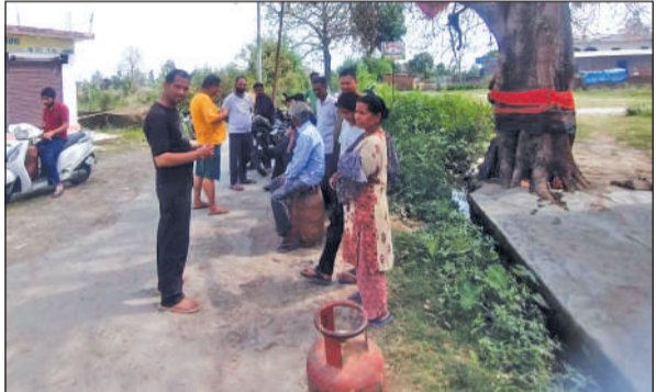
हल्द्वानी में गैस सिलेंडर लेने के लिए इंतजार में खड़े लोग।

इधर एक समस्या और भी है। चाहे घरेलू हो या कमर्शियल किसी भी तरह के ग्राहक को नया कनेक्शन नहीं मिल रहा है। यह सुविधा एक माह से बंद की जा चुकी है। लोगों को बताया जा रहा है कि जब तक यह संकट ठीक नहीं होता है तब तक कनेक्शन