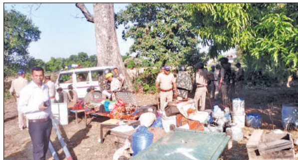
अतिक्रमण स्थल से बरामद सामान।