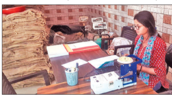
गल्ला मंडी क्रय केंद्र में किसानों का इंतजार करती क्रय केंद्र प्रभारी।

बुधवार को सुबह से ही क्रय केंद्र प्रभारी क्रय केंद्रों पर पहुंच गये थे। सुबह 9 बजे से सायं 5 बजे तक गेहूं की खरीद होनी थी। लेकिन तय समय पर कोई भी किसान न तो केंद्र में पंजीकरण के लिए पहुंचा और न ही गेहूं की नमी की जांच के लिए पहुंचा। जनपद ऊधमसिंह नगर में 108 क्रय केंद्र स्थापित