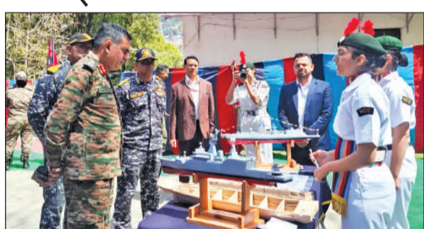
एनसीसी कैडेट्स द्वारा प्रस्तुत मॉडल का निरीक्षण करते अपर महानिदेशक।