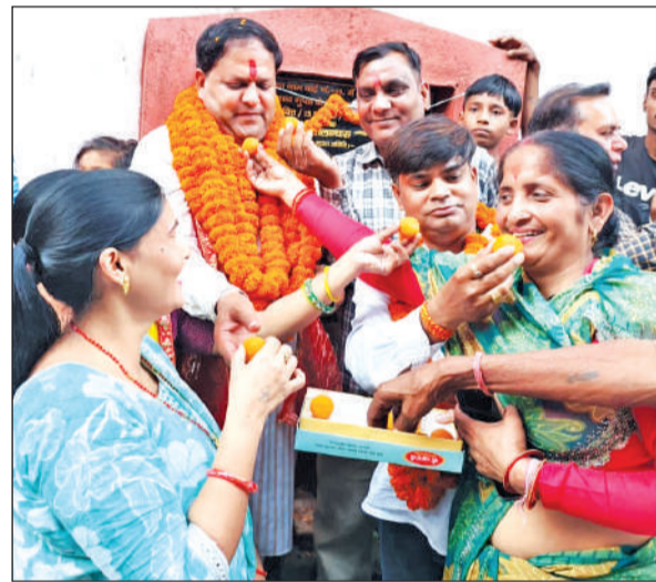
शिलान्यास के बाद एक-दूसरे को मिठाई खिलाते महापौर व अन्य।