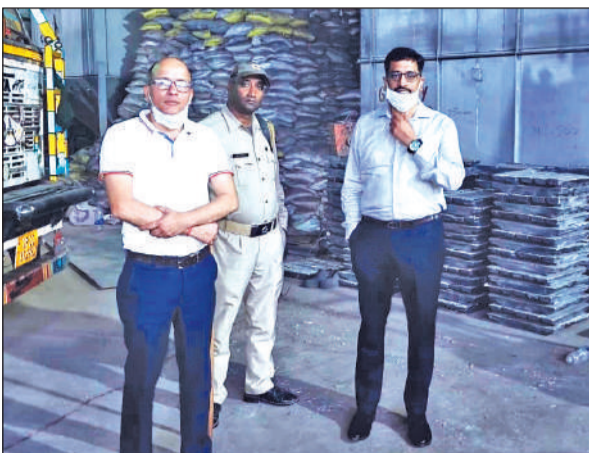
काशीपुर की फैक्ट्री में जांच करते जीएसटी अधिकारी।