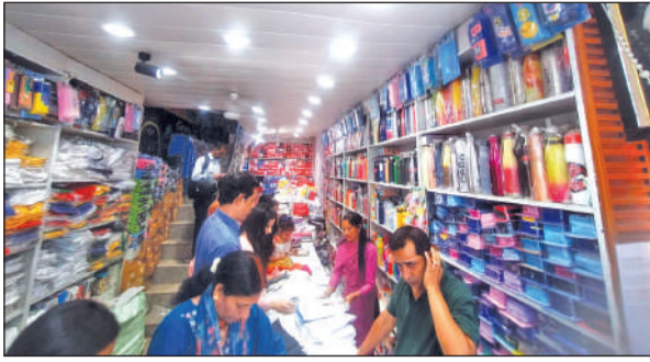
एक दुकान पर स्कूल ड्रेस की खरीदारी करते अभिभावक।

अमृत विचार : नए शैक्षणिक सत्र की शुरुआत होते ही शहर के स्कूलों में एक ओर जहां बच्चों की चहल-पहल और उत्साह देखने को मिला, वहीं दूसरी ओर बड़ी संख्या में अभिभावक काँपी-किताबों और स्कूल ड्रेस खरीदने के लिए दुकानों और बैंकवट हॉल में लाइन लगाते हुए नजर आए। सत्र के पहले ही दिन बड़ी संख्या में अभिभावकों ने काँपी-किताबों और ड्रेस की खरीदारी की। कुछ अभिभावकों ने नाम न छापने की शर्त पर बताया कि स्कूलों की ओर से जल्द से जल्द किताबें खरीदने के लिए कहा जा रहा है, जबकि शिक्षा विभाग के स्पष्ट निर्देश हैं कि कोई भी स्कूल अभिभावकों को किताबों और ड्रेस जल्दी खरीदने के लिए बाध्य नहीं कर सकता है। अभिभावक किताबें खरीदने के लिए दुकानों में पहुंच रहे हैं, जबकि बाजार में सभी किताबें उपलब्ध नहीं हैं। ऐसे में उन्हें फिर से दुकानों के चक्कर लगाने पड़ रहे हैं। एक अभिभावक को किताबें खरीदने में औसतन आधे से पौने घंटे तक का समय लग रहा है। ड्रेस को लेकर भी स्थिति कुछ अलग नहीं है। प्रत्येक निजी स्कूल की अलग-अलग डिजाइन, रंग और लोगो वाली ड्रेस अनिवार्य किए जाने से अभिभावकों को सीमित दुकानों पर निर्भर रहना पड़ रहा है। जबकि शिक्षा विभाग के मानकों के अनुसार किसी विशेष दुकान या डिजाइन को अनिवार्य नहीं किया जा सकता। इस