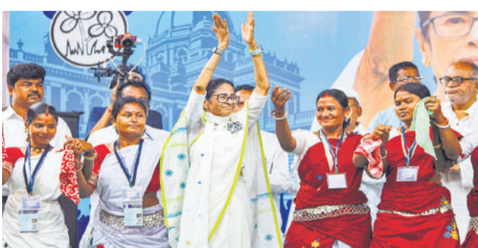
प. बंगाल के बीरभूम में एक जनसभा के दौरान लोगों का अभिवादन स्वीकार करती सीएम ममता बनर्जी।

अमेरिका का गुलाम होने का आरोप लगाया। उन्होंने असम में भाजपा नीत सरकार के दौरान हर मोर्चे में बड़े पैमाने पर भ्रष्टाचार होने का आरोप लगाते हुए शारदा, स्मार्ट सिटी और एनसी हिल्स जैसे कई पुराने घोटालों का मुद्दा उठाया। प्रियंका ने दावा किया कि भाजपा के कथं था कि उसने डबल इंजन वाली सरकार दी है। असल में यह दोहरी गुलामी वाली सरकार है। प्रधानमंत्री मोदी अमेरिका की गुलामी में लगे हैं और हिमंत विश्व शर्मा मोदी की गुलामी कर रहे हैं। उन्होंने भाजपा पर चाय बगान श्रमिकों की दैनिक मजदूरी बढ़ाने के वादे को पूरा करने में नाकाम का आरोप लगाया।