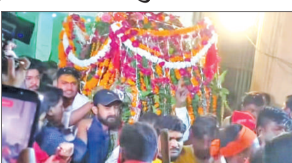
काशीपुर में चैती मंदिर से नगर मंदिर को जाता मां बाल सुंदरी देवी का डोला।

मंगलवार की अर्ध रात्रि 12.30 बजे तंत्रोक्त विधि से हवन शुरू हुआ और द्वाइ बने पूजाहुति के बाद मां को नारियल एवं जायफल की प्रतीकात्मक बलि दी गई। 3.15 बजे मां की स्वर्ण प्रतिमा को लेकर डोले में विराजमान किया गया और बुधवार तड़के 4.20 बजे मोहल्ला कानूनगोयान स्थित नगर मंदिर पहुंची मां बाल सुंदरी की प्रातः काली मारी की गई। बता दें कि चैती मेला मैदान स्थित मां बाल सुंदरी देवी मंदिर में बीती 26 मार्च को तड़के मां भगवती का डोला आने के बाद से शहर के अलावा