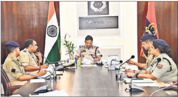
बैठक के दौरान मौजूद अधिकारी।

डीआईजी ने कार्यालय में आयोजित बैठक में अपराधिक प्रकरण, निरोधात्मक कार्रवाई, एसआर केस और लंबित विवेचनाओं के शीघ्र निस्तारण के निर्देश दिए। ने कहा कि हत्या लूट, डकैती, बलात्कार, दहेज हत्या, पॉक्सो एक्ट, अपहरण, गोकशी, धर्मांतरण एवं साम्प्रदायिक संघर्ष के मामलों में कठोर कार्रवाई की जाए। उन्होंने ऑपरेशन कन्विकशन, ऑपरेशन क्लीन, ऑपरेशन त्रिनेत्र के तहत की गयी कार्रवाई की समीक्षा की।