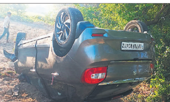
पलिया-निघासन हाईवे पर खेत में पलटी पड़ी कार। ● अमृत विचार

अमृत विचार: पलिया-निघासन हाईवे पर कोटी बाबा सैयद फार्म के पास बुधवार सुबह एक तेज रफ्तार बेलोनी कार अनियंत्रित होकर पलट गई और सड़क किनारे खेत में जा गिरी। हादसे में कार चालक गंभीर रूप से घायल हो गया, जिसे मौके पर पहुंची पुलिस ने अस्पताल में भर्ती कराया है। निघासन से मझगई की तरफ जा रही कार काफी तेज गति में थी। सामने सड़क पर गड्ढा आने पर चालक ने बचाव करने की कोशिश की, लेकिन इसी दौरान कार असंतुलित होकर पलट गई और सड़क किनारे खेत में जा गिरी। हादसा इतना भीषण था कि कार के चारों पहिए उपर हो गए। दुर्घटना में थाना मझगई के गांव