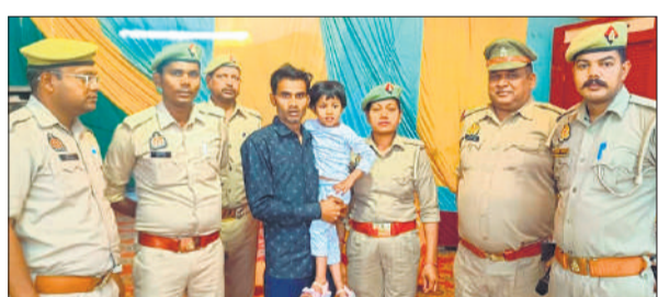
गोला के घेती मेला में खोई बच्ची परिजनों को सौंपती पुलिस। ● अमृत विचार

गोला गोकर्णनाथ, अमृत विचार: छोटी काशी में चला रहे ऐतिहासिक चैती मेला देखने आई पांच साल की बच्ची मेले में कहीं खो गई। सूचना पर पुलिस ने ढूंढकर उसे परिजनों के सुपुर्द किया।