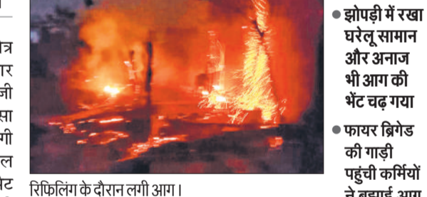
रिफिलिंग के दौरान लगी आग।