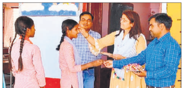
शेरपुर स्कूल में छात्राओं को तिलक लगाकर स्वागत करती शिक्षिका।