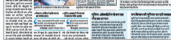
अमृत विचार में छपी खबर का पीडीएफ।