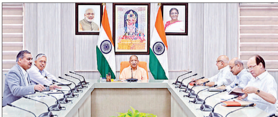
लखनऊ: अधिकारियों के साथ कृषि विभाग की समीक्षा बैठक करते मुख्यमंत्री योगी।

अमृत विचार: मुख्यमंत्री योगी आदित्यनाथ ने कृषि विभाग को निर्देश दिया कि सभी योजनाओं को फार्मर रजिस्ट्री से जोड़ने के लिए आवश्यक तकनीकी व्यवस्था तय समयसीमा में तैयार की जाए और विभागीय पोर्टल को 1 मई 2026 तक पूरी तरह क्रियाशील बनाया जाए। इससे लाभार्थियों के चयन और वितरण की प्रक्रिया डिजिटल और पारदर्शी हो सकेगी। मुख्यमंत्री योगी ने अपने आवास पर बुधवार को कृषि विभाग की समीक्षा बैठक में फार्मर रजिस्ट्री को प्रदेशभर में तेजी से लागू करने के निर्देश दिए हैं। उन्होंने स्पष्ट कहा कि प्रत्येक पात्र किसान का पंजीकरण प्राथमिकता के आधार पर सुनिश्चित किया जाए और कोई भी किसान इस व्यवस्था से वंचित न रहे। मुख्यमंत्री ने निर्देश दिए कि प्रत्येक ग्राम पंचायत में विशेष शिबिर आयोजित कर किसानों को फार्मर रजिस्ट्री से जोड़ा जाए। उन्होंने कहा कि राज्य सरकार इसे कृषि क्षेत्र में एकीकृत लाभ वितरण प्रणाली के रूप में विकसित कर रही है, जिससे विभिन्न योजनाओं का लाभ एक ही प्लेटफॉर्म के माध्यम