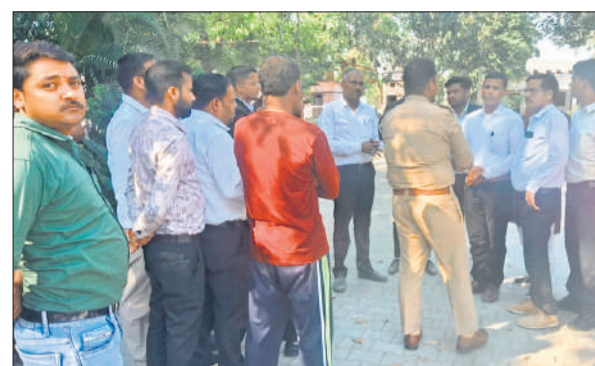
मौके पर जांच-पड़ताल करती पुलिस।