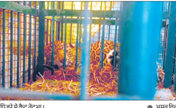
पिंजरे में कैद तेंदुआ।

वन विभाग के मुताबिक तेंदुआ लगातार लोकेशन बदल रहा था, जिससे उसे पकड़ना चुनौतीपूर्ण हो गया था। टीम ने मैलापुरवा, ढखनिया, रामलोक और ढेखीपुरवा गांवों के आसपास कई बार नाइट विजन कैमरे और पिंजरे लगाए, लेकिन हर बार तेंदुआ चकमा दे गया। इससे ग्रामीणों में भय का माहौल बना हुआ था। मंगलवार देर रात वन विभाग के लगाए गए पिंजरे में बंधी बकरी के लालच में तेंदुआ फंस गया। वन विभाग की टीम मौके पर पहुंच गई। तेंदुए के पकड़े जाने की खबर फैलते