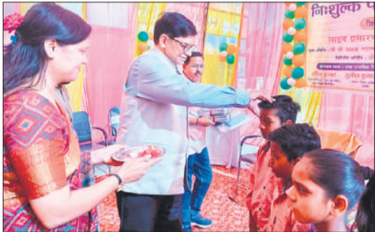
टाह पीटा स्कूल में बच्चों को तिलक लगाकर स्वागत करते डीएम व बीएसए।