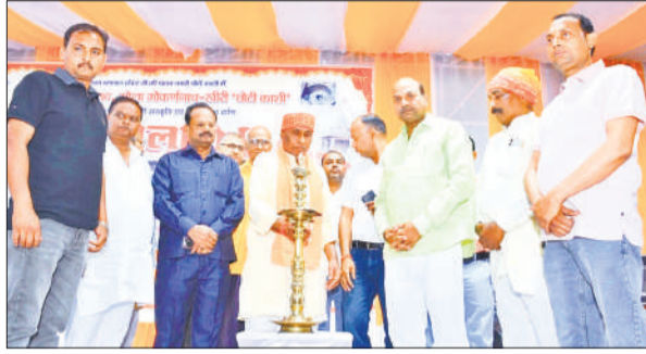
चैती मेले के सांस्कृतिक मंच पर पालिका अध्यक्ष के साथ दीप प्रज्वलित करते मुख्य अतिथि।