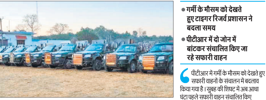
मुस्तफाबाद में खड़े सफारी वाहन।

अमृत विचार: पीलीभीत टाइगर रिजर्व में अब रोजाना सुबह छह बजे और शाम को 3.30 बजे से सफारी वाहनों का संचालन किया जाएगा। गर्मी के मौसम को देखते हुए टाइगर रिजर्व प्रशासन ने सफारी वाहनों के समय में बदलाव किया है। सर्दी के दौरान सफारी वाहनों का संचालन सुबह 6.30 बजे से किया जाता था। पीलीभीत टाइगर रिजर्व में पर्यटन सत्र के दौरान सैलानियों की सुविधा के लिए सफारी वाहनों का संचालन किया जा रहा है। इसमें 28 जीपों सफारी एवं करीब 47 जिप्सी वाहनों का संचालन किया गया है। चालू पर्यटन सत्र में मुस्तफाबाद गेट, महोफ गेट, बराही गेट समेत शहर स्थित नेहरू ऊर्जा उद्यान से इन सफारी वाहनों