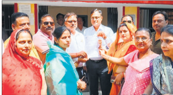
स्मार्ट मीटर को लेकर ज्ञान देते व्यापारी।

नए मीटरों में अत्यधिक तेज रीडिंग के कारण बिजली बिल में बढ़ोतरी हुई है। तकनीकी खामियों के चलते रिचार्ज खत्म होते ही कनेक्शन कट जाता है।