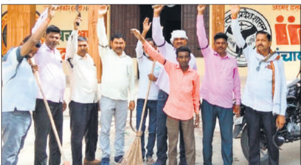
ग्राम सचिवालय पर काली पट्टी बांधकर प्रदर्शन करते सफाईकर्मों।

उन्होंने कहा कि नई पेंशन व्यवस्था में कर्मचारियों को सेवानिवृत्ति के बाद आर्थिक अस्थिरता का सामना करना पड़ता है, जबकि पुरानी पेंशन योजना