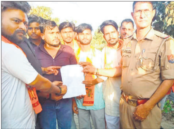
हैदराबाद एसओ को ज्ञापन सौंपते पदाधिकारी।

बुधवार शाम गौशाला पर हंगामा कर रहे हिंदू युवा वाहिनी के कार्यकर्ताओं का कहना था कि अस्थायी गोवंश आश्रय स्थल पर प्रधान, सेक्रेटरी और पशु चिकित्सक लापरवाही कर रहे हैं, जिससे भूख, प्यास और इलाज के अभाव में पशु तड़फ तड़फ कर मर रहे हैं। गोवंश के अंतिम संस्कार की भी व्यवस्था नहीं करते हैं, जिससे चील, कौए नोंचते रहते