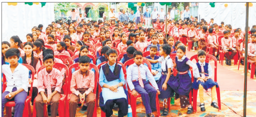
पहले दिन कार्यक्रम में मौजूद बच्चे।