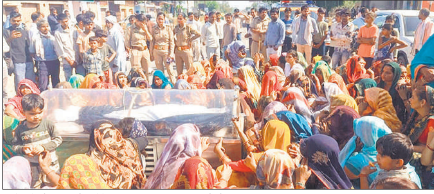
आरोपियों की गिरफ्तारी न होने पर जाम लगाकर प्रदर्शन करती भीड़।