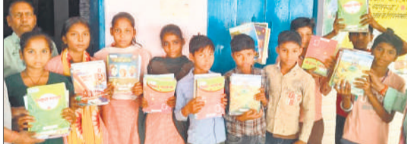
लखनऊ कला गांव के स्कूल में किताबें दिखाते बच्चे।