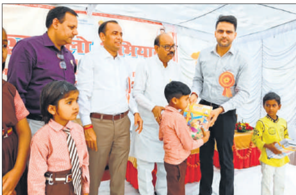
प्राथमिक विद्यालय सदर में बच्चों को पुस्तकें देते भाजपा जिलाध्यक्ष, सीडीओ व बीएसए।