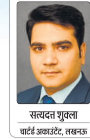
सयुक्त शुक्ला चाईर्ड अकाउंटेंट, लखनऊ

तेजी से बदलते डिजिटल युग में खरीदारी का स्वरूप पूरी तरह बदल चुका है। आज उपभोक्ता घर बैठे कपड़े, मोबाइल, किताबें ही नहीं, बल्कि रोजमर्रा की जरूरत की वस्तुएं भी ऑनलाइन प्लेटफॉर्म के माध्यम से खरीद रहे हैं। इस बढ़ती डिजिटल निर्भरता ने ई-कॉमर्स को एक विशाल बाजार के रूप में स्थापित कर दिया है। ऐसे में किसी भी ऑनलाइन व्यवसाय को सफल बनाने के लिए ई-कॉमर्स मैनेजमेंट की भूमिका बेहद महत्वपूर्ण हो जाती है। ई-कॉमर्स मैनेजमेंट केवल उत्पाद बेचने तक सीमित नहीं है, बल्कि यह एक समग्र प्रक्रिया है, जिसमें वेबसाइट या ऐप का संचालन, प्रोडक्ट की प्रस्तुति, ग्राहकों से संवाद, ऑर्डर की प्रक्रिया, भुगतान प्रणाली और डिलीवरी तक का पूरा प्रबंधन शामिल होता है। सही रणनीति और कुशल प्रबंधन के जरिए ऑनलाइन व्यवसाय को तेजी से विस्तार दिया जा सकता है।