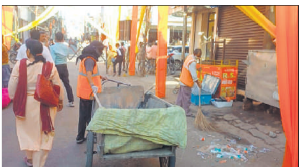
साफ-सफाई करते नगर पालिका के सफाई कर्मी।