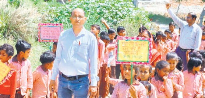
प्राथमिक विद्यालय अकबरपुर - रावतपुर में स्कूल चलो जागरूकता रैली निकालते शिक्षक व छात्र।