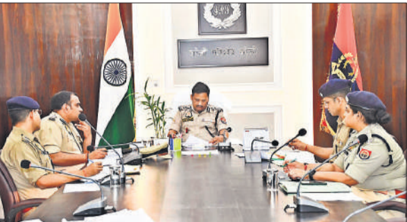
बैठक के दौरान मौजूद अधिकारी।

डीआईजी ने कार्यालय में आयोजित बैठक में अपराधिक प्रकरण, निरोधात्मक कार्रवाई, एसआर केस और लंबित विवेचनाओं के शीघ्र निस्तारण के निर्देश दिए। ने कहा कि हत्या लूट, डकैती, बलात्कार, दहेज हत्या, पाँकसो एक्ट, अपहरण, गोकर्षी, धर्मांतरण एवं साम्प्रदायिक संघर्ष के मामलों में कठोर कार्रवाई की जाए। उन्होंने ऑपरेशन कन्विकशन, ऑपरेशन क्लीन, ऑपरेशन त्रिनेत्र के तहत की गयी कार्रवाई की समीक्षा की।