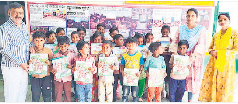
प्राइमरी स्कूल तेरा में पुस्तकें वितरित करते प्रधान अध्यापक।

शाहजहांपुर, अमृत विचार : पुलिस लाइन स्थित महिला परामर्श केंद्र पर बुधवार को 7 पत्रावलियों पर सुनवाई की गई, जिसमें एक दंपती का समझौता हुआ। पुष्पा क्षेत्र के एक दंपती, जिनकी शादी करीब 03 वर्ष पूर्व हुई थी, के मध्य पारिवारिक विवाद उत्पन्न हो गया था। महिला 4 माह से मायके में रह रही थी। महिला ने आरोप लगाया कि पति एवं सास उसके साथ मारपीट करते थे। सास विवाह में मिले सामान का उपयोग नहीं करने देती थी, जिसके कारण वह मायके चली गई थी। दोनों पक्षों को परिवार परामर्श केंद्र बुलाया गया, जहां उनकी बातों का समझौता-बुझाया गया। दोनों पक्ष आपसी सहमति से पुनः साथ रहने के लिए तैयार हो गए।