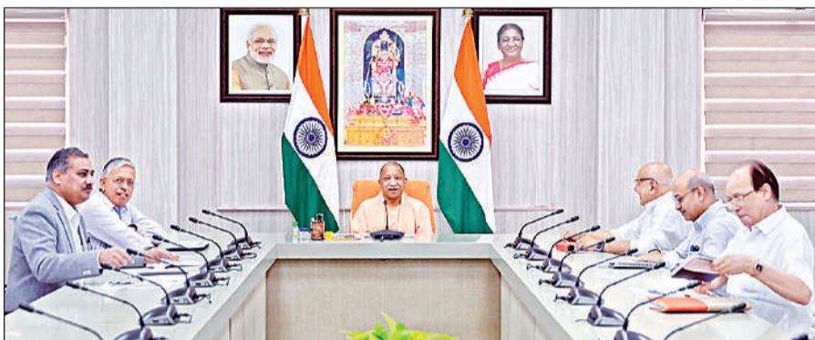
लखनऊ: अधिकारियों के साथ कृषि विभाग की समीक्षा बैठक करते मुख्यमंत्री योगी।

● ग्राम पंचायत स्तर पर विशेष शिबिर, 1 मई तक पोर्टल होगा क्रियाशील, सभी योजनाएं होंगी एकीकृत