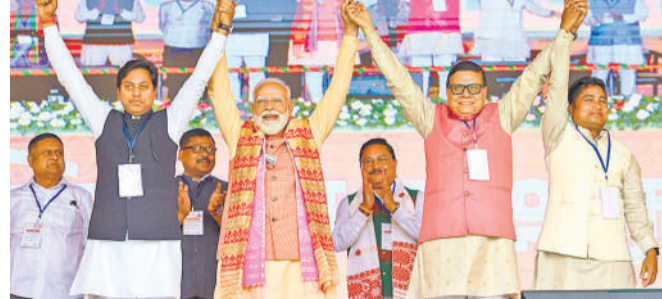
असम के गोगामुख में एक जनसभा के दौरान स्थानीय प्रत्याशियों के साथ प्रधानमंत्री नरेन्द्र मोदी।

प्रधानमंत्री नरेन्द्र मोदी ने बुधवार को आरोप लगाया कि अगर कांग्रेस असम में सत्ता में आई तो वह घुसपैठियों की रक्षा के लिए कानून लाएगी, लेकिन भारतीय जनता पार्टी (भाजपा) और उसके सहयोगी ऐसा होने नहीं देंगे। मोदी ने धेमाजी जिले के गोगामुख में एक चुनावी रैली को संबोधित करते हुए कहा कि कांग्रेस का लक्ष्य बहुसंख्यक समुदाय को अल्पसंख्यक में बदलना और घुसपैठियों का एक स्थायी बंदूक बनाना है। उन्होंने कहा कि 2014 में भाजपा के सत्ता में आने से पहले कांग्रेस ने केन्द्र में नया कानून लाने की कोशिश की थी, लेकिन राष्ट्रीय जनतांत्रिक गठबंधन (राजग) ने उसका विरोध किया था।