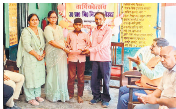
बच्चे को सम्मानित करती स्कूल प्रधानाध्यापिका।