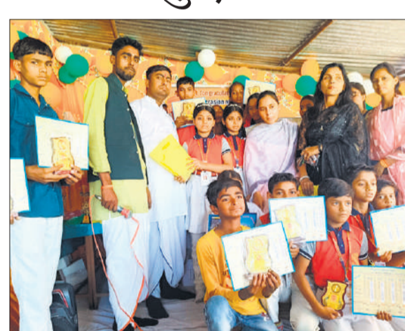
मेधावी बच्चों के साथ शिक्षक