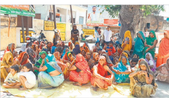
ब्लॉक गेट पर डाला ताला व धरने पर बैठी महिलाएं।