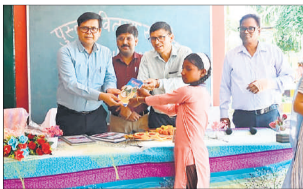
बच्चे को किताबें देते बीएसए।