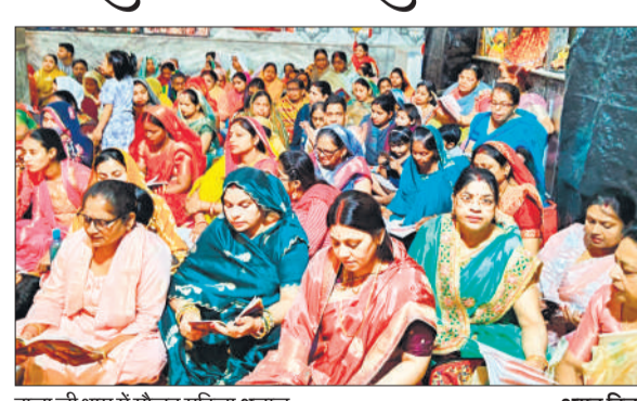
बाला जी धाम में मौजूद महिला श्रद्धालु

अमृत विचार : नगर के प्रसिद्ध धार्मिक स्थल सिद्ध पीठ श्री बालाजी धाम में श्री हनुमान जन्मोत्सव के उपलक्ष्य में आयोजित कार्यक्रमों ने पूरे क्षेत्र को भक्तिमय कर दिया। मंदिर परिसर में सतेती से आई प्रसिद्ध भजन मंडली की ओर से सुंदरकांड व संगीतमय पाठ किया गया। आयोजन की दिव्यता का आलम यह रहा कि पाठ के दौरान उपस्थित सैकड़ों भक्त श्रद्धा के अतिरेक में भाव-विभोर हो गए और पूरा मंदिर प्रांगण "जय श्री राम" व "जय हनुमान" के उद्घोष से गूंज उठा। सुंदरकांड का सस्वर पाठ बजरंग कीर्तन मंडल ने प्रस्तुत किया गया। उनकी सुमधुर प्रस्तुति ने वातावरण में ऐसी आध्यात्मिक ऊर्जा में संचार किया कि श्रद्धालु मंत्रमूग्ध होकर प्रभु की भक्ति में लीन नजर आए। पाठ की पूर्णाहुति