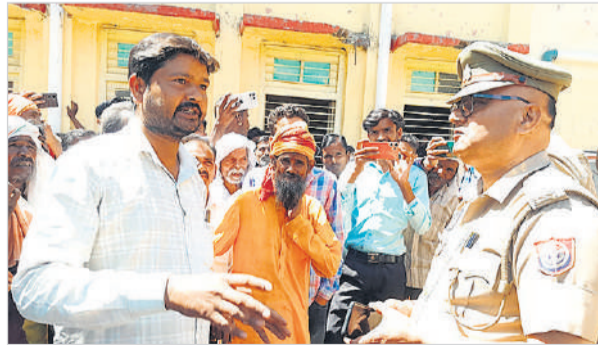
ग्रामीणों को समझती हुई पुलिस।