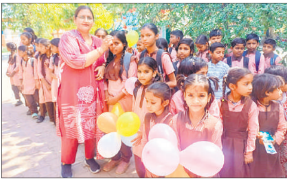
बच्चों को तिलक लगाकर स्वागत करती स्कूल प्रधानाध्यापिका।

बदायूं, अमृत विचार : ब्लॉक उझानी के गांव पटपरागंज में फिर से कूड़ा डाला गया, तो कांग्रेस कार्यकर्ता विरोध प्रदर्शन करेंगे। कांग्रेस के जिलाध्यक्ष अजीत यादव ने कहा कि पिछले एक साल से नगर पालिका की ओर से कूड़े का निस्तारण नहीं किया जा रहा है। अब फिर से नगर पालिका प्रशासन कूड़ा निस्तारण को लेकर कार्य योजना तैयार कर रहा है। उन्होंने बताया कि पटपरागंज में दस साल से कूड़ा डाला जा रहा था जिसे एक साल पहले बंद कराया गया है।