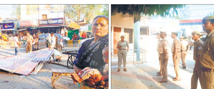
थाने के बाहर से अतिक्रमण हटवाते पुलिसकर्मी।