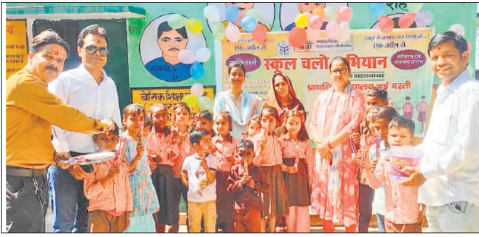
प्राथमिक विद्यालय नई बस्ती में छात्रों का पुष्प वर्षा कर स्वागत करते प्रधान अध्यापक।