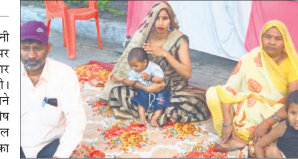
चीनी मिल गेट पर धरना देता पीड़ित परिवार।