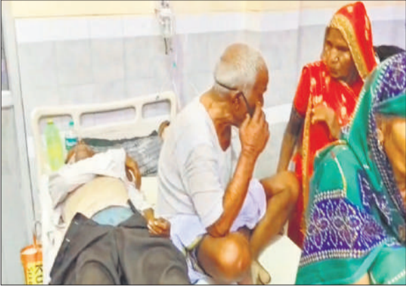
बेड पर शव के पास बेटे मरीज और तीमारदार।

बताया गया कि ट्रामा सेंटर का विस्तार कार्य होने के कारण उच्च नई बिल्डिंग के पास अस्थायी स्थान पर शिफ्ट किया गया है, जहां सीमित संसाधनों में मरीजों का इलाज किया जा रहा है। मंगलवार को लखीमपुर निवासी एक मरीज को गंभीर हालत में लाया गया, जिसे स्टाफ एक बेड पर लिटाकर उपचार शुरू किया। वीडियो में दिख रहा है कि उसी बेड पर एक बजुर्ग का शव भी किनारे रखा था और पास में दूसरा मरीज बैठा हुआ था। डॉ. की ओर से जांच के बाद लेटे हुए मरीज को मृत घोषित कर दिया गया। किसी व्यक्ति