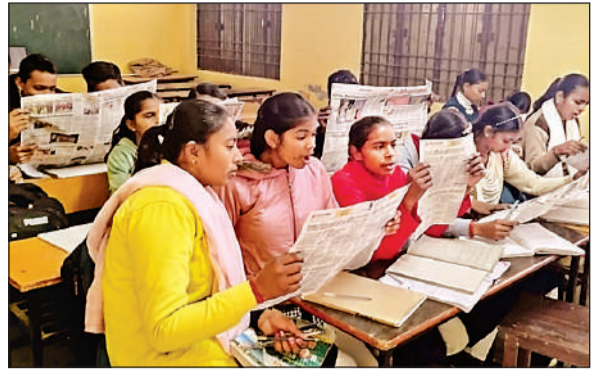
लखनऊ: राजकीय हाईस्कूल हनुआपुर, काकोरी में अखबार पढ़ती छात्राएं।

अमृत विचार: समसामयिक घटनाओं की जानकारी से अवगत होने और शब्दज्ञान बढ़ाने के लिए विद्यार्थियों ने नए सत्र में अपनी कक्षाओं का शुभारंभ समाचार पत्र पढ़कर किया। माध्यमिक विद्यालयों में नए सत्र का आरंभ बुधवार से कर दिया गया है। प्रार्थना सभा के बाद छात्र-छात्राओं ने समाचार पत्रों का वाचन किया। इसके लिए विद्यालयों में समाचार पत्रों को उपलब्ध कराए जाने को लेकर दिशा-निर्देश जारी किया गया था। निर्देश के अनुसार, बच्चों की स्कूली