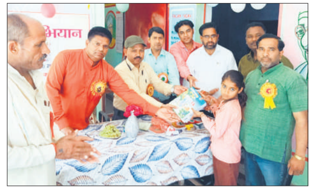
बच्चों को नई किताबें देते शिक्षक।