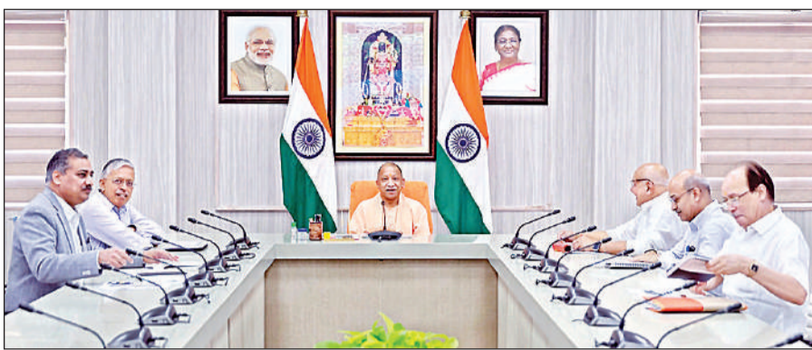
लखनऊ: अधिकारियों के साथ कृषि विभाग की समीक्षा बैठक करते मुख्यमंत्री योगी।

लखनऊ, अमृत विचार: राज्यसभा सांसद डॉ. लक्ष्मीकांत वाजपेयी ने दवाओं की कीमतों में भारी असमानता को मुद्दा उठाते हुए केंद्र सरकार से सभी दवाओं के लिए एक समान अधिकतम खुदरा मूल्य (एमआरपी) निर्धारित करने की मांग की है। उन्होंने कहा कि एक ही साल की दवाओं के दाम में बड़ा अंतर आम लोगों के लिए आर्थिक बोझ बन रहा है। भाजपा के पूर्व प्रदेश अध्यक्ष डॉ. लक्ष्मीकांत वाजपेयी ने बुधवार को संसद में शून्यकाल के दौरान उठाए गए इस मुद्दे की जानकारी देते हुए बताया कि सरकार ने आयुष्मान भारत योजना और जन औषधि केंद्रों के माध्यम से सस्ती दवाएं उपलब्ध कराने का प्रयास किया है, लेकिन निजी क्षेत्र में मूल्य असमानता अभी भी बड़ी समस्या बनी हुई है। सांसद ने यह भी सुझाव दिया कि डॉक्टरों को दवाओं के ब्रांड नाम के बजाय साल्ट नाम लिखना चाहिए।