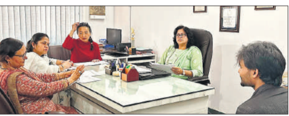
छात्र का साक्षात्कार लेते समिति में शामिल शिक्षक।

बरेली, अमृत विचार : चीनी भाषा दक्षता परीक्षा के बाद एमजेपी रुहेलखंड विश्वविद्यालय के मानविकी विभाग स्थित बहुभाषिक केंद्र में बुधवार को साक्षात्कार हुआ। इसमें 7 विद्यार्थियों का चयन हुआ। परीक्षा का आयोजन ताइवान एजुकेशन एंड कल्चरल सेंटर नई दिल्ली के सहयोग से किया गया था। जिसमें 15 विद्यार्थियों ने भाग लिया था।