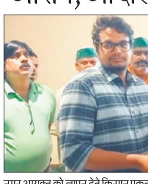
नगर आयुक्त को ज्ञापन देते किसान एकता संघ के पदाधिकारी।