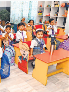
गिरीश प्रसाद मेमोरियल स्कूल में छुट्टी के बाद बच्चों के आते बच्चे। ● अमृत विचार

कई स्कूलों में प्री-एनसी के नए एडमिशन वाले बच्चे एक दूसरे को रोता देख खुद भी रोने लगे। ऐसे बच्चों को मैडम ने मिलकर संभाला। उन्हें बहलाने के लिए टॉफी और खिलौने दिए गए। मैडम भी बच्चा बनकर बच्चों को बहलवाती रहीं। इसके बाद बच्चे कुछ शांत हुए।