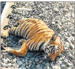
भीखमपुर जंगल में रेलवे लाइन के किनारे पड़ा बाधिन का शव।

बांकेगंज: दुधवा टाइगर रिजर्व के बफर जोन क्षेत्र में मैलानी-बांकेगंज रोड पर बुधवार की सुबह एक बाधिन का शव पाया गया। माना जा रहा है कि बाधिन को ट्रेन की चपेट में आकर मौत हो गई। इस घटना से एक बार फिर वन्यजीवों की सुरक्षा को लेकर गंभीर सवाल खड़े हो गए हैं।