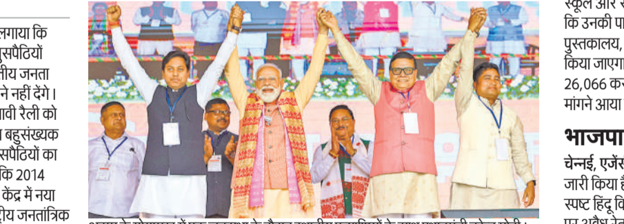
असम के गोगामुख में एक जनसभा के दौरान स्थानीय प्रत्याशियों के साथ प्रधानमंत्री नरेन्द्र मोदी।

प्रधानमंत्री नरेन्द्र मोदी ने बुधवार को आरोप लगाया कि अगर कांग्रेस असम में सत्ता में आई तो वह घुसपैठियों की रक्षा के लिए कानून लाएगी, लेकिन भारतीय जनता पार्टी (भाजपा) और उसके सहयोगी ऐसा होने नहीं देंगे। मोदी ने धेमाजी जिले के गोगामुख में एक चुनौती रेली को संबोधित करते हुए कहा कि कांग्रेस का लक्ष्य बहुसंख्यक समुदाय को अल्पसंख्यक में बदलना और घुसपैठियों का एक स्थायी वाट बँक बनाना है। उन्होंने कहा कि 2014 में भाजपा के सत्ता में आने से पहले कांग्रेस ने केंद्र में नया कानून लाने की कोशिश की थी, लेकिन राष्ट्रीय जनतांत्रिक गठबंधन (राजग) ने उसका विरोध किया था।