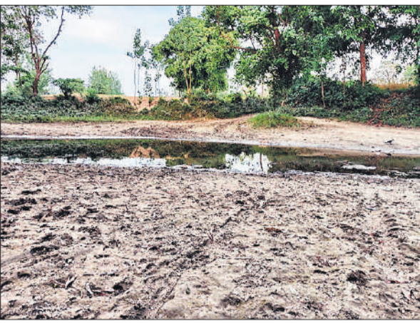
दमखोदा ब्लाक के खिरना गांव में देवरनियां नदी पर बनेगा पुल।