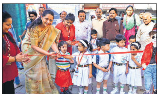
सेक्रेट हार्ट में नए सत्र पर बच्चों से फीता कटवाते अध्यापक। ● अमृत विचार

बुधवार सुबह दुर्गा नगर स्थित एक निजी स्कूल के छात्र ने अपनी मम्मी का हाथ कसकर पकड़ रखा था। उसकी आंखों में डर झलक रहा था। मम्मी ने उसे स्कूल में जाने को कहा तो वह कुलबुलाने लगी। अपनी मम्मी को हाथ छोड़ने को तैयार नहीं थी। बहुत पुचकारने पर बोली मम्मा, आप यहीं रहना। मम्मी ने मुस्कुराकर हामी भरी और उसके सिर पर हाथ फेरा। कहा कि मैं यहीं हूँ, तुम अंदर जाओ, दोस्त बनाओ। पास ही खड़ी दूसरी छात्रा हंसते हुए अपने पापा को स्कूल की हर