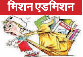
कार्यालय संवाददाता, बरेली

अमृत विचार : जिले के सरकारी और निजी स्कूलों में बच्चों की सुरक्षा को लेकर गंभीर सवाल परिजननों के मन में हैं लेकिन वह उनके भविष्य की चिंता में सब सवालों को दरकिनारा कर रहे हैं। सरकारी स्कूलों में बच्चों की सुरक्षा राम भरोसे है। वहीं निजी स्कूलों में भी बहुत ज्यादा गंभीरता दिखाई नहीं देती। कई स्कूलों में मानक