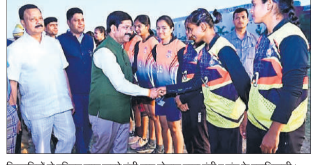
कार्यालय संवाददाता, बरेली