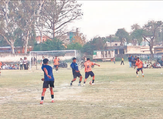
फुटबॉल मैच में खेलते खिलाड़ी।