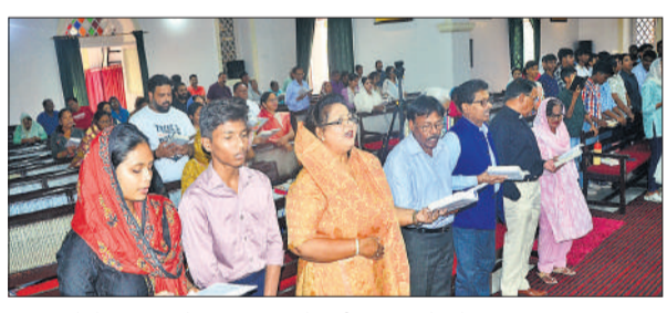
क्राइस्ट मेथोडिस्ट चर्च में आराधना करते मसीह समाज के लोग।