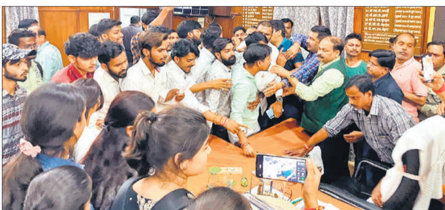
बरेली कॉलेज में प्राचार्य कक्ष में हंगामा करते एबीवीपी कार्यकर्ता। इस दौरान धक्का-मुक्की भी की गई।