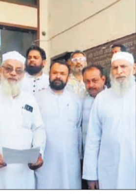
नगर आयुक्त से मिलने पहुंचे लोग।