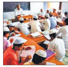
प्रदेश में करीब 25 हजार मदरसे 558 को मिलता है अनुदान