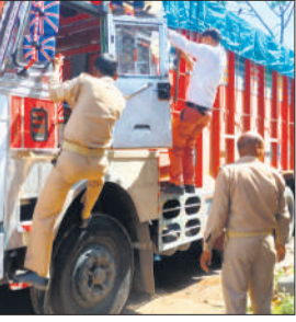
जांच करते मत्स्य विभाग के कर्मचारी।