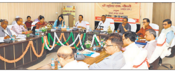
विकास भवन सभागार में मंडलीय समीक्षा बैठक करते कमिश्नर भूपेंद्र एस. चौधरी।

अमृत विचार: निजी अस्पतालों में आयुष्मान कार्डधारकों से इलाज के दौरान रुपये वसूलने की शिकायतें आने पर कमिश्नर भूपेंद्र एस. चौधरी ने सख्ती दिखाई। बुधवार दोपहर विकास भवन सभागार में मंडलीय समीक्षा बैठक में सभी डीएम और स्वास्थ्य अधिकारियों को निर्देश दिए कि आयुष्मान कार्डधारकों से पैसा वसूलने की शिकायत मिले तो संबंधित अस्पताल के विरुद्ध कार्रवाई कराएं। तत्काल पैसा वापस कराएं।