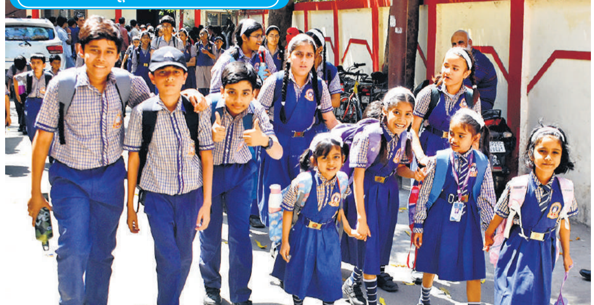
स्कूलों में बुधवार से नवीन शैक्षिक सत्र की शुरुआत हो गई। पहले दिन शहर के एक स्कूल के बाहर छात्र-छात्राएं उत्साहित नजर आए।