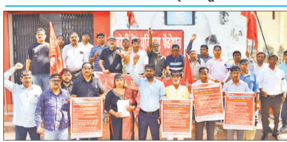
पटेल चौराहे पर यूनियन बैंक मुख्य शाखा पर प्रदर्शन करते फेडरेशन के पदाधिकारी।

अमृत विचार : केंद्रीय श्रमिक संगठनों के आह्वान पर बुधवार को बरेली में काला दिवस मनाया गया। बड़ी संख्या में कर्मचारियों ने काले फीते और बैज लगाकर तथा काले कपड़े पहनकर विरोध जताया। यूनियन बैंक की मुख्य शाखा के सामने दोपहर में बरेली ट्रेड यूनियंस फेडरेशन के बैनर तले प्रदर्शन सभा आयोजित की गई।