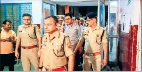
शॉप शूटर से मुठभेड़ की सूचना पर जिला अस्पताल पहुंचे एसएसपी।