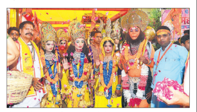
शोभायात्रा में शामिल झांकी का स्वागत करते लोग।

जगह-जगह श्रद्धालुओं और सामाजिक संगठनों ने पुष्पवर्षा कर शोभायात्रा का स्वागत किया और प्रसाद का वितरण किया। भक्ति और उत्साह का माहौल देखने को मिला। राम बरात, शिव परिवार,