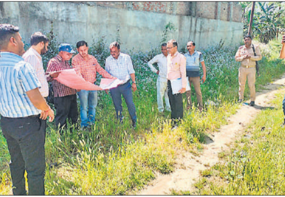
मौके पर नक्शे के अनुसार चर्चा करते एसडीएम और अन्य अफसर हैं। ● अमृत विचार

डीएम के निर्देश के बाद एसडीएम ने विकास, राजस्व पंचायती राज अफसरों के साथ किया निरीक्षण