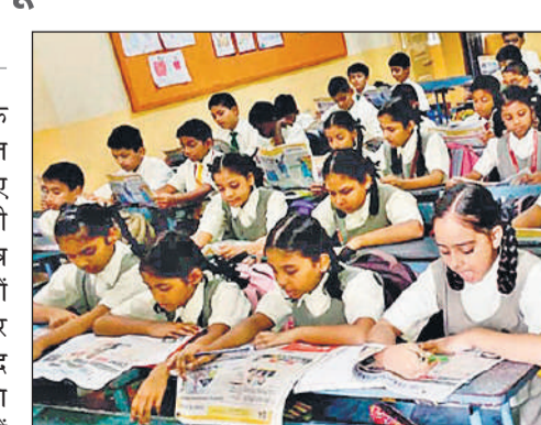
लखनऊ के एक स्कूल में अखबार पढ़ते विद्यार्थी।

अमृत विचार: समसामयिक घटनाओं की जानकारी से अवगत होने और शब्दज्ञान बढ़ाने के लिए विद्यार्थियों ने नए सत्र में अपनी कक्षाओं का शुभारंभ समाचार पत्र पढ़कर किया। माध्यमिक विद्यालयों में नए सत्र का आरंभ बुधवार से कर दिया गया है। प्रार्थना सभा के बाद छात्र-छात्राओं ने समाचार पत्रों का वाचन किया। इसके लिए विद्यालयों में समाचार पत्रों की उपलब्धता और इसे विद्यार्थियों को उपलब्ध कराए जाने को लेकर दिशा-निर्देश जारी किया गया था। निर्देश के अनुसार, बच्चों की स्कूली