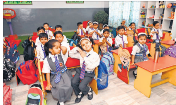
गिरीश प्रसाद मेमोरियल स्कूल में छुट्टी के बाद बच्चों के आते बच्चे।

हुए उसे टीचर के हाथ में सौंप दिया। इसी बीच स्कूल की घंटी बजी और धीरे-धीरे बच्चे अंदर जाने लगे। कुछ बच्चे पीछे मुड़कर बार-बार अपने