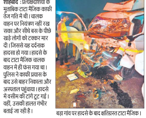
बड़ा गांव पर हादसे के बाद क्षतिग्रस्त टाटा मैजिक।