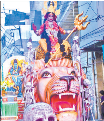
शोभायात्रा में भगवान के रूप में सजे कलाकार।