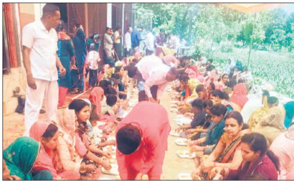
भंडारे का प्रसाद ग्रहण करते श्रद्धालु।