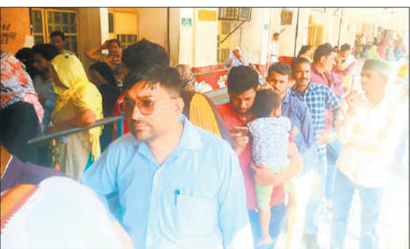
ओपीडी का पर्चा बनवाने के लिए लाइन में लगे मरीज।

इस अवधि में करीब 15103 लोगों ने अस्पताल में एंटी रेबीज वैक्सिन लगावाई, जिनमें से करीब 300 से अधिक गंभीर रूप से घायल लोगों को एंटी रेबीज सीरम (एआरएस) दिया गया। रिपोर्ट के अनुसार, लगभग 6520 लोगों ने