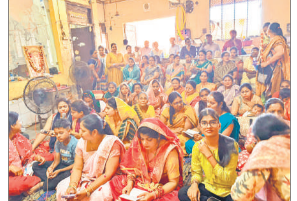
चंदौसी में हनुमान जयंती कार्यक्रम में शामिल महिलाएं