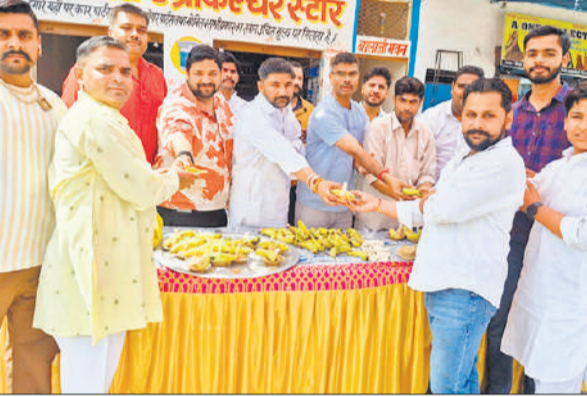
असमोली में हनुमान जयंती पर प्रसाद वितरण करते लोग।