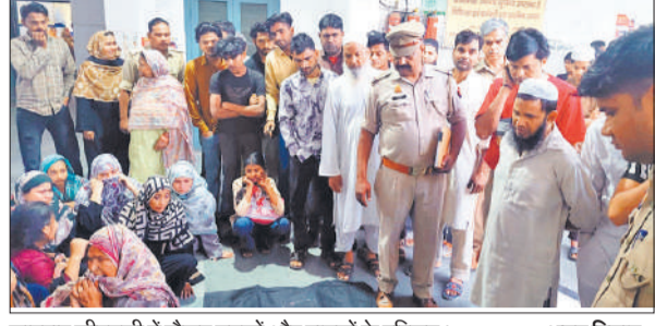
शाहबाद सीएचसी में मौजूद मृतकों और घायलों के परिजन।

शाहबाद में बिलारी रोड पर बड़ा गांव के पास हुआ हादसा, दो लोगों की चली गई जान