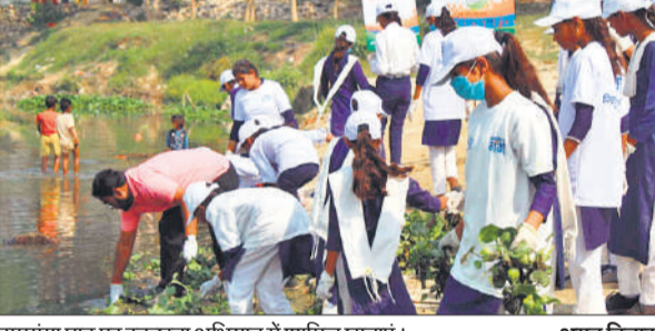
रामगंगा घाट पर स्वच्छता अभियान में शामिल छात्राएं।