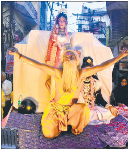
शोभायात्रा में लीला मंचन करते कलाकार।