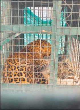
पिंजरे में कैद तेंदुआ।