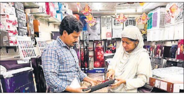
दुकान पर इंक्वशन चूल्हा खरीदती महिला।

कच्चे माल की बड़ी कीमतों का बाजार में दिखने लगा असर, खरीदार परेशान