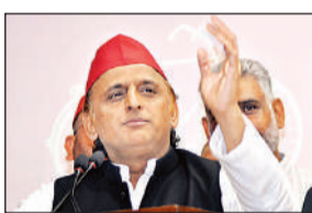
सपा प्रमुख अखिलेश यादव।

अधिकारियों को हटया गया, जबकि उत्तर प्रदेश में 2022 के चुनाव के दौरान ऐसा नहीं हुआ। उन्होंने आरोप लगाया कि यूपी के उपचुनाव में जिन अधिकारियों ने गड़बड़ी की थी, उनके खिलाफ अब तक कोई कार्रवाई नहीं हुई। अखिलेश यादव ने कहा कि बंगाल