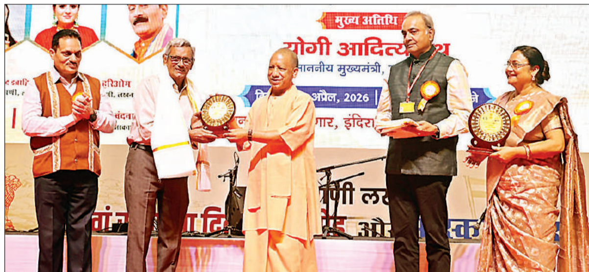
आकाशवाणी लखनऊ के 89वें स्थापना दिवस पर पद्म पुरस्कार से सम्मानित विभूतियों और वरिष्ठ लोकसेवा प्रसारकों को सम्मानित करते मुख्यमंत्री योगी।

मुख्यमंत्री योगी आदित्यनाथ ने कहा कि आकाशवाणी ने आजादी की लड़ाई और जनजागरण का अहम भूमिका निभाई। उन्होंने वंदे मातरम को लेकर कांग्रेस पर हमला बोलते हुए कहा कि आजादी की लड़ाई के इस मंत्र को लेकर 1924 में कांग्रेस के अधिवेशन में मो. अली जौहर ने विरोध किया। 13 साल बाद कांग्रेस ने वंदे मातरम के पहले दो छंद गाए जाने का निर्णय लिया। आकाशवाणी लखनऊ में 'वंदे मातरम' का 1938 से नियमित प्रसारण हो रहा है।