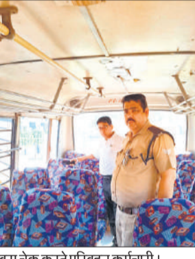
बस चेक करते परिवहन कर्मचारी।

अमृत विचार : स्कूली बच्चों की सुरक्षा को सर्वोच्च प्राथमिकता देते हुए एआरटीओ ने अभियान चलाकर 63 स्कूली बसों की जांच की। कमियां पाए जाने पर 9 बस संचालकों को नोटिस भेजा है जबकि, एक बस का संचालन तत्काल प्रभाव से बंद कर दिया है। अभियान स्कूली वाहनों में सुरक्षा मानकों के अनुपालन को सुनिश्चित करने तथा किसी भी प्रकार की लापरवाही पर प्रभावी कार्रवाई करने के उद्देश्य से संचालित किया जा रहा है।