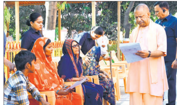
गोरखनाथ मंदिर में लोगों से मुलाकात कर समस्याएं सुनते मुख्यमंत्री योगी।