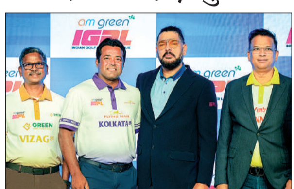
यूएफोई में फ्रेंचाइजी लाइन-अप के अनावरण के दौरान इंडियन गोल्फ प्रीमियर लीग के को-फाउंडर और ब्रांड एंबेसडर युवराज सिंह (दाएं से दूसरे), पूर्व टेनिस खिलाड़ी और फ्रेंचाइजी के मालिक लिंडर पेंस (बाएं से दूसरे)।

युवराज ने आईजीपीएल की 10 फ्रेंचाइजी के अनावरण के मौके पर कहा क्रिकेट को क्रिकेट के साथ-साथ गोल्फ भी खेलना चाहिए। मुझे भी पहले गोल्फ खेलना चाहिए था, जिससे मुझे क्रिकेट में मदद मिलती। गोल्फ वास्तव में आपको तनाव से मुक्ति दिलाता है। आईजीपीएल का कार्यक्रम अभी तय होना बाकी है। उन्होंने कहा ज्यादातर विदेशी क्रिकेटर, खासकर ऑस्ट्रेलिया, न्यूजीलैंड, इंग्लैंड और दक्षिण अफ्रीका के खिलाड़ी बचपन से ही गोल्फ खेलते हैं। युवराज ने कहा