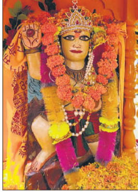
शोभायात्रा में हनुमान जी की झांकी।

दुर्गा कॉलोनी, बरेली सराय, शिव मंदिर और शिवाजी चौक सहित विभिन्न मार्गों से होते हुए पुनः