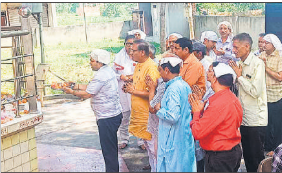
हनुमान जी की आरती उतरते श्रद्धालु।