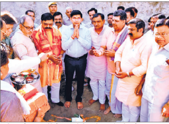
51 फिट ऊंची हनुमान मूर्ति की स्थापना के लिए भूमि पूजन में शामिल डीएम व अन्य।