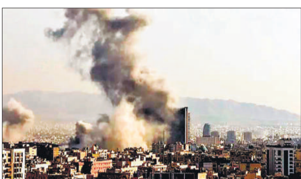
इजराइल के तेल अवीव में ईरान की मिसाइल गिरने के बाद उठता धुआं।