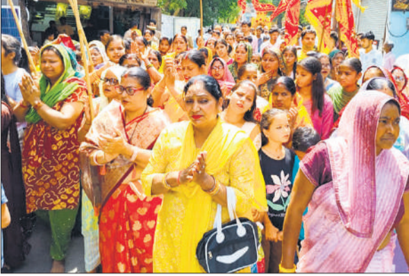
संभल में शोभायात्रा में शामिल महिला श्रद्धालु।

भगवान श्री बालाजी महाराज के जन्मोत्सव पर श्रद्धालुओं ने तिलक लगाकर भेंट अर्पित की। इसके बाद विश्व शांति के लिए यज्ञ का आयोजन किया। जिसमें 5151 आहुतियां देकर भक्तों ने अपनी मनोकामनाएं पूर्ण होने की प्रार्थना की। पूर्णाहुति के बाद महाआरती संपन्न हुई और भगवान को छप्पन भोग अर्पित किये। इसके उपरांत मंदिर से भव्य नगर शोभायात्रा