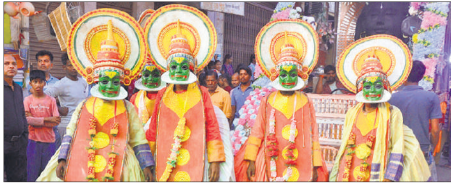
शोभा यात्रा में उपस्थित नटराज की झांकी।