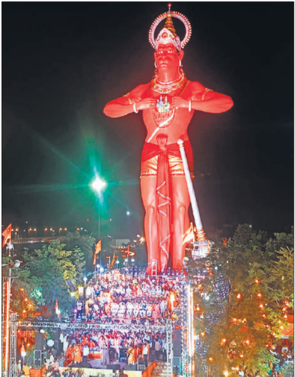
जन्मोत्सव पर सजा हनुमतधाम व बड़ी संख्या में मौजूद भक्त।

तिलहर, अमृत विचार: हनुमान जन्मोत्सव के अवसर पर क्षेत्र में धार्मिक उत्साह का माहौल रहा और काव्यानी खेड़ा हनुमान धाम सहित विभिन्न मंदिरों में विशेष पूजा-अर्चना के कार्यक्रम आयोजित किए गए। गुरुवार को नेशनल हाईवे स्थित काव्यानी खेड़ा धाम पर हजारों श्रद्धालुओं की भीड़ उमड़ी, जहां भक्तों ने बजरंगबली को भोग लगाकर अपनी मनोकामनाएं मांगीं। मंदिरों में दिनभर श्रद्धालुओं का आवागमन बना रहा और भक्ति का माहौल छाया रहा। नगर के वंशी वाले मंदिर पर 151 किलो बूंदी के लड्डुओं का भोग लगाया गया और शाम से भक्तों के लिए भंडारे का आयोजन किया गया। काव्यानी खेड़ा हनुमान मंदिर के पास 21 कुडीय महायज्ञ का आयोजन किया गया, जिसके पहले क्षेत्र में भक्तों ने पैदल अर दैवदर ट्रौली से शोभायात्रा निकाली।