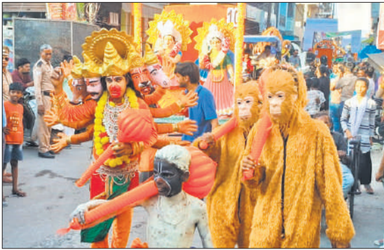
शोभा यात्रा में शामिल बंदर का भेष लिए कलाकार।

निकट बरेली कॉलेज, होटल मोती महल काली बाड़ी चौराहा, बरेली 9837069463 7599211076