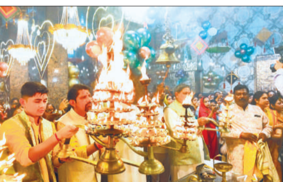
बालाजी की आरती उतारते श्रद्धालु।