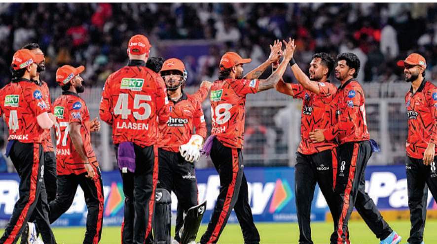
जीत दर्ज करने के बाद जश्न मनाते सनराइजर्स हैदराबाद के खिलाड़ी।

सनराइजर्स ने आठ विकेट पर 226 रन बनाने के बाद जयदेव उनादकट (21 रन पर तीन विकेट), इशान मलिंगा (14 रन पर दो विकेट) और 'प्लेयर ऑफ द मैच' रेड्डी (17 रन पर दो विकेट) की शानदार गेंदबाजी से केकेआर की पारी को 16 ओवर में 161 रन पर समेट दिया। केकेआर की यह दो मैचों में दूसरी हार है। केकेआर के लिए अंगकृष्ण रघुवंशी ने 29 गेंदों में 52 रन बनाए, जबकि रिकू सिंह ने 25 गेंदों में 35 रन का योगदान दिया। फिन ऐलन ने सात गेंदों में 28 रन बनाए, लेकिन उनकी तेज पारी का फायदा उठाने में टीम नाकाम रही। क्लासेन ने 35 गेंदों में 52 रन बनाए के अलावा रेड्डी (24 गेंदों में 39 रन) के साथ पांचवें विकेट के लिए 53 गेंदों में 82 रन की साझेदारी कर पारी को संवारा। इससे पहले ट्रेविस हेड ने 21 गेंदों पर 46 रन की विस्फोटक पारी खेलकर लय में वापसी की, जबकि अभिषेक शर्मा ने 21 गेंदों में 48 रन ठोके। दोनों ने