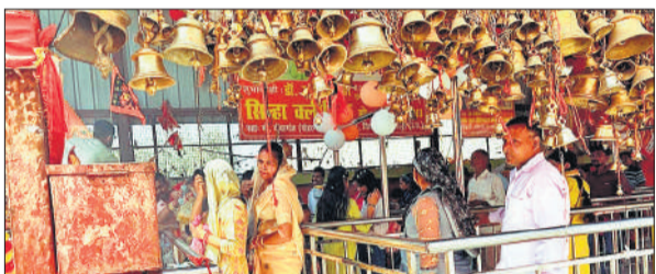
काव्यानी खेड़ा हनुमान धाम पर पूजा-अर्चना और प्रसाद वितरण करते श्रद्धालु।