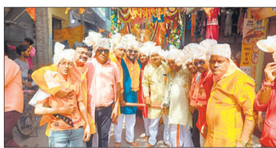
भगवान हनुमान के रथ को खींचते श्रद्धालु।