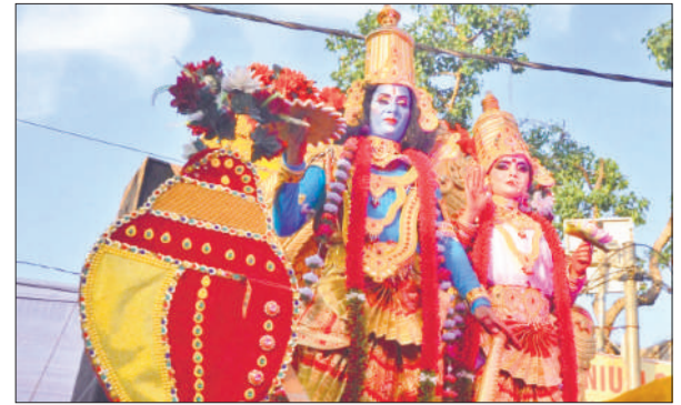
शोभा यात्रा में शामिल भगवान विष्णु और मां लक्ष्मी की झांकी।