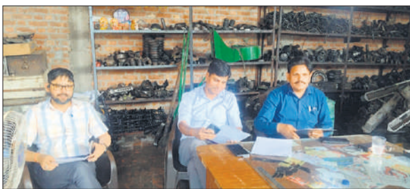
कबाड़ प्रतिष्ठान पर दस्तावेजों की जांच करते जीएसटी अधिकारी।