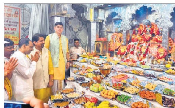
बालाजी धाम में लगा छप्पन का भोग।