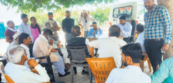
खमरिया क्षेत्र में जमीन अधिग्रहण को लेकर किसानों के साथ बैठक करते एसडीएम।