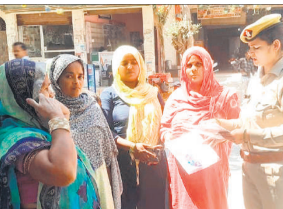
महिलाओं को जागरूक करती महिला पुलिस।

इस दौरान सरकार द्वारा संचालित विभिन्न जनकल्याणकारी योजनाओं जैसे विधवा पेंशन योजना, वृद्धावस्था पेंशन योजना, सुकन्या समृद्धि योजना, प्रधानमंत्री आवास योजना, उज्वला योजना, मुख्यमंत्री सामूहिक विवाह योजना, राष्ट्रीय पारिवारिक लाभ योजना, प्रधानमंत्री जन आरोग्य योजना एवं नशा मुक्ति भारत अभियान के बारे में भी अवगत कराया गया। साथ ही, बालिकाओं को उनकी सुरक्षा