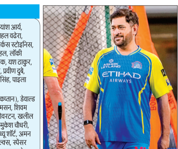
अभ्यास सत्र के दौरान चेन्नई सुपर किंग्स के एमएस धोनी।

कप्तान रुतुराज गायकवाड़ को काफी फायदा मिलेगा। संजु सैमसन सीएसके के लिए अपने पहले मैच में खास प्रभाव नहीं छोड़ पाए थे और वह इसकी भरपाई करने के लिए बेताब होंगे। सीएसके को राजस्थान रॉयल्स के खिलाफ मैच में डेवाल्ड ब्रेविस की सेवाएं नहीं मिल पाई थी और अभी यह स्पष्ट नहीं है कि वह साइड स्ट्रेट से पूरी तरह उबर चुके हैं या नहीं। शीर्ष क्रम के बल्लेबाजों के