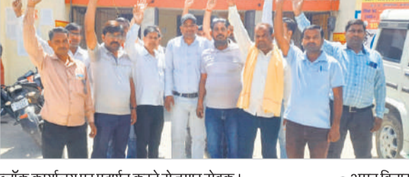
लॉक कार्यालय पर प्रदर्शन करते रोजगार सेवक।