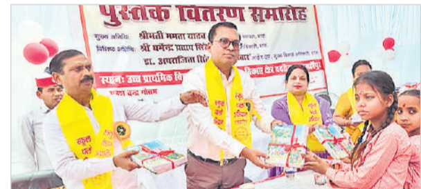
होनहार बच्चों को पुरस्कृत कर पुस्तकें वितरित करते जिलाध्यक्ष व जिलाधिकारी।