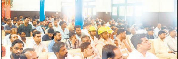
सामने बैठे लाइनमैन और अवर अभियंता

द्रांसफार्मर जल जाते हैं। लाइन के तार टूटते हैं। स्पाकिंग होने पर लाइट गुल हो जाती है, इससे उपभोक्ता उزعित होते हैं। ऐसी स्थिति में अवर अभियंताओं व लाइनमैन कर्मियों को धैर्य से काम लेना है। तत्परता