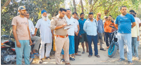
सूचना पर पहुंचे ग्रामीण व वन विभाग की टीम।