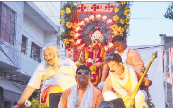
शोभा यात्रा में शामिल भगवान हनुमान की झांकी।

इनके अलावा राम दरबार, मां दुर्गा, खाटू श्याम के साथ केदारनाथ बाबा की झांकी आकर्षण का केंद्र रहीं। कई स्वचालित झांकियों भी शोभा यात्रा में शामिल रहीं। शोभा यात्रा के साथ चल रहे श्रद्धालुओं और समिति के कार्यकर्ताओं व पदाधिकारियों की ओर से जय श्री राम और जय बजरंगबली