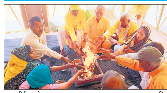
भजन कीर्तन करते श्रद्धालु।