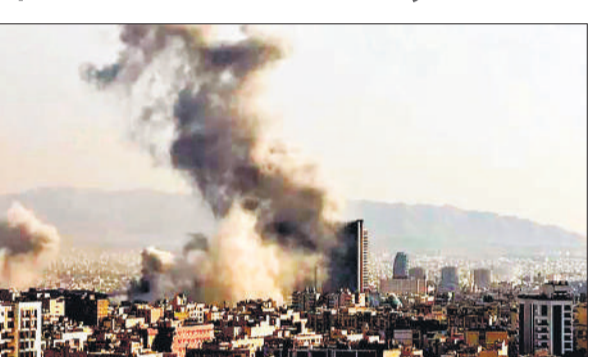
इजराइल के तेल अवीव में ईरान की मिसाइल गिरने के बाद उठता धुआं।