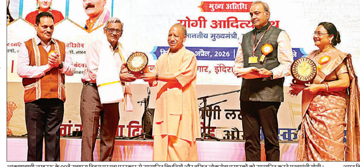
आकाशवाणी लखनऊ के 89वें स्थापना दिवस पर पद्म पुरस्कार से सम्मानित विभूतियों और वरिष्ठ लोकसेवा प्रसारकों को सम्मानित करते मुख्यमंत्री योगी।

मुख्यमंत्री योगी आदित्यनाथ ने कहा कि आकाशवाणी ने आजादी की लड़ाई और जनजागरण का अहम भूमिका निभाई। उन्होंने वंदे मातरम को लेकर कांग्रेस पर हमला बोलते हुए कहा कि आजादी की लड़ाई के इस मंत्र को लेकर 1924 में कांग्रेस के अधिवेशन में मो. अली जौहर ने विरोध किया। 13 साल बाद कांग्रेस ने वंदे मातरम के पहले दो छंद गाए जाने का निर्णय लिया। आकाशवाणी लखनऊ में 'वंदे मातरम' का 1938 से नियमित प्रसारण हो रहा है।