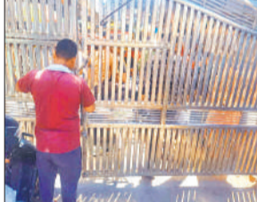
कार्यालय का मेन गेट बंद करता कर्मचारी।