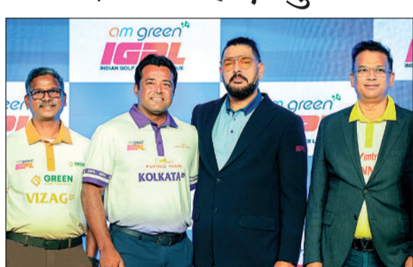
न्यूयॉर्क में फ्रेंचाइजी लाइन-अप के अनावरण के दौरान इंडियन गोल्फ प्रीमियर लीग के को-फाउंडर और ब्रांड एम्बेसडर युवराज सिंह (दाएं से दूसरे), पूर्व टेनिस खिलाड़ी और फ्रेंचाइजी के मालिक लिंडर पैस (बाएं से दूसरे)।

युवराज ने आईजीपीएल की 10 फ्रेंचाइजी के अनावरण के मौके पर कहा क्रिकेट को छोड़ने के साथ-साथ गोल्फ भी खेलना चाहिए। मुझे भी पहले गोल्फ खेलना चाहिए था, जिससे मुझे क्रिकेट में मदद मिलती। गोल्फ वास्तव में आपको तनाव से निपटने में मदद करता है। आईजीपीएल का कार्यक्रम अभी तय होना बाकी है। उन्होंने कहा ज्यादातर विदेशी क्रिकेटर, खासकर ऑस्ट्रेलिया, न्यूजीलैंड, इंग्लैंड और दक्षिण अफ्रीका के खिलाड़ी बचपन से ही गोल्फ खेलते हैं। युवराज ने कहा