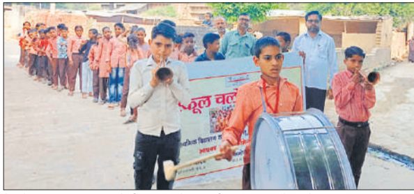
बैंड के साथ जगमरुकता रैली निकालते परिषदीय विद्यालय के बच्चे।