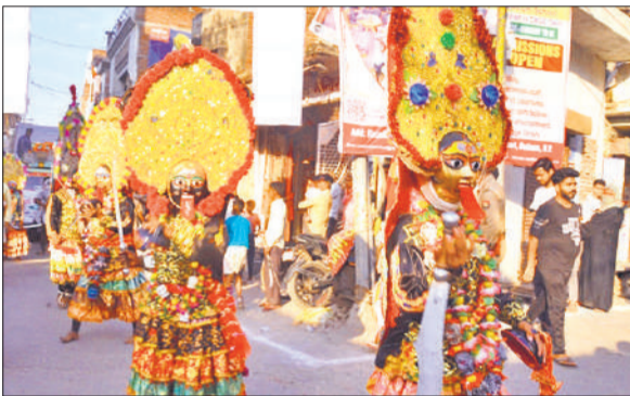
शोभा यात्रा में शामिल काली का अखाड़ा।