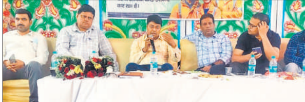
विद्युत सुधार प्रशिक्षण में मंच पर मौजूद अधिकारी

अमृत विचार : विद्युत विभाग ने गुरुवार को एक होटल में अपने अधिकारियों-कर्मचारियों को प्रशिक्षण दिया। प्रशिक्षण में बताया गया कि गर्मी में ट्रिपिंग और अघोषित विद्युत कटौती को रोकने के लिए किस तरह काम करें और ग्रामीणों को शांत करें। गर्मी में विद्युत आपूर्ति समय सारिणी के अनुसार देने को लेकर भी प्रशिक्षण दिया गया। विद्युत विभाग को गर्मियों में अघोषित बिजली कटौती रोकने और ट्रिपिंग पर रोक लगाने के निर्देश दिए गए हैं। इन निर्देशों के अनुपालन में मध्यमचल विद्युत वितरण निगम ने गुरुवार को सभी अवर अभियंताओं और लाइनमैन कर्मियों सहित विभाग के सभी अधिकारियों का एक विद्युत सुरक्षा प्रशिक्षण कार्यक्रम शहर के