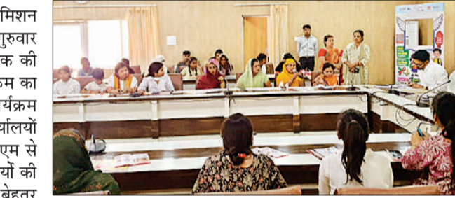
कलेक्ट्रेट में डीएम से संवाद करती महिलाएं।