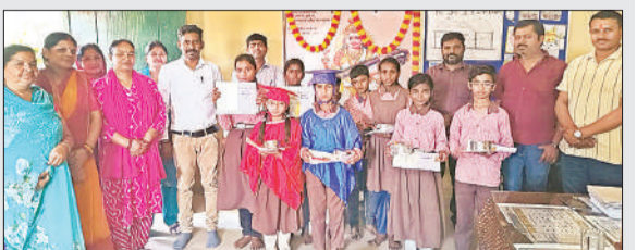
पुरस्कार के साथ बच्चे।