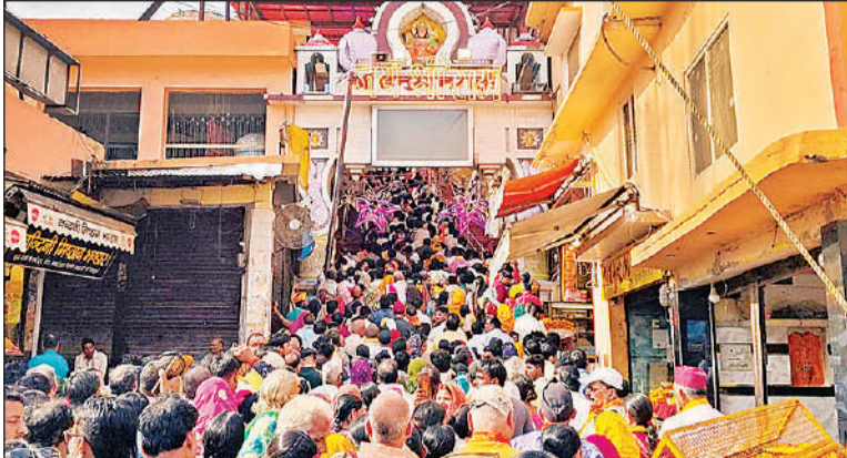
हनुमानगढ़ी पर दर्शन पूजन के लिए लगी भीड़।