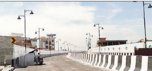
हलकारा का पुरवा के पास बना फ्लाईओवर।

अमृत विचार : अयोध्या में राम भक्तों और श्रद्धालुओं की सुविधा को ध्यान में रखते हुए एक और महत्वपूर्ण विकास कार्य पूरा कर लिया गया है। उग्र राज्य सेतु निगम लिमिटेड द्वारा 14 कोसी परिक्रमा मार्ग पर हलकारा का पुरवा रेलवे स्टेशन संख्या-108 एसी के पास 181.03 करोड़ रुपये की लागत से दो लेन रेल उपरगामी सेतु (फ्लाईओवर) का निर्माण कार्य पूरा हो गया है। यह फ्लाईओवर 982 मीटर लंबा है। इसके निर्माण से परिक्रमा मार्ग पर आवागमन अधिक सुगम हो जाएगा। फ्लाईओवर की दो लेन को एक हफ्ते में यातायात के लिए