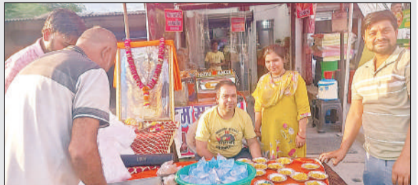
प्रसाद वितरित करते श्रद्धालु।

हनुमान जन्मोत्सव पर, हौआ प्रसाद का वितरण