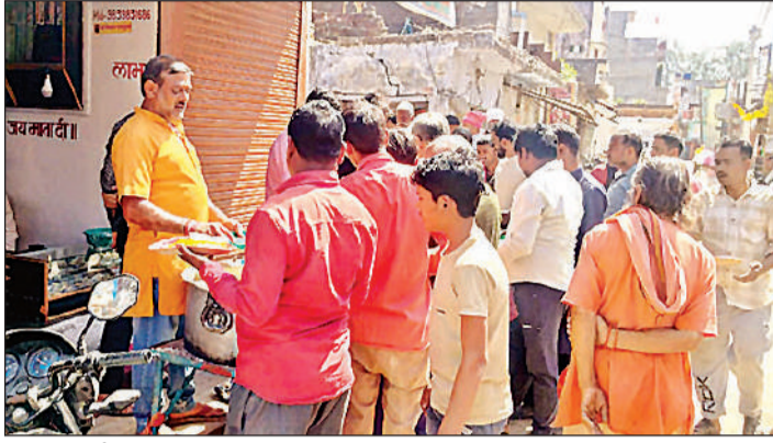
हनुमान जयंती पर किया गया प्रसाद का वितरण। अमृत विचार