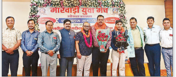
शपथ ग्रहण के दौरान उपस्थित पदाधिकारी।