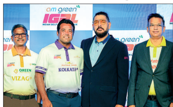
यूयॉर्क में फ्रेंचाइजी लाइन-अप के अनावरण के दौरान इंडियन गोल्फ प्रीमियर लीग के को-फाउंडर और ब्रांड एंबेसडर युवराज सिंह (दाएं से दूसरे), पूर्व टेनिस खिलाड़ी और फ्रेंचाइजी के मालिक लिंडर पेस (बाएं से दूसरे)।

युवराज ने आईजीपीएल की 10 फ्रेंचाइजी के अनावरण के मौके पर कहा क्रिकेट को क्रिकेट के साथ-साथ गोल्फ भी खेलना चाहिए। मुझे भी पहले गोल्फ खेलना चाहिए था, जिससे मुझे क्रिकेट में मदद मिलती। गोल्फ वास्तव में आपको तनाव से मुक्ति दिलाता है। आईजीपीएल का कार्यक्रम अभी तय होना बाकी है। उन्होंने कहा ज्यादातर विदेशी क्रिकेटर, खासकर ऑस्ट्रेलिया, न्यूजीलैंड, इंग्लैंड और दक्षिण अफ्रीका के खिलाड़ी बचपन से ही गोल्फ खेलते हैं। युवराज ने कहा