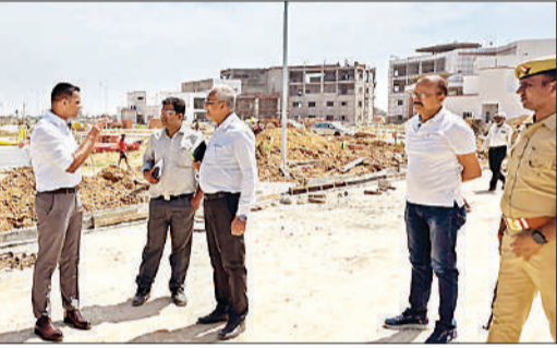
निर्माणाधीन मां पाटेश्वरी विश्वविद्यालय का निरीक्षण करते डीएम।

जिलाधिकारी ने विश्वविद्यालय परिसर में निर्माणाधीन एकेडमिक ब्लॉक, एडमिनिस्ट्रेटिव ब्लॉक एवं छात्रावास (हॉस्टल) का निरीक्षण कर संबंधित अधिकारियों से विस्तृत जानकारी प्राप्त की। उन्होंने स्पष्ट कहा कि यह परियोजना जनपद के शैक्षिक विकास के लिए अत्यंत महत्वपूर्ण है, इसलिए इसे शीघ्र प्राथमिकता देते हुए समयबद्ध ढंग से पूरा किया जाए। निरीक्षण के दौरान डीएम ने निर्माण कार्यों की गुणवत्ता पर विशेष ध्यान देने के निर्देश दिए और चेतावनी दी कि किसी भी स्तर पर लापरवाही बर्दाश्त नहीं की जाएगी।