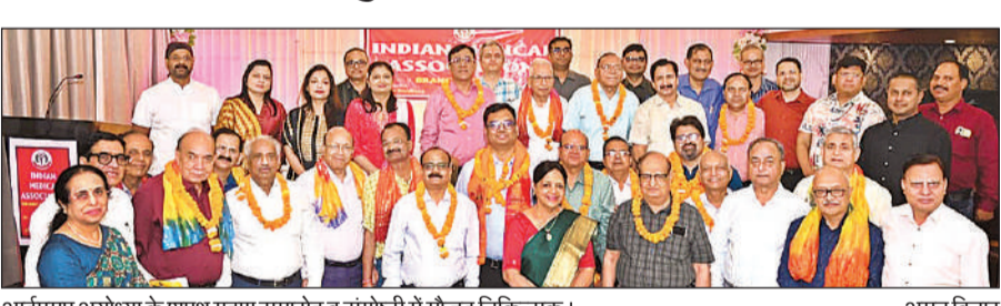
आईएमए अयोध्या के शाय्य ग्रहण समारोह व संगोष्ठी में मौजूद चिकित्सक।

मौका था सिनर्जी सुपर स्पेशियलिटी हॉस्पिटल एंड कैंसर इंस्टीट्यूट द्वारा इंडियन मेडिकल एसोसिएशन अयोध्या के सहयोग से आयोजित संगोष्ठी का। इस सीएमई का मुख्य विषय "व्यापक कैंसर देखभाल" था। जिसमें कैंसर उपचार की आधुनिक तकनीकों, विशेष रूप से एडवॉन्स