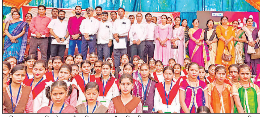
प्रशस्ति-पत्र व स्कूल किट के साथ मौजूद शिक्षक, छात्र और अधिकारी।