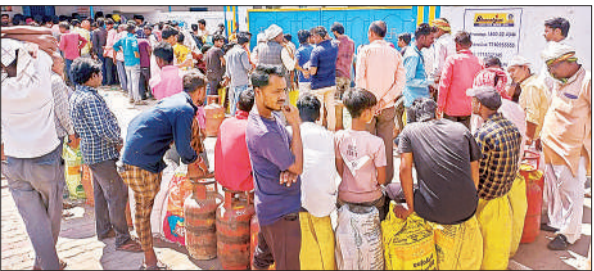
सिलेंडर के लिए इंतजार करते उपभोक्ता।