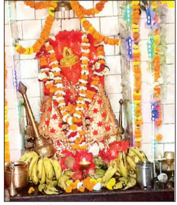
हनुमान जी की प्रतिमा। अमृत विचार