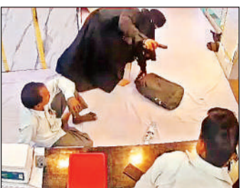
रुदौली के ज्वेलर्स की दुकान में तमंचे के बल पर लूटपाट करती नकारपोश महिला सीसीटीवी में कैद।