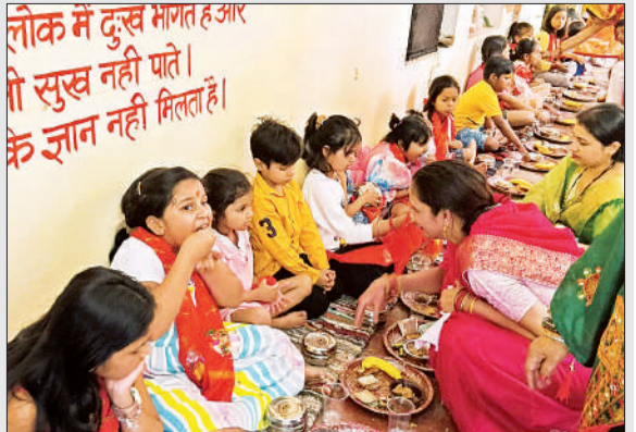
श्री हनुमान जन्मोत्सव पर कन्याओं को भोजन कराती श्रद्धालु।