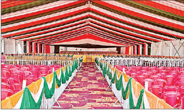
बलरामपुर महोत्सव के लिए सजाया गया आकर्षक पंडाल।

अमृत विचार : लगभग दो दशक के लंबे इंतजार के बाद जनपद का बहुप्रतीक्षित ‘बलरामपुर महोत्सव 2026’ आज 3 अप्रैल से बड़े परेड ग्राउंड में भव्य आगाज के साथ शुरू हो रहा है। तीन दिवसीय इस महोत्सव में सांस्कृतिक, साहित्यिक और बौद्धिक गतिविधियों की रंगांग छटा बिखरेगी, जिसमें जिले से लेकर राष्ट्रीय स्तर तक की नामचीन हस्तियां शिरकत करेंगी।