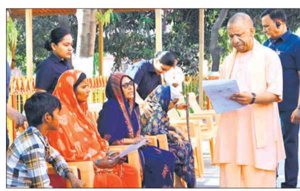
गोरखनाथ मंदिर में लोगों से मुलाकात कर समस्याएं सुनते मुख्यमंत्री योगी।

अमृत विचार : मुख्यमंत्री योगी आदित्यनाथ ने गुरुवार सुबह गोरखनाथ मंदिर में आयोजित जनता दर्शन में लोगों से मुलाकात कर उनकी समस्याएं सुनीं। इस दौरान उन्होंने जरूरतमंदों को आवास और गंधीर बीमारियों से पीड़ित लोगों को आर्थिक सहायता उपलब्ध कराने का भरोसा दिया। जनता दर्शन में करीब 100