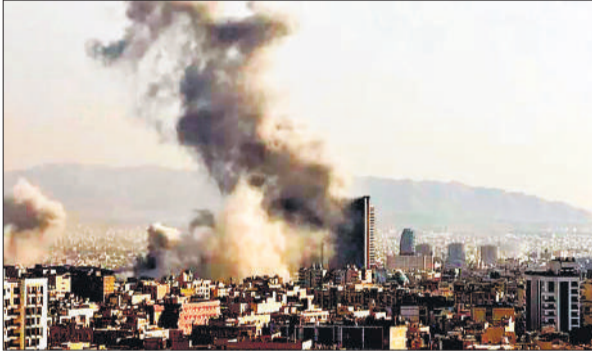
इजराइल के तेल अवीव में ईरान की मिसाइल गिरने के बाद उड़ता धुआं।

अमेरिका से लड़ने के लिए 70 लाख ईरानी तैयार