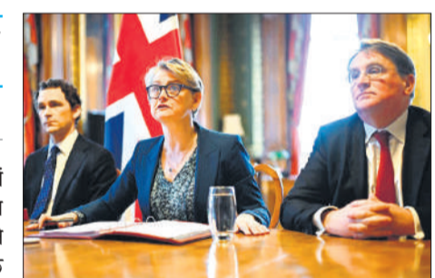
ब्रिटेन में होर्मुज खोलने के तरीकों पर चर्चा करते अधिकारी।

ईरान पर अमेरिका-इजराइल के हमलों के बाद बंद किए गए महत्वपूर्ण जहाज मार्ग होर्मुज जलडमरूमध्य को खुलवाने के लिए कूटनीतिक व राजनीतिक दबाव बनाने को लेकर गुरुवार को 35 से अधिक देशों की बैठक करेगी। ब्रिटेन ने भारत को बातचीत में शामिल का निमंत्रण भेजा है। भारत के विदेश मंत्रालय ने कहा कि बैठक में भारत शामिल होगा। इस बैठक में हिस्सा लेने वाले देशों में अमेरिका शामिल नहीं है। अमेरिकी राष्ट्रपति ट्रंप के यह स्पष्ट करने के बाद यह बैठक होगी कि