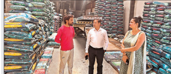
एक औद्योगिक इकाई का निरीक्षण करती टीम।