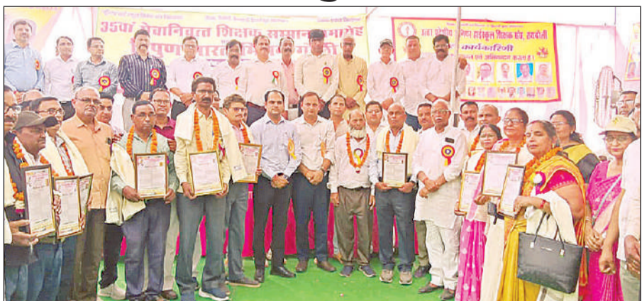
स्काउट भवन परिसर में आयोजित समारोह में सम्मानित किए गए सेवानिवृत्त शिक्षक।