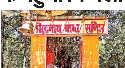
सिद्धनाथ मंदिर का मुख्य द्वार।