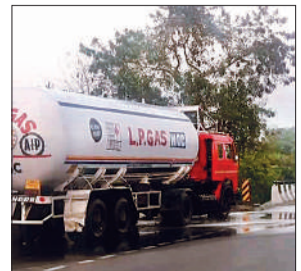
गैस शिफ्टिंग के बाद खड़ा खाली टैंकर।