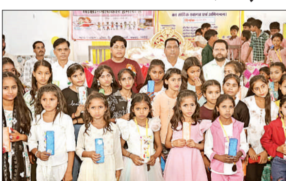
अतिथियों के साथ सम्मानित बच्चे।

उन्होंने हर वर्ग के अभिभावकों से मौलिक अधिकार के तरह स्कूल में दाखिला कराने के अपील की। वही कार्यक्रम के विशिष्ट अतिथि आदर्श