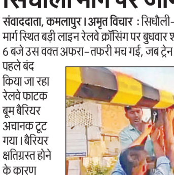
टूटे रेलवे बैरियर को दुरुस्त करते रेलकर्मी।

संवाददाता, कमलापुर। अमृत विचार : सिधौली-महमूदाबाद मार्ग स्थित बड़ी लाइन रेलवे क्रॉसिंग पर बुधवार शाम करीब 6 बजे उस वक्त अफरा-तफरी मच गई, जब ट्रेन आने से पहले बंद किया जा रहा रेलवे फाटक बूम बैरियर अचानक टूट गया। बैरियर क्षतिग्रस्त होने के कारण क्रॉसिंग के दोनों ओर वाहनों के पहिए थम गए और देखते ही देखते भीषण जाम लग गया। व्यस्त मार्ग होने के कारण सड़क पर वाहनों की लंबी कतारें लग गईं, जिससे राहगीरों और वाहन चालकों को भारी परेशानी झेलनी पड़ी। घटना की सूचना मिलते ही रेलवे विभाग के तकनीकी कर्मचारी मौके पर पहुंचे और युद्धस्तर पर मरम्मत कार्य शुरू किया।