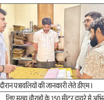
निरीक्षण के दौरान पत्रावलियों की जानकारी लेते डीएम।

कार्यालय संवाददाता सीतापुर। अमृत विचार : जिलाधिकारी डॉ. राजागणपति आर. ने कलेक्ट्रेट में निकाय विकास कार्यों की समीक्षा की। इस दौरान कार्यों में लापरवाही और वित्तीय वर्ष 2023-24 का भुगतान लंबित होने पर उन्होंने कड़ा रुख अपनाते हुए तंबौर नगर पंचायत के अधिशासी अधिकारी व जेई का वेतन रोकने के निर्देश दिए। साथ ही वाटर कूलर स्थापना कार्य अपूर्ण मिलने पर संबंधित कार्यदायी संस्था को ब्लैकलिस्ट करने को कहा। डीएम ने कड़े निर्देश दिए कि सभी निर्माण कार्य गुणवत्ता के साथ समय पर पूरे किए जाएं। उन्होंने शहर को अतिक्रमण मुक्त करने के