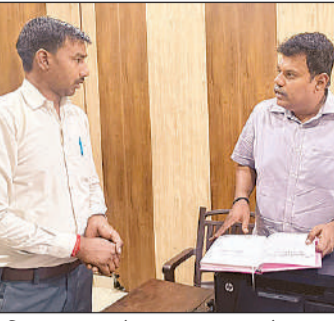
रजिस्टर का अवलोकन कर सवाल करते जिलाधिकारी डॉ. राजागणपति आर.।

डीएम ने समाज कल्याण पटल पर पेंशनरों की रिपोर्ट अद्यतन न होने पर बीडीओ को हर चौथे रविवार को कैप लगाने के निर्देश दिए। लेखाकार कक्ष में ग्रांट रजिस्ट्रों में कमियां मिलने और जेई