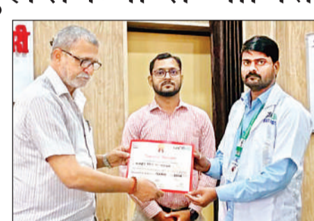
कर्मियों को प्रशस्ति पत्र देते सीएमओ।