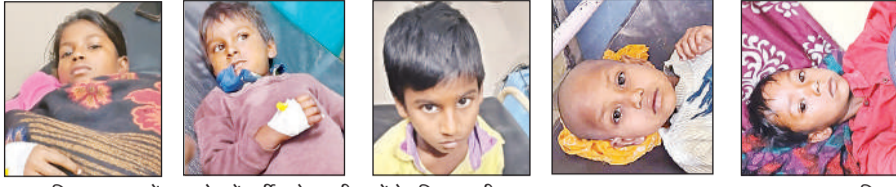
सामुदायिक स्वास्थ्य केंद्र सलोन में भर्ती बच्चों। सभी बच्चों ने दूषित मट्टा पीया था।