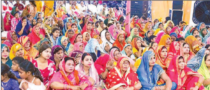
श्रीमद्भागवत कथा सुनते श्रद्धालु।