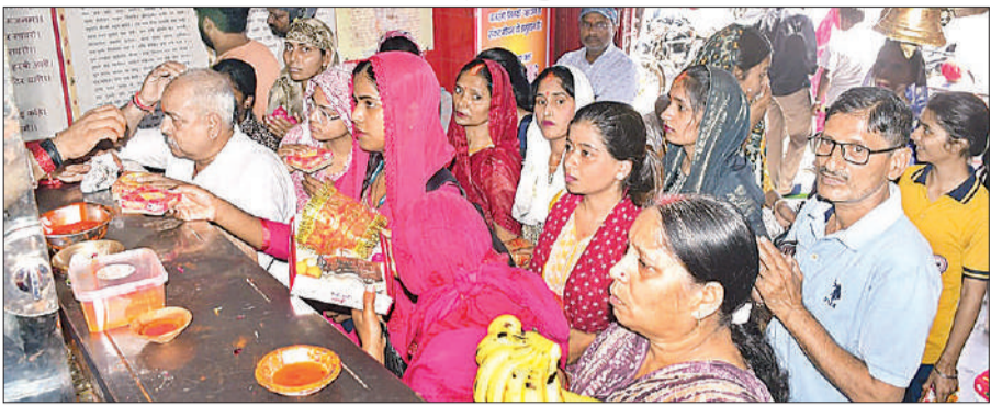
धनोखर स्थित हनुमान मंदिर में दर्शन-पूजन करने के लिए लगी श्रद्धालुओं की भीड़।