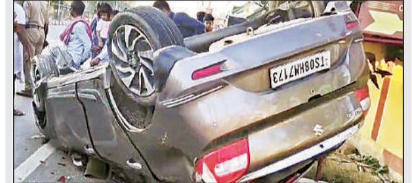
दुर्घटनास्थल पर पलटी पड़ी कार।