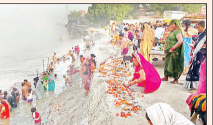
पूर्णमासी पर गंगा स्नान करते श्रद्धालु।

शुक्लागंज, उन्नाव: चैत्र पूर्णमासी पर सुबह से ही श्रद्धालुओं की गंगातटों पर भीड़ देखने को मिली। जहां श्रद्धालुओं ने गंगा में आस्था की डुबकी लगाई। इसके साथ तट पर भगवान सत्यनारायण की कथा का भी श्रवण किया। वहीं तट पर लगी दुकानों पर जमकर खरीददारी भी की। चैत्र पूर्णमासी होने से गुरुवार सुबह से सैकड़ों श्रद्धालुओं ने गंगा में स्नान किया और नगर के सभी घाटों पर खासी भीड़ देखी गई। कुछ श्रद्धालुओं ने गंगातट पर बैठे पंडों को दान दक्षिणा देने के साथ सत्य नारायण की कथा भी सुनी। स्नान के बाद श्रद्धालुओं ने गंगातट पर लगी दुकानों से खरीददारी की। गंगा तट पर सुबह से दोपहर तक श्रद्धालु स्नान करते रहे। आचार्यों ने कहा कि चैत्र पूर्णमा पर हनुमान जी का जन्म हुआ था। इसलिए इसका विशेष महत्व है। धार्मिक मान्यता है कि इस दिन भगवान श्री हनुमान प्रभु श्री राम के सहयोग के लिए धरती पर जन्मे थे। यह भी मान्यता है कि इस दिन भगवान विष्णु व माता लक्ष्मी की पूजा करने से हनुमान जी की कृपा प्राप्त होती है। अगर आप इस दिन चैत्र पूर्णमा का व्रत रख रहे हैं तो इस पौराणिक कथा का ध्यान करना शुभ होता है।