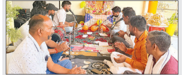
परशुराम भवन में सुंदरकांड का पाठ करते भक्त।