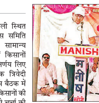
कार्यक्रम को संबोधित करते समिति के अध्यक्ष।