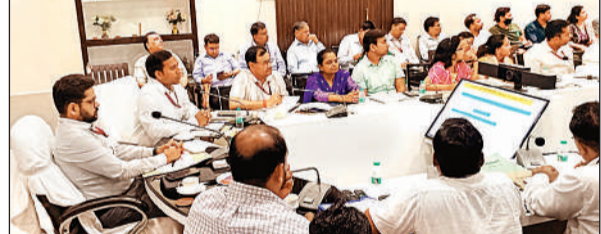
बैठक को संबोधित करते जिलाधिकारी गौरांग राठी।

अमृत विचार: जिलाधिकारी गौरांग राठी ने बैठक में कहा कि भारत की जनगणना 2027 दो चरणों में होगी। प्रथम चरण में मकान सूचीकरण व मकानों की गणना 22 मई से 20 जून 2026 तक, स्वगणना 7 मई से 21 मई 2026 तक होगी। द्वितीय चरण की जनगणना 9 से 28 फरवरी 2027 तक होगी। डीएम ने कहा कि जनगणना संबंधित सभी तैयारियों को समय से कर लिया जाए। कहा कि स्व जनगणना के तहत कोई भी सामान्य निवासी पोर्टल के माध्यम से गणना प्रश्नावली भर सकता है। इसी प्रकार स्व गणना हेतु सामान्य निवासी जिस स्थान/मकान के लिए गणना