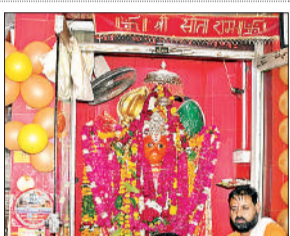
हनुमानजी की मूर्ति की सजावट की गयी।

स्थित बालाजी हनुमान मंदिर में विशेष पूजन और भजन का आयोजन किया गया। श्रद्धालु ढोल-मंजीरे की थाप और भजनों दुनिया न चले हनुमान के बिना, राम जी चले न हनुमान के बिना पर झूमते हुए नाचे और पूरे शहर में जन्मोत्सव की धूम रही।