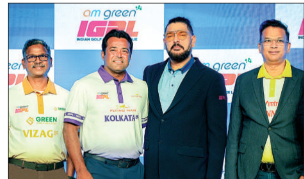
यूएफके में फ्रेंचाइजी लाइन-अप के अनावरण के दौरान इंडियन गोल्फ प्रीमियर लीग के को-फाउंडर और ब्रांड एम्बेसडर युवराज सिंह (दाएं से दूसरे), पूर्व टेनिस खिलाड़ी और फ्रेंचाइजी के मालिक लिंडर पेंस (बाएं से दूसरे)।

विश्व कप विजेता पूर्व भारतीय हरफनमौला युवराज सिंह ने बृहस्पतिवार को कहा कि क्रिकेट को अपने मुख्य पेशे के तनाव से निपटने के लिए कम उम्र से ही गोल्फ खेलना शुरू कर देना चाहिए। युवराज क्रिकेट को अलविदा कहने के बाद शौकिया तौर पर गोल्फ खेलते हैं। उन्हें दूसरे 'इंडियन गोल्फ प्रीमियर लीग (आईजीपीएल)' का ब्रांड दूत बनाया गया है। युवराज ने आईजीपीएल की 10 फ्रेंचाइजी के अनावरण के मौके पर कहा क्रिकेट को क्रिकेट के साथ-साथ गोल्फ भी खेलना चाहिए। मुझे भी पहले गोल्फ खेलना चाहिए था, जिससे मुझे क्रिकेट में मदद मिलती। गोल्फ वास्तव में आपको तनाव से मुक्ति दिलाता है। आईजीपीएल का कार्यक्रम अभी तय होना बाकी है। उन्होंने कहा ज्यादातर विदेशी क्रिकेटर, खासकर ऑस्ट्रेलिया, न्यूजीलैंड, इंग्लैंड और दक्षिण अफ्रीका के खिलाड़ी बचपन से ही गोल्फ खेलते हैं। युवराज ने कहा