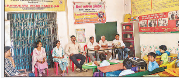
कार्यक्रम में मौजूद प्रबंधक व अन्य।