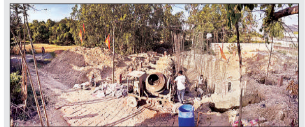
बछरावाँ कस्बे में कराया जा रहा श्रीराम मंदिर का निर्माण।