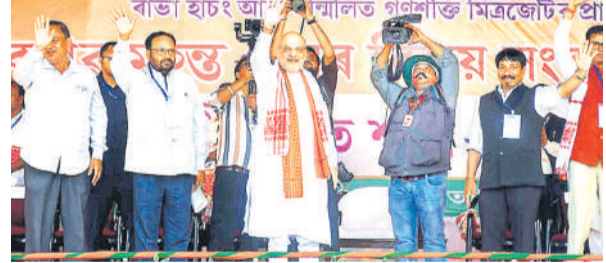
असम के कालियाबोर में जनसभा में स्थानीय प्रत्याशियों के साथ गृहमंत्री अमित शाह।