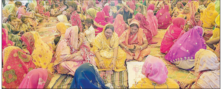
हनुमान जन्मोत्सव पर दुखदुरैया में शामिल सुहागिनें।