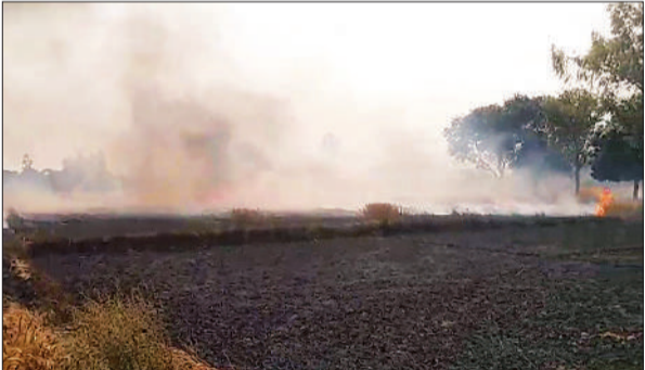
आग लगने के कारण नष्ट हुई गेहूं की फसल।