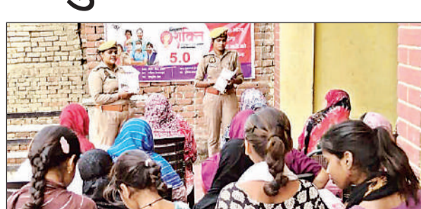
महिलाओं व बालिकाओं को जागरूक करती महिला पुलिस कर्मी।

टीम ने महिलाओं को विभिन्न हेल्पलाइन नंबर जैसे 112, 1090, 1930, 181, 108 व 102 की जानकारी देते हुए उनके उपयोग के बारे में विस्तार से बताया। साथ ही सरकार द्वारा संचालित विभिन्न योजनाओं के बारे में भी जागरूक किया गया। इस दौरान छोटी