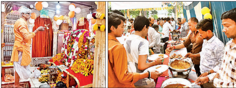
हनुमान मंदिर में आरती करते पुजारी।

बड़े हनुमान मंदिर में धूमधाम से मना जन्मोत्सव शहर के मोहल्ला जगन्नाथगंज स्थित प्राचीन बड़े हनुमान मंदिर में हनुमान जयंती हर्षोल्लास व श्रद्धा