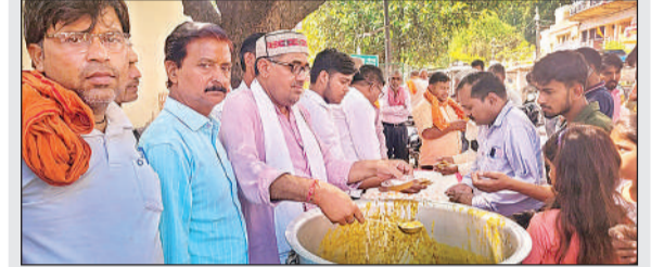
भंडारे में भक्तों को प्रसाद वितरित करते आयोजक व अन्य।