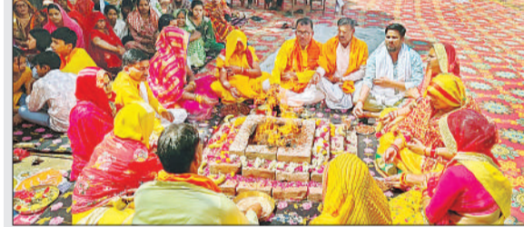
हवन-पूजन करते श्रद्धालु।