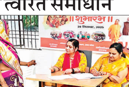
महिला हेल्प डेस्क में शिकायतें सुनती कर्मचारी।