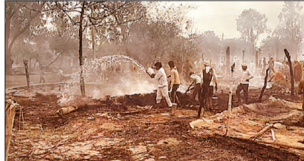
बाल्टियों से पानी डालकर आग बुझाते ग्रामीण।

अमृत विचार: गंगा नदी के किनारे स्थित एक गांव में गुरुवार को अज्ञात कारणों से आग लग गई। इसमें गांव के करीब सभी घरों की गृहस्थी जल कर स्वाहा हो गई। इसमें करीब 50 लाख का नुकसान होने का अनुमान लगाया जा रहा है। सूचना पर पहुंची राजस्व विभाग की टीम ने नुकसान का आंकलन किया। ग्रामीणों की मदद से फायर ब्रिगेड की टीम ने बमशिकल आग पर काबू पाया। कोतवाली बांगरमऊ क्षेत्र के गांव फरीदपुर कट्टर के मजरा मल्लाहन पुरवा में गुरुवार शाम साढ़े 5 बजे अचानक आग लगने से हड़कंप मच गया। ग्रामीणों के अनुसार गांव के पश्चिम स्थित एक घर में अचानक