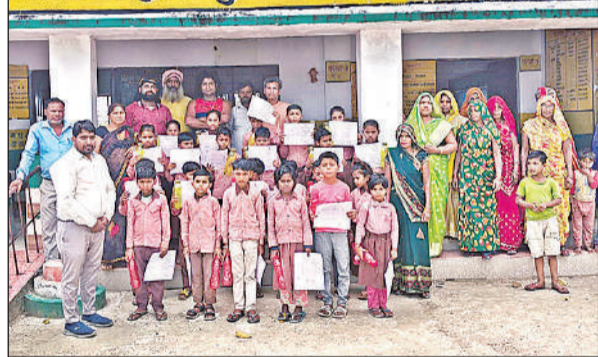
प्राथमिक विद्यालय हरीरामपुर में आयोजित कार्यक्रम में मौजूद बच्चे, शिक्षक व अन्य।