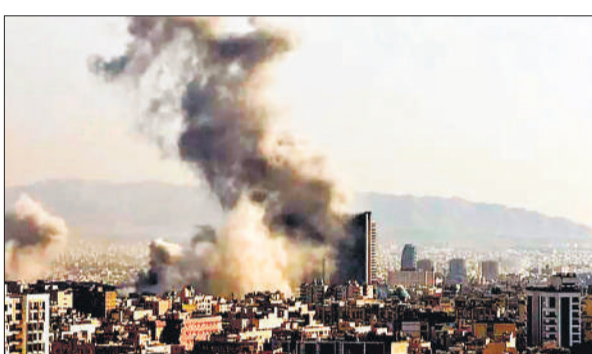
इजराइल के तेल अवीव में ईरान की मिसाइल गिरने के बाद उठता धुआं।