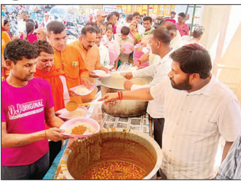
भंडारा में प्रसाद ग्रहण करते श्रद्धालु।