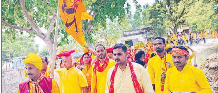
कलशयात्रा में शामिल श्रद्धालु।

अमृत विचार। मनीरामपुर के कटरा रानी गांव में बृहस्पतिवार से आयोजित होने जा रही संगीतमय ब्राह्मण भागवत महापुराण कथा के पूर्व विशाल मंगल कलश यात्रा निकाली गई। कलश यात्रा में महिलाओं ने सिर पर मंगल कलश रखकर गांव के विविध देवस्थानों की पूजा करते हुए क्षेत्र के कल्याण की कामना की। यात्रा में बड़ी संख्या में लोगों की मौजूदगीरही। मनीरामपुर के कटरा रानी गांव में आयोजित होने जा रही श्रीमद् भागवत महापुराण कथा के पहले मंगल कलश यात्रा का जगह-जगह लोगों ने पुष्प वर्षा के साथ स्वागत किया। कलश यात्रा मनीरामपुर के कटरा रानी गांव से निकलकर मुसवापुर चौराहा होते हुए पहलवान वीर बाबा धाम तक गई। वहां से लौटकर मनीरामपुर कटरा