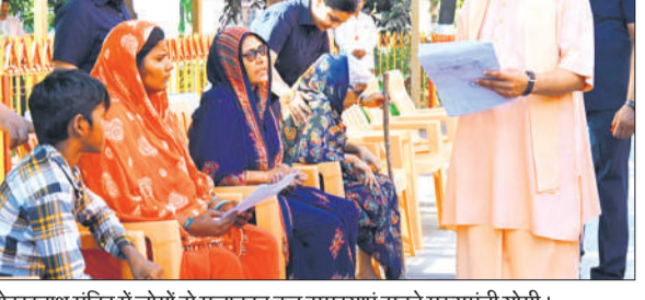
गोरखनाथ मंदिर में लोगों से मुलाकात कर समस्याएं सुनते मुख्यमंत्री योगी।

का समयबद्ध, निष्पक्ष और संतुष्टिपरक निस्तारण सुनिश्चित किया जाए। पुलिस से जुड़े मामलों में सख्त और त्वरित कार्रवाई के निर्देश भी दिए गए। एक महिला द्वारा आवास की समस्या रखने