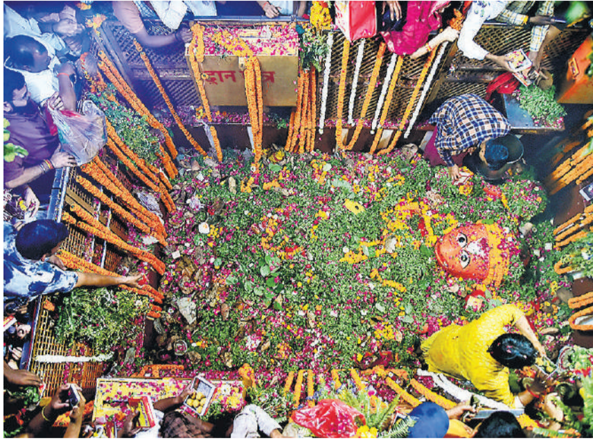
प्रयागराज में गुरुवार को श्री बड़े हनुमान जी मंदिर में हनुमान जयंती के अवसर पर लोग वीर हनुमान जी की पूजा-अर्चना करते हुए।