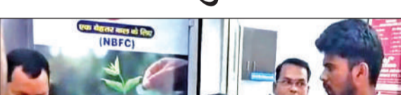
खाताधारक से बहस करती कंपनी की डायरेक्टर। ● अमृत विचार

● रुद्रपुर का मामला, खाताधारक से भी एमडी ने की धमकी-मुक्की