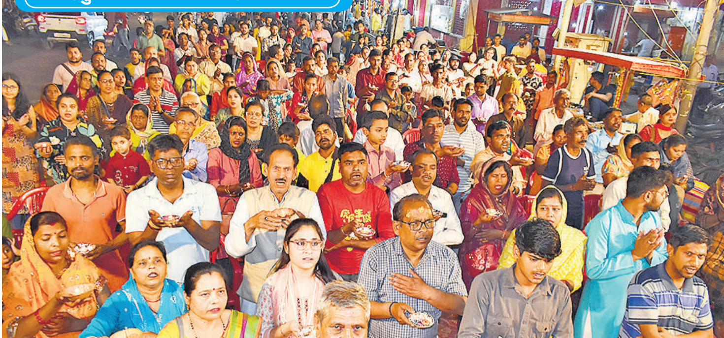
हनुमान जन्मोत्सव पर सिविल लाईस स्थित श्री हनुमान मंदिर में महाआरती करते श्रद्धालु। (संबंधित खबर पेज IV पर)