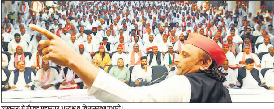
लखनऊ में मौजूद महानगर अध्यक्ष व विधानसभा प्रभारी।

सपा अध्यक्ष ने दो टूक कह दिया कि जिलाध्यक्ष का नाम तय तो जल्द होगा मगर वो नहीं जिसको आप सोच रहे हो। हाईकमान के इस संदेश से नए चेहरों में चमकते