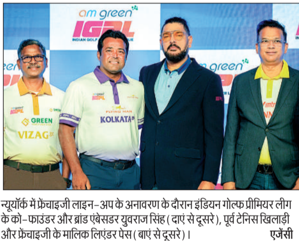
यूएफके में फ्रेंचाइजी लाइन-अप के अनावरण के दौरान इंडियन गोल्फ प्रीमियर लीग के को-फाउंडर और ब्रांड एंबेसडर युवराज सिंह (दाएं से दूसरे), पूर्व टेनिस खिलाड़ी और फ्रेंचाइजी के मालिक लिंडर पेस (बाएं से दूसरे)।

नई दिल्ली, । विश्व कप विजेता पूर्व भारतीय हरफनमौला युवराज सिंह ने बृहस्पतिवार को कहा कि क्रिकेट को अपने मुख्य पेशे के तनाव से निपटने के लिए कम उम्र से ही गोल्फ खेलना शुरू कर देना चाहिए। युवराज क्रिकेट को अलविदा कहने के बाद शौकिया तौर पर गोल्फ खेलते हैं। उन्हें दूसरे 'इंडियन गोल्फ प्रीमियर लीग (आईजीपीएल)' का ब्रांड दूत बनाया गया है। युवराज ने आईजीपीएल की 10 फ्रेंचाइजी के अनावरण के मौके पर कहा क्रिकेट को छोड़ने के साथ-साथ गोल्फ भी खेलना चाहिए। मुझे भी पहले गोल्फ खेलना चाहिए था, जिससे मुझे क्रिकेट में मदद मिलती। गोल्फ वास्तव में आपको तनाव से निपटने का एक शौकिया खेल है। उन्होंने कहा ज्यादातर विदेशी क्रिकेटर, खासकर ऑस्ट्रेलिया, न्यूजीलैंड, इंग्लैंड और दक्षिण अफ्रीका के खिलाड़ी बचपन से ही गोल्फ खेलते हैं। युवराज ने कहा