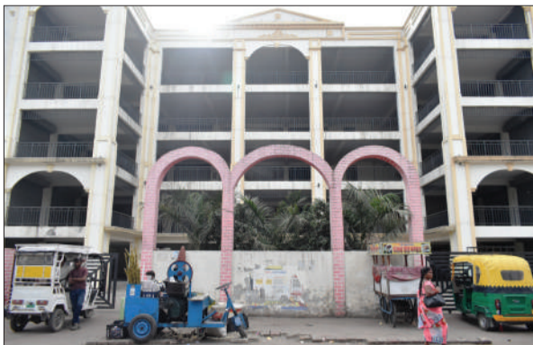
तांगा स्टैंड पर स्मार्ट सिटी के अंतर्गत बना कॉम्प्लेक्स।

वर्ष 2018 में जब स्मार्ट सिटी योजना लागू हुई तब अफसरों ने शहरी जनता के लिए तमाम प्रोजेक्ट बनाए। कई चरणों के बाद जिन प्रोजेक्टों को हरी झंडी मिली, इसमें