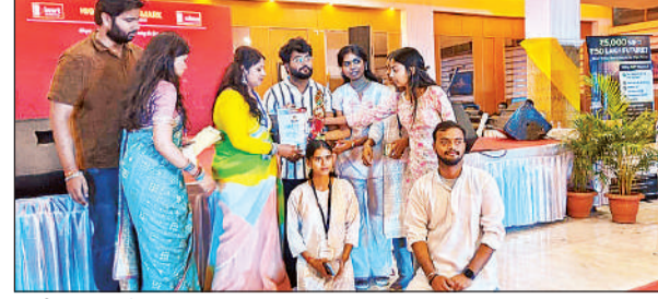
ट्रोंफी प्राप्त करते छात्र।