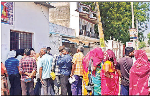
गैस एजेंसी के बाहर केवाईसी कराने के लिए लगी लोगों की कतार।