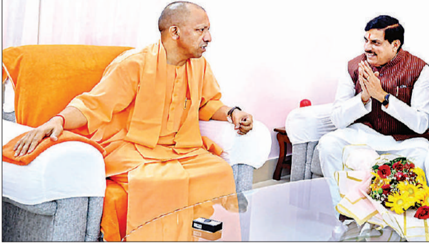
वाराणसी के सफिद हाउस में मध्य प्रदेश के मुख्यमंत्री मोहन यादव से वार्ता करते हुए मुख्यमंत्री योगी आदित्यनाथ।

बोर्ड ने अभ्यर्थियों को निर्देश दिया है कि वे परीक्षा में वही पहचान पत्र लेकर आए, जो उन्होंने आवेदन के समय इस्तेमाल किया था, ताकि सत्यापन में किसी तरह की दिक्कत न हो।