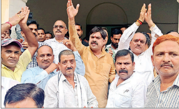
मांगों को लेकर नारेबाजी करते शिक्षक।