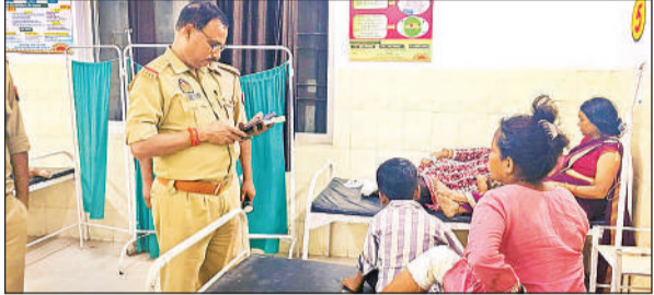
घायलों की जानकारी लेते हैदरगढ़ थाना प्रभारी।