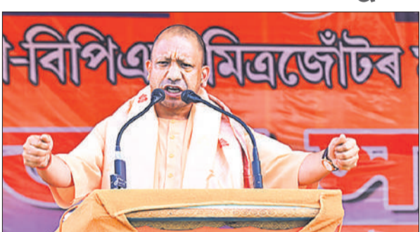
असम के बारपेटा विधानसभा क्षेत्र में आयोजित जनसभा को संबोधित करते मुख्यमंत्री योगी।

मुख्यमंत्री योगी शुक्रवार को असम के बारपेटा और बरछला विधानसभा क्षेत्र में की चुनावी सभाओं को संबोधित कर रहे थे। उन्होंने जय श्रीराम के उद्घोष के बीच यूडीएफ को घुसपैठ और जननी बताया। कहा कि कांग्रेस उसकी सहयोगी बनकर राज्य की सुरक्षा में संघ लगा रही है। मुख्यमंत्री ने मतदाताओं से अपील