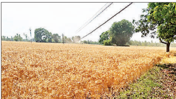
महराजगंज क्षेत्र के खेत में गेहूं की फसल के ऊपर लटकते विद्युत तार।