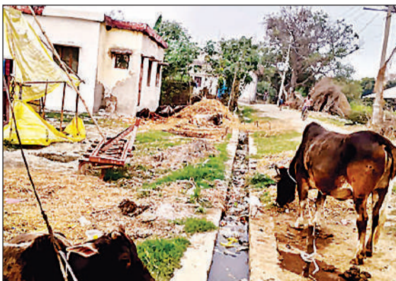
बद्री मंसूरपुर में पंचायत भवन के पास कूड़े से ढकी नाली।