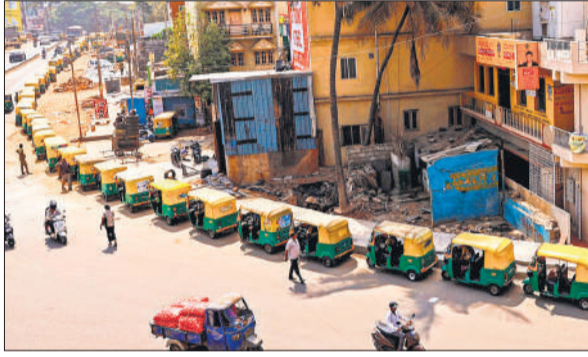
बंगलुरु के एक पेट्रोल पंप पर शुक्रवार को एलपीजी भरवाने के लिए लगी टैपो की कमी।

पश्चिम एशिया संकट ने होर्मुज जलडमरूमध्य से तेल और गैस ले जाने वाले जहाजों की आवाजाही को बाधित कर दिया है। इससे खाना पकाने की गैस की आपूर्ति को लेकर चिंताएं बढ़ गई हैं और लोग इंडक्शन हीटर और उसके अनुकूल बर्तन खरीद रहे हैं। बैठक में वाणिज्य एवं उद्योग मंत्री गोयल के साथ ऊर्जा सचिव, विदेश व्यापार महानिदेशक (डीजीएफटी) और उद्योग एवं आंतरिक व्यापार संवर्धन विभाग (डीपीआईआईटी) के सचिव सहित वरिष्ठ अधिकारियों शामिल हुए। एक अधिकारी ने बताया कि बैठक में चर्चा की गई कि इंडक्शन हीटर और उससे जुड़े इंडक्शन कुकर जैसे बर्तनों का उत्पादन किस तरह तेजी से बढ़ाया जा सकता है।