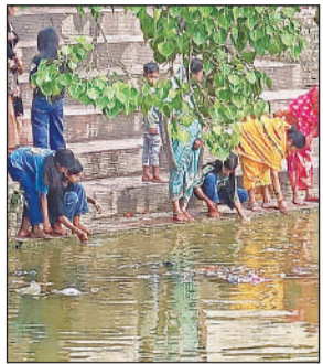
अमृत कुंड के दूषित पानी से आचमन करते श्रद्धालु। अमृत विचार

अमृत विचार। विकास खंड संग्रामपुर क्षेत्र स्थित प्रसिद्ध कालिकन धाम का पवित्र सगरा (अमृत कुंड) इन दिनों गंभीर प्रदूषण की चपेट में है। श्रद्धालुओं की आस्था का केंद्र माना जाने वाला यह कुंड गंदगी से पट गया है, जिससे न केवल धार्मिक भावनाएं आहत हो रही हैं, बल्कि पर्यावरण पर भी विपरीत असर पड़ रहा है।