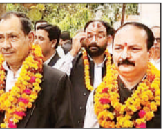
पर्चा भरने जाते अधिवक्ता।