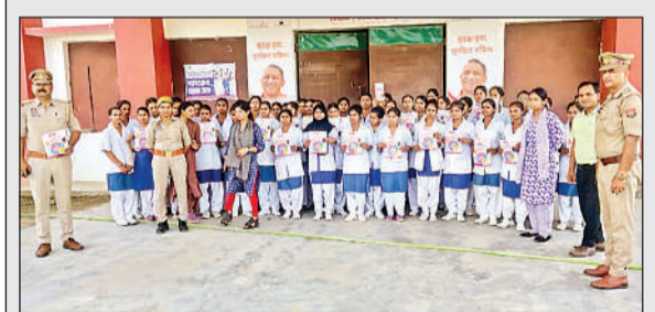
गदागंज क्षेत्र के महाविद्यालय में आयोजित कार्यक्रम में मौजूद लोग।