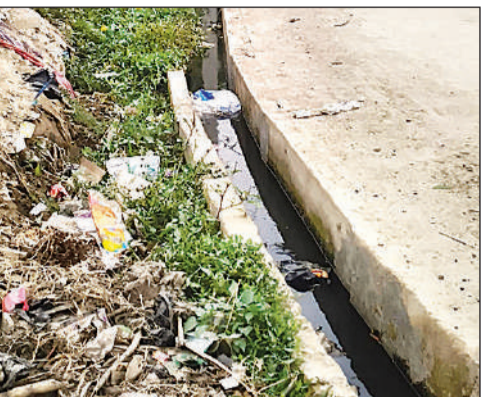
बिरेचा में मुख्य मार्ग के किनारे चोक नाली और पड़ा हुआ कचरा।