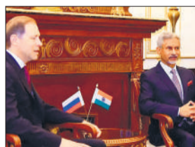
नई दिल्ली, एजेंसी