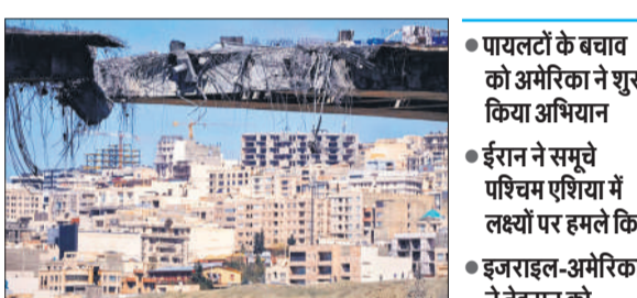
ईरान के करज शहर में हवाई हमलों से क्षतिग्रस्त हुआ पुल।

वहीं शुक्रवार को ईरान ने एक अमेरिकी फाइटर जेट गिराया गया है। इस घटना के बाद अमेरिकी सेना ने अपने लापता पायलटों और चालक दल को बचाने के लिए एक बड़ा तलाशी अभियान शुरू कर दिया है। युद्ध की शुरुआत के बाद यह पहला मौका है जब ईरान के भीतर किसी अमेरिकी जेट के गिरने की पुष्टि हुई है। इस युद्ध को शुरू हुए लगभग पांच सप्ताह हो गए हैं। युद्ध की शुरुआत के बाद यह पहला मौका है जब ईरान के भीतर किसी अमेरिकी जेट के गिरने की पुष्टि हुई है। ईरानी मीडिया दावा कर रहा है आईआरजीसी ने अमेरिका के दो लड़ाकू विमानों को मार गिराया है। यह भी दावा किया जा रहा है कि विमान का पायलट दक्षिण-पश्चिमी ईरान में पैराशूट के जरिए सुरक्षित कूद गया था, जिसे अब बंधक बना लिया गया