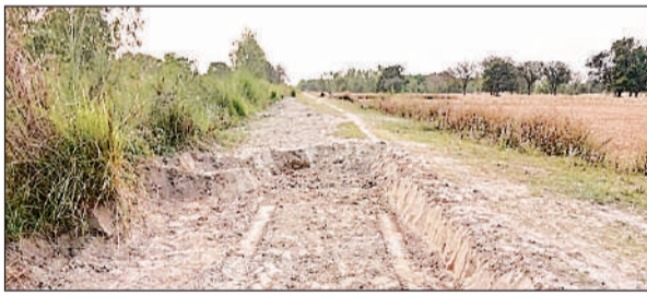
जगतपुर में शारदा सहायक नहर से निकाली गई सिल्ट।

अमृत विचार। शारदा सहायक नहर से निकली पारी रजबहा इन दिनों अवैध सिल्ट खनन का अड्डा बन गई है। गरीबों के पुरवा के सामने बिना किसी नीलामी प्रक्रिया के खुलेआम बड़े पैमाने पर सिल्ट का उठान किया जा रहा है। हैरानी की बात यह है कि यह खेल लंबे समय से जारी होने के बावजूद जिम्मेदार विभाग पूरी तरह अनजान बना हुआ है। ग्रामीणों के मुताबिक दिन-रात ट्रैक्टर-ट्रॉली और अन्य वाहनों के जरिए सिल्ट ढोई जा रही है। आरोप है कि खनन माफिया न सिर्फ सरकारी संपत्ति को लूट रहे हैं, बल्कि रजबहा की पट्टरी को भी नुकसान पहुंचा रहे हैं, जिससे भविष्य में नहर व्यवस्था प्रभावित होने का खतरा