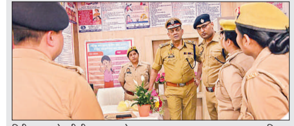
निरीक्षण करते एडीजी लखनऊ जौन।