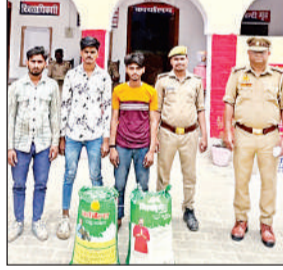
पुलिस की गिरफ्त में आरोपी।