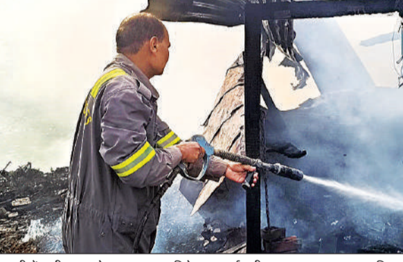
गुमटी में लगी आग को बुझाता फायर ब्रिगेड का कर्मचारी। अमृत विचार

अमृत विचार। नगर पालिका परिषद जायस कस्बे में प्राइमरी स्कूल के सामने शुक्रवार को एक चाय की गुमटी में अचानक आग लग गई। देखते ही देखते लपटें तेज हो गईं और कुछ ही देर में पूरी गुमटी आग की चपेट में आ गई। वहीं गुमटी में रखा गैस सिलेंडर तेज धमाके के साथ फट गया। आगजनी के बीच घने धुएं को देखकर आसपास मौजूद लोगों में हड़कंप मच गया। स्थानीय लोगों ने तुरंत फायर ब्रिगेड को सूचना दी।