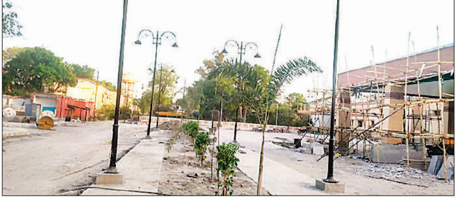
बछरावां रेलवे स्टेशन पर कराया जा रहा सौंदर्यीकरण का कार्य। अमृत विचार

रेलवे ओवर ब्रिज पर प्रेनाइट पत्थर लगाए गए हैं और स्टेशन के दोनों भव्य गेट व लगभग 200 खंभों में एलईडी लाइटें लगाई गई हैं। स्टेशन पूरी तरह दूधिया रोशनी में नहाएगा। यात्रियों की सुरक्षा को ध्यान में रखते हुए आरपीएफ चौकी और स्टेशन अधीक्षक कक्ष और हरियाली को भी बेहतर बनाया गया है, साथ ही कार और मोटरसाइकिल के लिए अलग-अलग