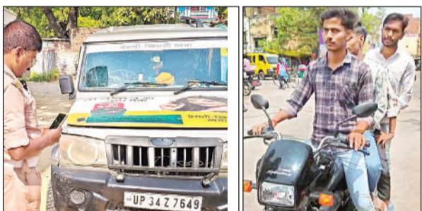
वाहन को सीज करती ट्रैफिक पुलिस व बाइक पर सवार तीन युवक।

अमृत विचार। नगर क्षेत्र में यातायात नियमों के सख्त अनुपालन को लेकर इन दिनों प्रशासन पूरी तरह सक्रिय नजर आ रहा है। बिना आवश्यक कागजात के वाहन चलाने वालों के खिलाफ लगातार कार्रवाई की जा रही है, जिससे वाहन चालकों में हड़कंप मचा हुआ है और लोगों में नियमों के प्रति जागरूकता भी बढ़ी है।