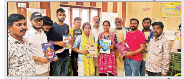
पुस्तकों के साथ बच्चे।