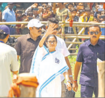
दक्षिण दिनाजपुर में चुनावी सभा में पहुंची ममता।

ममता बनर्जी ने लगाया आरोप, कहा- भाजपा और कांग्रेस ने उपद्रवियों को उकसाया, मुख्य आरोपी को भाजपा लाई थी