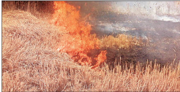
फसल में लगी आग।