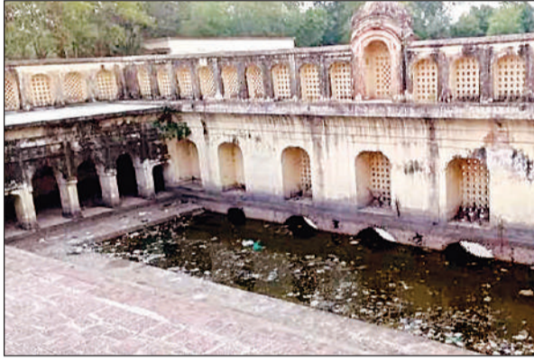
रायपुर के पास स्थित बदहाल ऐतिहासिक धरोहर रेवती राम तालाब। अमृत विचार

जनपद का ऐतिहासिक धरोहर रेवती राम तालाब आज उपेक्षा और अत्यवस्था के कारण अपनी पहचान खोता जा रहा है। यह तालाब कभी