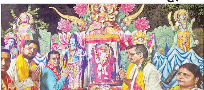
मंदिर में आयोजित जागरण में मौजूद श्रद्धालु।

बांगरमऊ उज्जाव, अमृत विचार । नगर में बीते गुरुवार को मोहल्ला भटपुरी व खत्रियाना स्थित मंदिरों में आयोजित धार्मिक कार्यक्रमों में श्रद्धालुओं की भारी भीड़ रही। भजनों की धुनों व महाआरती के स्वर से पूरा क्षेत्र भक्तिमय हो गया।