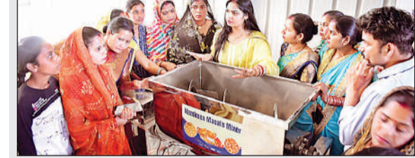
खेती-किसानी की जानकारी लेती महिलाएं।