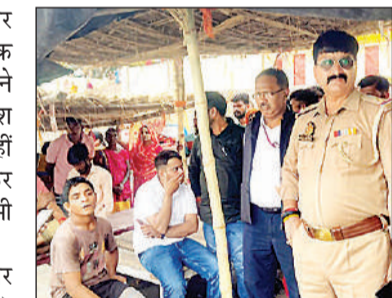
मौके पर मौजूद पुलिस व प्रशासनिक अधिकारी।

उज्जाव, अमृत विचार । बक्सर घाट पर दोस्तों के साथ गंगा नहाते समय एक युवक गहरे पानी में चला गया। शोर सुन नाविकों ने पानी में छलांग लगा उसे बचाने की कोशिश की लेकिन बहाव तेज होने से वह सफल नहीं हुए। एसडीएम ने गोताखोरों को बुलाकर उसकी तलाश शुरू कराई है। लेकिन अभी उसका पता नहीं चला है।