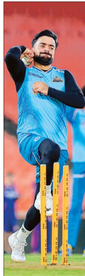
अहमदाबाद में अभ्यास सत्र के दौरान गुजरात टाइटंस के राशिद खान।