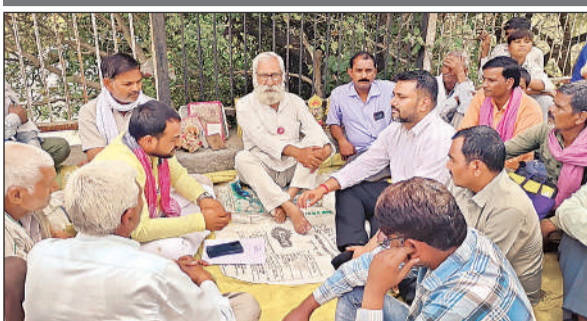
प्रदर्शनकारियों से बात करते नायब तहसीलदार।