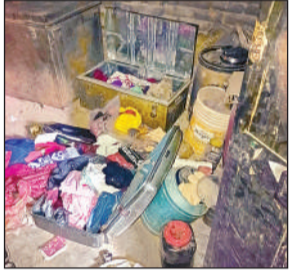
चोरी के बाद बिखरा पड़ा समान।

अमृत विचार। गुरुवार रात चोरों ने घर में चुसकर बक्से का ताला तोड़कर सोने-चांदी के करीब 10 लाख रुपये के जेवर और 25 हजार रुपये नकद चोरी कर ले गए। शुक्रवार सुबह परिवार के जागने पर उन्हें कमरे में सामान बिखरा मिला। तब चोरी की घटना की जानकारी हुई। घटना जगदीशपुर थाना क्षेत्र के कटेहटी गांव की है।