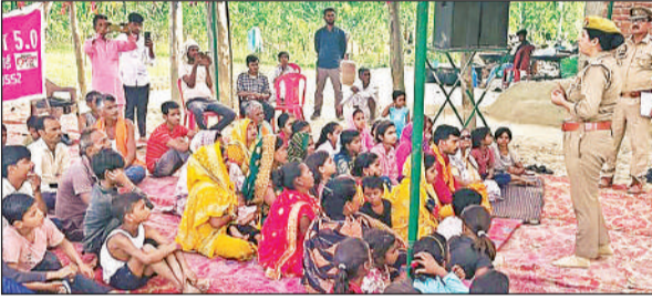
बेनीगंज में महिलाओं को जागरूक करती मिशन शक्ति की टीम।

मिशन शक्ति के दूसरे चरण में एंटी रोमियो व मिशन शक्ति टीम ने महिलाओं और बालिकाओं को जागरूक करते हुए उन्हें आत्म