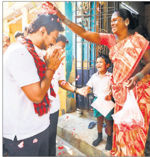
तमिलनाडु के डिप्टी सीएम उदयनिधि स्टालिन ने चेंनेई में चुनाव प्रचार किया।

कोलकाता। पश्चिम बंगाल में विधानसभा चुनाव के बीच 2022 प्राथमिक शिक्षक अहर्ता परीक्षा (टीटीटी) में उत्तीर्ण अभ्यर्थियों की साक्षात्कार प्रक्रिया स्थगित कर दी गई है। लिखित परीक्षा 11 दिसंबर 2022 को हुई थी और इसके परिणाम 10 फरवरी 2023 को घोषित किए गए थे। पश्चिम बंगाल शिक्षा बोर्ड ने इस साल 12 मार्च को अधिसूचना जारी कर साक्षात्कार कार्यक्रम घोषित किया था।