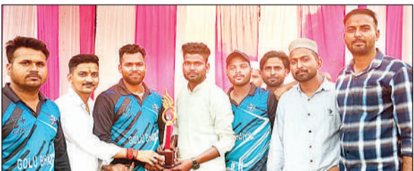
ट्रॉफी लेता खिलाड़ी।