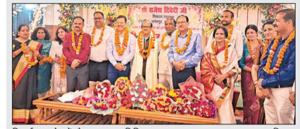
विदाई समारोह में मौजूद मुख्य अतिथि व अन्य।