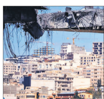
कराज शहर में हवाई हमलों से क्षतिग्रस्त हुआ पुल।

वहीं शुक्रवार को ईरान ने एक अमेरिकी फाइटर जेट गिराया गया है। इस घटना के बाद अमेरिकी सेना ने अपने लापता पायलटों को बचाने के लिए एक बड़ा तलाशी अभियान शुरू कर दिया है। युद्ध की शुरुआत के बाद यह पहला मौका है जब ईरान के भीतर किसी अमेरिकी जेट के गिरने की पुष्टि हुई है। इस युद्ध को शुरू हुए लगभग पांच सप्ताह हो गए हैं। युद्ध की शुरुआत के बाद यह पहला मौका है जब ईरान के भीतर किसी अमेरिकी जेट के