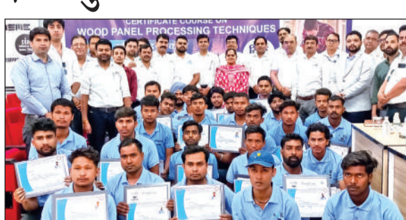
सितारगंज में प्रशिक्षार्थियों को नियुक्ति पत्र देती बालाजी एक्शन की टीम।

अमृत विचार : बालाजी एक्शन कंपनी के टेसा कारपेंटर अकादमी ने 30 युवाओं को तीन माह का प्रशिक्षण दिया। शुक्रवार को इन प्रशिक्षार्थियों को प्रमाण पत्र वितरित करने के बाद देश की प्रमुख तीन कंपनियों की टीम ने साक्षात्कार के बाद सभी 30 छात्रों को नियुक्ति प्रदान की। एमएसएमई टेक्नोलॉजी सेंटर सिडकुल में तीसरे बैच में 30 युवाओं को तीन माह का प्रशिक्षण दिया गया। इन प्रशिक्षार्थियों को वुड पैनेल प्रोसेसिंग टेक्निकल कोर्स में प्रशिक्षण दिया गया। शुक्रवार को नीलकमल, क्रिएटिव कॉम्पस, ओपल डिजायनर कंपनियों ने नियुक्ति पत्र प्रदान किए। यहां एमएसएमई व टेसा प्रबंधकों की ओर से वक्ताओं ने कहा कि