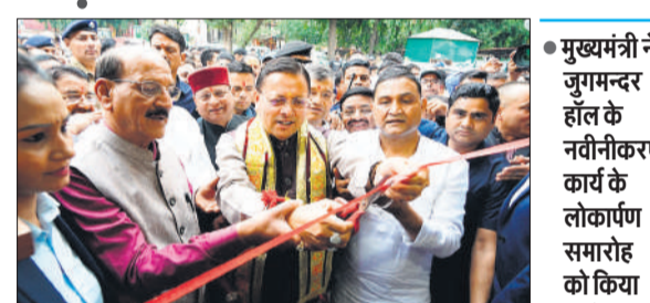
जुगमन्दर हॉल के जीर्णोद्धार व नवीनीकरण कार्य का लोकार्पण करते सीएम।

मुख्यमंत्री ने कहा, देहरादून को आधुनिक शहर के रूप में विकसित करने के लिए 1400 करोड़ रुपये से अधिक की विभिन्न विकास परियोजनाओं पर व्यापक स्तर पर