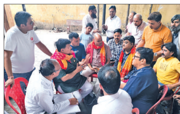
लालकुआं में विचार-विमर्श करते व्यापार मंडल के पदाधिकारी।