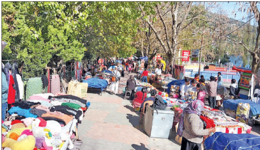
सरोवर नगरी में पंत पार्क में लगे व्यावसायिक फड़। ● अमृत विचार

बल्कि उनके व्यापार में भी वृद्धि होगी। वहीं, पर्यटकों को एक ही स्थान पर विविध उत्पाद उपलब्ध होने से खरीदारी का अनुभव अधिक सुविधाजनक और आकर्षक बनेगा। इस परियोजना के पूरा होने के बाद न केवल 121 व्यापारियों का जीवन स्तर सुधरेगा, बल्कि नैनीताल एक नए, आधुनिक और व्यवस्थित शहर के रूप में उभरकर सामने आएगा।