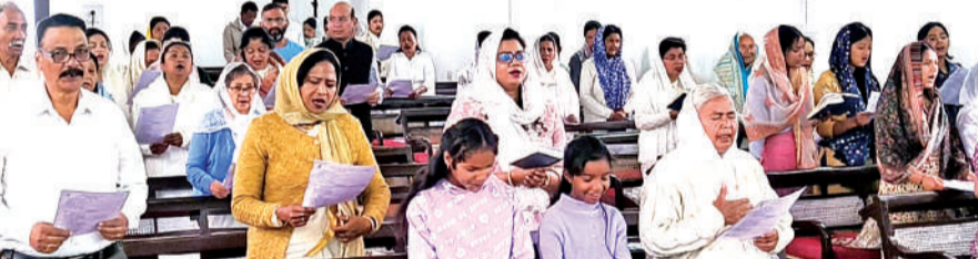
अल्मोड़ा के चर्च में शुरुवार को गुड फ्राइडे पर प्रार्थना सभा में मौजूद इसाई समुदाय के लोग।