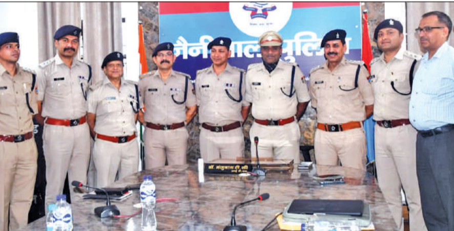
इंस्पेक्टर से डिप्टी एसपी बने अधिकारियों के साथ एसएसपी डॉ. मंजुनाथ टीसी व अन्य अधिकारी।

इस अवसर पर एसएसपी डॉ. मंजुनाथ टीसी की मौजूदगी में पीपिंग सेरेमनी आयोजित की गई। एसएसपी ने दोनों अधिकारियों के कंधों पर 'यूपीएस' बैज लगाकर उन्हें नए पद की जिम्मेदारी सौंपी। दोनों पदोन्नत अधिकारियों ने वर्ष