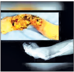
ये है जॉम्बी ड्रग का साइड ड्रफ्ट।

अगर समय रहते सतर्कता न बरती तो आने वाले समय में उत्तराखंड भी इससे अछूता नहीं रहेगा। उत्तराखंड में स्मैक की तस्करी बढ़े पैमाने पर की जाती है। ऐसे में इस ड्रग के यहां