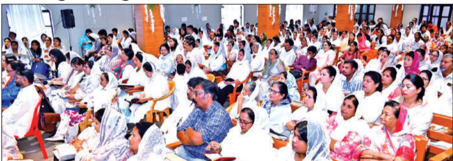
हल्लानी में गुड फ्राइडे के अवसर पर प्रार्थना सभा में मौजूद प्रभु ईसा मसीह के अनुयायी।

इसके बाद चर्च में विशेष प्रार्थना सभा हुई, जिसमें गीतों व भजनों के माध्यम से प्रभु के बलिदान