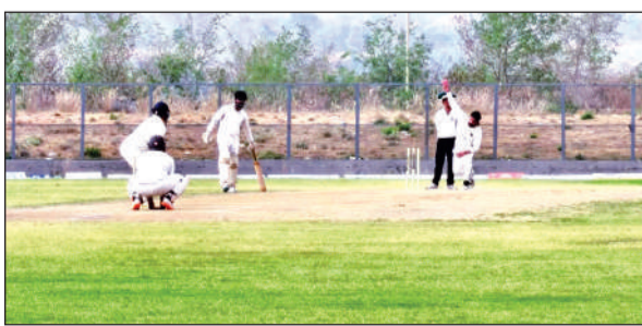
क्रिकेट स्टेडियम गोलापार में आयोजित क्रिकेट मैच में खेलते खिलाड़ी।

इन खेलों में व्यवस्थित और पेशेवर प्रशिक्षण मिल सकेगा। अभी तक इन खेलों की सीमित सुविधाओं के कारण कई प्रतिभाएं आगे नहीं बढ़ पाती थीं, लेकिन नई व्यवस्था से उन्हें उचित मार्गदर्शन और संसाधन उपलब्ध होंगे। खेल विशेषज्ञों का मानना है