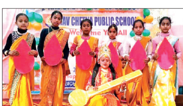
खटीमा के नव चेतना पब्लिक स्कूल में सरस्वती वंदना प्रस्तुत करते बच्चे।