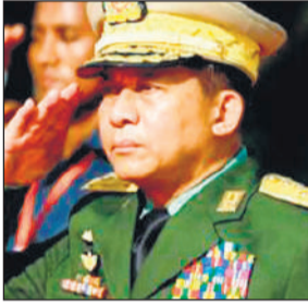
● ह्लाईंग ने ही किया था आंग सू ची सरकार को सत्ता से बेदखल

संसद में भारी बहुमत होने के कारण उनकी नियुक्ति लगभग तय मानी जा रही थी। मतदान राजधानी नेपीताव में नवनिर्मित संसद भवन में हुआ, जो पिछले साल आए भूकंप से क्षतिग्रस्त हो गया था। संसद के संयुक्त ऊपर और निचले सदन के अध्यक्ष आंग लिन डूवे ने घोषणा की कि मिन आंग ह्लाईंग ने 584 में से 429 वोट हासिल किए हैं दूसरे स्थान पर रहे दोनों उम्मीदवार उपराष्ट्रपति बने हैं। पूर्व जनरल न्यो सॉ, जो मिन आंग ह्लाईंग के सलाहकार रह चुके हैं और सैन्य समर्थक यूनिशन सॉलिडैरिटी एंड डेवलपमेंट पार्टी की नरेश जतीयी समूह की नेता नान नी ए देश की पहली महिला उपराष्ट्रपति होंगी। इन तीनों का शपथ ग्रहण