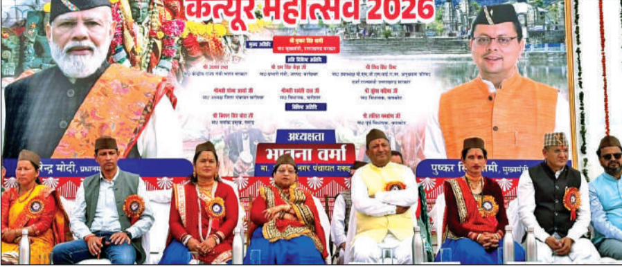
कत्पूर महोत्सव के शुभारंभ समारोह में उपस्थित अतिथि।