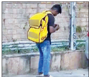
चंडीगढ़ में हाल में वायरल हुए डिलीवरी बॉय का फोटो।

अमृत विचार: दुनिया भर में तेजी से फैल रहा 'जॉम्बी ड्रग' अब सिर्फ एक नशा नहीं बल्कि एक संगठित अंतरराष्ट्रीय नेटवर्क का हिस्सा बन चुका है। जांच में सामने आया है कि इस खतरनाक ड्रग को जाइलाजीन से तैयार किया जा रहा है, जिसे मूल रूप से जानवरों को बेहोश करने के लिए बनाया गया था। अब इसे अवैध नशे के रूप में धड़ल्ले से इस्तेमाल किया जा रहा है। हालांकि यह किसी एक विशेष दवा का नाम नहीं है, बल्कि यह नशीले पदार्थों के लिए प्रयोग किया जाने वाला एक बोलचाल का शब्द है जो इंसाज को मानसिक और