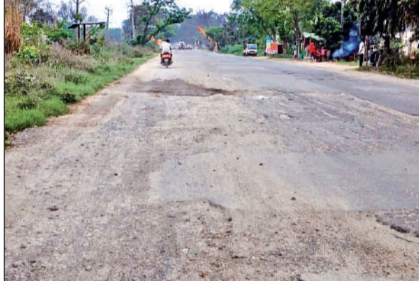
जर्जर हालत में रामनगर रोड। ● अमृत विचार

उनका आभार व्यक्त किया। महापौर ने बताया कि परियोजना का जीओ जारी हो चुका है। एक सप्ताह में टेंडर प्रक्रिया शुरू होगी और मई