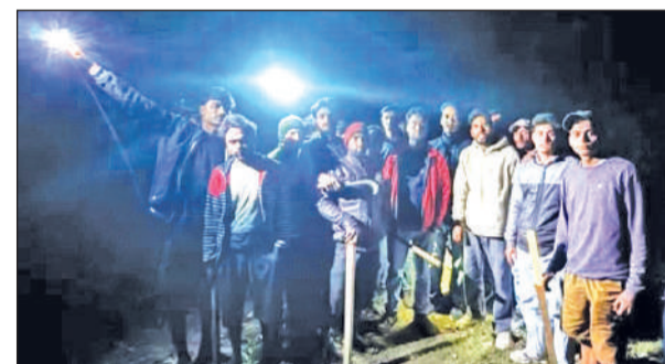
बाघ द्वारा महिला को निवाला बनाने की घटना के बाद मौके पर पहुंचे ग्रामीण।

मालूम हो की 2 फरवरी 2026 को भीमताल के वार्ड नंबर 6 में तेंदुए के द्वारा एक महिला को निवाला बनाने जाने के बाद दो माह के भीतर दूसरी घटना होने से क्षेत्र में एक बार पुनः भय का