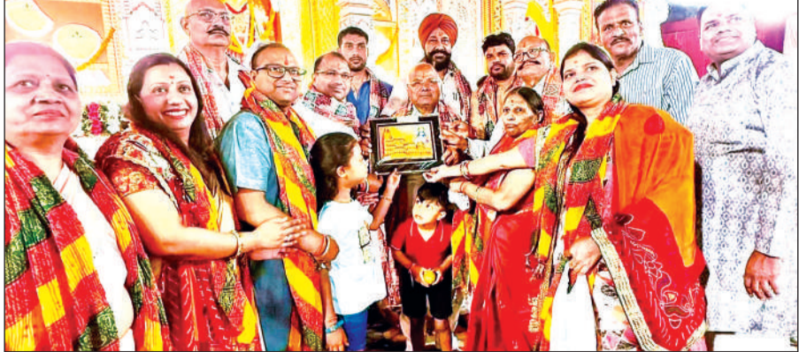
श्री बालाजी घाटा मंदिर में जनप्रतिनिधियों को सम्मानित करते मंदिर कमेटी के लोग।