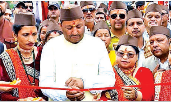
कत्पूर महोत्सव के शुभारंभ समारोह में उपस्थित अतिथि।

कार्य कर रहे हैं। इससे स्थानीय कलाकारों, शिल्पकारों और युवाओं को अपनी प्रतिभा प्रदर्शित करने का मंच मिलता है, साथ ही पर्यटन और स्थानीय अर्थव्यवस्था को भी बढ़ावा मिलता है। मुख्यमंत्री पुष्कर सिंह धामी ने नगर पंचायत गरुड़, जिला प्रशासन एवं आयोजकों को बधाई देते हुए विश्वास जताया कि यह कत्पूर महोत्सव सामाजिक सद्भाव और भाईचारे को और मजबूत करेगा। इस अवसर पर नगर पालिका अध्यक्ष बागेश्वर सुरेश खेतवाल, उपजिलाधिकारी वैभव कांडपाल सहित अन्य जनप्रतिनिधि, महोत्सव समिति के सदस्य और क्षेत्रीय जनता उपस्थित रही।