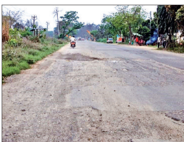
जर्जर हालत में रामनगर रोड।