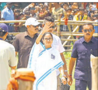
दक्षिण दिनाजपुर में चुनावी सभा में पहुंची ममता।

लिए बाहर से गुंडों को लाने का आरोप लगाते हुए ममता बनर्जी ने कहा, उन्होंने न्यायिक अधिकारियों को भी नहीं बख्शा।