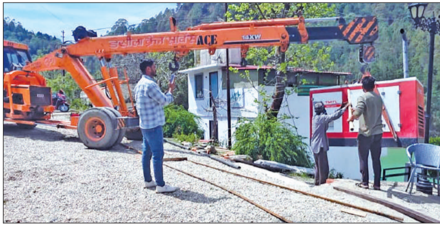
खुर्पाताल क्षेत्र में अतिक्रमण के खिलाफ अभियान चलाती जिला विकास प्राधिकरण की टीम। ● अमृत विचार

मामले को गंभीरता से लेते हुए आयुक्त ने संबंधित अधिकारियों की कार्यशैली पर नाराजगी जताई