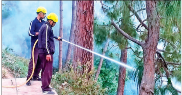
सीएमओ ऑफिस से सटे जंगल में आग को बुझाते फायर कर्मी।

रोजाना किसी न किसी जंगल में आग लगने की सूचना मिल रही है। शुरुवार दिन में अल्मोड़ा के सीएमओ कार्यालय से पास जमा कूड़े के ढेर में आग लग गई। कूड़े के ढेर में धककी आग पास के जंगल में फैल गई। विकराल हो चुकी आग आसपास के रिहायशी इलाकों की ओर से तेजी से बढ़ने लगी। जिससे वहां मौजूद लोगों में