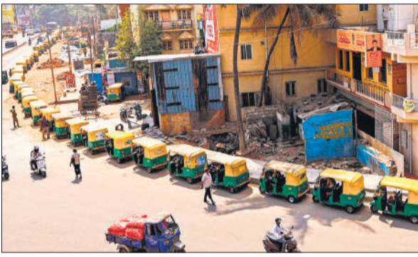
बंगलुरु के एक पेट्रोल पंप पर शुक्रवार को एलपीजी भरवाने के लिए लगी टैपो की कमी।

पश्चिम एशिया संकट ने होर्मुज जलडमरूमध्य से तेल और गैस ले जाने वाले जहाजों की आवाजाही को बाधित कर दिया है। इससे खाना पकाने की गैस की आपूर्ति को लेकर चिंताएं बढ़ गई हैं और लोग इंडक्शन हीटर और उसके अनुकूल बर्तन खरीद रहे हैं। बैठक में वाणिज्य एवं उद्योग मंत्री गोयल के साथ ऊर्जा सचिव, विदेश व्यापार महानिदेशक (डीजीएफटी) और उद्योग एवं आंतरिक व्यापार संवर्धन विभाग (डीपीआईआईटी) के सचिव सहित वरिष्ठ अधिकारी शामिल हुए। एक अधिकारी ने बताया कि बैठक में चर्चा की गई कि इंडक्शन हीटर और उससे जुड़े इंडक्शन कुकर जैसे बर्तनों का उत्पादन किस तरह तेजी से बढ़ाया जा सकता है।