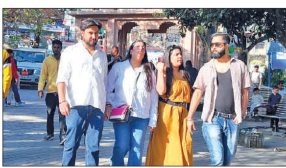
नैनीताल में चहलकदमी करते पर्यटक। ● अमृत विचार

अमृत विचार: सरोवर नगरी नैनीताल में वीकेंड के मौके पर एक बार फिर पर्यटकों की रौनक देखने को मिली। मैदानी इलाकों में बढ़ती गर्मी से राहत पाने के लिए बड़ी संख्या में पर्यटक नैनीताल पहुंच रहे हैं, जिससे यहां के पर्यटन कारोबारी भी खासे उत्साहित नजर आ रहे हैं। शहर के प्रमुख पर्यटन स्थलों पर सुबह से ही चहल-पहल बनी रही। नैनी झील में नौकायन का लुत्फ उठाने के लिए पर्यटकों की लंबी कतारें देखने को मिलीं। वहीं स्नो व्यू, हिमालय दर्शन, गवर्नर हाउस गार्डन, चिड़ियाघर और चाइना पीक (नैनी पीक) जैसे स्थानों पर भी पर्यटकों की अच्छी खासी भीड़ उमड़ी। साफ मौसम