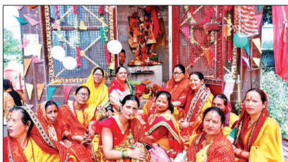
दिनेशपुर के श्री हनुमान मंदिर ललपुरी में भजन गायी महिलाएं।