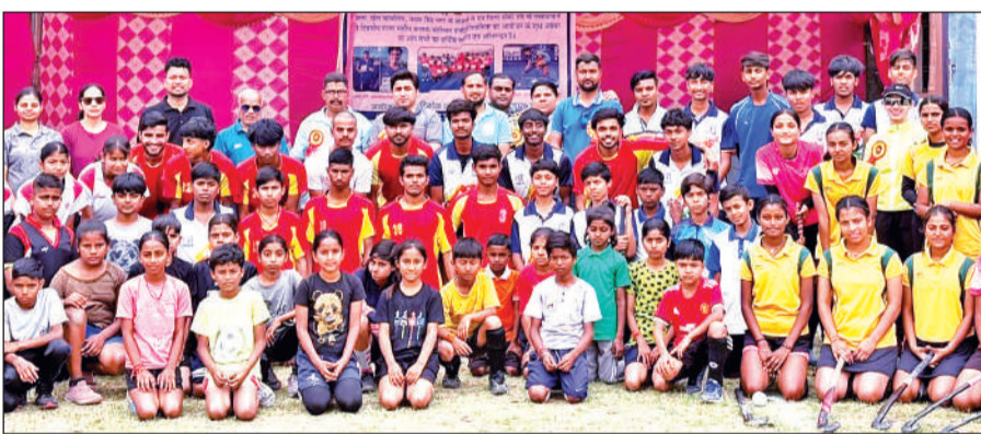
काशीपुर में आयोजित हॉकी प्रतियोगिता में भाग लेने वाले खिलाड़ी। ● अमृत विचार

अमृत विचार: जिला हॉकी संघ के तत्वावधान में जिला खेल कार्यालय व सीनियर हॉकी खिलाड़ियों द्वारा आयोजित दो दिवसीय बालक-बालिका आमंत्रण हॉकी प्रतियोगिता का शुक्रवार को भव्य शुभारंभ हुआ। स्थानीय स्पोर्ट्स स्टेडियम में आयोजित इस प्रतियोगिता में देहरादून, बाजपुर, काशीपुर और रुद्रपुर की टीमों ने प्रतिभाग किया। प्रतियोगिता के पहले दिन बालिका वर्ग में काशीपुर और देहरादून के बीच कड़ा मुकाबला हुआ, जिसमें काशीपुर ने 2-0 से जीत दर्ज की। वहीं, बालक वर्ग में काशीपुर ने रुद्रपुर को 1-0 के