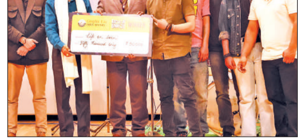
ग्राफिक एरा भीमताल में बैटल ऑफ बैंड्स 2.0 में प्रतिभाग करते बैंड के सदस्य।

ब्लैक गॉडस ने अपनी मौलिक रचनाओं के साथ दमदार प्रस्तुति दी, जबकि सांझ ने गढ़वाली और कुमाऊनी लोक संगीत का सुंदर संगम प्रस्तुत करते हुए नंदा तेरो डोला जैसे प्रस्तुति से सांस्कृतिक समृद्धि को दर्शाया। भीमताल परिसर के निदेशक ने म्यूजिक क्लब एवं आयोजन से जुड़े सभी संकाय सदस्यों को सफल आयोजन के लिए धांधे दी। प्रतियोगिता में लाइफ ऑन लोन विजेता रही, ब्लैक गॉडस उपविजेता बनी, जबकि सांझ को सांत्वना पुरस्कार प्रदान किया गया। पुरस्कार मुख्य अतिथि, निर्णायक मंडल एवं परिसर निदेशक द्वारा वितरित किए गए।