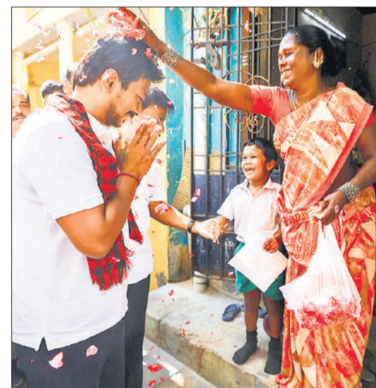
तमिलनाडु के डिप्टी सीएम उदयनिधि स्टालिन ने चेन्नई में चुनाव प्रचार किया।

कोलकाता। पश्चिम बंगाल में विधानसभा चुनाव के बीच 2022 प्राथमिक शिक्षक अहर्ता परीक्षा (टीटी) में उत्तीर्ण अभ्यर्थियों की साक्षात्कार प्रक्रिया स्थगित कर दी गई है। लिखित परीक्षा 11 दिसंबर 2022 को हुई थी और इसके परिणाम 10 फरवरी 2023 को घोषित किए गए थे। पश्चिम बंगाल शिक्षा बोर्ड ने इस साल 12 मार्च को अधिसूचना जारी कर साक्षात्कार कार्यक्रम घोषित किया था।