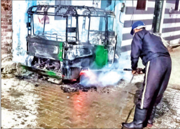
टेंपो में लगी आग बुझाना दमकल कर्मी।