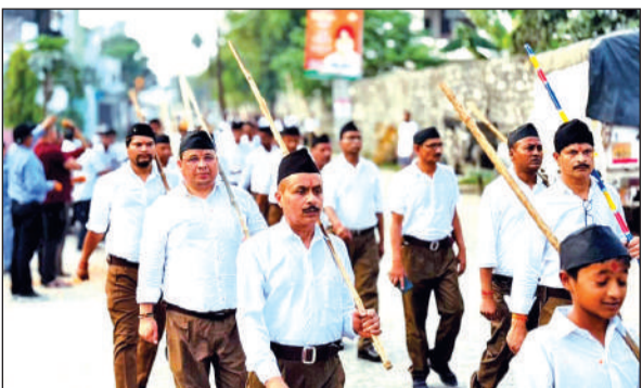
काशीपुर में पथ संचलन करते स्वयं सेवक।