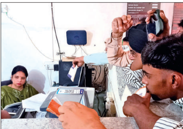
काशीपुर में गैस एजेंसी पर लगी उपभोक्ताओं की भीड़।