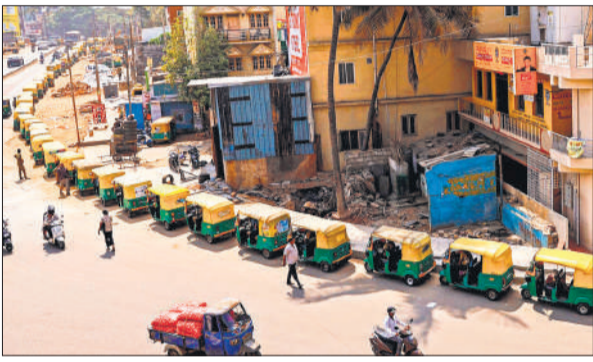
बेगलुरु के एक पेट्रोल पांप पर शुक्रवार को एलपीजी भरवाने के लिए लगी टैपो की कमी।

पश्चिम एशिया संकट ने होर्मुज जलडमरूमध्य से तेल और गैस ले जाने वाले जहाजों की आवाजाही को बाधित कर दिया है। इससे खाना पकाने की गैस की आपूर्ति को लेकर चिंताएं बढ़ गई हैं और लोग इंडक्शन हीटर और उसके अनुकूल बर्तन खरीद रहे हैं। बैठक में वाणिज्य एवं उद्योग मंत्री गोयल के साथ ऊर्जा सचिव, विदेश व्यापार महानिदेशक (डीजीएफटी) और उद्योग एवं आंतरिक व्यापार संवर्धन विभाग (डीपीआईआईटी) के सचिव सहित विरष्ट अधिकारी शामिल हुए। एक अधिकारी ने बताया कि बैठक में चर्चा की गई कि इंडक्शन हीटर और उससे जुड़े इंडक्शन कुकर जैसे बर्तनों का उत्पादन किस तरह तेजी से बढ़ाया जा सकता है।