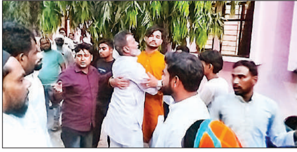
हादसे की सूचना मिलने पर रोते-बिलखते परिजन।