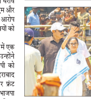
दक्षिण दिनाजपुर में चुनावी सभा में पहुंची ममता।

लिए बाहर से गुंडों को लाने का आरोप लगाते हुए ममता बनर्जी ने कहा, उन्होंने न्यायिक अधिकारियों को भी नहीं बख्शा। ममता ने एआईएमआईएम पर आरोप लगाया कि उसने बिहार चुनाव में मतों को विभाजित