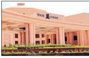
● हाईकोर्ट की लखनऊ बेंच का सख्त रुख