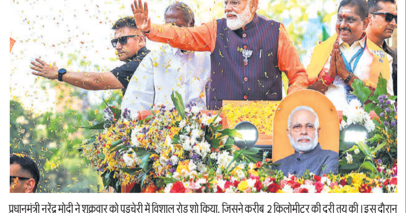
प्रधानमंत्री नरेंद्र मोदी ने शुक्रवार को पुडुचेरी में विशाल रोड शो किया, जिसने करीब 2 किलोमीटर की दूरी तय की। इस दौरान भारी जनसैलाब उमड़ा। इस दौरान उनके साथ पुडुचेरी के कई बड़े नेता भी मौजूद थे।