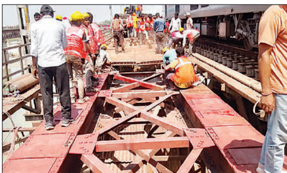
रेलवे पुल पर एचबीम स्लीपर डालते रेलकर्मियों।

बता दें कि रेलवे द्वारा यह कार्य 2 अप्रैल से शुरू हुआ है। इसमें करीब 200 कर्मचारियों की टीम