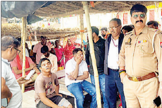
मौके पर मौजूद पुलिस व प्रशासनिक अधिकारी।