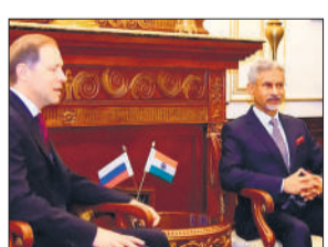
नई दिल्ली, एजेंसी

रूस ने पश्चिम एशिया संकट के कारण वैश्विक ऊर्जा बाजार में बढ़ती अस्थिरता के बीच भारत को कच्चे तेल एवं प्राकृतिक गैस की आपूर्ति बढ़ाने की पेशकश की है। इसके अलावा दोनों देशों ने द्विपक्षीय संबंधों को और मजबूत करने पर भी सहमति जताई है। घटनाक्रम से जुड़े सूत्रों ने कहा कि रूस के प्रथम उप प्रधानमंत्री डेनिस मंतुरोव ने गुरुवार को राष्ट्रीय सुरक्षा सलाहकार अजीत डोभाल और विदेश मंत्री एस. जयशंकर के साथ बैठकों में ऊर्जा सहयोग पर विशेष रूप से चर्चा की। मंतुरोव ने इसके बाद वित्त मंत्री सीतारामण से भी मुलाकात की। गुरुवार शाम वह प्रधानमंत्री मोदी से भी मिले। रूस की तरफ से जारी बयान के मुताबिक, नई दिल्ली में हुई इन बैठकों में तेल एवं गैस क्षेत्र में द्विपक्षीय सहयोग पर विशेष ध्यान दिया गया। डेनिस मंतुरोव ने पुष्टि की कि रूसी कंपनियों के पास भारतीय बाजार को तेल एवं