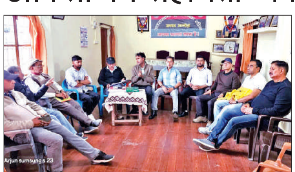
अल्मोड़ा में आयोजित बैठक में मौजूद सोसाइटी के सदस्य।

सहमति के कचहरी बाजार स्थित स्व. जनरल बीसी जोशी सभागार में आयोजित बैठक में रेडक्रॉस के कार्यों में आमजन की भागीदारी बढ़ाने के लिए जागरूकता अभियान चलाने और टैक्सी चालकों को सीपीआर प्रशिक्षण