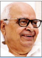
हृदय नारायण दीक्षित पूर्व विधानसभा अध्यक्ष उत्तर प्रदेश

भारतीय ज्ञान परंपरा में 10 दिशाएं हैं। काल गणना भी है। वासना भी जन्म और जीवन के साथ आई है। वासना का अनुशासन प्रार्थना है। जीवन ऊर्जा का अधोगामी प्रवाह वासना है। वासना भी एक दिशा है, लेकिन इसका कार्यव्यवहार दुखदायी है। लोकमंगल के विपरीत भी है। जीवन ऊर्जा की दूसरी दिशा प्रार्थना है। वासना और प्रार्थना दोनों में ही हमारी चेतन ऊर्जा ही मुख्य कारक है। दोनों में स्वयं के प्रति आस्तिकता है, लेकिन प्रार्थना में प्रार्थन के प्रति गजब का विश्वास है। ऋग्वेद में प्रार्थना है-हे देवो! हमारा मन शुभ करो। यजुर्वेद में प्रार्थना है-तन्मे मनः शिवसंकल्पमस्तु-हमारे मन को कल्याणकारी संकल्प से भरो। विरोधाभास ध्यान देने योग्य है। मन हमारा है, इसे शुभ या शिव बनाने की प्रार्थना हम दूसरे से क्यों करते हैं? प्रार्थना का अंतर्भूत तत्व ऐसा नहीं है। कोई देवता प्रार्थना सुनकर हमारा