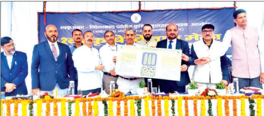
हवालबाग में शनिवार को आयोजित कृषि विज्ञान मेले में बीजों का लोकार्पण किया गया।