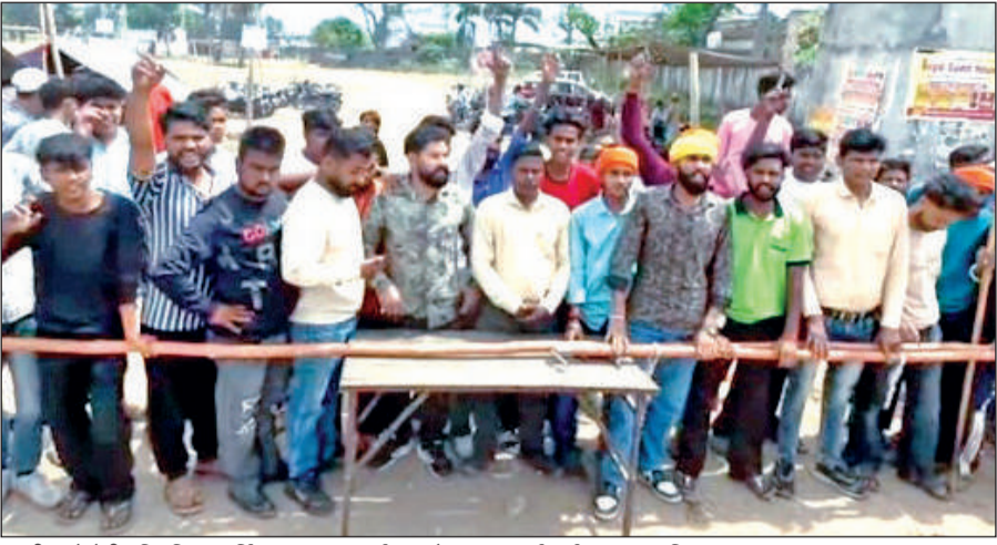
काशीपुर में चैती मंदिर स्थित पार्किंग स्थल पर प्रदर्शन करते भाजपा कार्यकर्ता। • अमृत विचार

अमृत विचार: पार्किंग पर्ची को लेकर चैती मेला पार्किंग कर्मचारियों ने बाउंसरों के साथ मिलकर एक भाजपा नेता की पिटाई कर दी। आक्रोशित लोगों ने पार्किंग के बाहर प्रदर्शन कर मेला प्रशासन से टेका निरस्त करने की मांग की। वहाँ भाजपा नेता ने राजकीय चिकित्सालय में अपना मेडिकल कराकर पुलिस में तहरीर देकर आरोपियों के खिलाफ कार्यवाही की मांग की है।