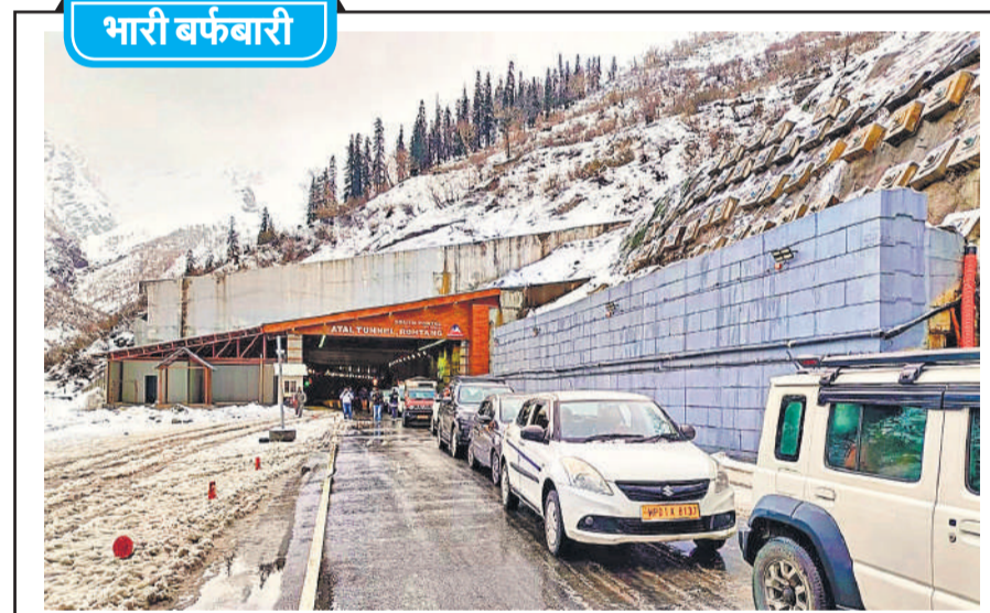
भारी बर्फबारी मनाली के रोहतांग स्थित अटल सुरंग के दक्षिणी पोर्टल पर भारी हिमपात के कारण लगभग 1000 वाहन और 5000 से अधिक पर्यटक बर्फ में फंस गए।

नासिक। महाराष्ट्र के नासिक जिले में एक कार के कुएं में गिरने से एक ही परिवार के नौ सदस्यों की मौत हो गई। मरने वालों में छह बच्चे भी शामिल हैं। एक पुलिस अधिकारी ने बताया कि यह दुर्घटना शुक्रवार रात करीब 10 बजे डिंडोरी कस्बे के शिवाजी नगर इलाके में हुई। मुख्यमंत्री देवेंद्र फडणवीस ने इस घटना में बच्चों की मौत पर शोक व्यक्त किया और कहा कि उन्होंने सार्वजनिक क्षेत्रों में खुले कुओं की तत्काल सुरक्षा जांच के आदेश दिए हैं। पुलिस के अनुसार, ये सभी लोग इलाके में एक बैकवेट हॉल में आयोजित कार्यक्रम में शामिल होने के बाद घर लौट रहे थे, तभी उनकी कार कार्यक्रम स्थल के पास ही स्थित एक कुएं में गिर गई। नासिक के जिलाधिकारी को घटना की जांच करने और जांच रिपोर्ट पेश करने के लिए कहा गया है।