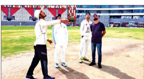
टॉस के दौरान मौजूद टीमों के कप्तान।