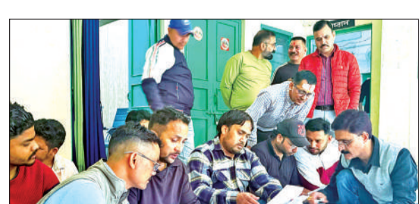
बागेश्वर में संघर्ष वाहिनी के सदस्यों से वार्ता करते जिला पूर्ति अधिकारी।