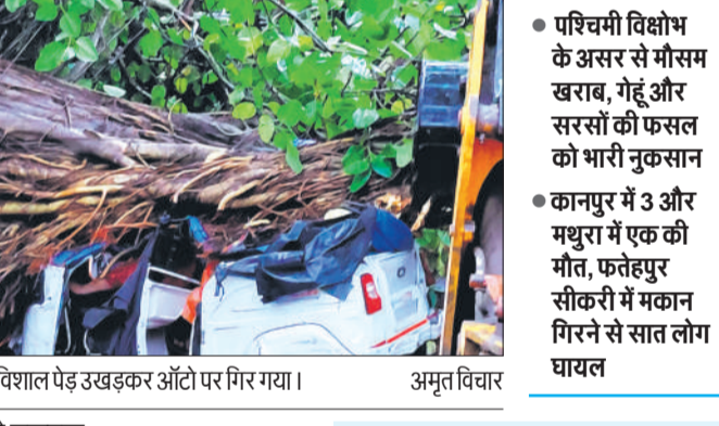
कानपुर में विशाल पेड़ उखड़कर आँटो पर गिर गया।

राज्य ब्यूरो, लखनऊ प्रदेश में शनिवार को आए तेज आंधी-तूफान, बारिश व ओलावृष्टि ने तबाही मचाई। कानपुर के काकादेव में आटो पर पेड़ गिरने से चालक और एक महिला की मौत हो गई। गुजैनी में जलभराव में बाइक फिसलने से एक युवक की जान चली गई। मथुरा में हाईटेशन लाइन टूटकर जमीनी पर गिर गई, जिसकी चपेट में आकर बाइक सवार बिजली मिस्त्री की मौत हो गई। मौसम विभाग के अनुसार, मध्य यूपी समेत प्रदेश के लगभग आधे हिस्से में बारिश हुई। मथुरा में तेज आंधी के चलते बिजली व्यवस्था पूरी तरह चरमरा गई। करीब 600 बिजली के खंभे टूट गए, जिससे 200 गांवों की बिजली आपूर्ति ठप हो गई। वहीं, फतेहपुर सीकरी में मकान गिरने से सात लोग घायल हो गए। आगरा, मथुरा, कानपुर-बुंदेलखंड और जालौन समेत कई जिलों में गेहूँ और सरसों की फसल को भारी नुकसान हुआ है। लखनऊ में आम की फसल को करीब 15