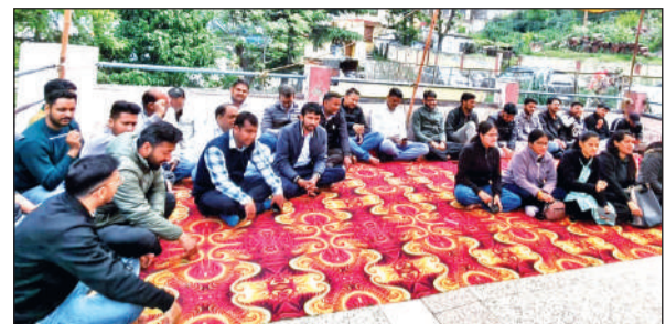
अल्मोड़ा में शनिवार को भी डिप्लोमा इंजीनियर्स ने प्रदर्शन किया। • अमृत विचार