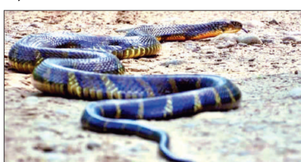
सीतावनी में दिखाई दिया विशाल किंग कोबरा। • अमृत विचार

अमृत विचार: रामनगर वन प्रभाग के सीतावनी पर्यटन जोन में शनिवार की सुबह जंगल सफारी पर निकले पर्यटकों को मंदिर के पास सड़क पर अचानक एक विशालकाय किंग कोबरा दिखाई दिया। जिप्सी में बैठे पर्यटक इसे देखकर दंग रह गए।