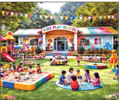
प्ले स्कूल का एआई फोटो।

कोई संस्था बच्चों की शिक्षा से जुड़ी गतिविधियां चला रही है, तो उसे अपनी मान्यता, पंजीकरण और अन्य जरूरी दस्तावेज विभाग को उपलब्ध कराने चाहिए। इधर, शहर में बिना