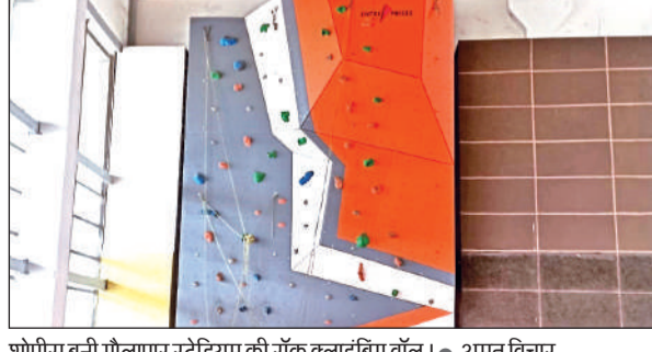
शोपीस बनी गौलापार स्टेडियम की रॉक क्लाइंबिंग वॉल।

अमृत विचार: इंदिरा गांधी अंतरराष्ट्रीय स्पोर्ट्स स्टेडियम में साहसिक खेलों को बढ़ावा देने के उद्देश्य से बनाई गई रॉक क्लाइंबिंग वॉल आज शोपीस बनकर रह गई है। वर्ष 2016 में तैयार हुई यह कृत्रिम चट्टान की दीवार बीते दस वर्षों में एक बार भी खिलाड़ियों के उपयोग में नहीं आ सकी है। मुख्य कारण यह है कि खेल विभाग अब तक इसके लिए प्रशिक्षित कोच की नियुक्ति नहीं कर पाया है। रॉक क्लाइंबिंग वॉल प्राकृतिक चट्टानों की तर्ज पर बनाई गई कृत्रिम संरचना होती है, जिस पर खिलाड़ियों को सुरक्षित तरीके से चढ़ने का प्रशिक्षण दिया जाता है।