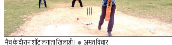
मैच के दौरान शॉट लगाता खिलाड़ी।