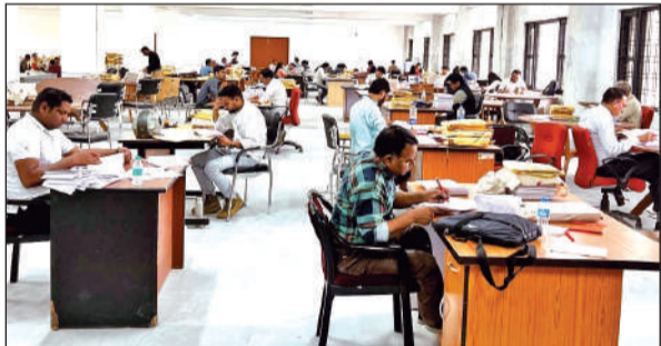
यूओयू में मूल्यांकन कार्य करते हुए शिक्षक।