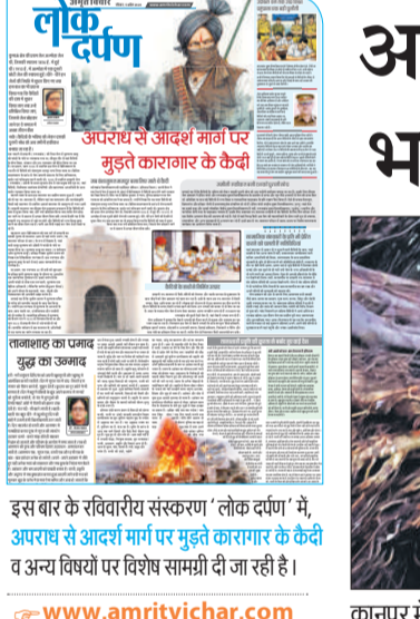
अपराध से आदर्श मान पर मुद्रित कारागार के कैदी

मोदी ने कहा कि उन्होंने कांग्रेस नेताओं से कई बार कहा है कि इस तरह के गैरजिम्मेदाराना बयान देने का यह समय नहीं है, क्योंकि खाड़ी क्षेत्र में रहने वाले लाखों भारतीय भाइयों और बहनों की सुरक्षा भारत की जिम्मेदारी है। उन्होंने कहा, केरल के लाखों निवासी इस क्षेत्र में काम करते हैं, फिर भी कांग्रेस नेताओं के गैरजिम्मेदाराना बयान उनकी सुरक्षा को खतरें में डाल रहे हैं। मैं कांग्रेस नेताओं से आग्रह करता हूँ कि वे ऐसे बयान देने से बचें, जिनसे पश्चिम एशिया में रहने वाले भारतीयों की जान को खतरा हो सकता है। हमारी सरकार के खाड़ी देशों के साथ मजबूत संबंध ही इन कठिन समय में हमारे लोगों की रक्षा करने में मददगार साबित हो रहे हैं।