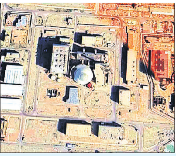
बहरीन ने होर्मुज स्ट्रेट खुलवाने के प्रस्ताव पर मतदान स्थगित किया

काहिरा, एजेंसी पश्चिम एशिया जंग जैसे-जैसे आगे बढ़ रही है, वैसे-वैसे इसका खतरा और दायरा भी बढ़ता जा रहा है। ईरान के बुशहर परमाणु प्लांट पर शनिवार को हमला हुआ। प्लांट के पास एक प्रोजेक्टाइल गिरा, जिसमें एक गाई की मौत हो गई और इमारत को भी नुकसान पहुंचा है। ईरान के परमाणु प्लांट पर हुए इस हमले से रेडिएशन का भी खतरा बढ़ गया है। युद्ध के दौरान इस संयंत्र को चौथी बार निशाना बनाया गया है।