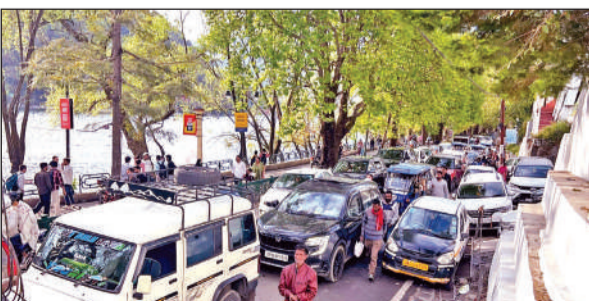
शहर की माल रोड में पर्यटकों के वाहनों से लगी लंबी कतार। ● अमृत विचार

अमृत विचार : सरोवर नगरी नैनीताल में पर्यटन सीजन शुरू होने से पहले ही यातायात व्यवस्था लड़खड़ाती नजर आने लगी है। वीकेंड पर पर्यटकों की भारी भीड़ के कारण शहर में जगह-जगह जाम की स्थिति रही, जिससे स्थानीय लोगों और पर्यटकों को परेशानी का सामना करना पड़ा। शनिवार को अपर माल रोड दिनभर जाम में फंसा रहा।