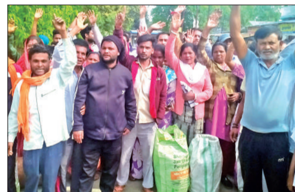
दिनेशपुर में जाफरपुर मार्ग पर जाम लगाते लोग।