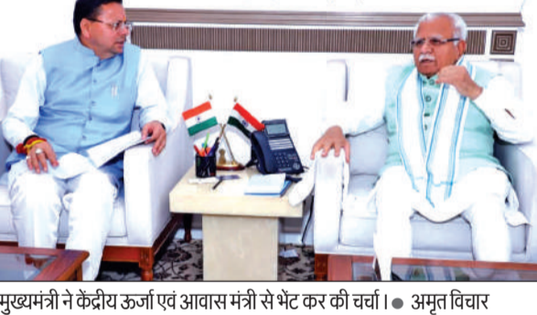
मुख्यमंत्री ने केंद्रीय ऊर्जा एवं आवास मंत्री से भेंट कर की चर्चा। • अमृत विचार

संस्थान (हीरा कुंवर स्कूल के पीछे), कुंवरपुर, गौलापार) में आयोजित इस प्रशिक्षण के लिए 18 से 50 वर्ष आयु वर्ग के इच्छुक अभ्यर्थी 8 अप्रैल तक आवेदन कर सकते हैं। पूरे जिले के लिए कुल 35 सीटें निर्धारित की गई हैं। यह प्रशिक्षण पूरी तरह आवासीय और नि:शुल्क होगा। प्रतिभागियों को चाय, नाश्ता, भोजन, यूनिफॉर्म और प्रशिक्षण सामग्री भी मुफ्त उपलब्ध कराई जाएगी। इच्छुक अभ्यर्थियों को आवेदन के लिए आधार कार्ड, राशन कार्ड/जॉब कार्ड, चार पासपोर्ट साइज फोटो और बैंक पासबुक की फोटोकॉपी के साथ संस्थान में उपस्थित होना होगा। प्रशिक्षण सफलतापूर्वक पूरा करने वाले अभ्यर्थियों को ग्रामीण विकास मंत्रालय द्वारा प्रमाण पत्र प्रदान किया जाएगा। अधिक जानकारी के लिए अभ्यर्थी 05946-266095, 8477009546 और 9756947425 पर संपर्क कर सकते हैं।