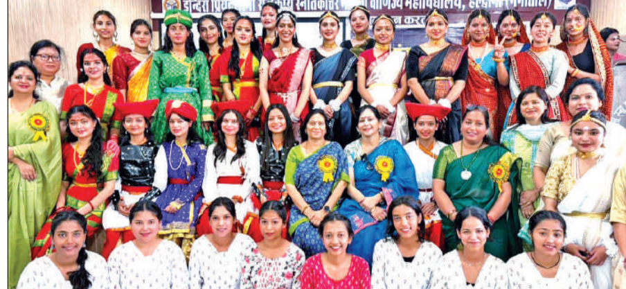
राजकीय महिला पीजी कॉलेज में आयोजित कार्यक्रम के दौरान मौजूद छात्राएं।