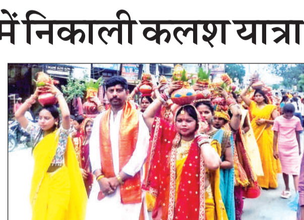
सितारगंज में कलश यात्रा निकालती महिलाएं।