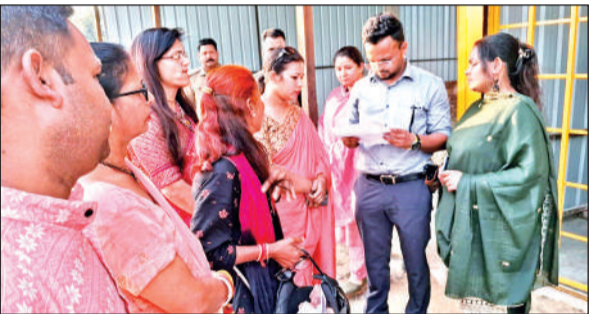
काशीपुर में दुकान खुलने का विरोध करते महिला।

अमृत विचार : चैती चौराहे के पास खुल रही नई शराब की दुकान का महिलाओं ने जमकर विरोध किया। उन्होंने कहा कि शराब की दुकान खुलने से इस मार्ग पर अराजकता का माहौल हो जाएगा। चैती चौराहा के पास देशी शराब की दुकान से चंद कदमों की दूरी पर अंग्रेजी शराब की नई दुकान खोली जा रही है। शनिवार की शाम को 15-20 महिलाएं दुकान पर पहुंच गईं और दुकान खोलने का विरोध करने लगीं। महिलाओं ने कहा कि यहां पर वर्ष 2026-27 के लिए नई शराब की दुकान खोली गई है। जबकि पास में ही मां बाल सुंदरी देवी मंदिर, छठ पूजा घाट के अलावा एक स्कूल के साथ ही महाविद्यालय