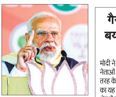
प्रधानमंत्री मोदी बोले- पश्चिम एशिया को लेकर दिए गए बयानों पर कांग्रेस को जनता और देश से मांगनी चाहिए माफ़ी

प्रधानमंत्री नरेंद्र मोदी ने शनिवार को कांग्रेस पर पश्चिम एशियाई देशों के साथ भारत के संबंधों में तनाव पैदा करने के उद्देश्य से भड़काऊ बयान देने का आरोप लगाया, ताकि उन्हें राजनीतिक रूप से नुकसान पहुंचाया जा सके और इस तरह राजनीतिक फायदा प्राप्त किया जा सके। कांग्रेस और उसके सहयोगियों पर निशाना साधते हुए मोदी ने कहा कि वे केवल चुनाव जीतने के बारे में ही चिंतित हैं।