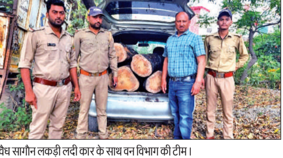
अधैव सागौन लकड़ी लदी कार के साथ वन विभाग की टीम।

क्लाइंबिंग शुरू करने की पहल भी की थी, लेकिन वह आगे नहीं बढ़ सकी। यह खेल जोखिम भरा होने के कारण बिना प्रशिक्षित कोच और सुरक्षा इंतजाम के खिलाड़ियों को अनुमति नहीं दी जा सकती।