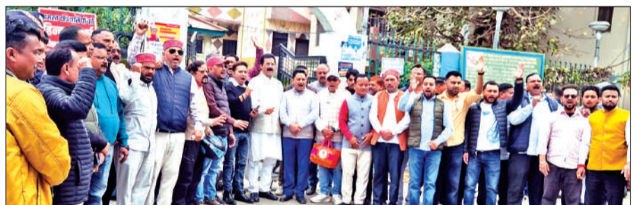
अल्मोड़ा के चौधानपाटा में मिष्ठान वितरण करते भाजपा कार्यकर्ता।