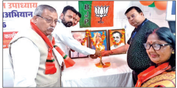
काशीपुर में समापन कार्यक्रम का शुभारंभ करते भाजपा पदाधिकारी।

अमृत विचार: पंडित दीनदयाल उपाध्याय प्रशिक्षण महाभियान 2026 के तहत विधानसभा काशीपुर के भाजपा नगर मंडल के तत्वाधान में श्री अग्रवाल सभा भवन में दो दिवसीय प्रशिक्षण अभियान का समापन हुआ।