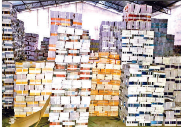
गांव कीरतपुर कोलडा स्थित गोदाम में रखी फर्जी एनसीईआरटी की किताबें।