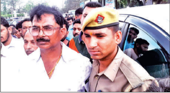
ठेकेदार को हिरासत में लेकर जाते पुलिस कर्मी।