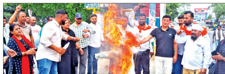
बैलपड़ाव में शनिवार को विरोध स्वरूप पुतला दहन करते कांग्रेस कार्यकर्ता।