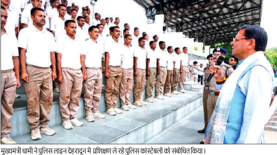
मुख्यमंत्री धामी ने पुलिस लाइन देहरादून में प्रशिक्षण ले रहे पुलिस कांस्टेबलों को संबोधित किया।

मुख्यमंत्री ने कहा कि केंद्र सरकार द्वारा इस स्वीकृति के अंतर्गत उत्तरकाशी जिले में राष्ट्रीय राजमार्ग-134 पर भूस्खलन से प्रभावित 17 स्थलों के उपचार के लिए 233 करोड़ रु. तथा पिथौरागढ़ जिले में राष्ट्रीय राजमार्ग-09 के तवाघाट-घटियाबागड़ खंड पर 3 संवेदनशील स्थलों के लिए 228 करोड़ रु. की राशि स्वीकृत की गई है। यह पहल न केवल आपदा जोखिम को कम करने में सहायक होगी, बल्कि प्रदेश के दुर्गम एवं सीमांत क्षेत्रों में आवागमन को भी सुगम बनाएगी।