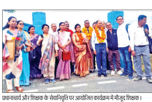
प्रधानाचार्य और शिक्षक के सेवानिवृत्ति पर आयोजित कार्यक्रम में मौजूद शिक्षक।

एवं 6 अप्रैल को इज्जतनगर में यात्रा समाप्त करेगी। यह गाड़ी इज्जतनगर-लालकुआं के मध्य निरस्त रहेगी। 55311 कासगंज-लालकुआं सवारी गाड़ी 6 अप्रैल को पंतनगर में यात्रा समाप्त करेगी। यह गाड़ी पंतनगर-लालकुआं के मध्य निरस्त रहेगी। 15062 लालकुआं-कासगंज एक्सप्रेस गाड़ी का संचलन 6 अप्रैल को पंतनगर में शॉर्ट-ओरिजनट कर किया जायेगा। यह गाड़ी पंतनगर-लालकुआं के मध्य निरस्त रहेगी। 55312 लालकुआं-कासगंज सवारी गाड़ी का संचलन 6 एवं 7 अप्रैल को इज्जतनगर में शॉर्ट-ओरिजनट कर किया जायेगा। यह गाड़ी इज्जतनगर-लालकुआं के मध्य निरस्त रहेगी।