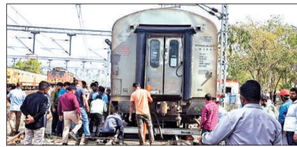
पटरी से उतरे कोच को वापस चढ़ाते रेलकर्मी।

इस अप्रत्याशित घटना से मौके पर रेल कर्मियों में अफरा-तफरी मच गई। रेल कर्मियों तुलंत डिब्बे के पीछे दौड़े और उसे रोकने का प्रयास किया, लेकिन सफल नहीं हो सके। प्रत्यक्षदर्शियों ने बताया कि पिट