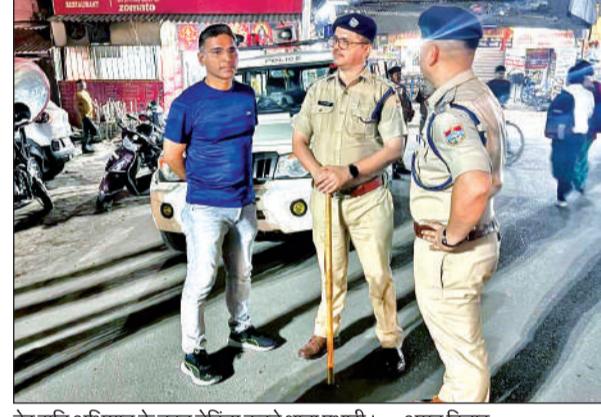
देर रात्रि अभियान के तहत चेकिंग करते थाना प्रभारी।