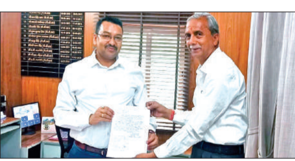
गैस वितरण में सुधार के लिए सिटी मजिस्ट्रेट को ज्ञापन सौंपते वरिष्ठ नागरिक।

शनिवार सुबह पीसी बिष्ट के आवास पर आयोजित बैठक में वरिष्ठ नागरिकों ने कहा कि जब गैस की होम डिलीवरी व्यवस्था पहले से लागू है, तो उपभोक्ताओं को सिलेंडर के लिए लाइन में खड़ा करना अनुचित है। बैठक में यह भी सामने आया कि कई उपभोक्ताओं को बुकिंग के 20 दिन बाद भी गैस उपलब्ध नहीं हो सकी है। ऐसे उपभोक्ताओं की सूची तैयार कर प्रशासन से समाधान की मांग