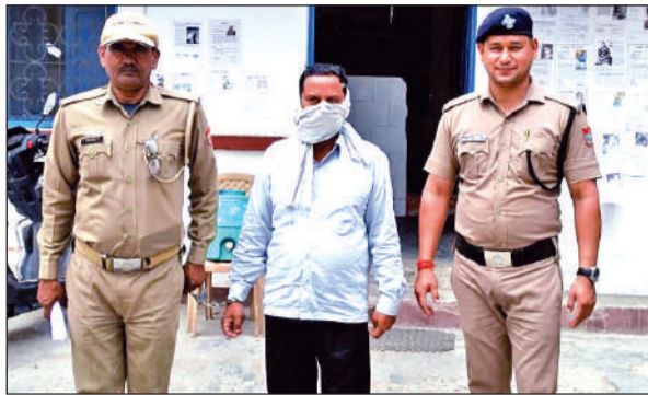
पुलिस की गिरफ्त में आरोपी।