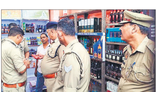
एक शराब की दुकान पर चेकिंग करती टीम।