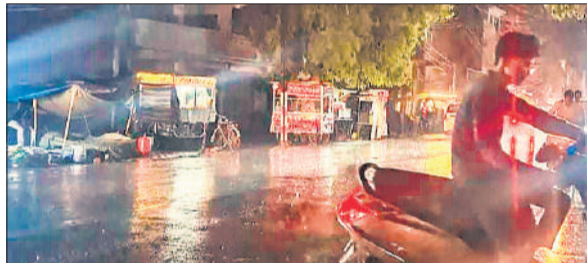
शहर में देर शाम होती बारिश।

अमृत विचार: जिले में शनिवार की शाम अचानक मौसम ने करवट ले ली। दिन भर गर्मी के बाद शाम होते-होते तेज धूल भरी आंधी चली, जिसके साथ झमाझम बारिश शुरू हो गई। कई इलाकों में ओलावृष्टि भी हुई, जिससे मौसम पूरी तरह ठंडा हो गया और लोगों को गर्मी से राहत मिली, लेकिन किसानों की चिंता बढ़ गई। दिन में जहां अधिकतम तापमान 32 डिग्री सेल्सियस दर्ज किया गया था, वहीं आंधी और बारिश के बाद तापमान में तेजी से गिरावट आई और यह करीब 25 डिग्री सेल्सियस तक पहुंच गया। तेज हवाओं के कारण कई स्थानों पर