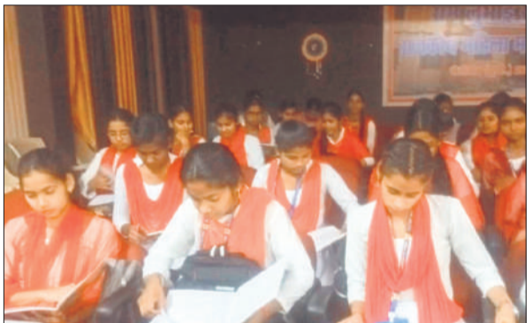
प्रतियोगिता में शामिल छात्राएं।