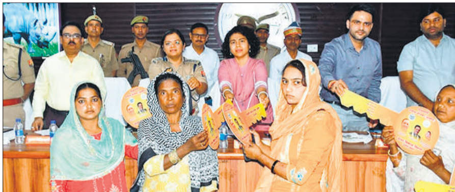
सीएम आवास योजना (ग्रामीण) के तहत लाभार्थियों को आवास की चाबियां देने के दौरान डीएम, एसपी आदि।