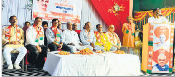
कार्यक्रम में मंच पर मौजूद अतिथि।