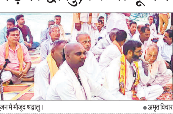
पूजन में मौजूद श्रद्धालु।