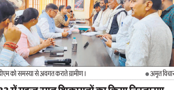
डीएम को समस्या से अवगत कराते ग्रामीण।