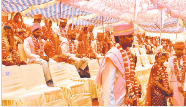
सामूहिक विवाह समारोह में मौजूद वर-वधू।