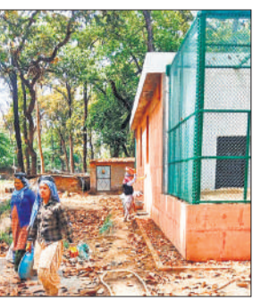
बनारसी नदी किनारे का कार्य पूरा होने के बाद मलबा हटाते श्रमिक।

एवं कानपुर के चिड़ियाघरों में ले जाया जाता है। पीलीभीत टाइगर रिजर्व बनने के बाद से अब तक करीब 11 बाघ-बाघियों को रेस्क्यू करने के बाद बीमारी या अन्य कारणों से गोरखपुर, कानपुर एवं लखनऊ चिड़ियाघर भेजा जा चुका है। यह दीगर बात है कि इन सभी बाघों में एक भी बाघ या बाघिन घर वापसी नहीं कर सका। केंद्र सरकार ने समस्या को देखते हुए करीब चार साल पहले पीलीभीत टाइगर रिजर्व