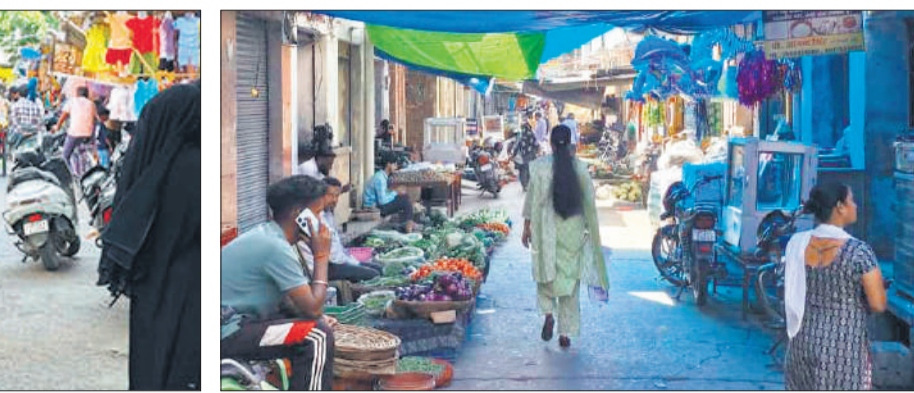
● अमृत विचार पुरानी सब्जी मंडी में फिर पसरने लगा अतिक्रमण।