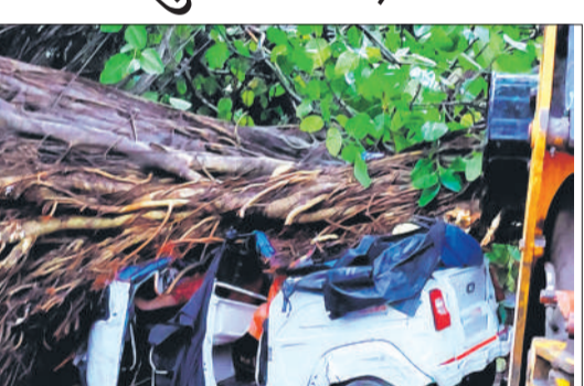
कानपुर में विशाल पेड़ उखड़कर आँटो पर गिर गया।