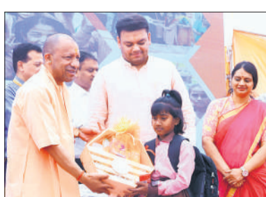
वाराणसी: स्कूल चलो अभियान के शुभारंभ अवसर पर एक बच्ची को स्कूल बैग, किताब व उपहार देते मुख्यमंत्री योगी।

योगी ने कहा कि शिक्षा सबसे पवित्र कार्य है और हर बच्चे को शिक्षित करना समाज व राष्ट्र की समृद्धि के लिए अनिवार्य है। उन्होंने कहा कि जब