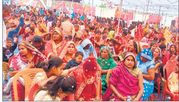
समारोह में मौजूद वर वधुओं के परिजन।