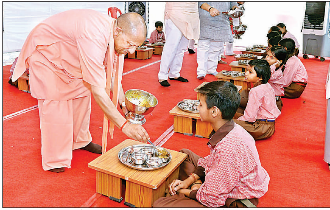
वाराणसी : 'स्कूल चलो अभियान' की शुरुआत के मौके पर बच्चों को मिड डे मील परोसते मुख्यमंत्री योगी आदित्यनाथ।