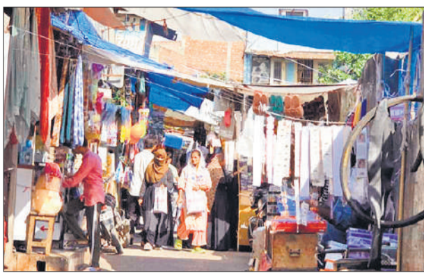
राम स्वरूप पार्क की गलियों में अतिक्रमण।

दो साल पहले सख्ती के दावे करते हुए गरजी थी जेसीबी, नगर पालिका पर निगरानी की छोड़ी थी जिम्मेदारी, झांकने भी नहीं गए कर्मचारी