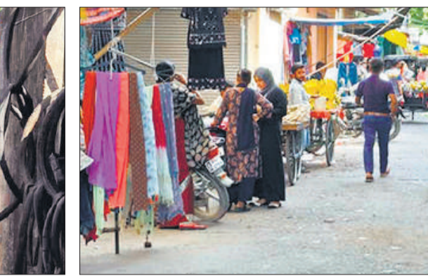
● अमृत विचार किराना मंडी जाने वाले मुख्य मार्ग पर सड़क पर सजी दुकानें।