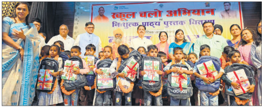
जनप्रतिनिधियों और अधिकारियों संग किताब, बैग से लाभान्वित बच्चे।

संस्कृति, इनरव्हील क्लब की अध्यक्ष, राजकीय किशोर कल्याण बोर्ड