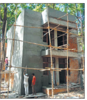
निर्माणाधीन रेस्क्यू सेंटर में बनाए जा रहे आवास।

पीलीभीत टाइगर रिजर्व के जंगल में बाघ एवं तेंदुओं के हिंसक होने के साथ उनके व्यवहार में परिवर्तन एवं बीमार या घायल होने की स्थिति में इलाज के लिए गोरखपुर, लखनऊ