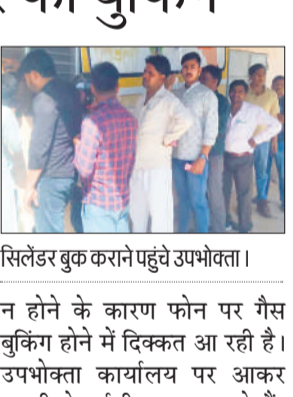
सिलेंडर बुक कराने पहुंचे उपभोक्ता।