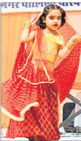
चैती मेला के सांस्कृतिक मंच पर रिकार्डिंग गीत पर नृत्य करती बालिका।