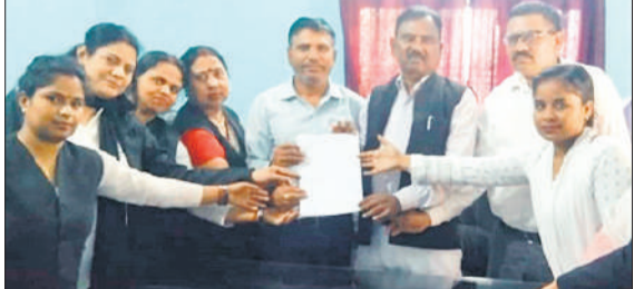
गोला तहसील में बार संघ के पदाधिकारियों को पत्र देती महिला अधिवक्ता।