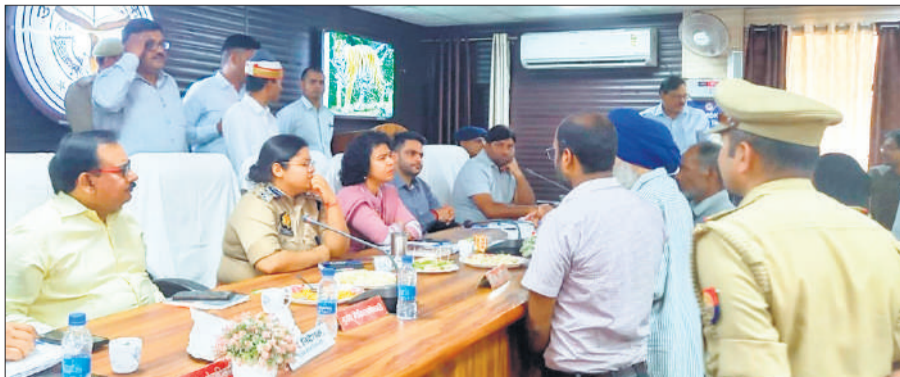
पलिया के संपूर्ण समाधान दिवस में जनसमस्याएं सुनीं डीएम और एसपी।

संपूर्ण समाधान दिवस: अधिकारियों को जनशिकायतों की निष्पक्ष जांच कर समयबद्ध एवं गुणवत्तापूर्ण निस्तारण के लिए निर्देश