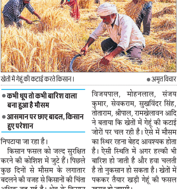
● अमृत विचार