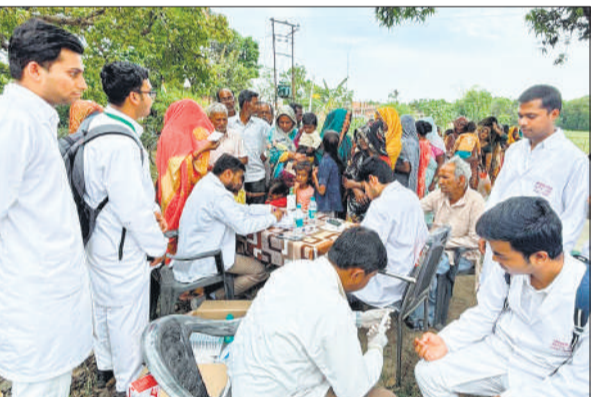
शिविर में ग्रामीणों को चेकअप कर दवा देती टीम।

अमृत विचार : ग्रामीण क्षेत्रों में स्वास्थ्य सेवाएं पहुंचाने के उद्देश्य से शनिवार को खाग गांव में निःशुल्क स्वास्थ्य शिविर लगाया गया। मेडिकल कॉलेज से संबद्ध जिला अस्पताल की टीम ने शिविर में 182 ग्रामीणों की जांच कर उन्हें परामर्श व दवाएं उपलब्ध कराईं। मेडिकल कॉलेज से संबद्ध जिला अस्पताल की ओर से फैमिली एडॉप्शन प्रोग्राम के तहत शनिवार को खाग गांव में निःशुल्क स्वास्थ्य शिविर का आयोजन किया गया। जिसमें विशेषज्ञ डॉक्टरों की टीम ने 182 ग्रामीणों