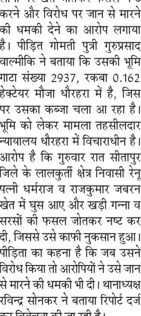
● अमृत विचार