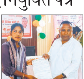
नियुक्ति पत्र वितरित करते विधायक।