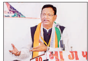
भाजपा प्रदेश अध्यक्ष पंकज चौधरी।

के बाद बोल रहे थे। उन्होंने कहा कि प्रशिक्षण केवल राजनीतिक कार्यक्रम नहीं, बल्कि व्यक्तित्व निर्माण और नेतृत्व विकास का माध्यम है। भाजपा को अन्य दलों से अलग बताते हुए उन्होंने कहा कि यह पार्टी "राष्ट्र प्रथम, संगठन सर्वोपरि और अत्यंत कार्य" के सिद्धांतों पर कार्य करती है। पंकज चौधरी ने कहा कि पार्टी