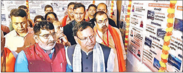
महाराजगंज में पं. दीनदयाल उपाध्याय प्रशिक्षण अभियान की शुरुआत के मौके पर लगाई गई प्रदर्शनी देखते भाजपा अध्यक्ष पंकज चौधरी।