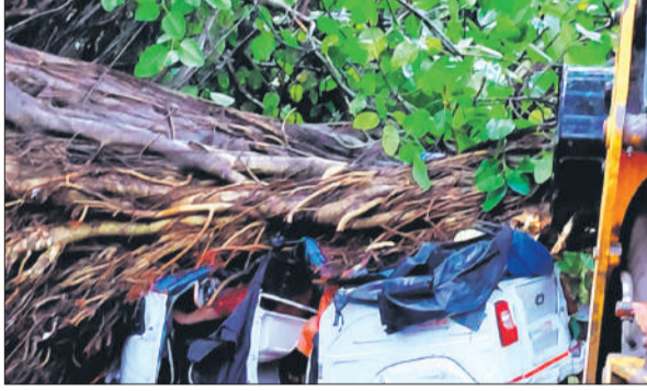
कानपुर में विशाल पेड़ उखड़कर आटो पर गिर गया। अमृत विचार

मौसम विभाग के अनुसार, मध्य यूपी समेत प्रदेश के लगभग आधे हिस्से में बारिश हुई। मथुरा में तेज आंधी के चलते बिजली व्यवस्था पूरी तरह चरमरा गई। फतेहपुर सीकरी में मकान गिरने से सात लोग घायल हो गए। आगरा, मथुरा, कानपुर-बुंदेलखंड और जालौन समेत कई जिलों में गेहूं और सरसों की फसल को भारी नुकसान हुआ है। लखनऊ में आम की फसल को करीब 15 प्रतिशत नुकसान