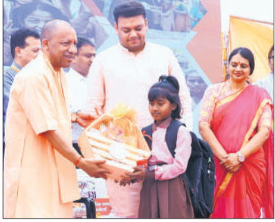
वाराणसी: स्कूल चलो अभियान के शुभारंभ अवसर पर एक बच्ची को स्कूल बैग, किताब व उपहार देते मुख्यमंत्री योगी।

अमृत विचार: मुख्यमंत्री योगी ने शनिवार को वाराणसी के कंपोजिट विद्यालय, शिवपुर (वरुणापार जोन) से नए शैक्षणिक सत्र के लिए 'स्कूल चलो अभियान' का शुभारंभ किया। उन्होंने समाज के हर वर्ग-शिक्षकों, अभिभावकों, जनप्रतिनिधियों और अधिकारियों से आह्वान किया कि कोई भी बच्चा स्कूल जाने से छूटने न पाए। योगी ने कहा कि शिक्षा सबसे पवित्र कार्य है और हर बच्चे को शिक्षित