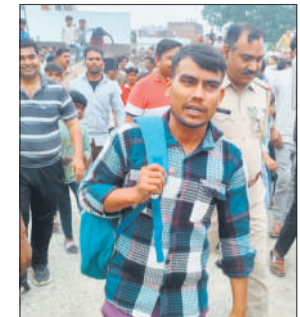
टावर पर चढ़े युवक को पुलिस ने उतारा।

बताया जाता है कि युवक का गांव की ही एक युवती से प्रेम प्रसंग चल रहा था। बीते वर्ष अक्टूबर में वह युवती को अपने साथ गुजरात ले गया था। परिजनों की तहरीर पर पुलिस ने युवक के विरुद्ध मुकदमा दर्ज कर लिया और करीब एक महीने बाद दोनों को जामनगर से बरामद कर लिया और युवक को जेल भेज दिया। अब युवक जेल से छूटा तो उसे पता चला कि युवती की शादी तय कर दी गई है। इससे आक्रोशित युवक शनिवार को किसी मामले में कोर्ट में तारीख से वापस आया और अलीगंज में लगे