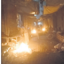
तंग जगह पर रात में कूड़ा जला कर हादसे को दावत दी जा रही।

अमृत विचार : नगर पालिका परिषद के सफाई कर्मचारियों की लापरवाही से कभी भी बड़ा हादसा हो सकता है। सब्जी मंडी में पहले भीषण आग लग चुकी है। इससे कई व्यापारियों का लाखों का नुकसान हो चुका और छोटे व्यापारी तो आग लगने से भुखमरी के कगार पर आ चुके लेकिन अब फिर उसी तरह की लापरवाही सफाई कर्मचारियों की तरफ से की जा रही है। मंडी की तंग जगह पर रात में एकत्र बार फिर बड़ा हादसा करा सकता है। सब्जी मंडी की जिन तंग गलियों में लोगों पैदल निकलना मुश्किल है तंग गलियों में व्यापारियों द्वारा अपनी प्रतिष्ठानों को धूप