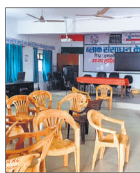
सूना पड़ा रिछा बीआरसी।