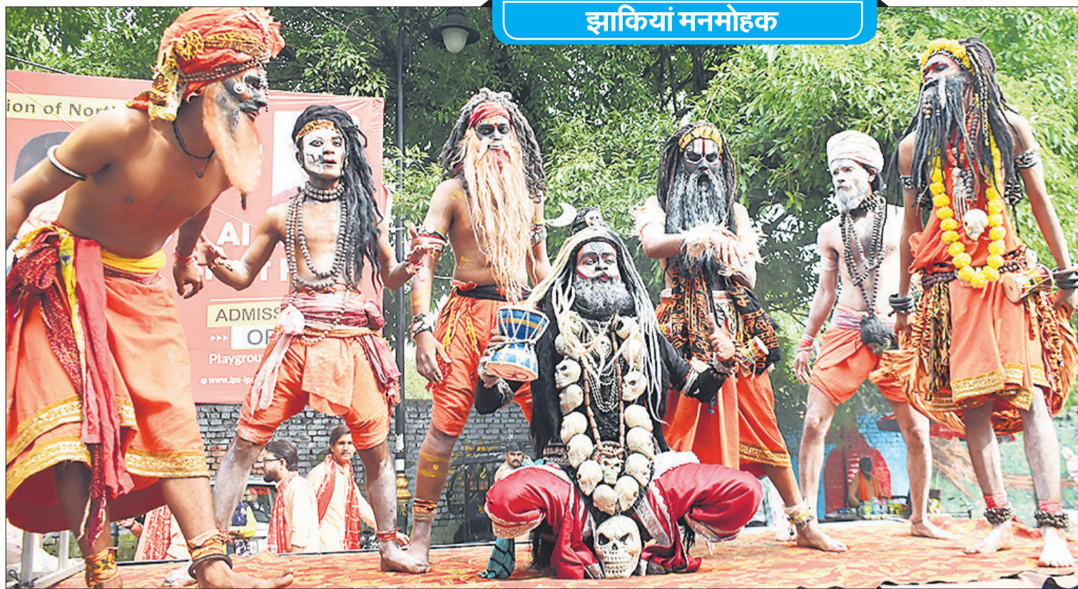
हनुमान जन्मोत्सव के उपलक्ष्य में शहर में श्रद्धा और उत्साह के साथ भव्य शोभायात्रा निकाली गई। इस दौरान झांकियां आकर्षण का केंद्र रही। (संबंधित खबर पेज IV पर)