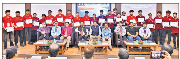
एसआरएमएस में आयोजित कार्यक्रम में विजयी प्रतिभागियों के साथ अतिथि।