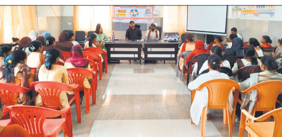
300 बेड अस्पताल में ट्रेनिंग लेती आंगनबाड़ी कार्यकर्त्री।