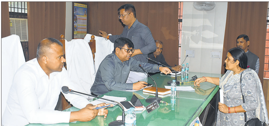
संपूर्ण समाधान दिवस में मंडलायुक्त भूपेन्द्र एस चौधरी ने शिकायतें सुनीं।

अर्जी के साथ बेटे के विवाह आशीर्वाद समारोह का कार्ड भी लगाया। यह भी कहा कि दावत के कार्ड बांटे जा चुके हैं। सिलेंडर मिलेंगे या नहीं, इसका निर्णय डीएसओ करेंगे। डीएसओ को जांच करने के निर्देश दिए हैं। समाधान