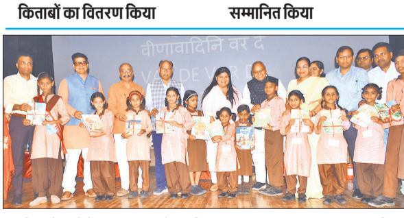
कार्यक्रम में बच्चों के साथ सांसद, मेयर, विधायक व आला अफसर। ● अमृत विचार