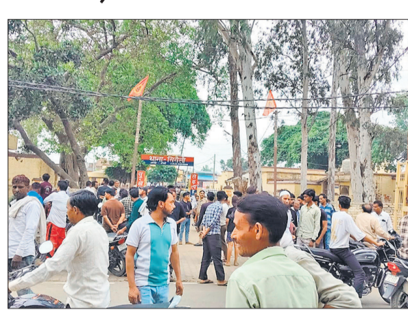
विवाद के बाद सिरौली थाने के बाहर जमा भीड़।