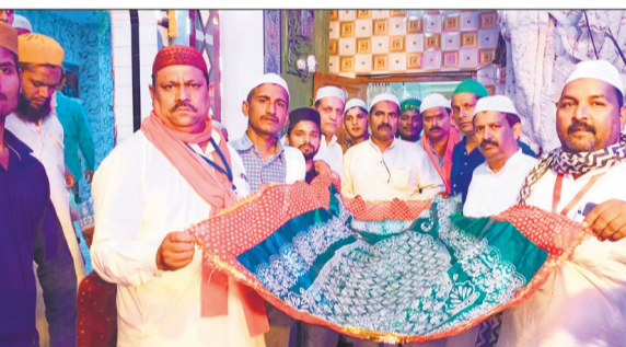
दरगाह शाहदाना वली पर चादरपोशी करते अकीदतमंद।