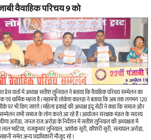
22वाँ पंजाबी वैवाहिक परिचय सम्मेलन 9 अप्रैल (बु)