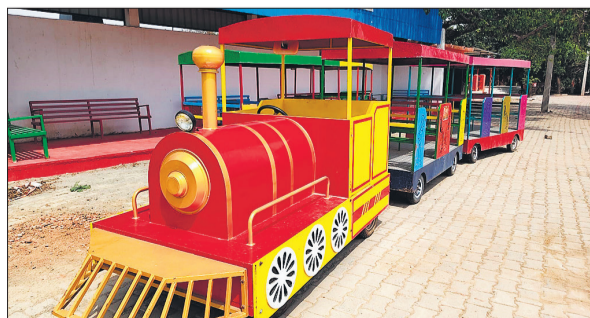
पंक्चर हो गए हैं। मौके पर केयर टेकर भी नहीं मिला।

अमृत विचार : पर्यटन विभाग ने पिछले साल जब रामनगर की ऐतिहासिक लिलौर झील किनारे टॉय ट्रेन का संचालन शुरू किया तो ऐसा लगा कि शिमला यहां उतर आया हो, लेकिन अब इस ट्रेन के हालात खराब हैं। ग्राम पंचायत टॉय (फैमिली ट्रेन) का रखरखाव ठीक से नहीं कर रही है। शनिवार को लिलौर झील की फैमिली ट्रेन के संचालन की स्थिति परखी गई तो पांच डिब्बों की ट्रेन में दो डिब्बे खराब खड़े थे। उनके टायरों की हवा निकली हुई थी। माना जा रहा है कि दोनों डिब्बों के टायर वाले पहिये