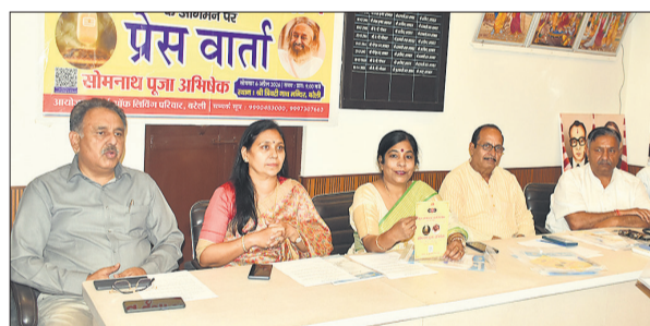
आध्यात्मिक आयोजन के बारे में जानकारी देते आर्ट ऑफ लिविंग परिवार के सदस्य।

अमृत विचार : आर्ट ऑफ लिविंग परिवार की ओर से नाथ नगरी के त्रिवेदी नाथ मंदिर में एक ऐतिहासिक आध्यात्मिक आयोजन होने जा रहा है। जहां पर एक हजार वर्ष प्राचीन सोमनाथ ज्योतिर्लिंग के पावन अवशेष छह अप्रैल को पहुंचेंगे। जिन्हें आर्ट ऑफ लिविंग के संस्थापक श्री श्री रवि शंकर के मार्गदर्शन में देशभर में ले जाया जा रहा है।