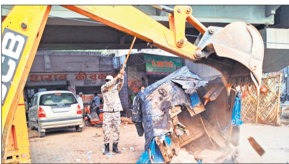
निगम टीम ने जेसीबी के जरिए अतिक्रमण हटवाया।

अमृत विचार : शहर की यातायात व्यवस्था को सुधारने और सड़कों को अतिक्रमण मुक्त करने के लिए नगर निगम की टीम ने शनिवार को मिनी बाईपास पर अभियान चलाया। सड़क किनारे अवैध रूप से कब्जा जमाए लोगों के खिलाफ कार्रवाई करते हुए टीम ने भारी मात्रा में निर्माण सामग्री जब्त की। अवैध रूप से डंप करके रखी गई पांच ट्राली रेटा और बजरी को कब्जे में ले लिया। सार्वजनिक मार्ग को बाधित करने और नियमों के उल्लंघन के आरोप में दुकानदारों से 70 हजार रुपये का जुर्माना वसूला। निगम टीम दोपहर को जैसे ही