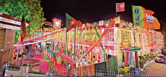
स्थापना दिवस के मौके पर सजाया गया लखनऊ स्थित भाजपा मुख्यालय।

प्रदेश अध्यक्ष एवं केंद्रीय वित्त राज्य मंत्री पंकज चौधरी तथा प्रदेश महामंत्री (संगठन) धर्मपाल सिंह लखनऊ स्थित पार्टी मुख्यालय पर प्रातः 10 बजे ध्वजारोहण करेंगे। इस अवसर पर वरिष्ठ