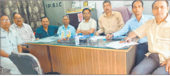
बैठक में मौजूद प्रधानाचार्य परिषद के पदाधिकारी।