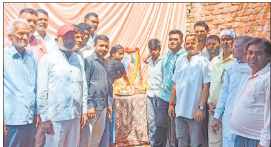
कार्यक्रम में मौजूद लोग।