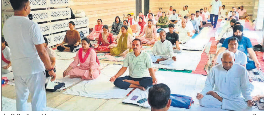
योग शिविर में भाग लेते साधक।

इस दौरान बताया कि शंख प्रक्षालन एक विलक्षण योगिक क्रिया है, जिसमें केवल गुणगुना पौनी संधा नमक के साथ पीकर पांच विशेष आसन (ताडासन, तिर्यक ताडासन, कटिचक्रासन, तिर्यक भुजंग आसन एवं उदराकर्षण) करके आंतों की शुद्धि की जाती है। शंखप्रक्षालन के उपरान्त आतें काम करने के लिए फिर से तरताजा हो जाती हैं। कुछ योग साधकों ने क्रिया सम्पन्न होने के उपरान्त कुंजल, जलनैत, रत्नरसैत, सूत्रनैत आदि क्रियाएं भी कीं। संघ प्रक्षालन में भारतीय योग