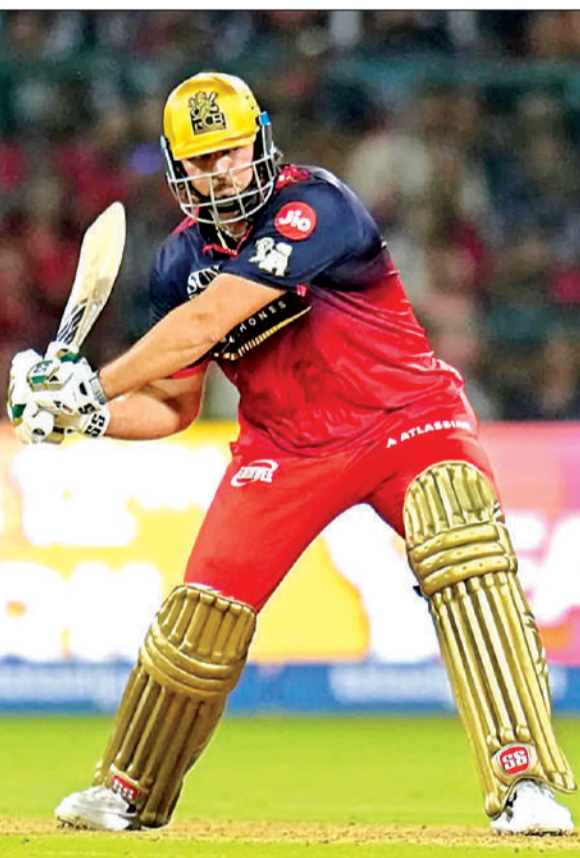
विस्फोटक पारी के दौरान शॉट लगाते टिम डेविड।