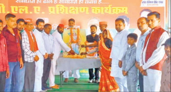
कार्यक्रम में मौजूद सपा कार्यकर्ता। ● अमृत विचार