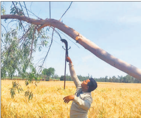
बरखेड़ा क्षेत्र में बिजली के तारों पर गिरा पेड़।