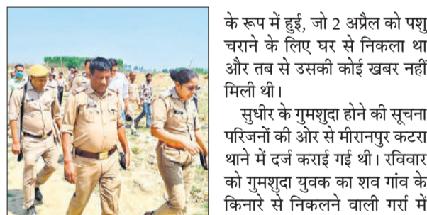
गरा नदी किनारे जांच करती पुलिस।