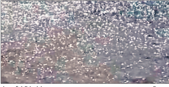
मोहम्मदी में गिरे ओले।