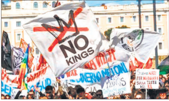
अमेरिकी में कुछ ही दिन पहले महंगाई और ईरान युद्ध के खिलाफ प्रदर्शन किए गए थे।

डीजल का अन्य उद्योगों के अलावा व्यापक रूप से कृषि, निर्माण और परिवहन क्षेत्र में इस्तेमाल किया जाता है। अमेजन ने यह भी कहा कि वह 17 अप्रैल से तीसरा पक्ष विक्रेताओं पर 3.5 प्रतिशत ईंधन अधिभार जोड़ने की योजना बना रही है। अमेरिकी डाक सेवा ने बुधवार को कहा कि वह अस्थायी रूप से आठ प्रतिशत का ईंधन अधिभार लगाने की कोशिश कर रही है।