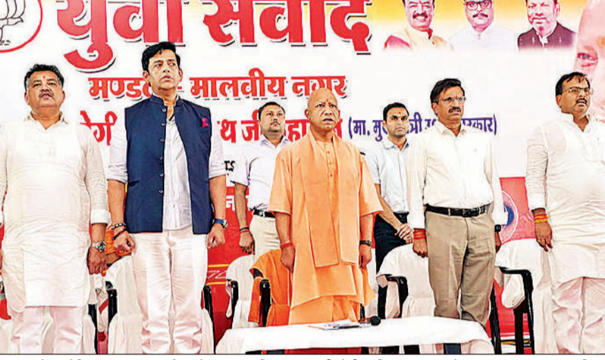
गोरखपुर में आयोजित युवा संवाद कार्यक्रम में मंच पर उपस्थित मुख्यमंत्री योगी आदित्यनाथ, साथ में अन्य। अमृत विचार

चि्लुआताल में फ्लोटिंग सोलर पॉवर प्लांट की स्थापना की मंजूरी दी है। यहां 20 मेगावाट बिजली पैदा होगी जिसका इस्तेमाल सोलर लाइट में किया जाएगा। मुख्यमंत्री ने कहा कि अब गोरखपुर सोलर सिटी के रूप में भी विकसित होगा। नौ साल में नहीं लगाया कोई नया टैक्स : आपनन और आम नागरिकों के हित पर सरकार के रूख का ध्यान आकर्षित करते हुए योगी ने कहा कि नौ साल में उनकी सरकार ने कोई भी नया टैक्स नहीं लगाया। इसके बावजूद प्रदेश की अर्थव्यवस्था को तीन गुना बढ़ाया गया है। उन्होंने नगर निगम को हिदायत दी कि कॉमर्शियल कॉम्प्लेक्स में व्यापारियों से अधिक किराया न लिया जाए।