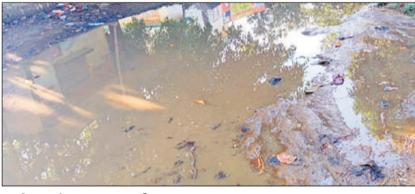
चुरईपुरवा चौराहा पर भरा पानी।

फर्क करना मुश्किल हो जाता है। चुरईपुरवा चौराहा क्षेत्र का प्रमुख बाजार स्थल है, जहां सप्ताह में मंगलवार और शुक्रवार को बाजार लगती है। इन दिनों आसपास के करीब पांच किलोमीटर क्षेत्र से बड़ी संख्या में ग्रामीण सब्जी, फल और अन्य जरूरी सामान खरीदने पहुंचते हैं। लेकिन बारिश के दौरान हालात इतने बदतर हो जाते हैं कि लोगों को घुटनों तक पानी और कीचड़ से होकर गुजरना पड़ता है। दुकानदारों का कहना है कि जलभराव से व्यापार पर असर है। पानी से भरे रास्तों के कारण ग्राहक बाजार तक पहुंचने से बचते हैं। ग्रामीणों का कहना है कि कई बार अधिकारियों से शिकायत की गई, लेकिन स्थायी समाधान नहीं निकला। प्रशासन से मांग की है कि चौराहे पर जल निकासी की पुख्ता व्यवस्था कराई जाए।