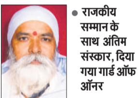
संवाददाता, गोला गोकर्णनाथ

मेले में डॉक्टरों की टीम द्वारा मरीजों की जांच कर उन्हें आवश्यक दवाएं वितरित की गईं। स्वास्थ्य मेले के दौरान सामान्य बीमारियों बुखार, खांसी, जुकाम, ब्लड प्रेशर, शुगर आदि की जांच की गई। इसके साथ ही गर्भवती महिलाओं की विशेष जांच कर उन्हें जरूरी परामर्श दिया गया। बच्चों के टीकाकरण पर भी विशेष ध्यान दिया गया। मेले में आए स्वास्थ्य कर्मियों ने लोगों को साफ सफाई, पोषण और मौसमी बीमारियों से बचाव के बारे में जागरूक किया। ग्रामीणों को बताया गया कि बदलते मौसम में स्वास्थ्य का विशेष ध्यान रखना जरूरी है और किसी भी परेशानी होने पर तुरंत नजदीकी स्वास्थ्य केंद्र पर संपर्क करें।