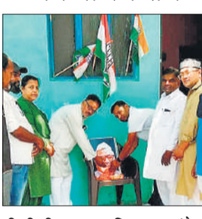
पीलीभीत, अमृत विचार : कांग्रेस