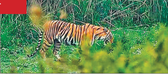
पीटीआर से बाहर आबादी क्षेत्र के नजदीक चलकदमी करता बाघ।

प्रोजेक्ट टीओटीआर का मुख्य उद्देश्य उन बाघों का प्रबंधन करना है जो पीलीभीत टाइगर रिजर्व की सीमाओं को छोड़कर गन्ने के खेतों या फिर रिहायशी इलाकों में