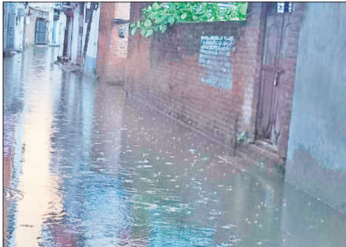
बारिश के बाद शहर की गलियों में इस तरह हुआ जलभराव।