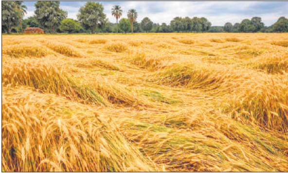
तेज हवा से खेतों में गिरी गोहू की फसल।

हुए। तेज आंधी के साथ अचानक हुई काफी वर्षा से निचले इलाकों में जल भराव हो तो हो ही गया, तेज हवा के कारण मेला मैदान में लगी दुकानों के कई तंबू उड़ गए। गलियों में पानी भर जाने से दुकानदारों और मेलास्थियों को काफी परेशानियां हुई हैं। सांस्कृतिक मंच पर हो रहे स्कूली बच्चों के कार्यक्रम बीच में ही रोक दिये गये।। हालांकि नगर पालिका परिषद ने रविवार को दोपहर बाद मुख्य गली में पानी भरे स्थानों में मिट्टी डलवाने का काम तो शुरू किया, लेकिन वह पर्याप्त नहीं है। आंधी-वर्षा के कारण ग्रामीण क्षेत्रों में बिजली व्यवस्था लड़खड़ा गई है। हैदराबाद फीडर से जुड़े दर्जनों गांव 24 घंटे से अंधेरे में हैं। बिजली कर्मियों का कहना है की दो