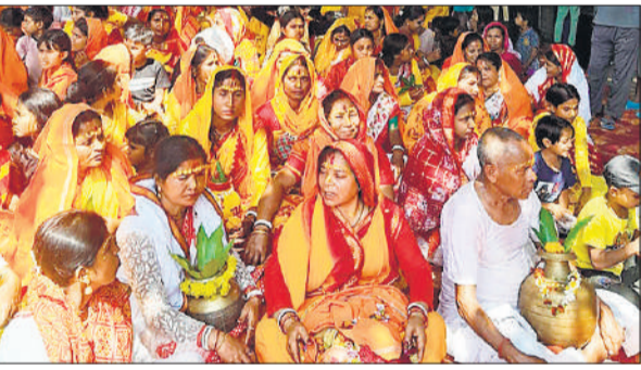
कार्यक्रम में मौजूद श्रद्धालु।

अमरिया, अमृत विचार : जोशी कॉलोनी में तीन दिवसीय अखंड महानाम संकीर्तन रविवार से शुरू हो गया। रविवार को पहले दिन भव्य कलश यात्रा निकाली गई। बड़ी संख्या में श्रद्धालु भजन-कीर्तन करते हुए वापस मंदिर परिसर लौटे और कलश स्थापित किए। जिसके बाद तीन दिन अखंड महानाम संकीर्तन की शुरुआत कर दी गई है।