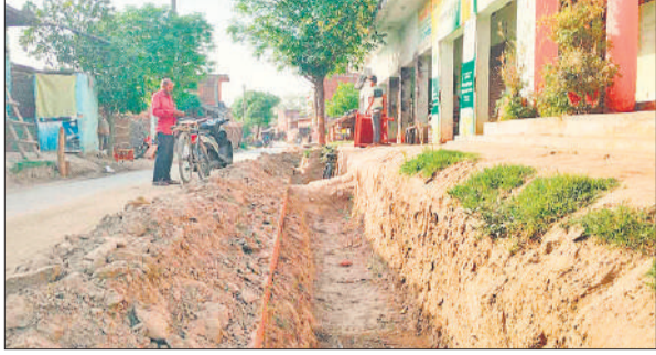
पड़रिया तिलकापुर में खुदा नाला।

अमृत विचार: बिजुआ क्षेत्र की ग्राम पंचायत पड़रिया तिलकापुर में जिला पंचायत द्वारा प्रस्तावित नाला निर्माण कार्य ठेकेदार की लापरवाही के चलते पिछले करीब आठ महीनों से अधूरा है। आरोप है कि ठेकेदार नाला खोदकर चला गया लेकिन निर्माण कार्य दोबारा शुरू नहीं कराया। नतीजतन गांव के लोग रोजमर्रा की समस्याओं से जूझने को मजबूर हैं।