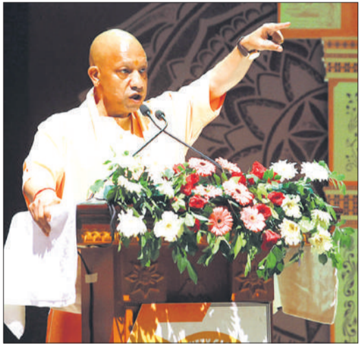
लखनऊ: भारतेंदु नाट्य अकादमी में आयोजित स्वर्ण जयंती नाट्य समारोह के उद्घाटन अवसर पर बोले मुख्यमंत्री योगी।

मुख्यमंत्री योगी रविवार को भारतेंदु नाट्य अकादमी (बीएनए) में 12 अप्रैल तक आयोजित स्वर्ण जयंती नाट्य समारोह का उद्घाटन करने के बाद बोल रहे थे। उन्होंने एक हजार वर्ष पहले महाराज सुहेलदेव के शौर्य