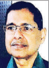
विजय सिंह रुद्रपुर

अमेरिका-ईरान युद्ध के बीच एक अमेरिकी पायलट की तलाश में दोनों देश रेस्क्यू ऑपरेशन चला रहे हैं। हुआ कुछ यूँ कि बीते दिनों एक अमेरिका के युद्धक विमान F-15E को ईरान ने मार गिराया। समय रहते उस विमान के दोनों पायलट कूद गए। खबर मिलते ही अमेरिका ने, अपने पायलटों को सकुशल ईरान के क्षेत्र से निकाल ले जाने के लिए, रेस्क्यू ऑपरेशन शुरू कर दिया। उसके कुछ टोही हेलिकॉप्टर