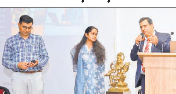
कार्यशाला में मौजूद सहायक पुलिस अधीक्षक व अन्य चिकित्सक।