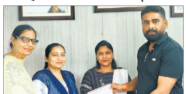
चेयरमैन को ज्ञापन देती महिलाएं।