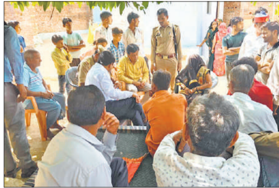
क्लिनिक पर कार्रवाई करने पहुंचे अधिकारी।