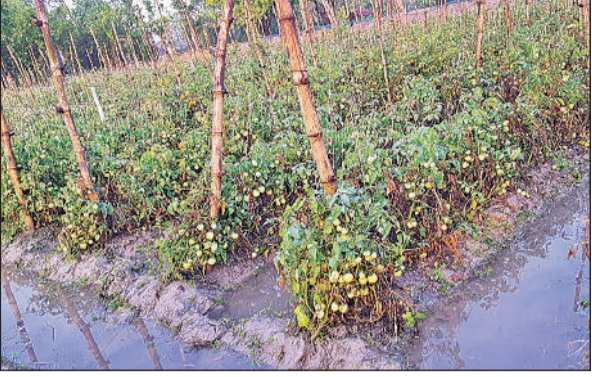
शिवागढ़ में बारिश से टमाटर की फसल में भरा बारिश का पानी।