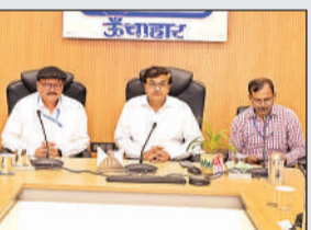
बैठक को संबोधित करते उत्तरी क्षेत्र के प्रमुख।

उत्तरी क्षेत्र एसएन पाणिग्रही ने रविवार को ऊंचाहार परियोजना का दौरा किया। इस दौरान उन्होंने विभिन्न संगठनों से मुलाकात के साथ साथ एक संयुक्त बैठक को भी संबोधित किया। उन्होंने एनटीपीसी द्वारा आसपास के गांवों की बालिकाओं के प्रशिक्षण कार्यक्रम को देखा