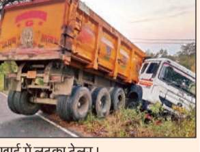
खाई में लटका ट्रैलर।