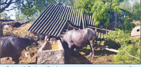
आंधी से गांव में टीनशेड पर गिरा पेड़।