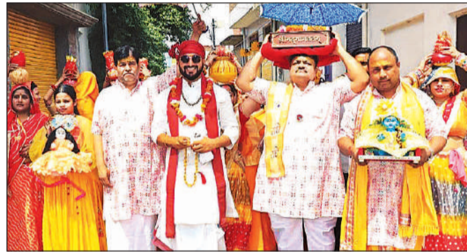
कलशयात्रा में शामिल श्रद्धालु।