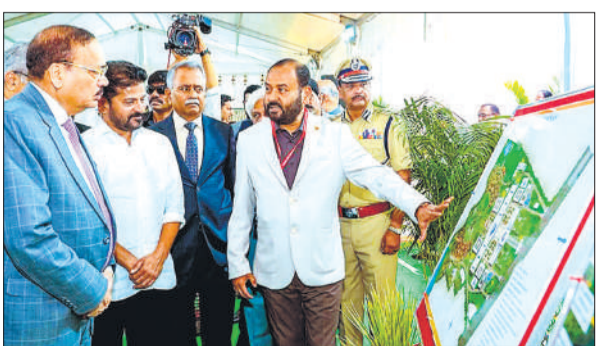
तेलंगाना में एक समारोह के दौरान प्रदर्शनी का अवलोकन करते सीजेआई सूर्यकांत।

उन्होंने कहा, देश भर में बना यह माहौल मुझे बहुत आत्मविश्वास देता है। पिछले कुछ महीनों में ही मुझे उत्तर प्रदेश, हिमाचल प्रदेश, आंध्र