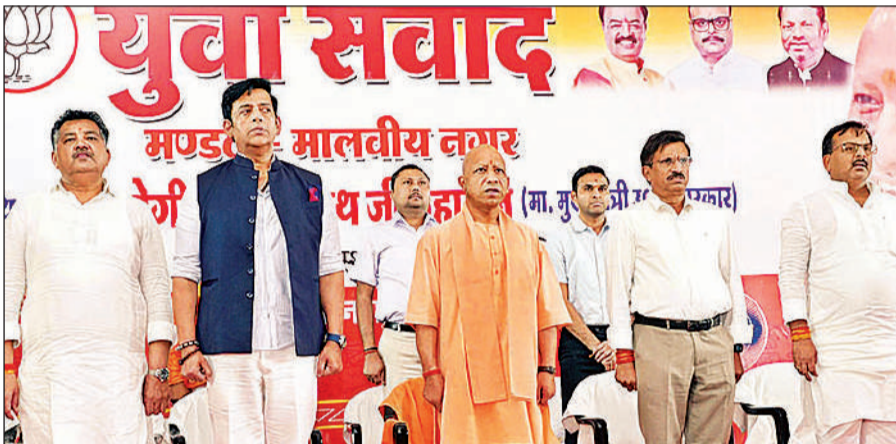
गोरखपुर में आयोजित युवा संवाद कार्यक्रम में मंच पर उपस्थित मुख्यमंत्री योगी आदित्यनाथ, साथ में अन्य।

निर्देश है कि अपराधियों के खिलाफ सख्त कार्रवाई की जाए। उन्होंने कहा कि आज महिलाओं, व्यापारियों और आम नागरिकों की सुरक्षा सुनिश्चित हुई है, जिससे प्रदेश में विश्वास और निवेश का माहौल बना है।