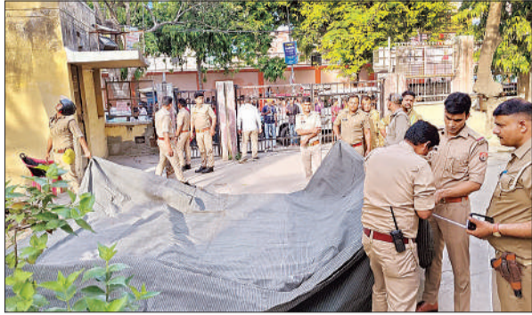
टॉवर के नीचे सुरक्षा जाल बिछाते पुलिसकर्मी।