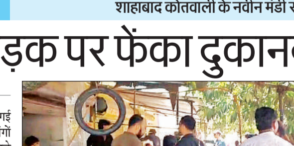
हाईवे पर दुकानों के सामने लगी भीड़।