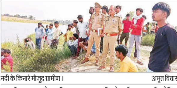
नदी के किनारे मौजूद ग्रामीण।