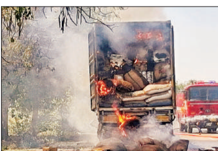
आग लगने से धू धू कर जलता कंटेनर।