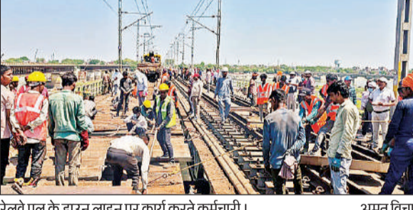
रेलवे पुल के डाउन लाइन पर कार्य करते कर्मचारी।