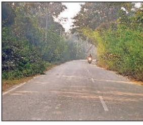
जगदीशपुर मार्ग पर लगी कंटीली टहनियां वाहन चालकों को जान का खतरा बना रहता है। रात के समय यह समस्या और भी गंभीर हो जाती है, जब दृश्यता और कम हो जाती है। सिर्फ जगदीशपुर मार्ग ही नहीं, बल्कि शुकुल बाजार-रानीगंज मार्ग, इन्हौना मार्ग तथा मां कामाख्या देवी मंदिर जाने वाले रास्तों पर भी यही हालात देखे जा सकते हैं। परेशान क्षेत्रीय लोगों ने जिला प्रशासन से मार्ग के दोनों ओर झाड़ियों को कटवाने की गुहार लगाई है।