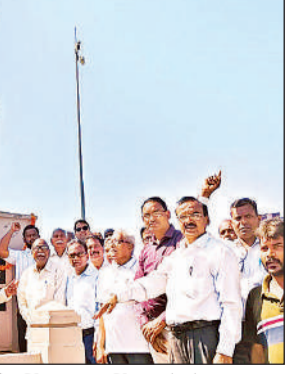
गोल चौराहा स्थित वीरांगना झलकारी बाई की मूर्ति पर पुष्प अर्पित करते लोग।

अमृत विचार। वीरांगना झलकारी बाई का 168वां बलिदान दिवस सादगी पूर्ण ढंग से मनाया गया। इस अवसर पर उनके अनुयायियों ने उनके जन्मदिन 22 नवम्बर व बलिदान दिवस 5 अप्रैल पर सार्वजनिक अवकाश घोषित किए जाने की मांग की। इसके अलावा उनके नाम पर जिला, तहसील और ब्लाक का नाम रखे जाने की भी मांग की गई। वीरांगना झलकारी बाई कल्याण एवं विकास परिषद के तत्वावधान में रविवार को गोल चौराहा स्थित वीरांगना झलकारी बाई मूर्ति के पास उनका 168वां बलिदान