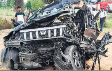
हादसे के बाद क्षतिग्रस्त वाहन।