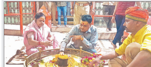
जलाभिषेक करते दर्जा प्राप्त राज्यमंत्री व उनकी पत्नी।