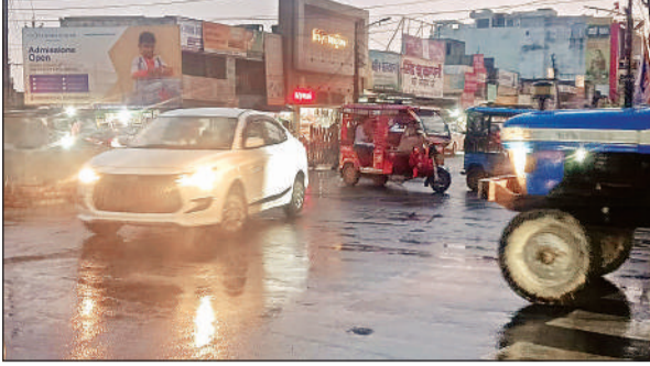
बारिश में जाते लोग।