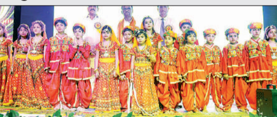
वार्षिकोत्सव अभ्युदय में संस्कृति एवं संस्कार की झलक दिखाई। अमृत विचार