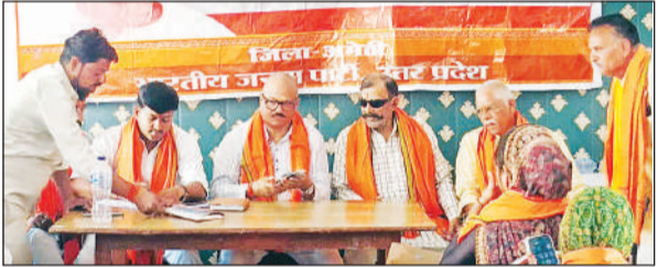
प्रशिक्षण महाभियान में उपस्थित भाजपा कार्यकर्ता।