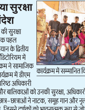
कार्यक्रम में सम्मानित किए गए बच्चे, मौजूद डीएम-एसपी व अन्य।