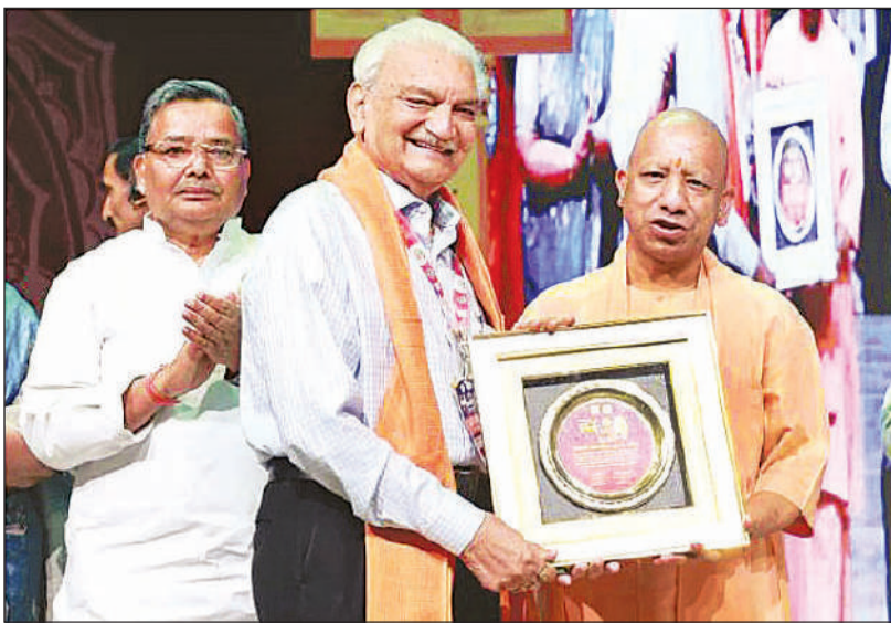
लखनऊ: भारतेंदु नाट्य अकादमी में आयोजित कार्यक्रम में कलाविदों को सम्मानित करते मुख्यमंत्री योगी।