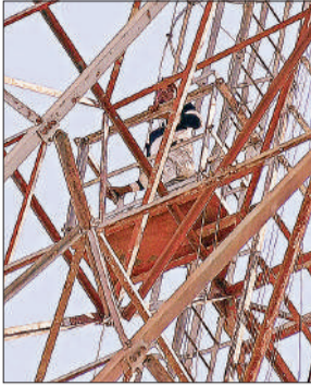
टॉवर पर चढ़ा युवक। ● अमृत विचार

अमृत विचार : इश्क के पागलपन में युवक बीएसएनएल कार्यालय परिसर में लगे 120 मीटर ऊंचे टॉवर पर चढ़ गया। इतना ही नहीं युवक ऊपर रोते हुए प्रेमिका को बुलाने की ज़िद पर अड़ गया। करीब 3 घंटे चले हाईवोल्टेज ड्रामे के बाद पुलिस और परिजनों के मान-मनौबल पर युवक टॉवर से नीचे उतरा। बताया जा रहा कि शादी न होने से युवक काफी परेशान रहता था। घटना के दौरान देखने वालों की मौके पर भारी भीड़ जमा हो गई।