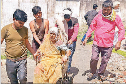
व्हील चेयर पर बैठकर मोर्चरी जाती मृतक की मां।