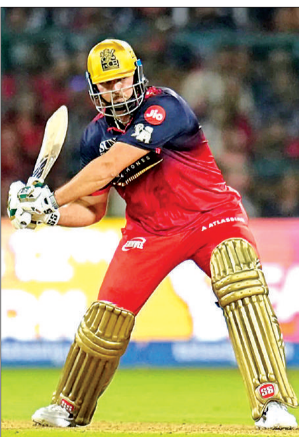
विस्फोटक पारी के दौरान शॉट लगाते टिम डेविड।