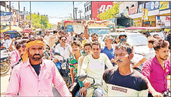
सलोन में सड़क जाम करने से फंसे वाहन व राहगीर।