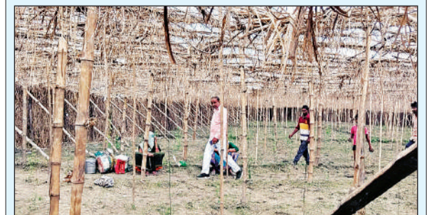
आकाशीय बिजली से जली पान की भीड़ को देखते ग्रामीण।