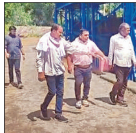
सरकारी पेड़ों को चोरी से कटवाने की जांच करती टीम।