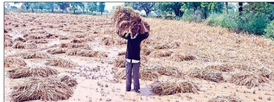
बारिश और ओलावृष्टि के बाद फसल ले जाता किसान।

अमृत विचार। शनिवार और रविवार की शाम हुई तेज बारिश और ओलावृष्टि ने किसानों की चिंता बढ़ा दी है। खेतों में कटाई के लिए तैयार खड़ी गेहूँ की फसल को भारी नुकसान हुआ है। तेज हवाओं की मार से फसल खेतों में गिर गई जिससे दाने खराब होने का खतरा बढ़ गया है।