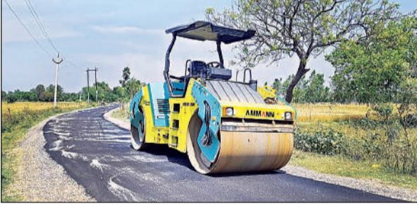
भवानीगढ़-सूरजपुर सम्पर्क मार्ग के निर्माण में लगे सरकारी संसाधन।

अमृत विचार। क्षेत्र के भवानीगढ़-सूरजपुर सम्पर्क मार्ग पर राहगीरों की सुरक्षा को ध्यान में रखते हुए सड़क के दोनों किनारों पर थर्मोप्लास्टिक पेंट से सफेद पट्टियां बनाई जाएंगी। घने कोहरे के दौरान हादसों की आशंका को कम करने के लिए यह पहल अहम मानी जा रही है। गौरतलब है कि 7.3 किलोमीटर लम्बे इस मार्ग का नवीनीकरण प्रधानमंत्री ग्राम सड़क योजना के तहत कराया गया है। बोते छह वर्षों से यह सम्पर्क मार्ग जर्जर, बदहाल एवं गड्ढों में तब्दील था, जिसके चलते छात्र-छात्राओं, व्यापारियों एवं राहगीरों को आवागमन में भारी दिक्कतों का सामना करना