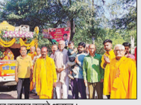
कलाश यात्रा का स्वागत करते श्रद्धालु।