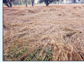
खेत में गिरी पड़ी गेहूं की फसल।

सिंहपुर (अमेठी) अमृत विचार। क्षेत्र में शनिवार शाम को हुई असमय बारिश तथा तेज हवाओं ने किसानों की मेहनत पर पानी फेर दिया। खेतों में तैयार खड़ी फसलें मौसम की मार से बुरी तरह प्रभावित हुई हैं, वहीं तेज हवाओं के चलते कई स्थानों पर बिजली आपूर्ति भी पूरी तरह ध्वस्त हो गई है। इससे किसानों के साथ-साथ आम जनजीवन भी प्रभावित हुआ है। किसानों का कहना है कि इस समय गेहूं की फसल पूरी तरह फफकर कटाई के लिए तैयार थी, और कुछ किसानों मौसम देखे बगैर ही खेत में कट डाले हैं और मड़ाई बाकी है वहीं खेत में खड़ी फसल तेज हवा के चलते खेतों में गिर गई। फसल गिरने से दानों के भरपूर पर असर पड़ेगा और कटाई में भी दिक्कतें बढ़ गई हैं। कई किसान गिरी हुई फसल के कारण कटाई नहीं कर पा रहे हैं, जिससे उत्पादन घटने की आशंका है। वहीं, जिन किसानों ने सरसों की फसल कटाकर खेतों में सुखाने के लिए छोड़ रखी थी, उन्हें भी भारी नुकसान उठाना पड़ रहा है। बारिश के कारण सरसों की फलियां बटकने लगीं, जिससे दाने जमीन पर गिरकर खराब हो रहे हैं। इससे किसानों को सीधा आर्थिक नुकसान हो रहा है। तेज हवाओं का असर सब्जी फसलों पर भी पड़ रहा है। टमाटर के पौधे कई जगहों पर टूट गए और फल जमीन पर गिर गए, जिससे उत्पादन में कमी की संभावना है। इसके अलावा तेज आंधी के कारण कई स्थानों पर बिजली के तार और खंभे क्षतिग्रस्त हो गए, जिससे विद्युत आपूर्ति बाधित हो गई। ग्रामीण क्षेत्रों में अंधेरा छा गया और पेड़जल व अन्य आवश्यक कार्य भी प्रभावित हुए। किसान राज बख्श, बृजेश कुमार, सुजीत कुमार, राजू, राज बहादुर, राम कुमार, शैलेन्द्र सहित अन्य किसानों ने प्रशासन से नुकसान का शीघ्र सर्वे कराकर उचित मुआवजा दिलाने की मांग की है, ताकि उन्हें राहत मिल सके।