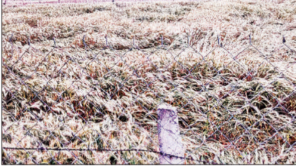
आंधी और बारिश में गिरी गेहूँ की फसल। अमृत विचार