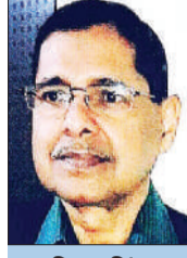
विजय सिंह रुद्रपुर

अमेरिका-ईरान युद्ध के बीच एक अमेरिकी पायलट की तलाश में दोनों देश रेस्क्यू ऑपरेशन चला रहे हैं। हुआ कुछ यूँ कि बीते दिनों एक अमेरिका के युद्धक विमान F-15E को ईरान ने मार गिराया। समय रहते उस विमान के दोनों पायलट कूद गए। खबर मिलते ही अमेरिका ने, अपने पायलटों को सकुशल ईरान के क्षेत्र से निकाल ले जाने के लिए, रेस्क्यू ऑपरेशन शुरू कर दिया। उसके कुछ टोही हेलिकॉप्टर