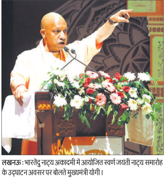
लखनऊ : भारतेंदु नाट्य अकादमी में आयोजित स्वर्ण जयंती नाट्य समारोह के उद्घाटन अवसर पर बोलेते मुख्यमंत्री योगी।

मुख्यमंत्री योगी रविवार को भारतेंदु नाट्य अकादमी (बीएनए) में 12 अप्रैल तक आयोजित स्वर्ण जयंती नाट्य समारोह का उद्घाटन करने के बाद बोल रहे थे। उन्होंने एक हजार वर्ष पहले महाराज सुहेलदेव के शौर्य