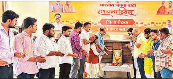
महर्षि कश्यप के चित्र पर पुष्प अर्पित करते भाजपा जिलाध्यक्ष।