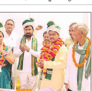
जिलाध्यक्ष का स्वागत करते अन्य पदाधिकारी।