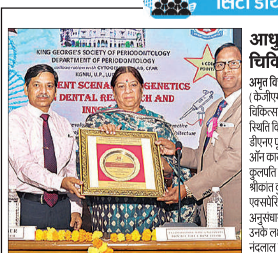
कार्यक्रम में कुलपति सम्मानित करते डॉक्टर।