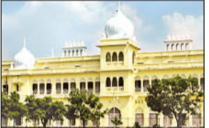
अमृत विचार, लखनऊ: लखनऊ विश्वविद्यालय के अधिष्ठाता छात्र कल्याण विभाग और फैकल्टी ऑफ योगा एण्ड अल्टरनेटिव मेडिसिन विभाग के संयुक्त तत्वावधान में आज मुख्य परिसर व नवीन परिसर में योगा सेशन का आयोजन किया गया है। जिसमें विश्वविद्यालय के शिक्षक, कर्मचारी एवं छात्र-छात्राएं आदि निःशुल्क रूप से भाग लेकर स्वास्थ्य लाभ प्राप्त कर सकते हैं।