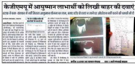
अमृत विचार में 6 अप्रैल को प्रकाशित खबर।