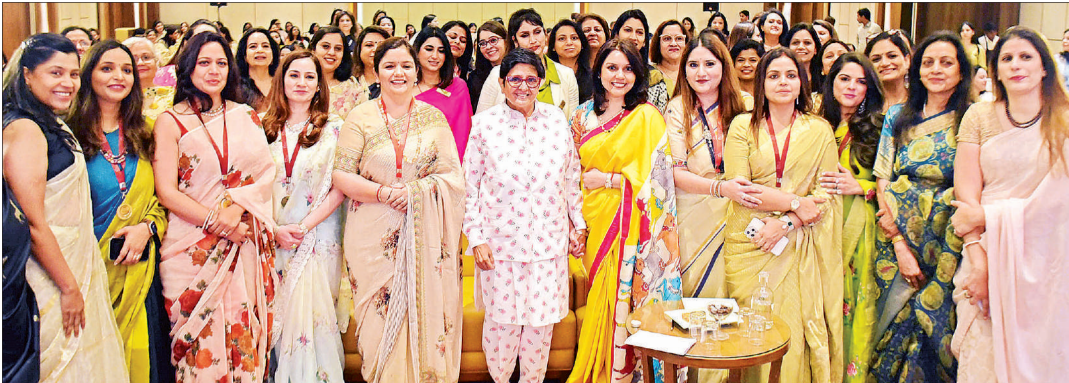
फिक्की फ्लो लखनऊ चैटर के चेंज ऑफ गार्ड समारोह में संकटन की पदाधिकारियों और सदस्यों के साथ पूर्व आईपीएस डॉ. किरण बेदी।