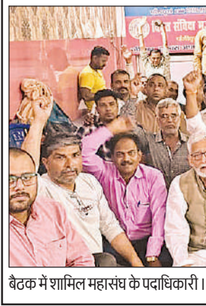
बैठक में शामिल महासंघ के पदाधिकारी।