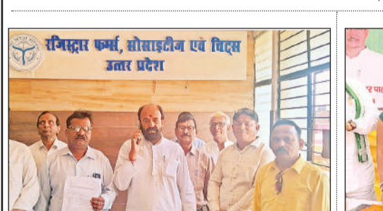
ज्ञापन देकर बाहर निकलते पदाधिकारी।