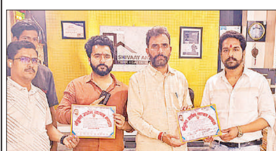
नियुक्त पद परते पदाधिकारी।