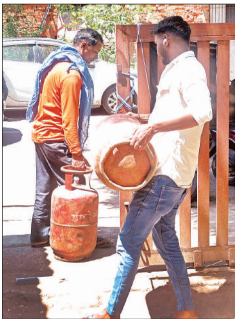
रसोई गैस सिलेंडर भरवाने जाते लोग।

■ अमृत विचार : गैस की किल्लत के बीच एक ओर उपभोक्ता परेशान हैं वहीं आपूर्ति के दबाव से गैस एजेंसी संचालक भी बीमार पड़ रहे हैं। इंडेन ऑयल की गोमती नगर स्थित मां दुर्गा एजेंसी के संचालक की तबियत खराब हो जाने से उन्हें अस्पताल में भर्ती कराया गया है। इससे उपभोक्ता परेशान हो रहे हैं। इस समस्या को देखते हुए कंपनी अब एजेंसी के उपभोक्ताओं को आस-पास की इंडेन ऑयल की गैस एजेंसी में शिफ्ट करने जा रही है। वहीं दूसरी ओर भारत गैस की कपूरथला स्थित अशोका गैस सर्विस उपभोक्ताओं को गैस सिलेंडर उपलब्ध नहीं करा पा रही है। वर्तमान में एजेंसी के पास लगभग 30,000 उपभोक्ता हैं। यहां गैस सिलेंडर लेने के लिए लोग बुकिंग के बाद 10 दिन से इंतजार कर रहे हैं। एजेंसी के पास चौक स्थित बंद हो चुकी गैस एजेंसी के उपभोक्ता भी शामिल हैं। एजेंसी पर लोड अधिक है, जिससे उपभोक्ताओं को गैस सिलेंडर के लिए एजेंसी के गोदाम पर लंबी कतार लगानी पड़ रही है। समस्या को देखते हुए अब भारत पेट्रोलियम के अधिकारी गैस एजेंसी का लोड कम करने की तैयारी कर रहे हैं। चौक और बालागंज क्षेत्र के उपभोक्ताओं को आस-पास की दूसरी एजेंसी में शिफ्ट किया जाएगा। एडीएम आपूर्ति ज्योति गौतम ने कहा कि गैस एजेंसियों के पास क्षमता से अधिक उपभोक्ता हैं। इससे उपभोक्ताओं को समय पर गैस सिलेंडर की आपूर्ति नहीं कर पा रहे हैं। जिन गैस एजेंसियों के पास ज्यादा उपभोक्ता हैं उन्हें आस-पास की दूसरी एजेंसी में शिफ्ट किया जाएगा।