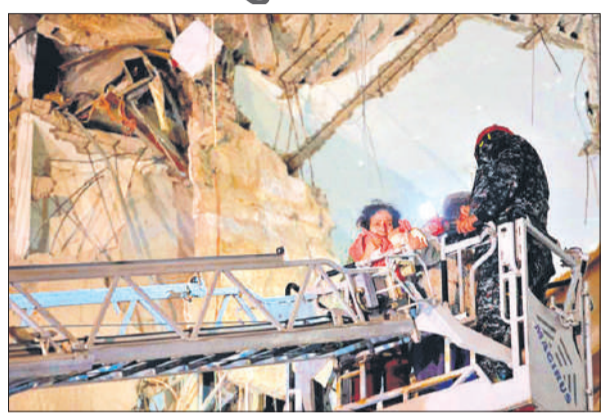
लेबनान के बेरुत शहर में बचाव अभियान के दौरान महिला को बचाते दमकलकर्मी।

● ईरान ने कहा- लेबनान में हिजबुल्ला पर इजराइल के हमलों का कड़ा जवाब देंगे