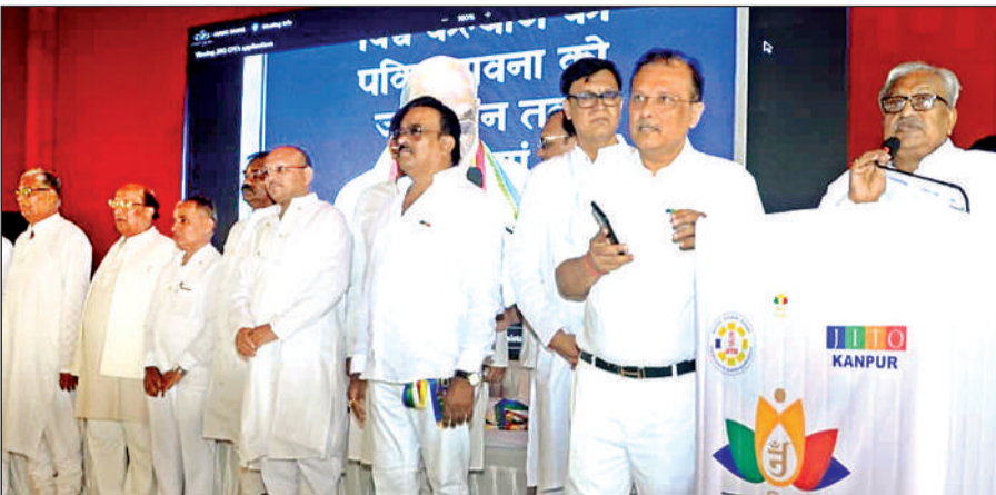
नानाराव पार्क में आयोजित विश्व नवकार दिवस पर भाग लेते अतिथि।