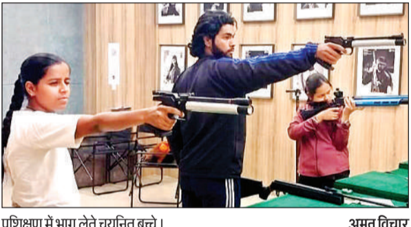
प्रशिक्षण में भाग लेते चयनित बच्चे।

अधिकांसी अधिकारी नगर पंचायत कुरार, हमीरपुर