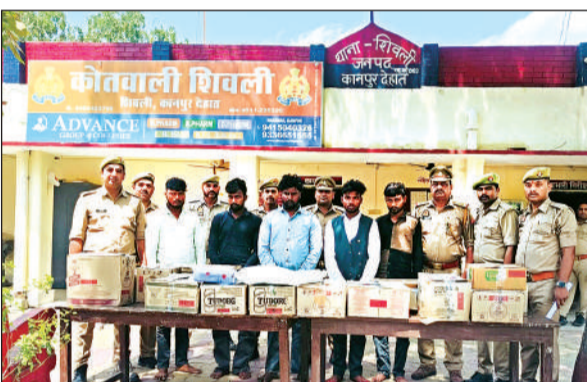
पुलिस की गिरफ्त में चोरी की आरोपी। चोरों के पास से बरामद की गई कारें।

कानपुर देहात। गुरुवार को जिलाधिकारी कपिल सिंह की अध्यक्षता एवं सीडीओ विधान जयसवाल की उपस्थिति में मुख्यमंत्री ग्राम परिवहन योजना-2026 के संबंध में बैठक कलेक्ट्रेट में आयोजित की गई। बैठक के दौरान जिलाधिकारी ने शासन की मंशा के अनुरूप ग्रामीण क्षेत्रों में सुगम एवं सुदृढ़ परिवहन व्यवस्था सुनिश्चित करने पर विशेष जोर दिया। उन्होंने योजना के प्रभावी, पारदर्शी एवं समयबद्ध क्रियान्वयन हेतु संबंधित अधिकारियों को आवश्यक दिशा-निर्देश प्रदान किए। जिलाधिकारी ने कहा कि इस योजना के माध्यम से ग्रामीण अंचलों में आवागमन की सुविधा बेहतर होगी, जिससे स्थानीय नागरिकों को आवागमन में सहूलियत मिलने के साथ-साथ रोजगार के अवसर भी सृजित होंगे। इस मौके पर अपर जिलाधिकारी प्रशासन अमित कुमार, अपर जिलाधिकारी वित्त एवं राजस्व दुय्यंत कुमार मोर्य सहित संबंधित विभागों के अधिकारी रहे।