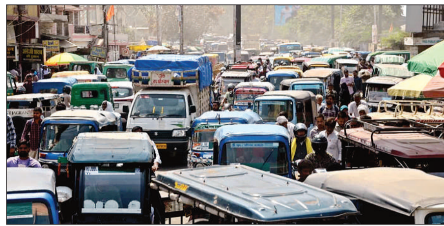
घंटाघर चौराहे पर अक्सर ऐसे ही लगता जाम, जहां घंटों जूझते रहते हैं वाहन सवार।

शहरीकरण के साथ आबादी के बढ़ते दबाव और वाहनों की बढ़ती संख्या ने अनेक मार्गों पर यातायात की समस्या को गंभीर बना दिया है। शहर के उत्तर से दक्षिण क्षेत्र में आना जाना हो तो सुबह और शाम व्यस्त समय में कुछ किलोमीटर का सफर तय करने में लंबा समय लग जाता है। यातायात विभाग के अध्यक्ष ने सामने आया है कि एक ही सड़क पर अलग-अलग समय में निश्चित दूरी तय करने का समय बदल जाता है। इसलिए ऐसे मार्गों को चिह्नित किया गया है, जहां जाम की समस्या सबसे ज्यादा या लगावम रोज है।