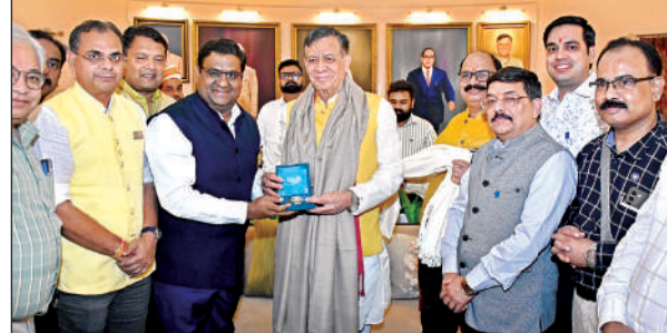
विधानसभा के भ्रमण के दौरान अध्यक्ष से मिले रोटररी क्लब के सदस्य।

भेजने के लिए प्रेरित किया। इस बीच न्याय पंचायत के उन मेधावी बच्चों को भी सम्मानित किया गया, जिन्होंने राष्ट्रीय आय आधारित योग्यता परीक्षा, राष्ट्रीय आविष्कार अभियान, इस्पायर मानक अर्वाइजर्स तथा नवोदय विद्यालय प्रवेश परीक्षा में सफलता प्राप्त की। मुख्य अतिथियों द्वारा उन्हें पगड़ी पहनाकर सम्मानित किया गया। रैली का विशेष आकर्षण