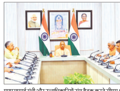
एमएसएमई मंत्री और उच्चाधिकारियों संग बैठक करते सीएम।

मुख्यमंत्री ने कहा कि प्रत्येक क्लस्टर में सीमित संख्या में बुनकरों को संगठित कर पंजीकृत इकाइयों के रूप में विकसित किया जाए, जिससे सामूहिक उत्पादन और विपणन को बढ़ावा मिले। साथ ही, इन क्लस्टरों को आधुनिक