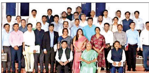
राज्यपाल के साथ हरकोट बटलर प्राविधिक विश्वविद्यालय के विभागाध्यक्ष।

बैठक के दौरान विश्वविद्यालय में नामांकन, छात्रावासों की स्थिति, उपलब्ध सुविधाएं, स्वास्थ्य परीक्षण, स्वच्छता, पेयजल व्यवस्था, भोजन की गुणवत्ता, छात्रावासों की साफ-सफाई, योग एवं शोध गतिविधियों, फैकल्टी-विद्यार्थी अनुपात, सह-पाठ्यक्रम गतिविधियां, प्रोजेक्ट्स, प्लेसमेंट, रोजगार एवं शोध पत्रों आदि की