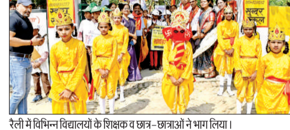
रैली में विभिन्न विद्यालयों के शिक्षक व छात्र-छात्राओं ने भाग लिया।