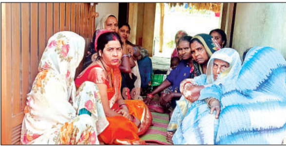
घटना के बाद गमगीन बैठी महिलाएं।