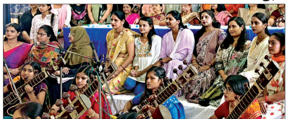
दयानंद गर्ल्स पीजी कॉलेज में गुरुवार को आयोजित एल्यूमिनाई मीट में सुरों की महफिल सजी।