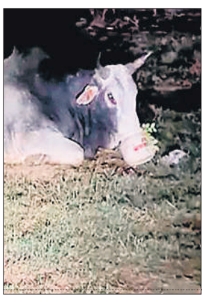
● विधरि में कई घंटे मशक्कत के बाद किया रेस्क्यू, शादी हाल के बाहर फेंका डिब्बा बना मुसीबत

विधरि में गौसेवकों ने मुश्किल में फंसे नदी को रेस्क्यू कर बचा लिया। 5 दिन से गौवंश के मुंह में डिब्बा फंसा था और वह कुछ खा नहीं पा रहा था। घंटों की मशक्कत के बाद मुंह से डिब्बा निकाला जा सका।