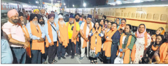
पाकिस्तान के ननकाना साहिब रवाना होता जत्था।

बरेली, अमृत विचार : गुरुद्वारा श्री गुरु सिंह सभा सुभाष नगर से गुरुवार को जत्था बैसाखी महोत्सव में भाग लेने के लिए पाकिस्तान स्थित ननकाना साहिब रवाना हुआ। आरंभ अरदास के साथ हुआ। ग्रंथी ने सुखद एवं सफल यात्रा के लिए प्रार्थना की। जत्था 10 अप्रैल को वाघा बॉर्डर के रास्ते पाकिस्तान पहुंचकर ननकाना साहिब जाएगा। इसके बाद संगत हसन अब्दाल स्थित गुरुद्वारा पंजा साहिब, करतारपुर साहिब और लाहौर स्थित ऐतिहासिक गुरुद्वारों के दर्शन करेगी। 14 अप्रैल को खालसा साजना दिवस के मुख्य समारोह में भाग लिया जाएगा। 19 अप्रैल को जत्था भारत