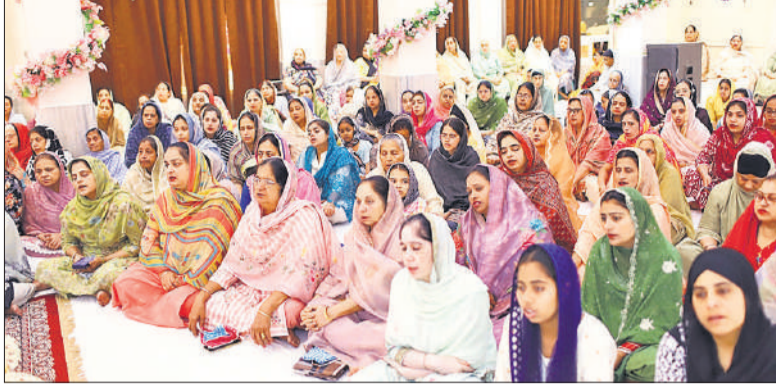
कीर्तन दरबार में श्रद्धा भाव से बड़ी संख्या में शामिल संगत।

● गुरुद्वारा गुरु गोविंद सिंह नगर में गुरु अर्जुन देव का प्रकाश पर्व श्रद्धा और उल्लास के साथ मनाया