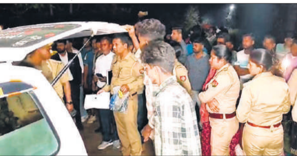
छात्र का शव मिलने के बाद मौके पर पहुंची पुलिस और जुटी भीड़।