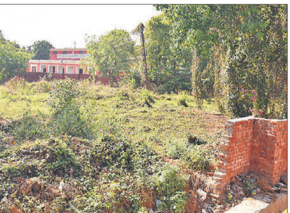
कॉलेज की इस जमीन पर किया गया था कब्जा। ● अमृत विचार

अमृत विचार : वैसे तो स्मार्ट सिटी का दिल कहे जाने वाला सिविल लाइंस रात में भी जागता है मगर मैथोडिस्ट गल्स कॉलेज के बेशकीमत खेल मैदान पर कब्जे के समय किसी की नौद नहीं टूटी थी। सिस्टम ने आंखें मूंद रखी थी और षड्यंत्र में शामिल लोगों ने रात-रात भर जागकर 'मिशन कब्जा' पूरा किया था। मैदान के सबसे कीमती हिस्से को अनयूज्ड बताकर चारों ओर लाल दीवार खड़ी कर दी गई थी। मामला अखबारों और सोशल मीडिया की सुर्खियां बना था लेकिन तुरंत ही लिखित शिकायत को कोई आगे नहीं आया था। स्थानीय लोगों का कहना है कि खेल मैदान के एक बड़े हिस्से को चारों ओर चाहरदीवारी खड़ी कर गेट लगाने तक अवैध कब्जे में शामिल कुछ प्रभावशाली लोग हर समय