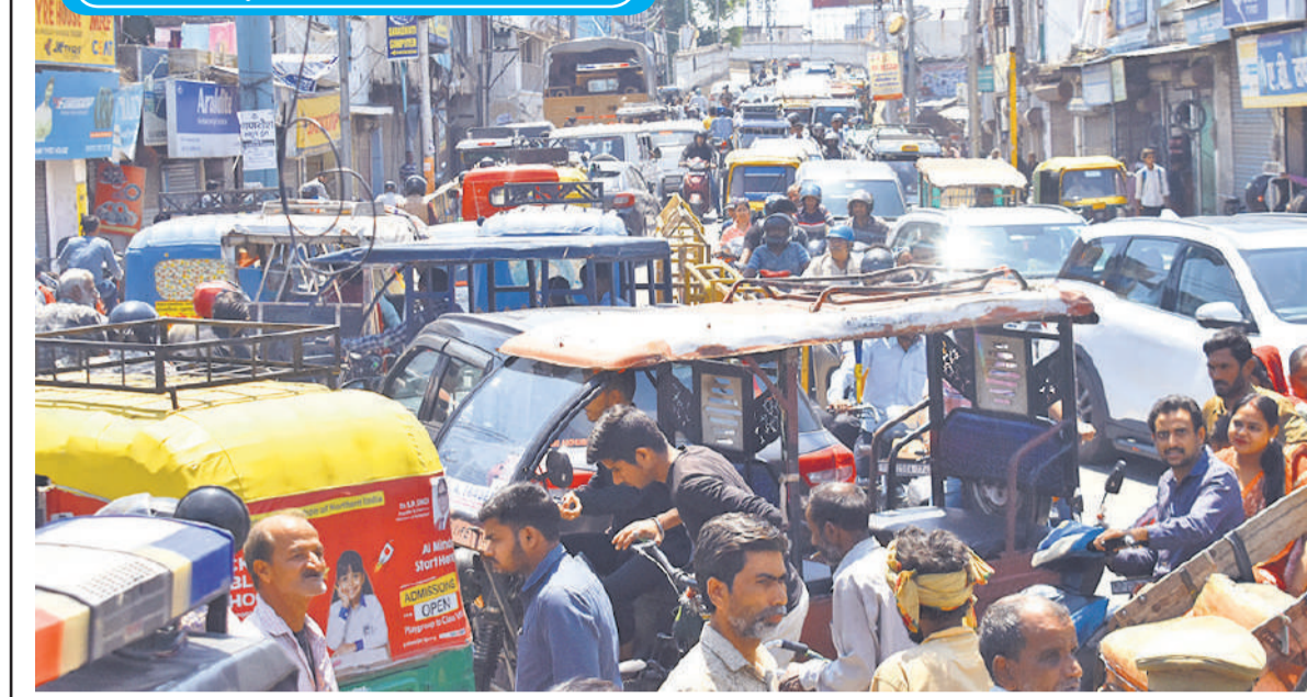
ट्रैफिक बढ़ने पर कोहाड़ापीर तिराहे से महादेव पुल तक जाम लग गया। राहगीर और वाहन चालकों को परेशानी से जूझना पड़ा। ● अमृत विचार