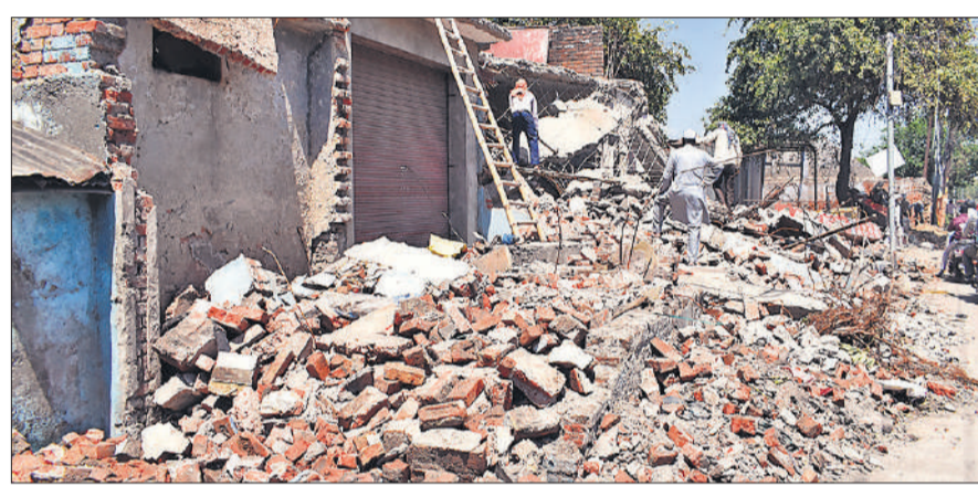
धर्मकांटा रोड पर ध्वस्तीकरण की कार्रवाई के बाद पड़ा मलबा और अतिक्रमण को खुद ही हटाते लोग।