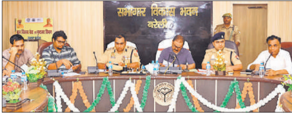
उर्स को लेकर बैठक करते डीएम, एसएसपी व अन्य अधिकारी।

डीएम अविनाश सिंह ने कहा कि अग्निशमन व्यवस्था, सड़कों की मरम्मत, पानी की व्यवस्था, निर्बाध विद्युत आपूर्ति के लिए अधिकारियों को निर्देश दे दिए गए हैं। बाहर से आने वाले जायरीन के रुकने की व्यवस्था पहले की तरह रहेगी, किसी तरह की कोई नई परंपरा नहीं की जाए। कोर कमिटी से कहा कि कोई समस्या हो तो कंट्रोल रूम के माध्यम से या अपर जिलाधिकारी नगर