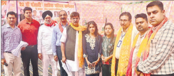
सम्मेलन में परिचय देती युवतियां, साथ में समिति के पदाधिकारी।

सम्मेलन में 15 संभावित वैवाहिक संबंधों की शुरुआत होना आयोजन की प्रमुख उपलब्धि रही। अतिथियों ने इसे समाज के लिए उपयोगी पहल बताते हुए सराहना की। मुख्य अतिथि डॉ. विनोद पागरानी ने पंजाबी समाज के संघर्ष और राष्ट्र निर्माण में योगदान को रेखांकित किया। अन्य अतिथियों ने ऐसे आयोजनों को सामाजिक संबंधों को मजबूत करने और युवाओं को उचित मंच देने वाला बताया। अध्यक्ष सतीश लुनियाल ने कहा कि