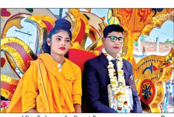
शुक्रवार को निकली शोभायात्रा में शामिल झांकी।