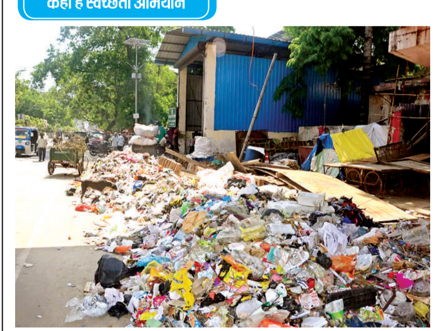
बड़ा चौराहे के पास प्लाट के बाहर सड़क पर लगा कूड़े का ढेर।