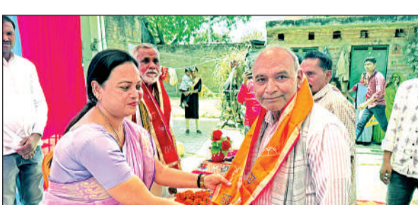
वरिष्ठजनों को सम्मानित करती भाजपा नेत्री।

भाजपाइयों द्वारा वरिष्ठजनों को सम्मानित करने के साथ साथ स्वच्छता अभियान भी चलाया गया। स्वच्छता अभियान के अंतर्गत ग्राम कुआखेड़ा में मंदिर परिसर एवं ग्राम बेरिया में गौशाला में साफ-सफाई का कार्य किया गया। इस अवसर पर उपस्थित ग्रामवासियों को केंद्र