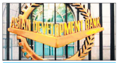
● कहा- पश्चिम एशिया संघर्ष लंबा खिंचा तो देश के आर्थिक प्रदर्शन पर पड़ना प्रतिकूल असर

नई दिल्ली, एजेंसी। एशियाई विकास बैंक (एडीबी) ने मजबूत घरेलू मांग, आसान वित्तपोषण परिस्थितियों और भारतीय वस्तुओं पर अमेरिका के कम शुल्क के समर्थन से चालू वित्त वर्ष 2026-27 में भारत की आर्थिक वृद्धि दर के 6.9 प्रतिशत रहने का शुक्रवार को अनुमान लगाया। वहीं अगले वित्त वर्ष में इसके 7.3 प्रतिशत रहने की संभावना है।