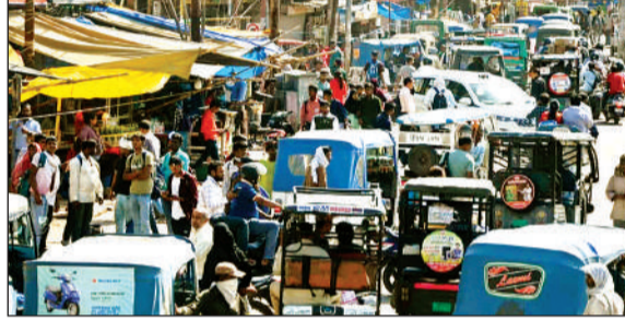
परदे के पास लगा जाम।

से बैराज को जोड़ती है तो दूसरी डीपीएस स्कूल के पास से जाती है। चौड़ीकरण के लिए 1.8 हेक्टेयर भूमि अधिग्रहीत की जाएगी। 25 करोड़ रुपये निर्माण और भूमि अधिग्रहण पर खर्च होगा। 11 करोड़ रुपये शासन ने आवंटित कर दिया है। बनियापुरवा बैराज से मैनावती मार्ग को जोड़ने वाली सड़क के मरम्मत कार्य पर 1.15 करोड़ रुपये खर्च होंगे।