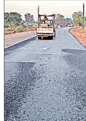
जते हैं पर आवागमन कम है। बड़े पैमाने पर मैरिज लॉन मैनावती मार्ग पर है। ऐसे में जाम भी लगता है।

केडीए मैनावती मार्ग पर ही न्यू कानपुर सिटी बसा रहा है, जबकि केडीए की एक आवासीय योजना पहले से ही यहां मौजूद है। इसके साथ ही इस्कॉन मंदिर भी मैनावती मार्ग पर है। अभी मैनावती मार्ग पर रहने वाले लोगों को बैराज जाने के लिए जागेश्वर मंदिर से होकर जाना पड़ता है। हालांकि बैराज से मैनावती मार्ग को जाने वाली सड़कों से लोग