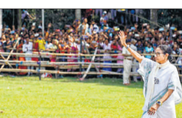
हटाए गए 90 लाख नामों में 30 लाख मुसलमान, 60 लाख हिंदू

सांप पर भरोसा किया जा सकता है लेकिन भाजपा पर नहीं। उन्होंने यह भी आरोप लगाया कि भाजपा पश्चिम बंगाल में भी बाहर से लोगों को लाने के लिए इसी तरीके का इस्तेमाल करने की कोशिश कर रही है और इसी कारण अधिकारियों का तबादला किया गया। उन्होंने कहा, लोगों, पैसे और मादक पदार्थों को लाया जा रहा है लेकिन हमारे कार्यकर्ता मुकाबला करेंगे और जीतेंगे।