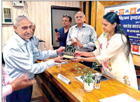
कार्यशाला में मुख्य अतिथि का स्वागत किया गया।