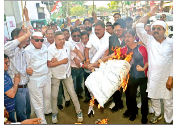
असम के सीएम का पुतला दहन करते कांग्रेसी।