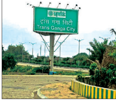
ट्रांसगंगा सिटी विकसित हो रही है।

ट्रांस गंगा सिटी परियोजना 1144 एकड़ से ज्यादा भूमि पर फैली है। यहां औद्योगिक, वाणिज्यिक और आवासीय भूखंडों को मिलाकर एक औद्योगिक मॉडल टाउनशिप विकसित करने का काम तेजी से चल रहा है। अंतर्राष्ट्रीय डिजाइन मानक, अबाध बिजली और