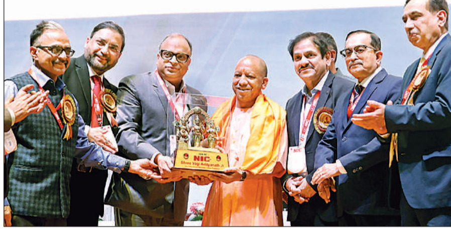
लखनऊ : कार्डियोलॉजिकल सोसायटी ऑफ इंडिया के सम्मेलन में मुख्यमंत्री योगी को स्मृति चिन्ह भेंट करते चिकित्सक।

बढ़ती जीवनशैली और खान-पान की गड़बड़ियों के कारण गंभीर चुनौती बन गई हैं। सीएम योगी ने उपचार-केंद्रित मॉडल से आगे बढ़कर जन-जागरूकता और जीवनशैली सुधार आधारित मॉडल अपना देने पर बल दिया। उन्होंने कहा कि स्वस्थ दिनचर्या, संतुलित आहार और संयमित जीवनशैली ही इस चुनौती का प्रभावी समाधान हैं। अटल विश्वविद्यालय से