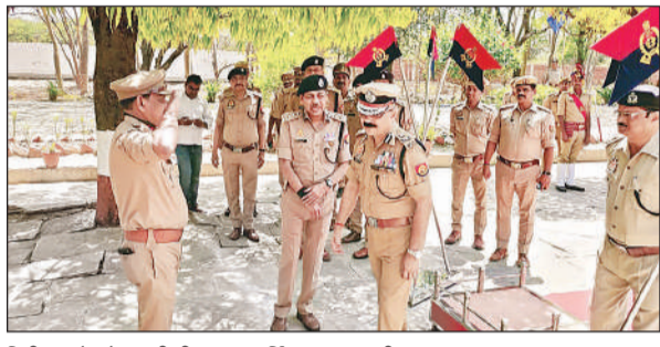
निरीक्षण के दौरान डीजी फायर सर्विस व एसएसपी।