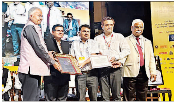
पुरस्कार ग्रहण करते हुए यूपीएमआरसी के अधिकारी। अमृत विचार

ने ग्रहण किया। सीआईडीसी की टीम ने मार्च में परियोजना स्थलों का निरीक्षण कर निर्माण की गुणवत्ता, गति और नवाचार की सराहना की। मल्टी-मॉडल कनेक्टिविटी, फूड व रिटेल आउटलेट, पुस्तक मले और 'सेलिब्रेशन ऑन व्हील्स' जैसी पहलों को विशेष रूप से सराहा गया। आधुनिक तकनीकों से बना