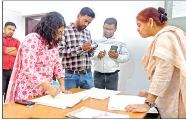
विकास खंड का निरीक्षण करती मुख्य विकास अधिकारी।