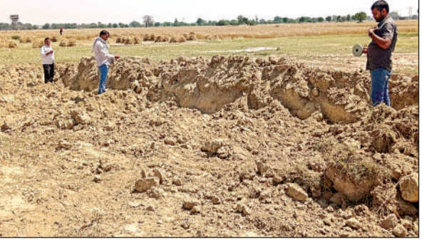
चोरी-छिपे खनन के बाद मिट्टी की नाप-जोख करती राजस्व टीम। अमृत विचार

अमृत विचार: गजनेर थाना क्षेत्र के लोहारी गांव में बेखोफ खनन माफिया ने रात के अंधेरे में एक किसान के खेत की मिट्टी चोरी कर बाजार में बेच दी। सुबह खेत पर पहुंचे किसान को खेत की जगह तालाब दिखाई दिया तो वह सन्न रह गया। शिकायत पर राजस्व टीम ने खेत की नाप-जोख कर रिपोर्ट अधिकारियों को दी है।