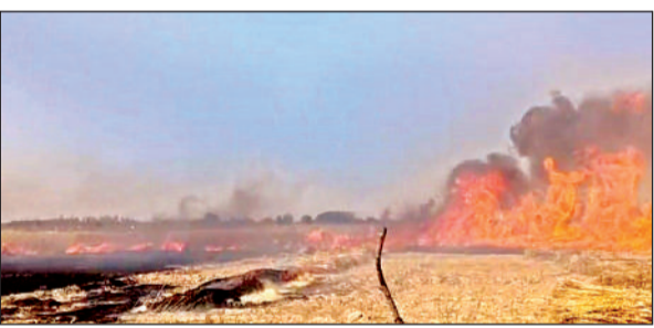
शिवली के पास आग लगने के बाद धू-धु कर जली फसल।