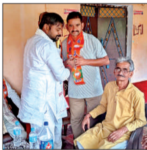
भाजपाई को पटका पहनाते विधायक।

अभियान की शुरुआत कस्बे के ऐतिहासिक सिद्धनाथ मंदिर से हुई, जहाँ भाजपा पदाधिकारियों और कार्यकर्ताओं ने मिलकर मंदिर परिसर में साफ-सफाई अभियान चलाया। इसके पश्चात, कार्यकर्ताओं ने कस्बे के मुमुख्य मागों