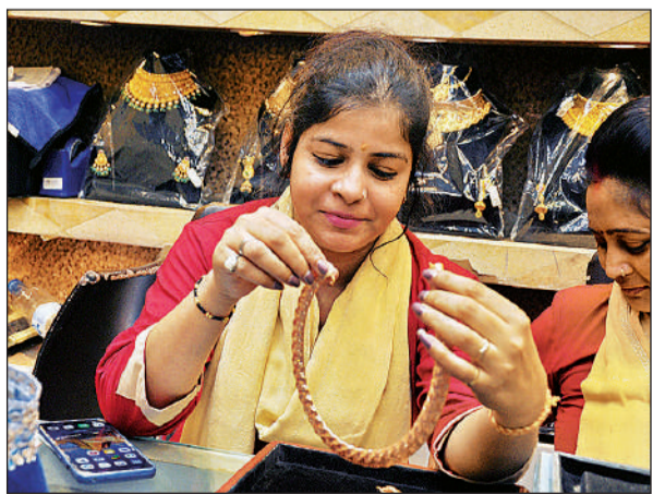
सराफे बाजार में दुकान पर हसली देखती महिला।

अमृत विचार : चढ़ती कीमतों और बाजार में निरंतर बने उतार-चढ़ाव के बीच अक्षय तृतीया पर्व के लिए लखनऊ के बाजार तैयार हो गए हैं। शोरूम में खरीदार नई डिजाइन पसंद कर अग्रिम बुकिंग करा रहे हैं। साथ ही कई ग्राहक ऐसे भी हैं जो ज्वेलरी खरीद कर उसका पूजन अक्षय तृतीया की शुभ घड़ी में करने के बाद ही उसे धारण करेंगे। पर्व भले ही 19 अप्रैल को हो लेकिन सर्राफा बाजारों में भीड़ है। कीमतें अधिक होने के कारण इस बार 'लाइट वेट' ज्वेलरी की शोरूम में भरमार है। पुराने जमाने में पहनी जाने वाली सोने की 'हसली' को नए रूप में उतारा गया है।