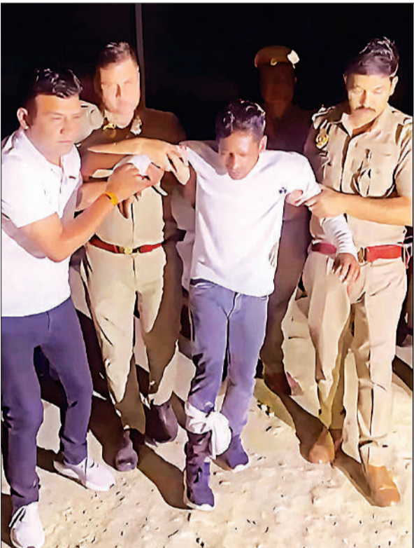
पर में गोली लगने से घायल बदमाश को सहारा देकर ले जाते पुलिसकर्मों।