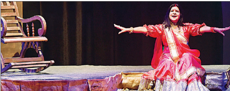
भारतेन्दु नाट्य अकादमी के स्वर्ण जयंती समारोह में मालन अलबेली की प्रस्तुति देती पद्मश्री मालिनी अवस्थी।

भारतेन्दु नाट्य अकादमी के स्वर्ण जयंती समारोह में शाम को मालन अलबेली में प्रख्यात पद्मश्री मालिनी अवस्थी ने गायन और अभिनय के साथ अपनी जिन्दगी के सफ़र को इतने मनमोहक अंदाज में प्रस्तुत किया। जिन लोगों ने मालिनी अवस्थी के लोकडों कार्यक्रम भी देखे होंगे उन्होंने भी उनका ऐसा स्वरूप नहीं देखा होगा और जिसने पहली बार उन्हें देखा होगा उसने पहली बार में ही उन्हें सौ फीसदी समझ लिया होगा। मालिनी ने सिखाया कि गजल सीखनी है तो शीन काफ़ दुरुस्त होना चाहिए। अपने गुरुओं को नमन करते हुए उन्होंने कहा कि कहाँ हैं ऐसे उस्ताद जो शागिर्द की डायरी पर गजल लिखें। वो बोलें कि मैं ईसाईयों के स्कूल में पढ़ी और घर पर जो उस्ताद आते थे वो मुसलमान थे। गोरखपुर में रहकर संस्कृत सीखी। संस्कृत बीए तक साथ में रही।