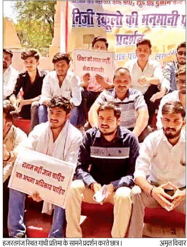
हजरतगंज स्थित गांधी प्रतिमा के सामने प्रदर्शन करते छात्र।