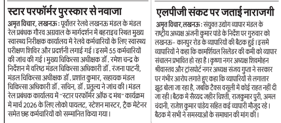
बैठक में शामिल व्यापारी।