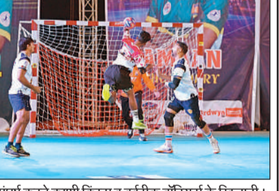
संघर्ष करते काशी किंग्स व बर्बरिक वॉरियर्स के खिलाड़ी।