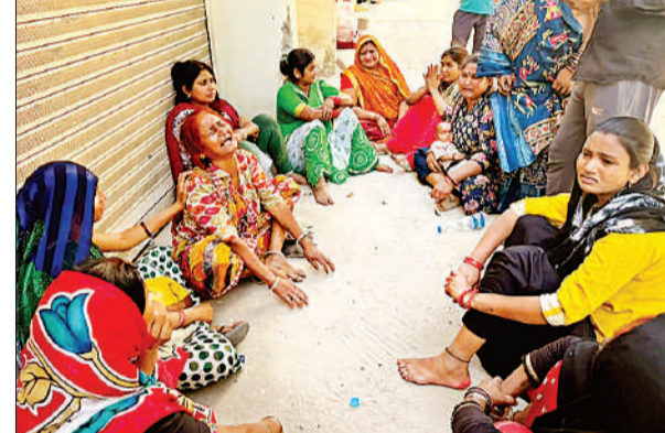
हादसे के बाद रोते बिलखते परिजन। अमृत विचार

● सीसीटीवी कैमरों के फुटेज खंगालने में जुटी पुलिस