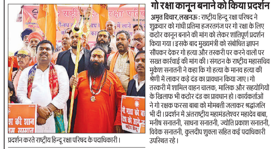
प्रदर्शन करते राष्ट्रीय हिन्दू रक्षा परिषद के पदाधिकारी।