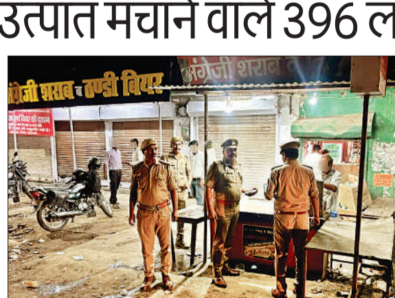
अभियान के तहत जांच करते पुलिस अधिकारी। अमृत विचार