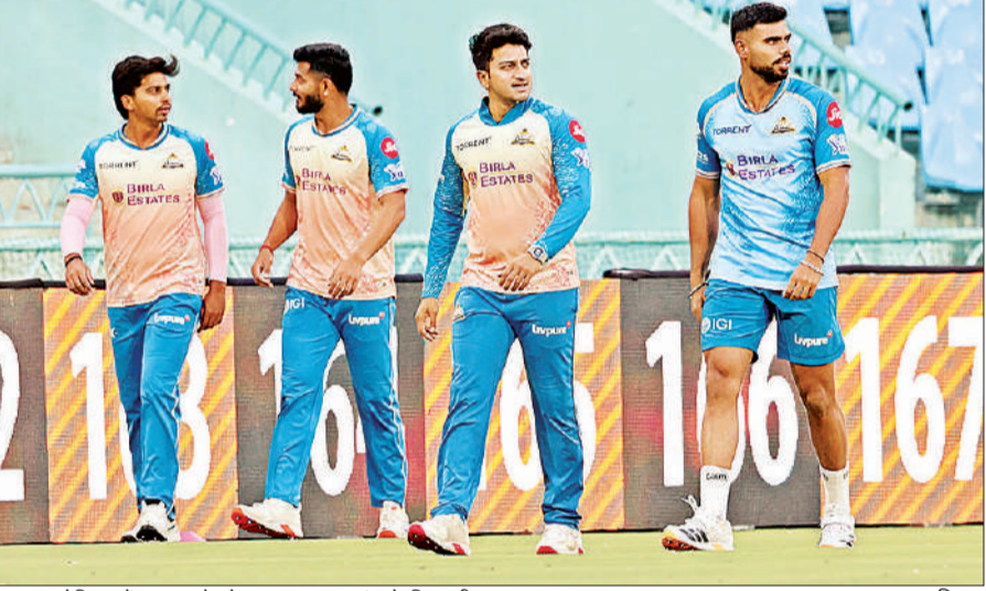
इकाना स्टेडियम में अभ्यास के दौरान गुजरात टाइटंस के खिलाड़ी।

शाम छह से आठ बजे तक चले अभ्यास सत्र में खिलाड़ियों ने बल्लेबाजी, गेंदबाजी और फील्डिंग तीनों विभागों पर विशेष ध्यान दिया। टीम प्रबंधन इस सत्र को काफी अहम मान रहा है, क्योंकि मौजूदा सीजन में गुजरात का प्रदर्शन अब तक उतार-चढ़ाव