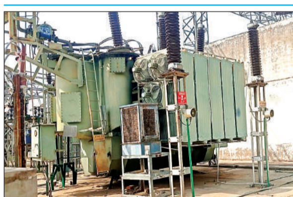
मकरंदनगर स्थित 132 केवी ट्रांसमिशन सेंटर पर लगा ट्रांसफार्मर। अमृत विचार

प्रदर्शन करते रहे पर कोई नतीजा नहीं निकला। खास बात यह कि विभाग के पास ओवरलोडिंग से बचने का कोई विकल्प ही नहीं है। विभागीय जानकारों की माने तो दो वर्ष पहले 132 केवीए बिजली घर में क्षमता वृद्धि की गई थी। इसके बाद लगातार कई कोल्डस्टोरेज