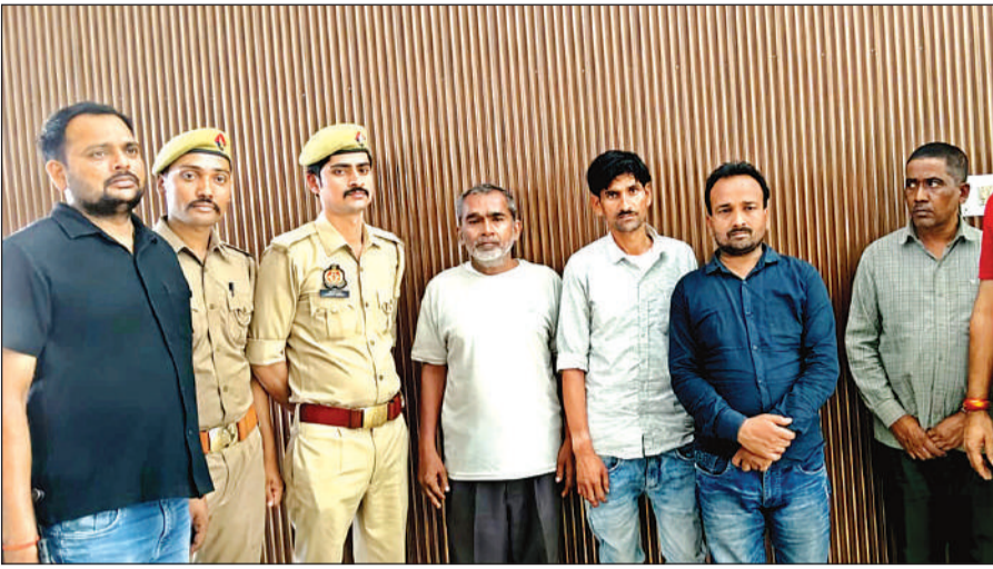
पुलिस की गिरफ्त में चोरी के आरोपी।