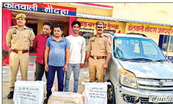
पुलिस की गिरफ्त में आरोपी।