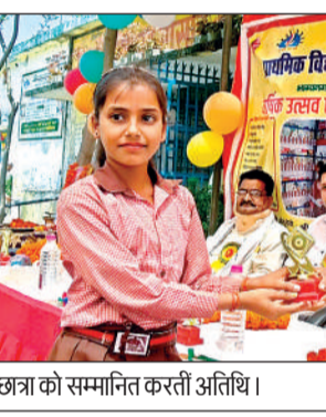
छात्रा को सम्मानित करतीं अतिथि।