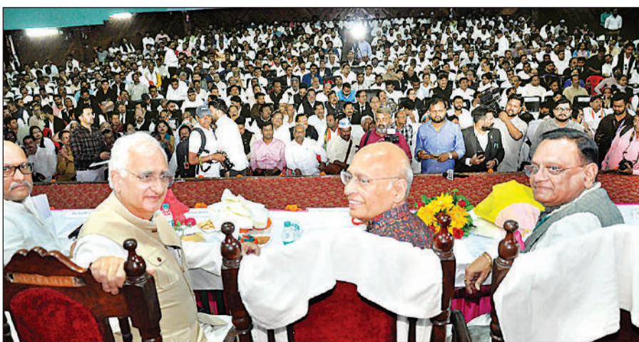
लखनऊ: कांग्रेस मुख्यालय पर आयोजित कार्यक्रम में उपस्थित सलमान खुरशीद, अभिषेक मनु सिंघवी व अन्य पार्टी नेता।

सम्मेलन में बोल रहे थे। पूर्व केंद्रीय मंत्री वरिष्ठ नेता सलमान खुरशीद ने कहा कि हमारा संविधान करोड़ों वंचितों की आशाओं का घोषणा पत्र है, अब जांच एजेंसियां प्रतिशोध का प्रवर्तक बन गई हैं, कुछ अपवादों को छोड़कर जब न्यायपालिका को गर्जना चाहिए, तब अक्सर फुसफुसाती नजर आती है, शक्ति का संतुलन एक अथाह खाई में झुक गया है। कांग्रेस प्रदेश अध्यक्ष अजय राय ने फुले के विचारों, समाज सुधार के कार्यों एवं समाज में भेदभाव और छुआछूत को लेकर उनके द्वारा किए गए सामाजिक जागरण और शिक्षा को लेकर विशेष तौर से उनके प्रयासों को याद किया।