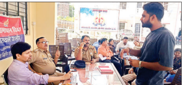
अधिकारियों को शिकायत बताता ग्रामीण।