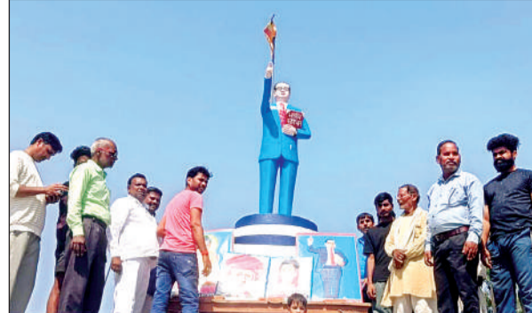
अछल्दा में कार्यक्रम के दौरान मौजूद लोग।