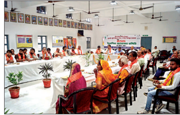
बैठक में मौजूद कृषि वैज्ञानिक और किसान।