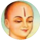
तुलसी मीठे बचन ते, सुख उपजन चहुं ओर। बसीकरन इक मंत्र है, परिहरू बचन कटोर।।

संत तुलसीदास कहते हैं, मीठे वचन से हम सब ओर सुख फैला सकते हैं। किसी को भी वंश में करने के लिए मिठास भरे शब्द एक मंत्र की तरह होते हैं, इसलिए इंसान को चाहिए कि कटोर वचन छोड़कर मीठा बोलने का प्रयास करें और अनजानों को भी अपना बना ले।