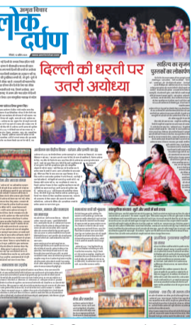
इस बार के रविवारीय संस्करण 'लोक दर्पण' में, दिल्ली की धरती पर उत्तरी अयोध्या व अन्य विषयों पर विशेष सामग्री दी जा रही है।

मुकदमों को वापस लेगी। अब कोई अत्याचार नहीं कर पाएगा, क्योंकि डबल इंजन सरकार साथ खड़ी है और आपके संघर्ष को सम्मान दे रही है।