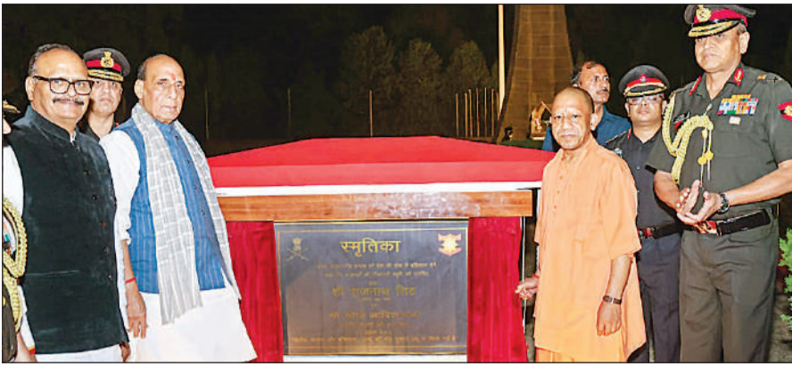
लखनऊ छावनी स्थित स्मृतिका युद्ध स्मारक में लेजर लाइट शो का उद्घाटन करते मुख्यमंत्री योगी व रक्षा मंत्री राजनाथ सिंह।

और कनेक्शन संबंधी शिकायतों को प्राथमिकता के आधार पर हल किया जाएगा। यूपीपीसीएल के अध्यक्ष डॉ. आशीष गौयल ने शक्ति भवन में उच्चस्तरीय बैठक कर सभी अधिकारियों को स्पष्ट निर्देश दिए कि स्मार्ट मीटर से जुड़ी शिकायतों का रोजाना निस्तारण सुनिश्चित किया जाए। उन्होंने कहा कि डिस्कॉम स्तर पर कंट्रोल रूम और मॉनिटरिंग सेल सक्रिय रहकर लगातार समीक्षा करें। अभियान के तहत प्रत्येक अधिकारी को 10 से 20 या उससे अधिक उपभोक्ताओं की जिम्मेदारी सौंपी जाएगी।