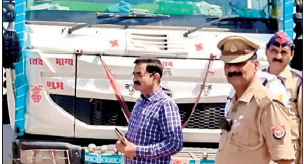
ओवरलोड ट्रक के विरुद्ध कार्रवाई करते अधिकारी।