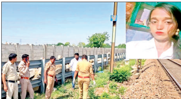
घटना स्थल पर मौजूद पुलिस टीम तथा मृतका की फाइल फोटो

घटना सुबह करीब पौने नौ बजे की बताई जा रही है । भरथना रेलवे स्टेशन के पूर्वी ओर पोल संख्या 1135/11 के पास छात्रा ने अपना स्कूल बैग ट्रैक किनारे रख दिया और अप लाइन पर कानपुर से इटावा की ओर जा रही सुपरफास्ट तेजस एक्सप्रेस के सामने आ गई । ट्रेन की