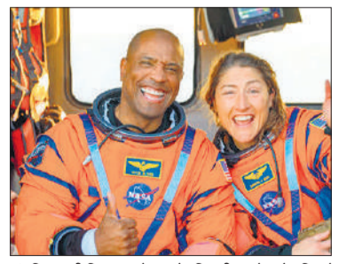
अंतरिक्ष यात्री विक्टर ग्लोवर और क्रिस्टीना कोच सेन डिगो एंव नासा का ओरियन अंतरिक्ष यान।

तालियों की गड़गड़ाहट और उत्साह के बीच नासा के 'आर्टेमिस-2' मिशन के चार अंतरिक्ष यात्री ऐतिहासिक चंद्र यात्रा पूरी करने के बाद प्रशांत महासागर में सुरक्षित उतर गए। यह 50 वर्षों से अधिक समय बाद चंद्रमा तक पहली मानव उड़ान है।