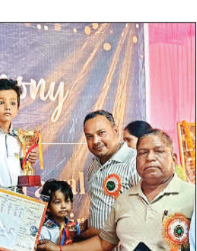
मेधावियों को पुरस्कृत करते अतिथि।