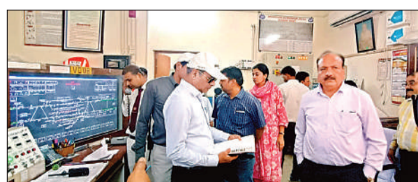
रागौल स्टेशन का निरीक्षण करते डीआरएम।