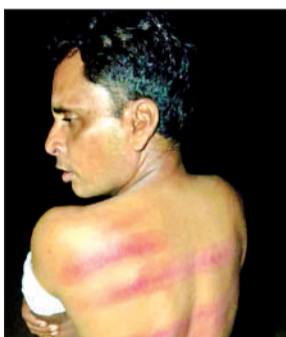
हमले से पीट पर चोटों के निशान दिखाता पीड़ित युवक।