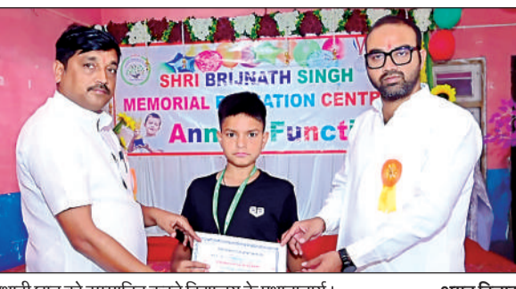
मेधावी छात्र को सम्मानित करते विद्यालय के प्रधानाचार्य।