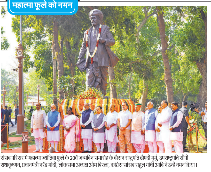
संसद परिसर में महात्मा ज्योतिबा फूले के 20वें जन्मदिन समारोह के दौरान राष्ट्रपति द्रौपदी मुर्मू, उपराष्ट्रपति सीपी राधाकृष्णन, प्रधानमंत्री नरेंद्र मोदी, लोकसभा अध्यक्ष ओम बिरला, कांग्रेस सांसद राहुल गांधी आदि ने उन्हें नमन किया।