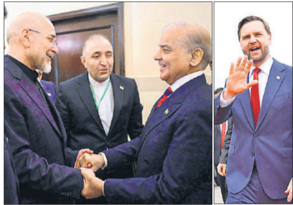
इस्लामाबाद : शांति वार्ता के दौरान प्रधानमंत्री शहबाज ईरानी संसद के अध्यक्ष मोहम्मद बाघेर गालिबफ से बात करते हुए। दाएं : पाकिस्तान पहुंचे अमेरिकी उपराष्ट्रपति जेडी वेंस।

47 साल पहले यानी 1979 में ईरान की इस्लामिक क्रांति के बाद ये पहली बार था जब दोनों देश के नेताओं ने इतने बड़े स्तर पर आमने-सामने