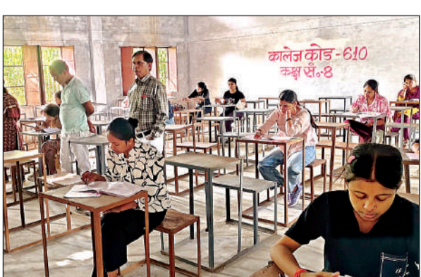
ॐ हरिहर स्नातकोत्तर महाविद्यालय में परीक्षा देते परीक्षार्थी।