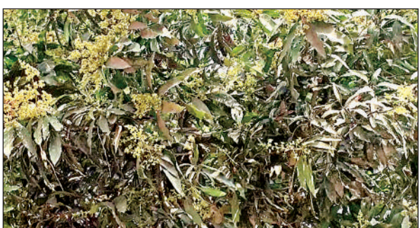
आंधी-बारिश के कारण प्रभावित हुई आम की बौर।

दरअसल, मार्च माह की शुरुआत में तापमान में बढ़ोतरी के चलते आम के पेड़ों पर इस बार अच्छी मात्रा में बौर आया था। इसे देखकर किसानों और बागवानों को बेहतर