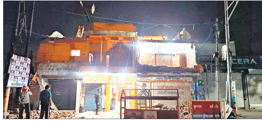
सूद धर्मकांटा चौराहा स्थित प्राचीन पंचमुखी मंदिर का अग्रभाग काफी हद तक तोड़ा जा चुका है।

डोहरा रोड पर नकटिया नदी के पुल के पास मंदिर हो या रहलखंड यूनिवर्सिटी के पास मस्जिद व जाट रेजीमेंट सेंटर के समीप मजार, लंबे समय से पूरा सिस्टम उनकी ओर देख रहा है। रामगंगा नगर बनने के बाद शहर उस ओर विस्तार ले रहा है लेकिन बाईपास के पास मंदिर की वजह से सड़क चौड़ी नहीं हो पा रही। यही कहानी पीलीभीत बाईपास