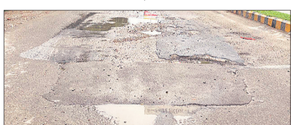
बदहाल पीलीभीत बाईपास रोड। (फाइल फोटो)

बरेली, अमृत विचार : पीलीभीत बाईपास पर बैरियर टू से फीनिक्स मॉल तक दो किलोमीटर सड़क बदहाल है। जल निगम ग्रामीण ने तीन साल पहले सीवर लाइन डालने के लिए सड़क बनाई थी। नियम के अनुसार खोदाई के बाद सड़क को वापस पीडब्ल्यूडी की इस सड़क को पुरानी चमक देनी थी, लेकिन जल निगम ने ऐसा नहीं किया। इस दो किलोमीटर के टुकड़े पर राहगीर रोज अपनी जान हथेली पर रखकर सफर करने को मजबूर हैं।