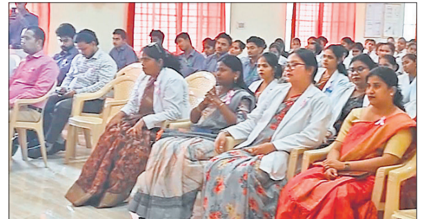
कार्यक्रम में मौजूद शिक्षक और स्टूडेंट्स।