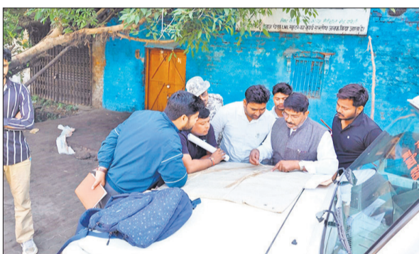
नैनीताल रोड पर नापजोख करती नगर निगम की टीम।