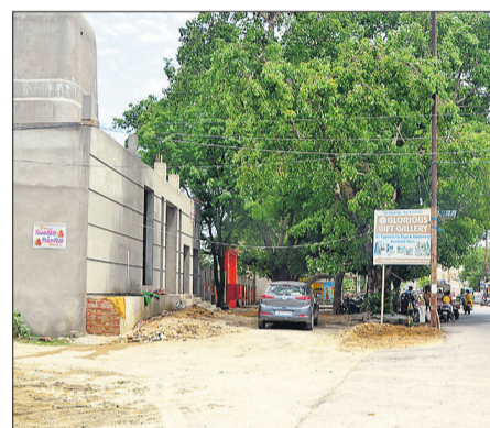
डोहरा-बाईपास रोड पर सड़क से किनारे मंदिर। ● अमृत विचार

और बरेली-शाहजहांपुर रोड पर मस्जिद व मजार की वजह से है, जहां सम्बंधित विभाग चाहकर भी