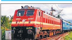
नगर स्पेशल ट्रेन प्रत्येक मंगलवार को रात 11 बजे बान्द्रा टर्मिनस से चलेगी और दूसरे दिन विभिन्न स्टेशनों से होते हुए इज्जतनगर दिन 12:47 बजे पहुंचकर तीसरे दिन सुबह 7:35 बजे गोमती नगर पहुंचेगी। यह स्पेशल ट्रेन कुल 5 फेरों के लिए संचालित की जाएगी। ट्रेन में कुल 22 कोच लगाए जाएंगे। उन्होंने बताया कि यात्रियों को सुगम यात्रा उपलब्ध कराने के लिए इस विशेष गाड़ी का संचालन किया जा रहा है। बरेली सहित आसपास के क्षेत्रों के यात्रियों को मुंबई जाने में काफी सहूलियत मिलेगी।

● इज्जतनगर सहित कई प्रमुख स्टेशनों से होकर गुजरेगी