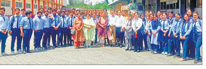
विद्यार्थियों ने उत्पादन इकाई का अवलोकन किया।