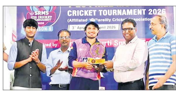
विजयी टीम के खिलाड़ियों को सम्मानित किया गया।

अमृत विचार : श्रीराम मूर्ति मेमोरियल टी-20 प्राइज मनी क्रिकेट टूर्नामेंट सीजन-6 के सेमीफाइनल मुकाबलों में शनिवार को रोमांचक क्रिकेट देखने को मिला। पहले सेमीफाइनल में मेरठ डिस्ट्रिक्ट क्रिकेट एसोसिएशन (एमडीसीए) ने बजाज टेक्सटाइल अमरौहा को 34 रन से हराकर फाइनल में जगह बनाई। वहीं, दूसरे सेमीफाइनल में आईके नेक्स्ट जनरेशन ने एसएनएस बुलंदशहर को 73 रन से हराकर खिताबी मुकाबले में प्रवेश किया।