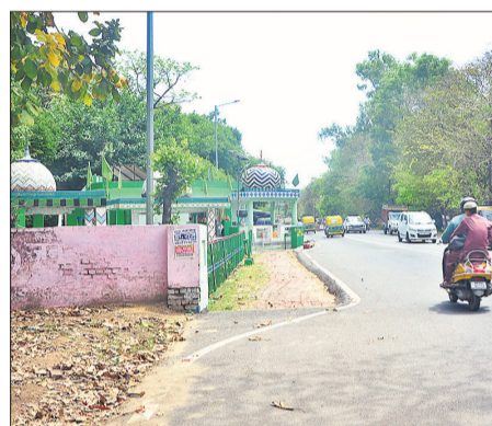
जाट रेजीमेंट के पास सड़क किनारे मजार। ● अमृत विचार

और बरेली-शाहजहांपुर रोड पर मस्जिद व मजार की वजह से है, जहां सम्बंधित विभाग चाहकर भी