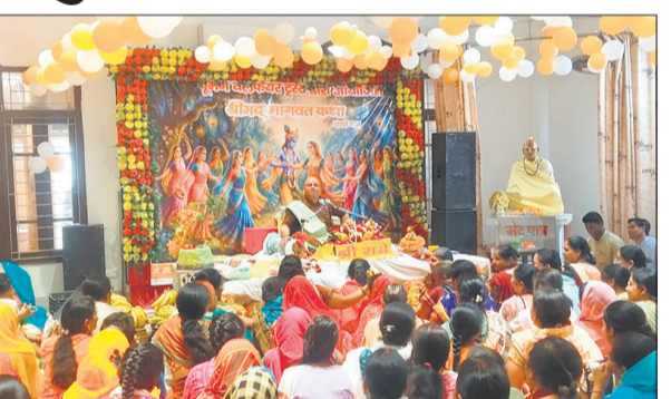
कथा में बड़ी संख्या में श्रद्धालुओं ने भाग लिया।