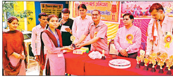
बच्चों को पुरस्कृत करते खंड शिक्षा अधिकारी।

● प्रतियोगिताओं के विजेता बच्चों को पुरस्कार देकर बढ़ाया हौसला