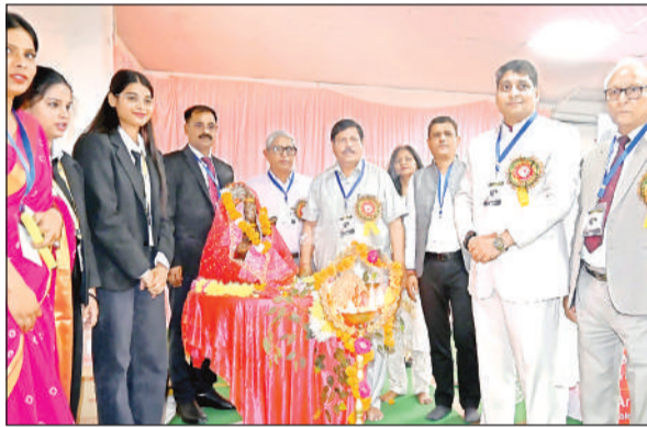
दीप प्रज्वलन कर कार्यक्रम का शुभारंभ करते अतिथिगण।