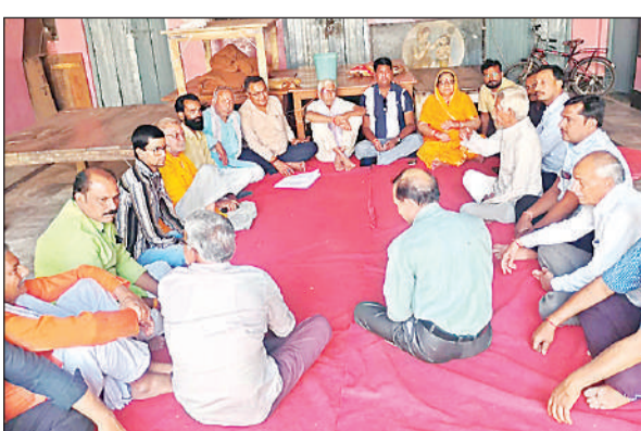
तैयारी बैठक में मौजूद लोग।