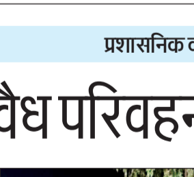
गत दिनों जांच करती टीम। फाइल फोटो

अमृत विचार। अवैध मौरंग परिवहन में लोकेशन बताने वाले प्रशासनिक कार्रवाई पर भारी साबित हो रहे हैं। यही वजह है कि अवैध मौरंग परिवहन को लेकर प्रशासन को अपेक्षित परिणाम नहीं मिल रहे। शनिवार देररात तक चले अभियान में टीम को महज आधा दर्जन अवैध बालू के ट्रक मिले हैं उनके जाते ही हाईवे पर ट्रकों का रेला निकल पड़ा था।