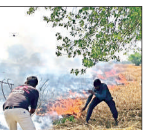
आग बुझाते ग्रामीण। अमृत विचार

अमृत विचार। थाना क्षेत्र के गांव पुरवा भदौरिया में रविवार को दोपहर करीब 12 बजे अज्ञात कारणों से गेहूं के खेतों में आग लग गई। देखते ही देखते आग गांव के किनारे तक पहुंच गई। ग्रामीणों के अथक प्रयासों से लगभग ढाई बजे आग पर काबू पाया जा सका।