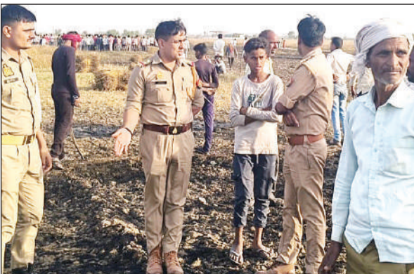
गेहूं के खेत में लगी आग की जानकारी लेती पुलिस।

अमृत विचार। टठिया थाना क्षेत्र के धन्नापुरवा गांव में रविवार को अज्ञात कारणों से खेतों में खड़ी गेहूं की फसल में आग लग गई। देखते ही देखते आग ने विकराल रूप धारण कर लिया। भीषण आग में करीब 100 बीघा गेहूं को तैयार खड़ी फसल जलकर राख हो गई। आग की लपटें इतनी तेज थीं कि आसपास के किसानों में अफरा-तफरी मच गई। ग्रामीणों ने किसी तरह आग पर काबू पाने का प्रयास किया, लेकिन तब तक फसल जल गई। आगजनों में कई किसानों की मेहनत की पूरी फसल बर्बाद हो गई। अग्नि कांड में प्रभावित किसानों में