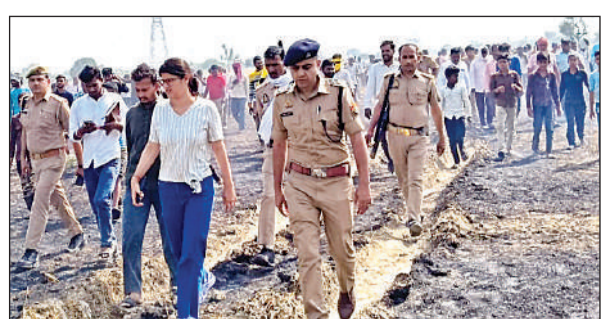
पुरवा भदौरिया में लगी आग के बाद मौके का निरीक्षण करते अधिकारी।

कानपुर देहात। साइबर अपराधों के खिलाफ चलाए जा रहे अभियान के तहत शिवली पुलिस ने साइबर टगी का शिकार हुये एक युवक के बैंक खाते में रुपये वापस करवाए। अज्ञात साइबर टगा टेलीग्राम में दिए गए टास्क के माध्यम से पैसा दोगुना करने का झंझा देकर बैंक के खाते से टगी करते हुये रुपये ट्रांसफर करवा लिए जाने की शिकायत करण शिवली कोतवाल के निर्देशन पर टीम ने 33 हजार रुपये दिलवाए।