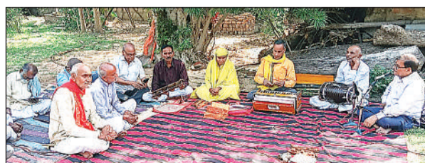
सत्संग में कबीर के भजन सुनाते लोग।

अमृत विचार। आज का मानव धन सम्पत्ति अर्जित कर बिलासिता व अज्ञानता की नींद में सोते हुए अहंकार पूर्ण जीवन जी रहा है। पैसे की लालसा में ईश्वर का नाम नहीं लेता, शराब के नशे में जीवन को व्यर्थ कर रहा, जबकि सच्चा रसायन राम नाम का है। इसलिए मानव को राम नाम का जाप करना चाहिए, क्योंकि कलघुषा में मन को परम शांति, सकारात्मक ऊर्जा और भय से मुक्ति दिलाने वाला सबसे सरल और प्रभावशाली साधन माना जाता है।