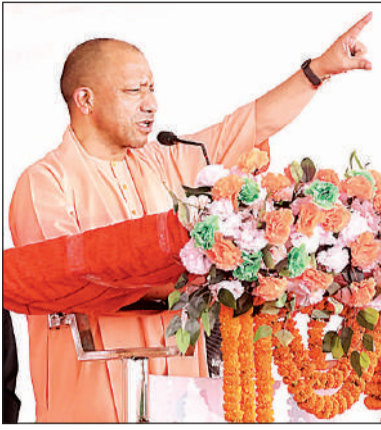
पश्चिम बंगाल में आयोजित एक जनसभा के दौरान उपस्थित जनसमूह को संबोधित करते मुख्यमंत्री योगी आदित्यनाथ।

उन्होंने बंगाल की आर्थिक स्थिति पर भी सवाल उठाए और कहा कि एक समय देश की अर्थव्यवस्था में अहम योगदान देने वाला राज्य आज पिछड़ गया है। उद्योग बंद हो रहे हैं और युवाओं को रोजगार नहीं मिल रहा। इसके उलट उत्तर प्रदेश में बड़े उद्योगों और एमएसएमई के माध्यम से रोजगार के अवसर बढ़े हैं। मुख्यमंत्री ने कहा कि नौ वर्ष पहले उत्तर प्रदेश की स्थिति भी बंगाल जैसी थी, लेकिन अब प्रदेश में कानून व्यवस्था बेहतर हुई है