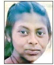
अशिका फाइल फोटो।

अमृत विचार। रविवार की सुबह 8:30 बजे तालग्राम रोड स्थित भाऊलपुर तिराहे पर एक भीषण सड़क दुर्घटना ने पूरे इलाके को झकझोर दिया। कोयला लदे बेकाबू ट्रक ने कोचिंग जाने के लिए बस का इंतजार कर रही 14 वर्षीय हाईस्कूल की छात्रा को रौंदा दिया। इसके अनियंत्रित ट्रक सड़क किनारे लगी फल की दुकान पर जा पलटा।