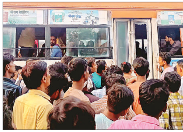
रोडवेज बस का टूटा शीशा और लगी भीड़। अमृत विचार

अमृत विचार। कस्बा के स्थानीय तिराहा पर रविवार की देर शाम पत्नी के साथ जा रहे पति पर पहली पत्नी और उसके परिजनों ने बस पर हमला बोल दिया। कंडक्टर के गेट न खोलने पर महिला ने उसका शीशा तोड़ दिया और जमकर हंगामा काटा। मौके पर लोगों की भीड़ लग गई। इससे जाम लग गया। सूचना पर पहुंची पुलिस ने रोडवेज बस और महिलाओं को कोतवाली ले गई।