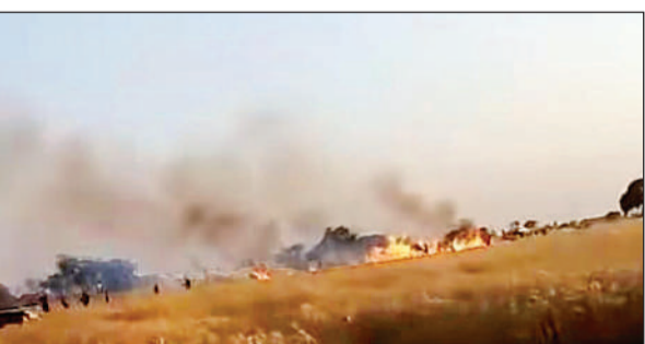
तार की चिंगारी से भड़की आग ने गेहूं की फसल जला डाली।