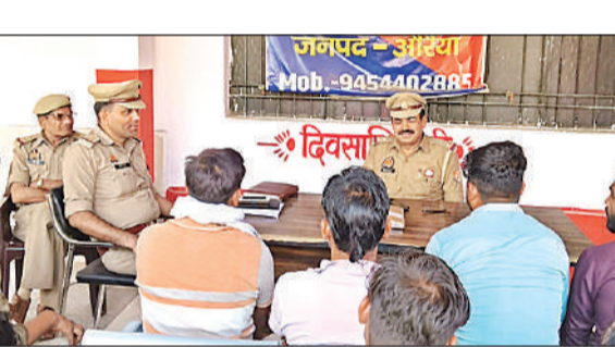
बैठक के दौरान मौजूद लोग।

। शांति व्यवस्था बनाए रखने को लेकर डीजे संचालकों के साथ थाना अध्यक्ष ने पीस कमेटी की बैठक की। बैठक में थानाध्यक्ष ने कहा कि आंबेडकर जयंती के दौरान डीजे और बैड संचालक ध्वनि प्रदूषण के निर्धारित मानकों का पालन करें। तेज आवाज में संगीत न बजाने के सख्त निर्देश दिए। बैठक में उपस्थित सभी सदस्यों से पर्व के दौरान आपसी सौहार्द और शांति बनाए रखने की अपील की गई। इसका उद्देश्य आंबेडकर जयंती को शांतिपूर्ण ढंग से संपन्न कराना