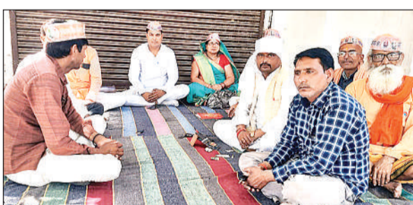
बैठक में समस्याओं पर चर्चा करते किसान नेता।

बैठक को संबोधित करते हुए बुंदेलखंड किसान यूनियन के जिलाध्यक्ष ने कहा कि जिले के किसानों की समस्याएं कम होने का नाम नहीं ले रही है। पहले फसल की बुवाई के लिए खाद बीज की