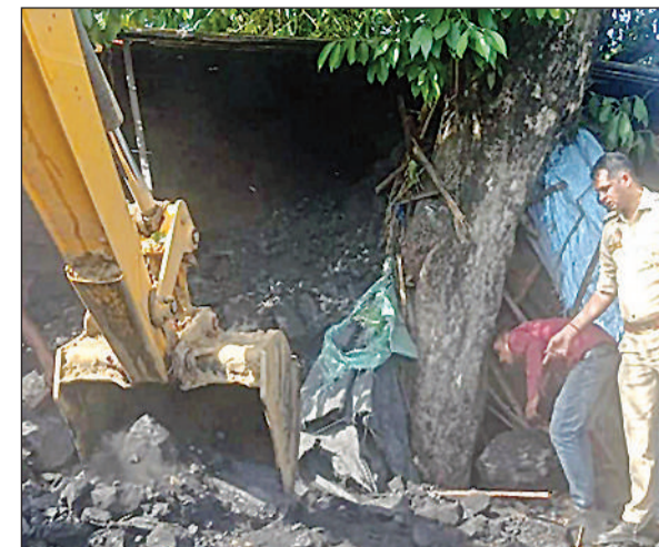
जेसीबी से कोयले का मलवा हटाकर घायलों को निकलवाते अधिकारी व पुलिस।