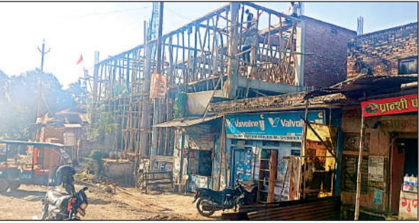
धार्मिक स्थल की जमीन पर चल रहा निर्माण कार्य।