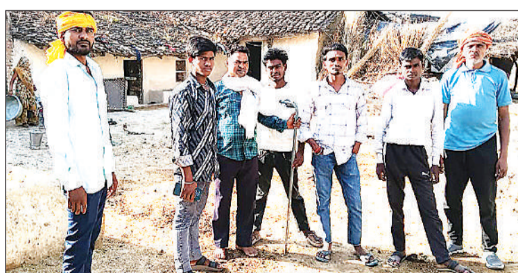
बिना टॉटी के टूट बने पाइप के पास खड़े ग्रामीण।