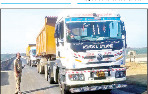
थाने के बाहर खड़े कराए गए सीज वाहन। अमृत विचार

● खतरनाक स्टंटबाजी करने पर 2 बाइकों को भी सीज किया गया