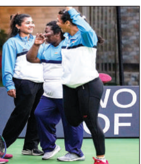
बिली जीन किंग कप के दौरान भारतीय खिलाड़ी।