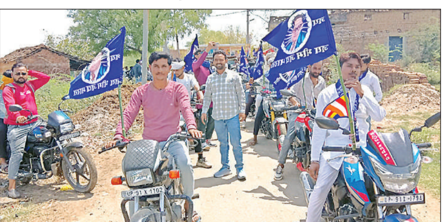
आंबेडकर जयंती के पूर्व बाइक रैली निकालते युवक।

14 अप्रैल को डॉक्टर भीमराव अंबेडकर का जन्म दिवस पूरे देश में बड़े हर्षोल्लास के साथ मनाया जाता है। भारत रत्न, अर्थशास्त्री, राजनीतिज्ञ, संविधान सभा में प्रासूप समिति के अध्यक्ष ने सामाजिक कुरीतियों, भेदभाव, छुआछूत का