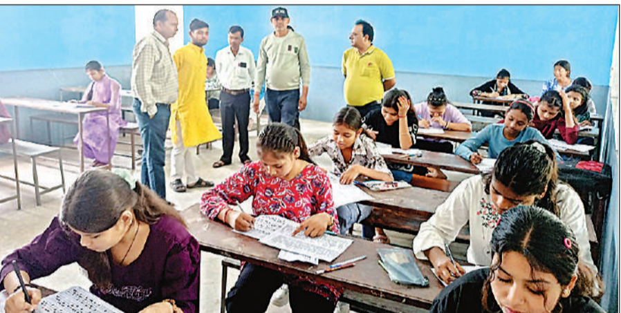
कंप्यूटर प्रशिक्षण के लिए प्रवेश परीक्षा में प्रतिभाग करते छात्र-छात्राएं।

अमृत विचार। स्थानीय मां गीता महेश्वरी इंटर कॉलेज में रविवार को NIPEC कंप्यूटर संस्थान द्वारा 'मेरी पहचान संयुक्त प्रवेश परीक्षा का सफल आयोजन किया गया। इस परीक्षा का मुख्य उद्देश्य मेधावी छात्र-छात्राओं को निःशुल्क एवं न्यूनतम शिक्षण शुल्क पर उच्च स्तरीय कंप्यूटर प्रशिक्षण प्रदान करना है। इस परीक्षा में नगर और ग्रामीण क्षेत्रों के सैकड़ों छात्र-छात्राओं ने उत्साहपूर्वक प्रतिभाग किया। उल्लेखनीय है कि NIPEC कंप्यूटर संस्थान द्वारा प्रतिवर्ष इस प्रकार की प्रवेश परीक्षा आयोजित की जाती है, ताकि आर्थिक रूप से कमजोर और प्रतिभाशाली विद्यार्थियों को तकनीकी शिक्षा से जोड़कर उन्हें भविष्य की चुनौतियों के लिए अग्रणी बनाया जा सके। इस