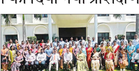
प्रशिक्षण में शामिल होने वाले शिक्षक।