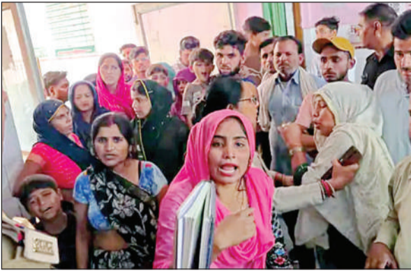
पुलिस के समक्ष रोष व्यक्त करती महिलाएं।