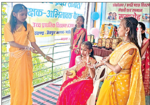
स्कूल में रंगारंग सांस्कृतिक कार्यक्रम प्रस्तुत करते बच्चे।

जिलाधिकारी ने सन् 2022 में धारा 52 का प्रकाशन आनन फानन में करा दिया है, लेकिन कस्बा क्षेत्र के किसानों को खतौनी आज तक ऑनलाइन नहीं चढ़ाई गई, जिससे किसानों का ऑनलाइन पंजीयन नहीं हो पा रहा है और न ही फॉर्मर रजिस्ट्री हो पा रही है। किसानों के पहचान पत्र के अभाव में सरकारी लाभार्थी परक योजनाओं से किसान वंचित हो रहे हैं। प्रशासन की लापरवाही से खतौनी के अभाव में कुलपहाड़ क्षेत्र के किसान खासा परेशान हैं।