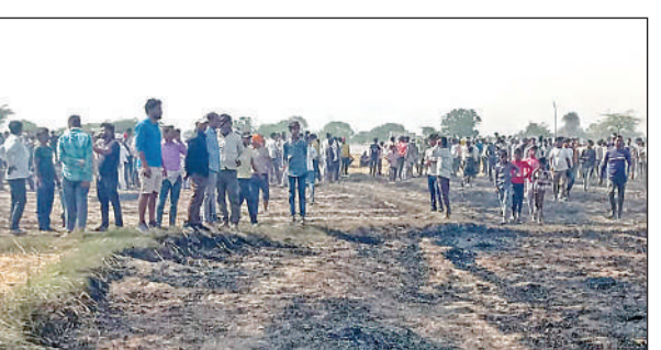
भुरेपुर में आग की सूचना पर मौके पर मौजूद भीड़।