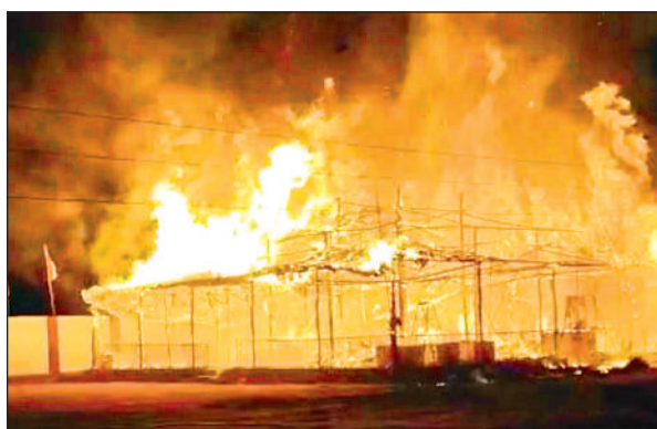
धू-धूकर जलती यज्ञशाला।