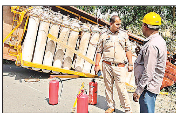
पलटते पड़े सीएनजी के ट्रक को देखते पुलिस और फायर कर्मी