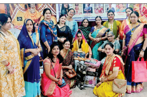
निर्धन कन्या के विवाह के लिए जुटीं जायन्ट्स की पदाधिकारी। अमृत विचार

● गरीब कन्या की शादी के लिए सामान और आर्थिक सहयोग