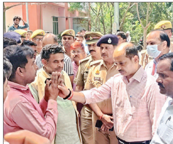
मृतक के परिवार से जानकारी लेते डीएम, एसपी अमृत विचार