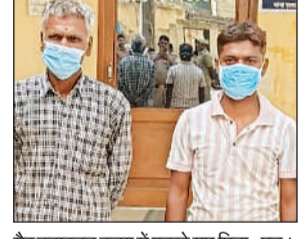
गैर इरादतन हत्या में पकड़े गए पिता-पुत्र।