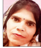
कुमकुम की फाइल फोटो।

अमृत विचार । पड़ोसन से पति के प्रेम प्रसंग को लेकर नाराज पत्नी ने कमरे के अंदर फांसी लगाकर आत्महत्या कर ली। घटना के बाद महिला के बेटे ने ही सारा चिट्ठा खोल कर सामने रखा है। जबकि मृतका के भाई ने उसके पति, सास-ससुर और पड़ोसन पर हत्या का आरोप लगाया है। पुलिस का कहना है कि पोस्टमार्टम रिपोर्ट आने के बाद ही इस बारे में आगे कुछ कहा जाएगा।