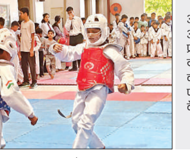
आगरा में आयोजित प्रतियोगिता के दौरान प्रदर्शन करते आरएस पब्लिक स्कूल के खिलाड़ी।

बांगरमऊ अमृत विचार । आगरा में आयोजित द्वितीय इन्वेटेशनल ओपन ताइक्वांडो चैंपियनशिप में बांगरमऊ के आरएस पब्लिक स्कूल के छात्र-छात्राओं ने अपनी प्रतिभा का लोहा मनवाते हुए शानदार प्रदर्शन किया है। प्रतियोगिता में स्कूल के 19 खिलाड़ियों ने हिस्सा लिया और गौरव की बात यह रही कि सभी 19 खिलाड़ियों ने पदक जीतकर जनपद और विद्यालय का मान बढ़ाया। विद्यालय के खिलाड़ियों ने प्रतियोगिता में कुल 19 पदक अपने नाम किए, जिनमें 3 स्वर्ण, 8 रजत