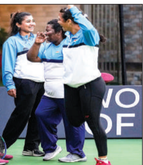
बिली जीन किंग कप के दौरान भारतीय खिलाड़ी।