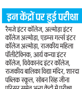
इन केंद्रों पर हुई परीक्षा

अभ्यर्थी परीक्षा में शामिल हुए। वहीं, 411 परीक्षा से अनुपस्थित रहे। दूसरी पाली में सामान्य ज्ञान परीक्षा आयोजित की गई। कुल पंजीकृत 1221 में से 810 अभ्यर्थी परीक्षा में शामिल हुए। वहीं, 411 परीक्षा से अनुपस्थित रहे। तीसरी पाली में गणित विषय की परीक्षा