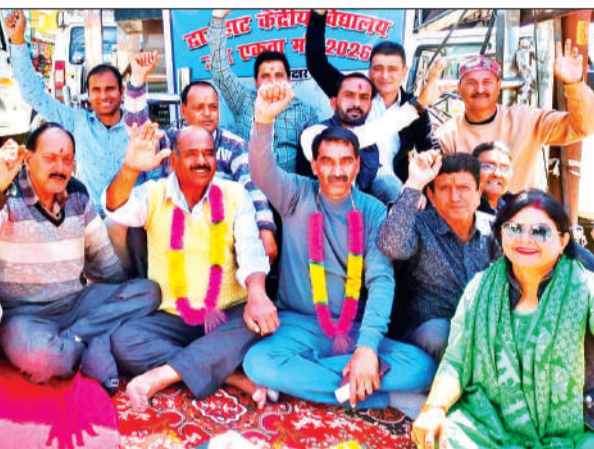
द्वाराहाट में रविवार को केंद्रीय विद्यालय की मांग को लेकर अनशन पर बैठे लोग।