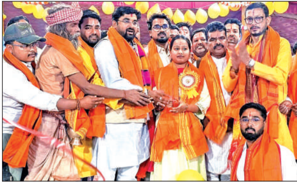
सुरेन्द्रनगर में धार्मिक महोत्सव का उद्घाटन करते चेयरमैन व अन्य।