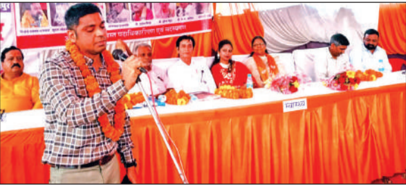
वैती मेला परिसर में आयोजित सम्मेलन में कविता पाठ करता युवा कवि।