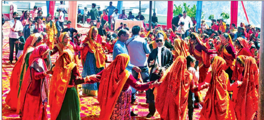
जैनोली कौतिक में झोड़ा गायन करते ग्रामीण।