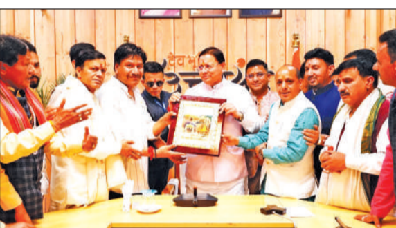
मुख्यमंत्री धामी का आभार जताते तीर्थ पुरोहित एवं संगठनों के प्रतिनिधि।

मुख्यमंत्री ने कहा कि सरकार श्रद्धालुओं की आस्था का सम्मान करते हुए चारधाम यात्रा को और अधिक सुगम एवं सुलभ बनाने के लिए प्रतिबद्ध है। राज्य में दर्शन के लिए आने वाले सभी श्रद्धालुओं की सुविधा, सुरक्षा और बेहतर व्यवस्थाएं सरकार की सर्वोच्च प्राथमिकता हैं। सभी संबंधित