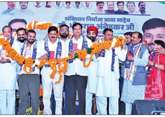
देहरादून में 'जय भीम, जय हिंद' कार्यक्रम में मौजूद कांग्रेस के वरिष्ठ पदाधिकारी।

पीकर वाहन चलाने वाले 24 चालकों को अलग-अलग थाना क्षेत्रों से गिरफ्तार किया गया तथा 62 वाहन चालकों के न्यायालय के चालान किए गए। अभियान के दौरान रायपुर पुलिस ने रात्रि में