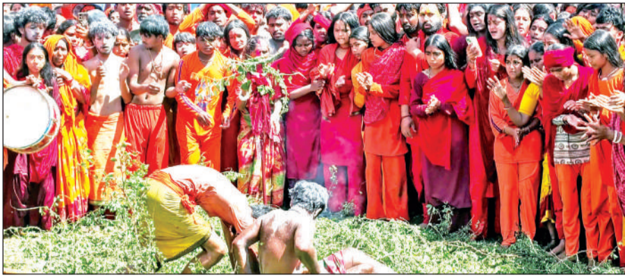
तारकेश्वर धाम में नंगे पांव कांटों पर चलते और अटखेलियां करते सन्यासी।

सुरेन्द्रनगर स्थित तारकेश्वर धाम एवं बैकुण्ठपुर स्थित शिवालय में इस विशेष अवसर पर शिव भक्त पूरे विधि-विधान से पूजा-अर्चना करने के बाद खजूर के ऊंचे पेड़ पर चढ़ते हैं और उसके नुकीले, जहरीले कांटों पर नृत्य करते हैं। कांटों से भरे उस