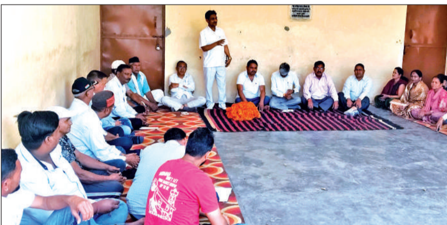
लालकुआं में ब्लॉक कांग्रेस कमेटी की बैठक में भाग लेते कांग्रेस कार्यकर्ता। ● अमृत विचार

वक्ताओं ने आरोप लगाया कि भारतीय जनता पार्टी ने चुनाव के दौरान बिंदुखत्ता को राजस्व गांव का दर्जा देने का वादा किया था, लेकिन अब तक इस दिशा में कोई कार्रवाई नहीं हुई। साथ ही गोला नदी में सुरक्षा दीवार का कार्य भी शुरू नहीं कराया गया है। बैठक