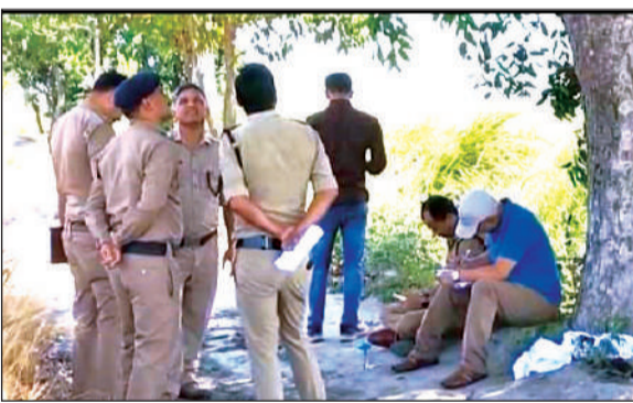
घटनास्थल का मौका मुआयना करती पुलिस।

अमृत विचार: थाना पंतनगर इलाके में एक युवक का शव पेड़ से लटकता मिला। सूचना पर पहुंची पुलिस ने घटनास्थल का मौका मुआयना किया। तलाशी लेने पर युवक की जेब से एक सुसाइड नोट बरामद हुआ है। पुलिस ने शव को पोस्टमार्टम को भेज दिया है और सुसाइड के कारणों की जांच में जुट गई है। जानकारी के अनुसार गुरुवार की सुबह थाना पंतनगर पुलिस को खबर मिली है कि सिडकुल चौकी इलाके के ओमेक्स कॉलोनी गेट के ठीक सामने गेहूं के खेत स्थित एक पेड़ पर युवक का शव