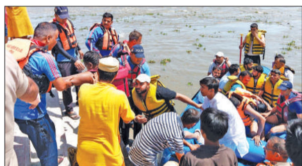
टापू में फंसे लोगों का रेस्क्यू करती पुलिस और आपदा प्रबंधन टीम।