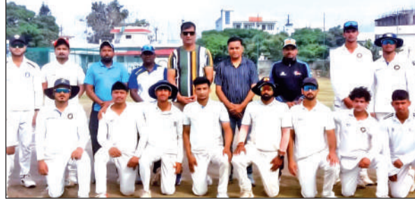
विजेता नैनीताल की टीम के खिलाड़ी, कोच व अपायर।

टांस जीतकर पहले बल्लेबाजी करने उतरी अल्मोड़ा की टीम का फैसला गलत साबित हुआ और पूरी टीम 24वें ओवर में मात्र 115 रनों