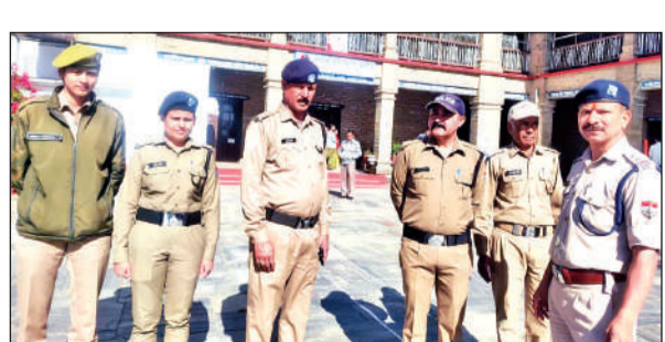
अल्मोड़ा में यूपीएससी परीक्षा के दौरान तैनात पुलिस बल।

जिला मुख्यालय के विभिन्न केंद्रों में तीन पालियों में परीक्षा संपन्न कराई गई, जिसमें एनडीए की पहली पाली में गणित विषय की परीक्षा आयोजित हुई। परीक्षा में कुल पंजीकृत 1784 में से 1301 अभ्यर्थी परीक्षा में शामिल हुए। वहीं, 483 परीक्षा से अनुपस्थित रहे। दूसरी पाली में सामान्य योग्यता परीक्षा आयोजित की गई।