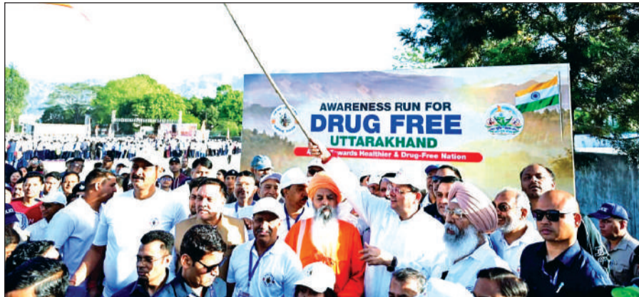
एमबी इंटर कॉलेज में अवेयरनेस रन को झंडा दिखाकर रवाना करते सीएम पुष्कर सिंह धामी।

सीएम ने कहा कि नशा एक साइलेंट वार की तरह फैल रहा है, इसका सबसे बड़ा निशाना युवा शक्ति है। मजाक-मजाक में युवा नशे की चपेट में आ जाते हैं फिर वहां से लौटना बहुत मुश्किल हो जाता है। यह न सिर्फ व्यक्ति, बल्कि पूरे परिवार की खुशियों को संकट में डाल देता है। उन्होंने कहा कि प्रधानमंत्री नरेंद्र मोदी के वर्ष 2020 में शुरू किए नशा मुक्त भारत अभियान से प्रेरणा लेकर