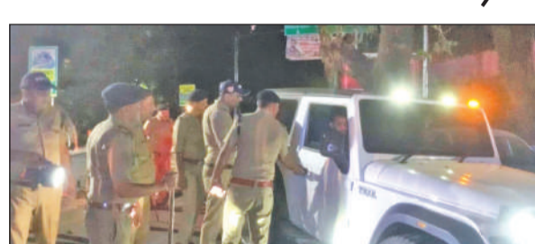
राजधानी में थार वाहन की चेकिंग करती दून पुलिस।