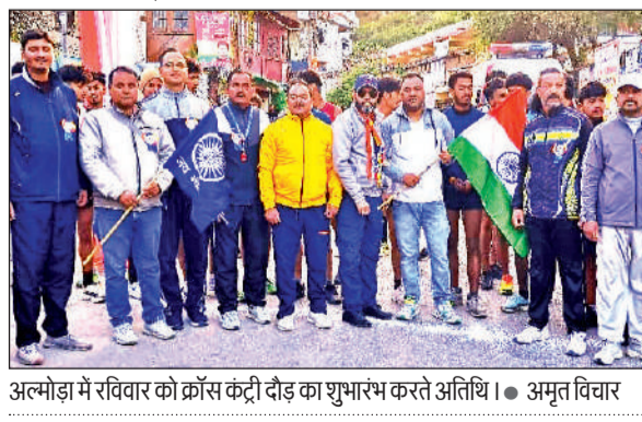
अल्मोड़ा में रविवार को क्रॉस केंद्री दौड़ का शुभारंभ करते अतिथि।