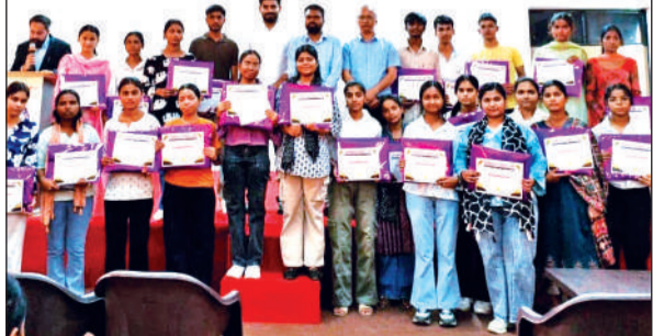
दिनेशपुर सिक्स सिग्मा इंस्टीट्यूट में मेधावी विद्यार्थियों को प्रशस्ति पत्र प्रदान करते शिक्षक।

अमृत विचार: सिक्स सिग्मा इंस्टीट्यूट ऑफ टेक्नोलॉजी एंड साइंस में आरोहण-2026 छात्रवृत्ति परीक्षा का आयोजन किया गया। शैक्षणिक उत्कृष्टता को प्रोत्साहित करने के उद्देश्य से आयोजित इस परीक्षा में विभिन्न विद्यालयों के 265 विद्यार्थी शामिल हुए, जबकि पूरे क्षेत्र के लगभग 6000 विद्यार्थियों ने प्रारंभिक चरण में प्रतिभाग किया। रविवार को संस्थान में कार्यक्रम के अंतिम चरण में लिखित परीक्षा आयोजित की गई। इससे पूर्व कॉलेज जीवन पर आधारित एक नाट्य प्रस्तुति और प्रभावशाली नुक्कड़ नाटक ने सभी का ध्यान आकर्षित किया।