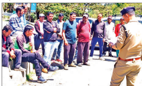
लमगाड़ा क्षेत्र में लोगों को जागरूक करते पुलिस कर्मी। ● अमृत विचार

रविवार को पुलिस ने लमगाड़ा, मोतियापाथर, नाटाडोल, दुर्गानगर, गंगानगर, शहरफाटक आदि स्थानों पर जागरूकता अभियान चलाया। इस दौरान टीम ने ग्रामीणों एवं स्थानीय नागरिकों को वर्तमान समय में बढ़ रहे साइबर फ्रॉड,