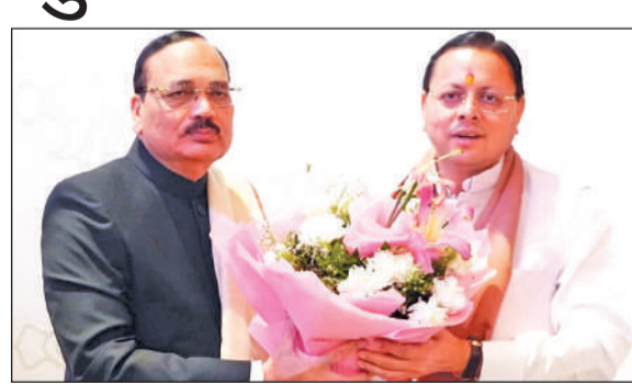
देश के प्रधान न्यायाधीश सूर्यकांत का सम्मान करते मुख्यमंत्री पुष्कर सिंह धामी।