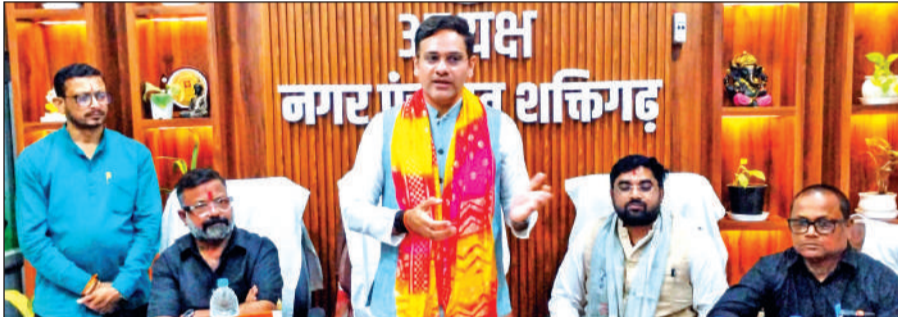
कार्यकर्ताओं एवं जनप्रतिनिधियों को संबोधित करते कैबिनेट मंत्री।

कैबिनेट मंत्री सौरभ बहुगुणा ने बताया कि लगभग 70 करोड़ रुपये की लागत से बनने वाले इस आंचल प्लांट का निर्माण कार्य आरंभ कर दिया गया है। उन्होंने कहा कि प्लांट स्थापित होने से क्षेत्र के दुग्ध उत्पादकों को सीधा लाभ मिलेगा और स्थानीय स्तर पर रोजगार के नए अवसर भी सृजित होंगे। उन्होंने यह भी स्पष्ट किया कि सरकार की ऐसी कोई मंशा नहीं है कि किसी सरकारी उद्यम को काश्तकार की भूमि पर स्थापित किया जाए, यह कुछ विकास विरोधी लोगों द्वारा फेलाया गया भ्रामक दुष्प्रचार है। उन्होंने कहा कि क्षेत्र में आधारभूत ढांचे को मजबूत करने के लिए कई योजनाओं पर तेजी से कार्य किया जा