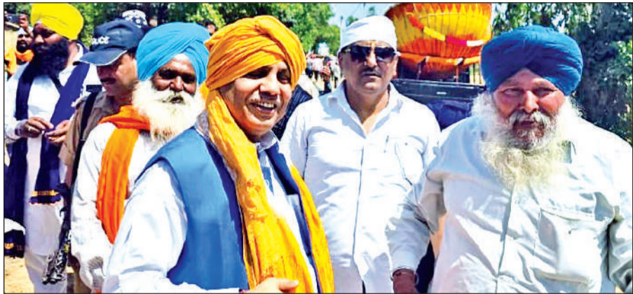
जसपुर पहुंचने पर दर्जा राज्यमंत्री विनय रोहेला का स्वागत करते सिख समुदाय के लोग।

दर्जा राज्यमंत्री विनय रोहेला ने की योजनाओं की समीक्षा, दिए निर्देश