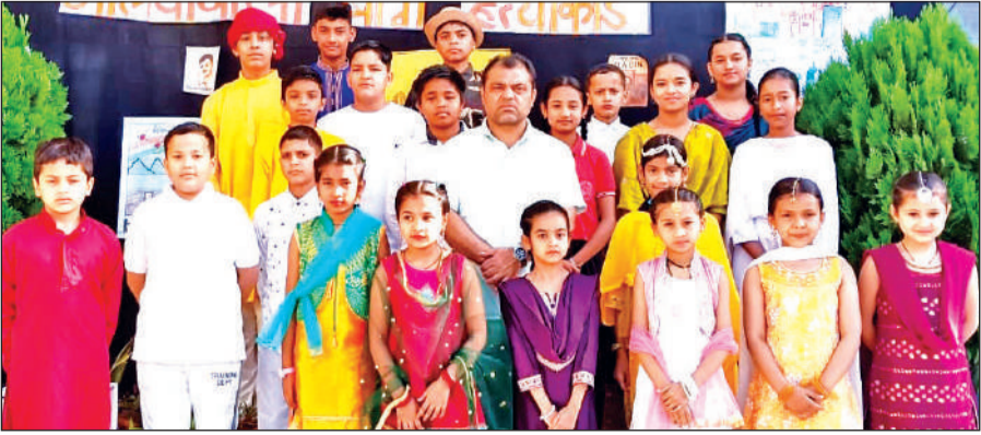
खटीमा के सोर वैली पब्लिक स्कूल में जलियांवाला बाग हत्याकांड का मंचन करने वाले बाल कलाकार व प्रबंधन।

अमृत विचार: सोर वैली पब्लिक स्कूल के विद्यार्थियों द्वारा 13 अप्रैल 1919 को अमृतसर के जलियांवाला बाग में हुई घटना का मंचन किया गया। उस समय बैसाखी का पर्व मना रहे लोग एक शांतिपूर्ण सभा में एकत्रित थे। जनरल डायर ने बिना किसी चेतवानी के बाग के एकमात्र निकास द्वार को घेर लिया और निरथे लोगों पर अंधाधुंध गोली चलाने का आदेश दे दिया। इस नरसंहार में अनेक निर्दोष लोग शहीद हुए और हजारों घायल हुए। बाग में स्थित कुआँ आज भी उस दर्दनाक दृश्य का गवाह है, जिसमें कई लोगों ने अपनी जान