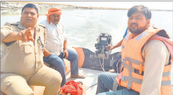
शारदा नदी में तलाश करती पुलिस टीम।