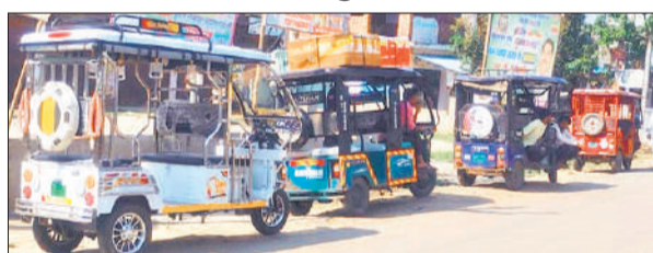
अजान में सड़क पर खड़े ई-रिक्शा।

स्थानीय लोगों ने बताया कि ई रिक्शा चालक मेन रोड पर सड़क के किनारे ही रिक्शा खड़ा कर सवारियों भरते हैं। सड़क किनारे रिक्शा खड़े होने से बाइक और कार सवारों को साइड लेने में भारी दिक्कत होती है। इसके चलते आए दिन जाम की स्थिति बन जाती है। इसी अव्यवस्था के कारण कई बार दुर्घटनाएं भी हो