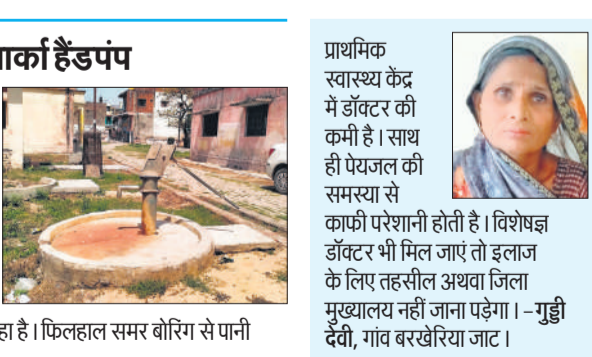
पीएचसी में पेयजल की समस्या गंभीर बनी हुई है।

पीएचसी में पेयजल की समस्या गंभीर बनी हुई है। जिला पंचायत द्वारा लगाई गई पानी की टंकी और फ्रीजर उपयोग में नहीं है। एकमात्र इंडिया मार्क हैंडपंप पिछले दो वर्षों से खराब पड़ा है, जिसकी मरम्मत अब तक नहीं हो सकी है। स्वास्थ्य विभाग का आरओ तो स्थापित है, लेकिन उससे जुड़ी टंकी क्षतिग्रस्त होने के कारण उसका लाभ नहीं मिल पा रहा है। फिलहाल समर बीरिंग से पानी भरकर काम चलाया जा रहा है।