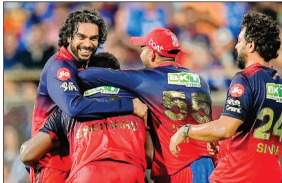
जीत का जश्न मनाते रॉयल चैलेंजर्स बेंगलुरु के खिलाड़ी।

रॉयल चैलेंजर्स बेंगलुरु (आरसीबी) ने फिल सॉल्ट, कप्तान रजत पाटीदार और विराट कोहली के अर्धशतकों से रविवार को यहां इंडियन प्रीमियर लीग (आईपीएल) के टी20 मैच में मुंबई इंडियंस को 18 रन से हरा दिया। बल्लेबाजी का न्योता मिलने के बाद आरसीबी ने शीर्ष क्रम में सॉल्ट (78 रन), पाटीदार (53 रन) और कोहली (50 रन) को बढौलत चार विकेट पर 240 रन का बड़ा स्कोर खड़ा किया। इसके जवाब में पांच बार की चैंपियन मुंबई इंडियंस को टीम 20 ओवर में पांच विकेट पर 222 रन बना सकी। उसके लिए शेरफाने रदरफोर्ड ने 31 गेंद में 71 रन (नौ छक्के, एक चौका) की नाबाद पारी खेली और शीर्ष स्कोरर रहे। कप्तान हार्दिक पंड्या ने 40 रन, रेयान रिक्लटन ने 37 रन और सूर्यकुमार यादव ने 33 रन का योगदान दिया। आईपीएल के 13 सत्र में पहली दफा टूर्नामेंट की शुरुआत जीत से करने के बावजूद मुंबई इंडियंस की टीम इस लय को जारी नहीं रख सकी जिससे उसे