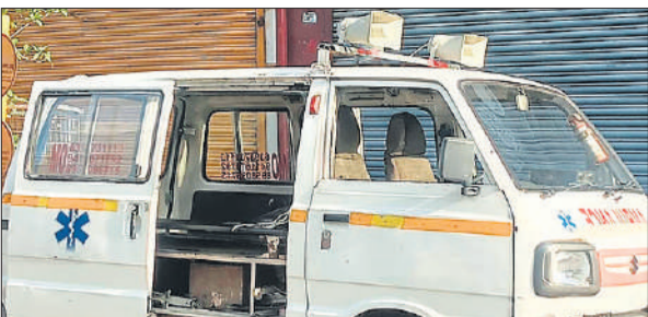
शहर के एक अस्पताल के बाहर खड़ी निजी एंबुलेंस।

शहर में निजी एंबुलेंस का जाल तेजी से फैलता जा रहा है। इनकी हकीकत चौंका देने वाली हैं। पुराने और खटारा वाहनों, खासकर वैन को मामूली बदलाव कर एंबुलेंस का रूप दे दिया है। इन गाड़ियों में सिर्फ एक स्ट्रेचर डालकर मरीजों को ढोया जा रहा है, जबकि जरूरी सुविधाएं पूरी तरह नदारद हैं। शहर में करीब 30 से अधिक एंबुलेंस संचालित होती हैं। नियमों