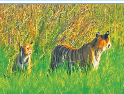
जंगल सफारी के दौरान वहालकदमी करते एक साथ दो बाघ।