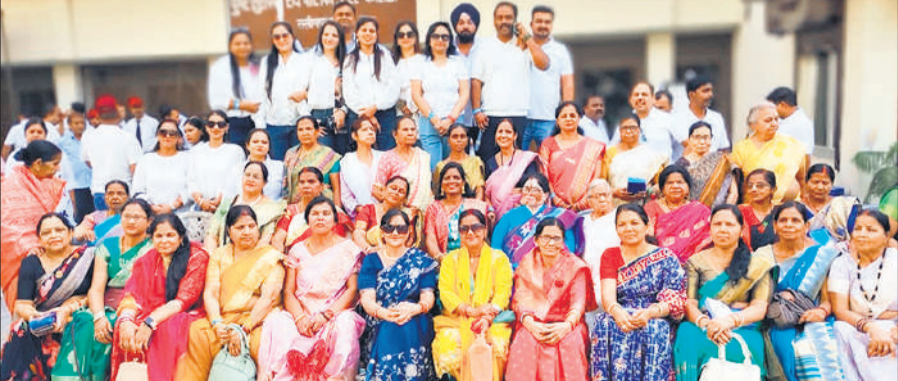
कार्यक्रम में शामिल पूर्व छात्र, छात्राएं व स्कूल स्टाॅफ व अन्य।

यादों को फिर से जोड़ना थीम पर आयोजित इस कार्यक्रम में पुराने साथियों और गुरुजनों का मिलन हुआ, जिसने सभी को बीते सुनहरे दिनों में पहुंचा दिया। कार्यक्रम में देश के विभिन्न हिस्सों से पहुंचे पूर्व छात्र-छात्राओं ने भाग लिया। जैसे ही वर्षों बाद सहपाठी एक-दूसरे से मिले, माहौल खुशी और भावुकता से भर गया। कई प्रतिभागी अपने पुराने दोस्तों को पहचानने और उनसे