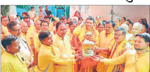
यात्रा में शामिल श्रद्धालु।