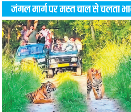
जंगल सफारी के दौरान बाघों को कैमरे में कैद करते सैलानी।

पीलीभीत टाइगर रिजर्व का जंगल और महोफ रेंज स्थित इको टूरिज्म स्पोर्ट्स चूका बीच खूबसूरती की मिसाल है। पूरे पर्यटन सत्र के दौरान जनपद के अलावा दूर-दराज के राज्यों से सैलानियों का आमद रहती है। इधर रविवार को छुट्टी के चलते पीलीभीत टाइगर रिजर्व के टूरिस्ट प्वाइंटों पर पूरे दिन सैलानियों का जमावाड़ा लगा रहा। मुस्तफाबाद,