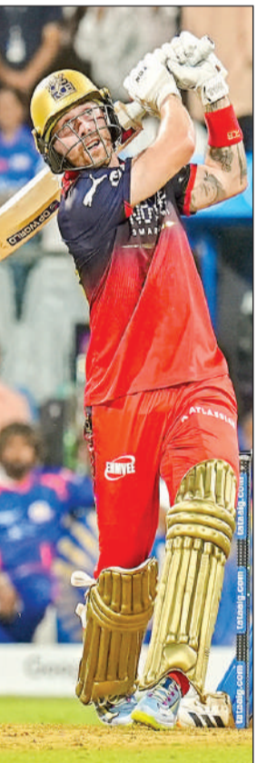
विस्फोटक पारी के दौरान शॉट लगाते फिल सॉल्ट।