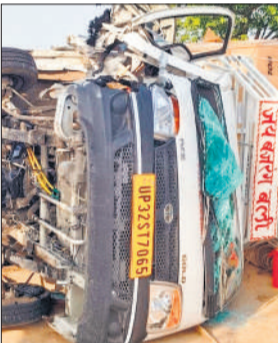
लखीमपुर-पलिया मार्ग पर पलटी पड़ी पिकअप।

राहगीरों और आसपास के लोगों ने मौके पर पहुंचकर कड़ी मशक्कत कर चालक को जैसे-