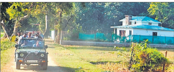
पीलीभीत टाइगर रिजर्व की जंगल सीमा से सटकर बनाया गया रिसॉर्ट।

पीलीभीत टाइगर रिजर्व की कोर एरिया के एक किलोमीटर के दायरे में आने वाले इको-सेंसिटिव जोन में बिना अनुमति के दर्जनों रिसॉर्ट्स और टूरिस्ट स्मॉट बन गए हैं। जबकि सुप्रीम कोर्ट और केंद्रीय पर्यावरण मंत्रालय के स्पष्ट आदेश हैं कि टाइगर रिजर्व के