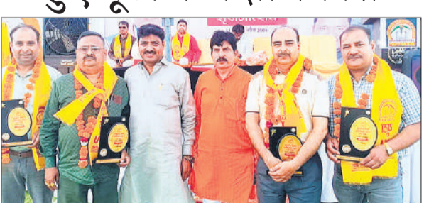
आगरा में सम्मेलन में सम्मानित हुए यूटा के जिलाध्यक्ष व अन्य।