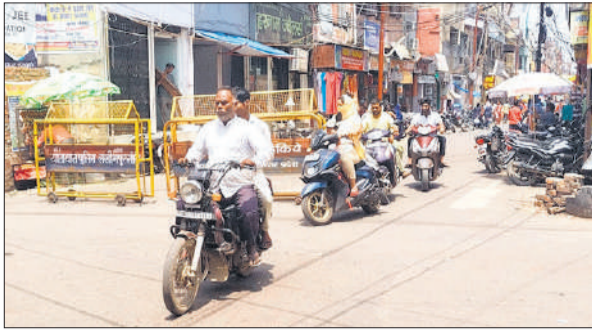
चिलचिलाती धूप में सदर चौराहे से गुजरते लोग।

रविवार सुबह न्यूनतम पारा 19 डिग्री और अधिकतम पारा 34 डिग्री रिकार्ड हुआ। इसके बाद पार में तेजी से उछाल आता गया। दोपहर 12 बजे तक पारा 30 डिग्री तक जा पहुंचा। इसी के साथ तपन भी बढ़ती गई। दोपहर तीन बजे तक पारा 34 डिग्री जा पहुंचा जो शाम चार बजे तक स्थिर रहा। ऐसे में तेज धूप लोगों के लिए असहनीय रही। लोग तेज धूप से बचने के