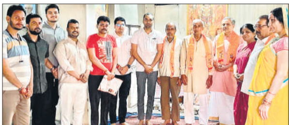
लक्ष्मीनगर कॉलोनी में स्वच्छता अभियान के तहत लोगों से संपर्क करते कार्यकर्ता।