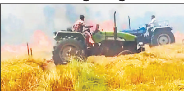
खेत में लगी आग को ट्रैक्टर की मदद से बुझाने की कोशिश करते किसान।

हादसा रविवार दोपहर का है। बताते हैं कि अधिकांश ग्रामीण घरों में थे। इस बीच खेतों की तरफ आग लगने के बाद धुएं का गुबार उठता दिखा। गांव में अफरातफरी मच गई। तेज हवा के चलते आग कुछ ही देर में भीषण हो गई। एक से दूसरे खेत में फैलती चली गई। ग्रामीण जमा हुए और ट्रैक्टर की मदद से आग बुझाने का प्रयास