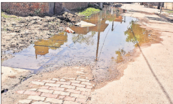
जिला पंचायत इंटर कॉलेज मार्ग पर बहता नालियों का पानी।

नगर पंचायत को साफ-सफाई और विकास कार्यों के लिए करोड़ों रुपये का बजट मिलने के साथ करीब 80 सफाई कर्मचारियों की तैनाती भी बताई जाती है, लेकिन इसके बावजूद हालात बदतर बने हुए हैं। नालियों में गंदगी भर जाने के कारण पानी ओवरफ्लो होकर