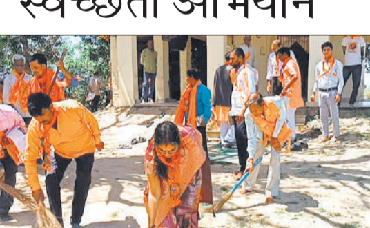
हैदराबाद गांव के मंदिर पर सफाई करते भाजपाई।