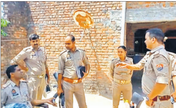
घटना के बाद घर में पड़ताल करती रजपुरा पुलिस।