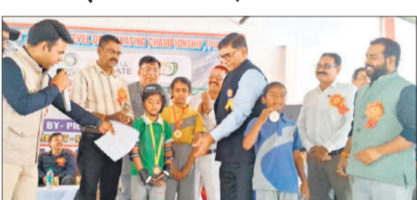
स्केटिंग प्रतियोगिता में पुरस्कृत किए जाते बच्चे।

प्रतियोगिता में कई स्कूलों के बच्चों ने प्रतिभाग किया। डीएम ने कहा कि जनपद में प्रथम बार स्केटिंग प्रतियोगिता का आयोजन हो रहा है। ये छात्रों के लिए नए आयाम लिखने का मौका है। उन्हें आगे बढ़ाने के