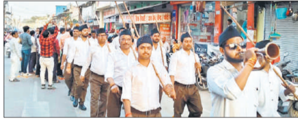
गोला में पथ संचलन निकालते आरएसएस के लोग।