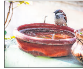
तपती धूप में टंडक की तलाश में पानी के टब पर बेठी नर्ही चिड़िया।