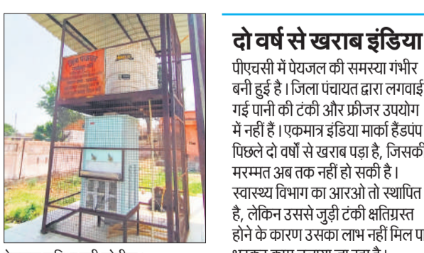
पेयजल सुविधा बनी शोपीस।

हैं, जिनकी उपस्थिति के चलते ओपीडी में प्रतिदिन औसतन 90 मरीजों का इलाज हो रहा है, जो सीजन में 150 तक पहुंच जाता है। स्वास्थ्य केंद्र में स्टाफ की उपलब्धता संतोषजनक है। यहां फार्मासिस्ट, वार्ड बॉय, लैब टेक्नीशियन, स्वीपर, एएनएम, दो स्टाफ नर्स और एक एलएचवी