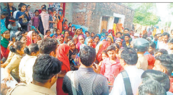
भुडवारा में उग्र परिवारियों और ग्रामीणों को समझाती पुलिस।