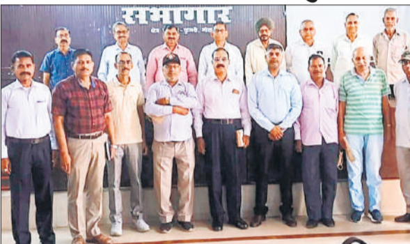
गोला की बैठक में मौजूद पूर्व सैनिक।