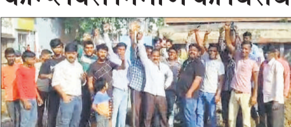
कलीनगर में विरोध प्रदर्शन करते ग्रामीण।