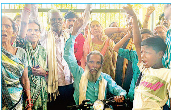
लौलई उपकेंद्र के बाहर नरबाजी करते उपभोक्ता और उनके परिजन।