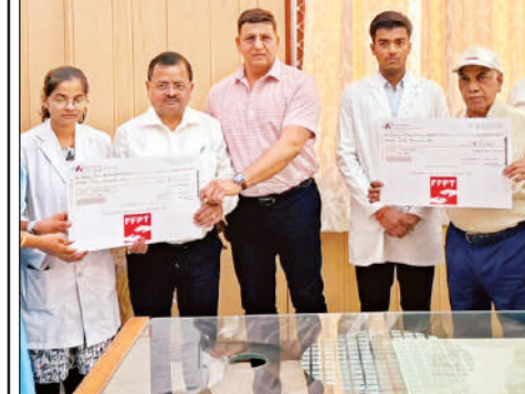
दोनों छात्रों को चेक सौंपते पदाधिकारी।