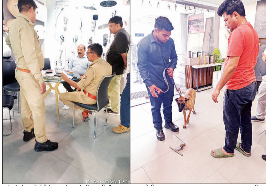
गुडंबा में शोरूम में चोरी के बाद जांच करते पुलिसकर्मी और डाग स्ववायड की टीम।