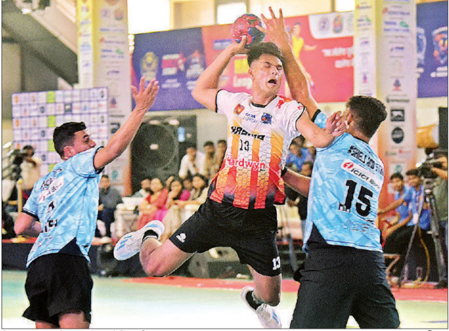
गेंद पर कब्जा करने का प्रयास करते खिलाड़ी।