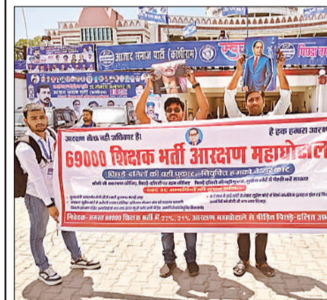
नियुक्ति की मांग को लेकर नारे लगाते आरक्षित अभ्यर्थी।