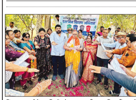
हिंद नगर वार्ड में नागरिकों को स्वच्छता की शायद दिलाती महापौर।