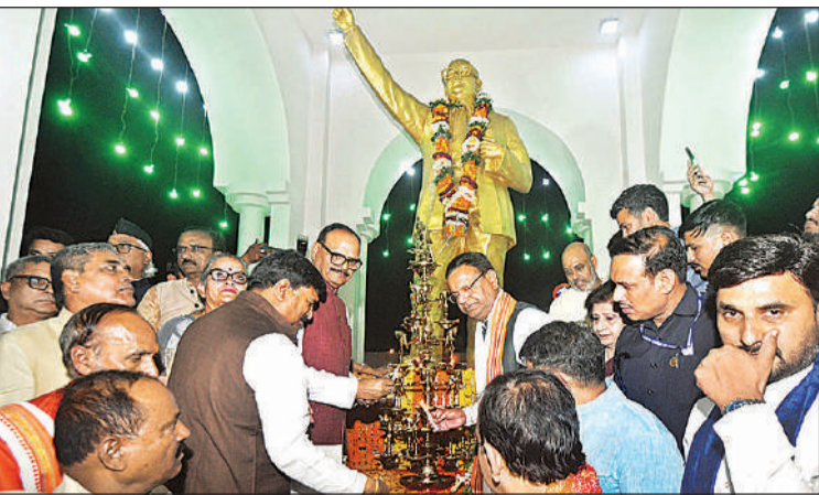
गोमती नगर स्थित आंबेडकर पार्क के सामने बाबा साहेब पर गीत प्रस्तुत करते कलाकार और डॉ. आंबेडकर की प्रतिमा के समक्ष दीप जलाते भाजपा प्रदेश अध्यक्ष पंकज चौधरी, उप मुख्यमंत्री ब्रजेश पाठक व अन्य।