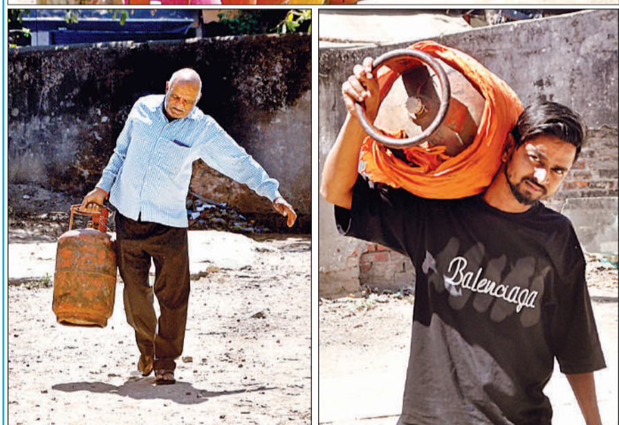
शहर में रसोई गैस की समस्या लगभग डेढ़ महीने बाद भी खत्म नहीं हुई है। गैस एजेंसियों के बाहर सुबह से ही सिलेंडरों के साथ लोग लाइन में लग जाते हैं, ज्यादातर जगह तो धूप में ही लाइन लगानी पड़ती है। शंटों धूप में तपने के बाद सिलेंडर मिल पाता है। अमृत विचार