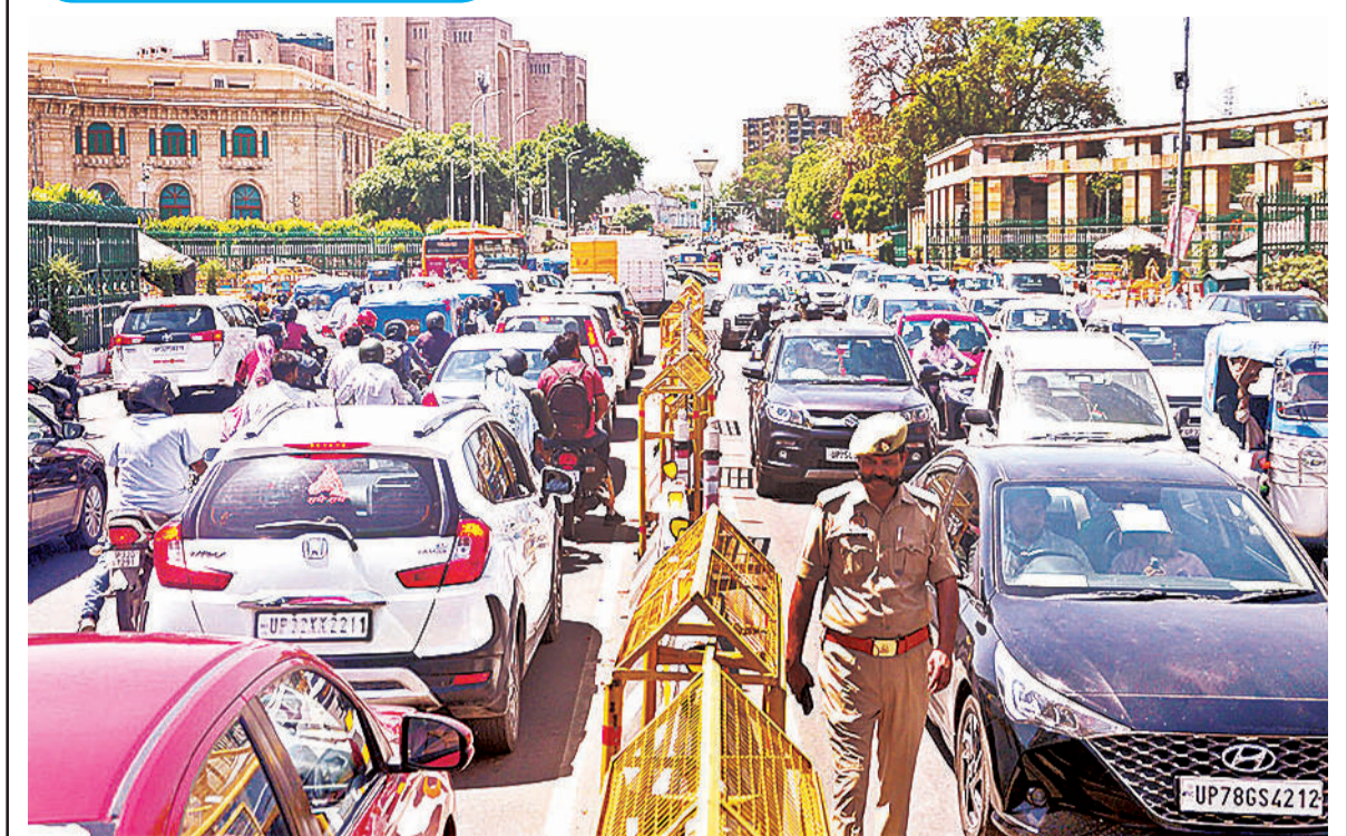
जाम की समस्या आम हो चुकी है। सोमवार को विधान भवन व लोक भवन के सामने लगा जाम।