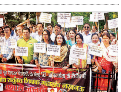
अपनी मांगों को लेकर प्रदर्शन करते शिक्षक।