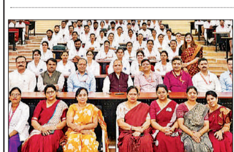
कार्यक्रम में मौजूद नर्स व चिकित्सक।