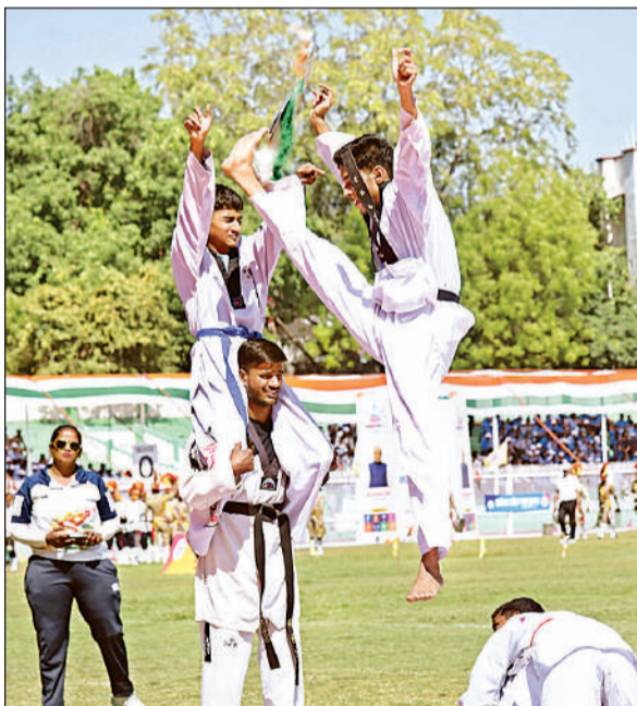
उद्घाटन समारोह में प्रदर्शन करते खिलाड़ी।

केडी सिंह बाबू स्टेडियम में सोमवार से रक्षामंत्री राजनाथ सिंह ने सांसद खेल महाकुंभ का रिमोट बटन दबाकर उद्घाटन किया। इस दौरान खिलाड़ियों ने योगासन, ताइक्वांडो और कलारिपयट्टू का प्रदर्शन किया। कलारिपयट्टू टीम के तलवार-ढाल, लाठी, उर्मी शोल्ड और हाई किक विधाओं के प्रदर्शन कर लोगों का दिल जीत लिया। बाद रक्षामंत्री ने 10 अंतरराष्ट्रीय खिलाड़ियों, पांच प्रशिक्षकों और प्रतिभागियों को मोमेंटो, अंगवस्त्र और नकद पुरस्कार देकर सम्मानित किया।