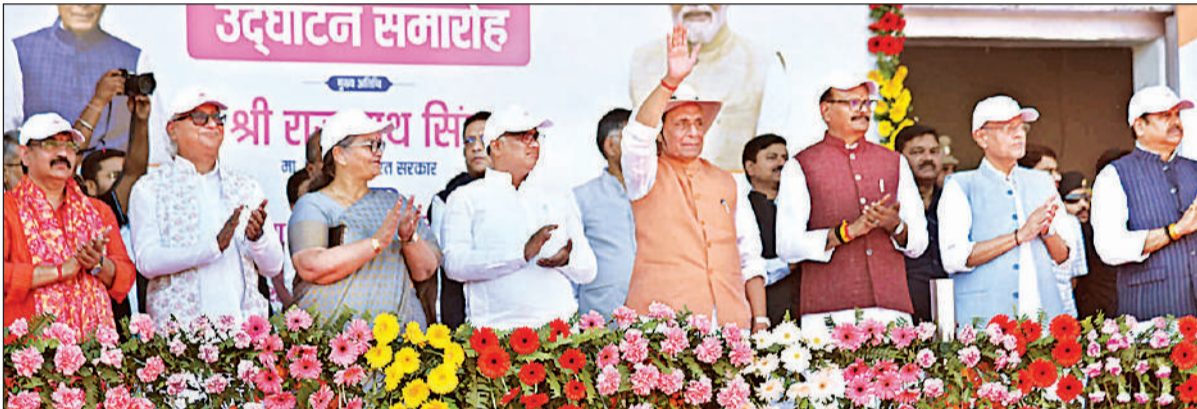
केडीसिंह बाबू स्टेडियम में सांसद खेल महाकुंभ का उद्घाटन करने के बाद खिलाड़ियों का अभिवादन रवीकारते रक्षामंत्री राजनाथ सिंह, साथ में ब्रजेश पाठक व अन्य।