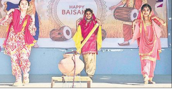
बेनहर स्कूल में आयोजित कार्यक्रम में बच्चे।