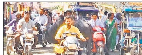
विशाल टॉकीज के पास एक तरफ ई-रिक्शा की कतार और सांड के पास से गुजरते लोग।

सड़क की ओर बढ़ा रहा दुकानों का अतिक्रमण : एक तरफ यातायात व्यवस्था को दुरुस्त बनाने के लिए