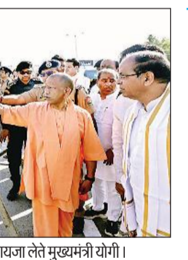
एक्सप्रेसवे के लोकार्पण कार्यक्रम की तैयारी का जायजा लेते मुख्यमंत्री योगी।

अमृत विचार: प्रधानमंत्री नरेंद्र मोदी के प्रस्तावित दौर से पहले मुख्यमंत्री योगी आदित्यनाथ सोमवार को सहारनपुर पहुंचे और कार्यक्रम स्थल का स्थलीय निरीक्षण कर तैयारियों का जायजा लिया। उन्होंने हेलीपैड से लेकर जनसभा स्थल तक व्यवस्थाओं को परखा और अधिकारियों के साथ बैठक कर आवश्यक दिशा-निर्देश दिए। प्रधानमंत्री मंगलवार को सहारनपुर के गणेशपुर में बनाए गए हेलीपैड पर उतरेंगे। यहां से वे रोड शो करते हुए मां डाट काली मंदिर पहुंचेंगे और पूजा-अर्चना करेंगे। इसके बाद देहरादून जाकर जनसभा को संबोधित करते हुए दिल्ली-देहरादून एक्सप्रेसवे का लोकार्पण करेंगे, जिसका सीधा