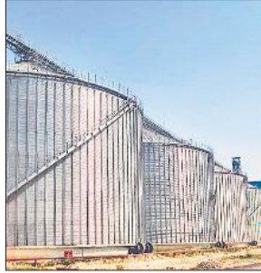
बरखेड़ा के नजदीक बनकर तैयार हुआ अत्याधुनिक साइलो प्लांट।

प्रदेश के कृषि प्रधान जनपदों में शुमार पीलीभीत में गेहूं की खरीद के बाद भंडारण को लेकर जब तब परेशानियां सामने आती रहीं हैं। गत वर्ष भी गेहूं के भंडारण करे लेकर काफी हाथ तोबा हुई थी। हालांकि