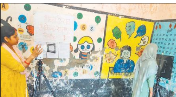
टीबी की जांच करती महिला स्वास्थ्यकर्मी।