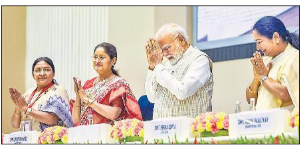
नई दिल्ली में नारी शक्ति वंदन सम्मेलन के दौरान प्रधानमंत्री नरेंद्र मोदी, दिल्ली की मुख्यमंत्री रेखा गुप्ता, केंद्रीय मंत्री अन्नपूर्णा देवी और अन्य।