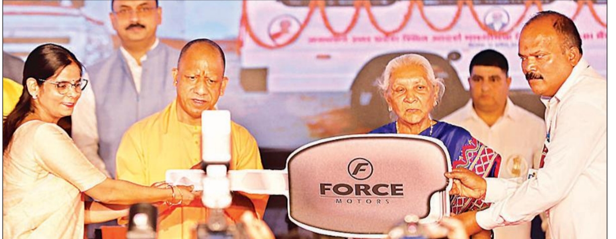
जनभवन के आदर्श माध्यमिक विद्यालय की प्रधानाचार्य को बस की चाबी सौंपतीं राज्यपाल आनंदीबेन पटेल और मुख्यमंत्री योगी आदित्यनाथ।