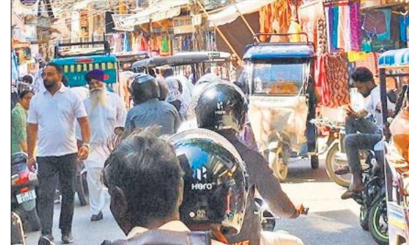
चौराहे पर बेतरतीब तरीके से खड़े ई-रिक्शा।