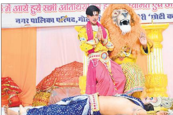
सांस्कृतिक मंच पर नरसिंह भगवान की झांकी प्रस्तुत करते कलाकार।