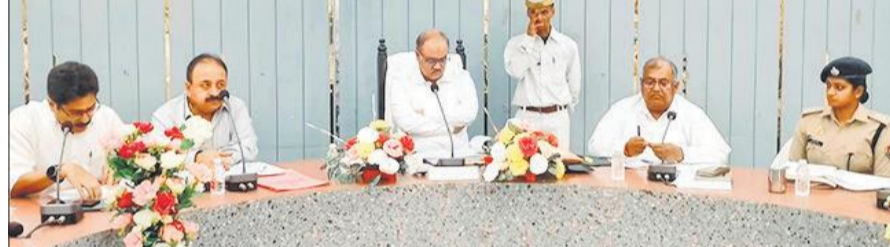
गांधी सभागार में अधिकारियों के साथ समीक्षा बैठक करते राज्य सूचना आयोगत मोहम्मद नदीम।

वाले अधिकारियों को बख्शा नहीं जाएगा। साथ ही लंबित अपीलों और शिकायतों को प्रगति की समीक्षा करते हुए अधिकारियों को समय सीमा के भीतर निस्तारण करने के निर्देश गांधी सभागार में सोमवार को हुई समीक्षा बैठक में राज्य सूचना आयोगत मोहम्मद नदीम द्वारा विभिन्न विभागों द्वारा आरटीआई आवेदनों के निस्तारण और आयोग में लंबित मामलों की प्रगति की गहन समीक्षा की गई। समीक्षा बैठक के दौरान राज्य सूचना आयोगत ने