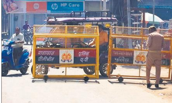
लाल रोड पर ई-रिक्शा के प्रवेश को रोकने के लिए लगाए बैरियर।