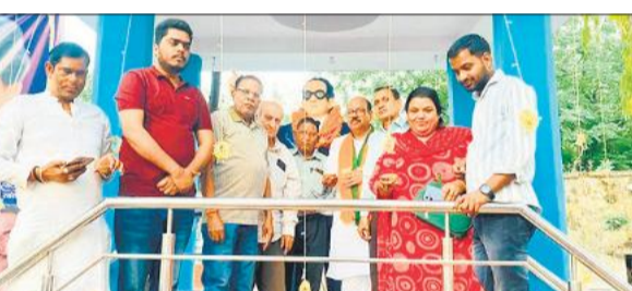
शहर के आंबेडकर पार्क में दीप जलाते भाजपा जिलाध्यक्ष व अन्य पदाधिकारी व कार्यकर्ता।

कार्यक्रम के दौरान भाजपा कार्यकर्ताओं ने पार्क परिसर में स्वच्छता अभियान चलाकर साफ-सफाई की और शाम को दीप प्रज्वलित कर बाबा साहेब को श्रद्धांजलि अर्पित की। वक्ताओं ने डॉ. आंबेडकर के योगदान को याद करते हुए उन्हें महान राष्ट्र निर्माता बताया। उन्होंने कहा कि बाबा साहेब द्वारा रचित संविधान के आधार