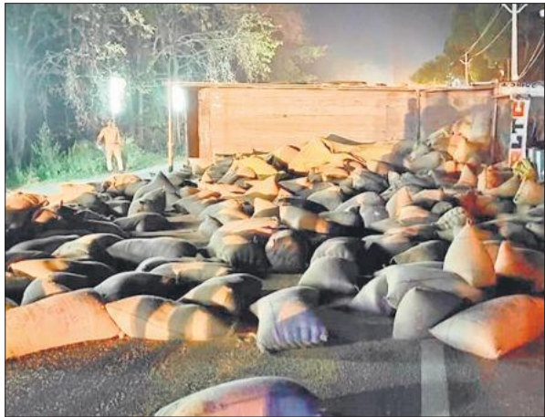
पलटने के बाद बिखरी पड़ी गेहूँ की बोरियां।