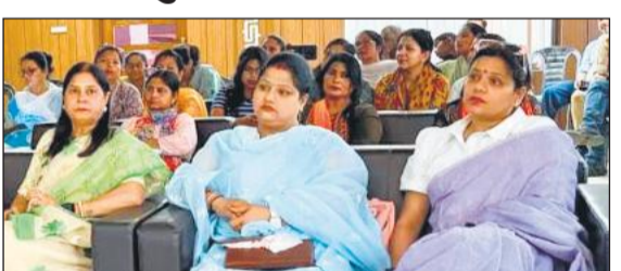
प्रधानमंत्री का लाइव प्रसारण देखा-सुना