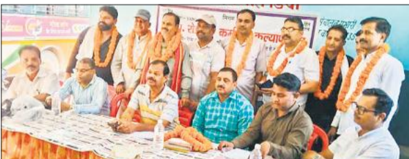
निर्विरोध निर्वाचित किए गए पदाधिकारी।