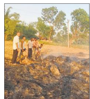
गेहूँ के ढेर में लगी आग बुझाते लोग।