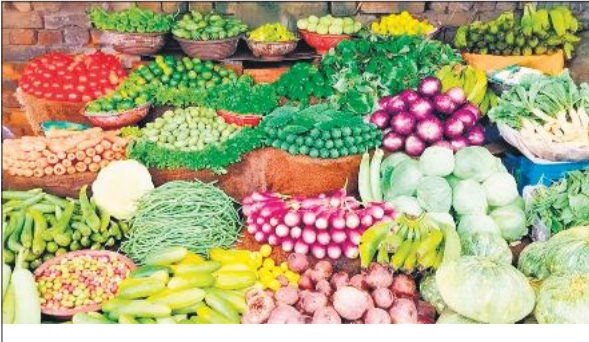
दुकान पर लगी सब्जियां।