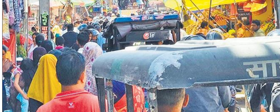
नीबू मंडी में जाम में फंसे राहगीर।