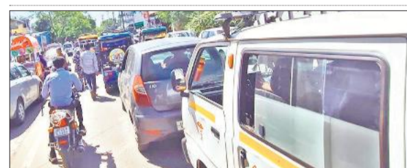
गांधी स्टेडियम रोड पर जाम में फंसे वाहन और एंबुलेंस।