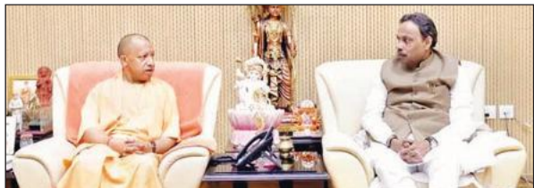
मुख्यमंत्री के साथ मुलाकात करते भाजपा के राष्ट्रीय महामंत्री विनोद तावड़े।

प्रदेश में भाजपा संगठन और सरकार के स्तर पर चल रही हलचल ने राजनीतिक माहौल को गर्म कर दिया है। इससे पहले प्रदेश