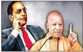
● आज लखनऊ में भीमराव आंबेडकर को सीएम योगी देंगे श्रद्धांजलि प्रदेशभर में होंगे आयोजन

अमृत विचार: प्रदेश में इस वर्ष भीमराव आंबेडकर जयंती को भव्य और व्यापक रूप में मनाने की तैयारी है। योगी सरकार ने इसे केवल एक स्मृति दिवस नहीं बल्कि सामाजिक न्याय, जागरूकता और जनसशक्तीकरण के महाअभियान का रूप दिया है। प्रदेश के सभी जिलों और विधानसभा क्षेत्रों में कार्यक्रम आयोजित कर जनप्रतिनिधि जनता को संविधान, अधिकारों और समानता के मूल्यों से अवगत कराएंगे। राजधानी लखनऊ के हजरतगंज स्थित आंबेडकर महासभा परिसर में मुख्य कार्यक्रम