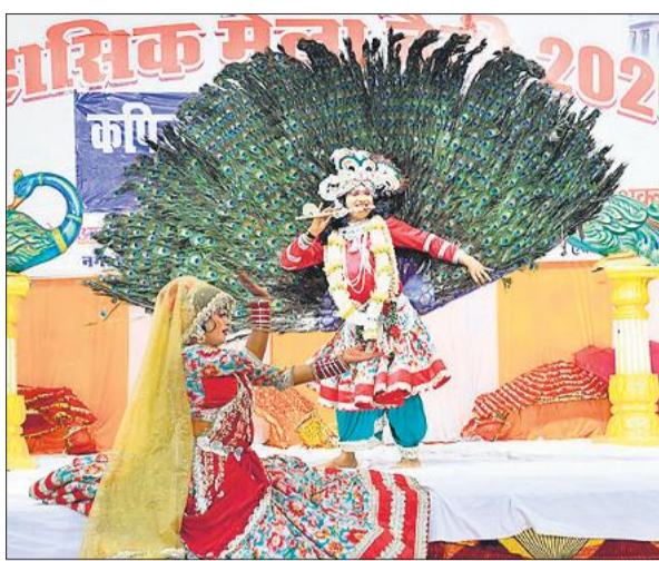
मयूर नृत्य करते उत्तराखंड के कलाकार।

चैती मेला में आज: ऐतिहासिक चैती मेला के सांस्कृतिक मंच पर 14 अप्रैल मंगलवार को जवाबी कव्वाली