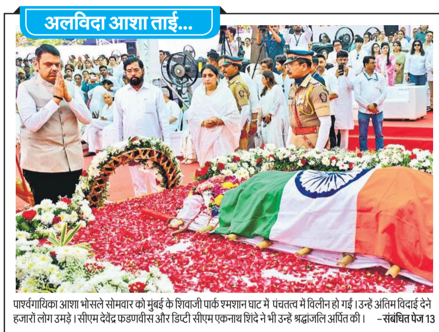
अलविदा आशा थाई... पार्श्वगायिका आशा भोसले सोमवार को मुंबई के शिवाजी पार्क रमशान घाट में पंचतत्व में विलीन हो गईं। उन्हें अंतिम विदाई देने हजारों लोग उमड़े। सीएम देवेंद्र फडणवीस और डिप्टी सीएम एकनाथ शिंदे ने भी उन्हें श्रद्धांजलि अर्पित की। -संबंधित पृष्ठ 13

बैशाख कृष्ण पक्ष द्वादशी 12:12 उपरांत त्रयोदशी विक्रम संवत् 2083