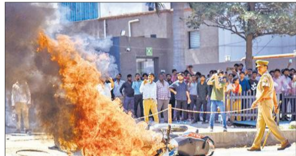
नोएडा में प्रदर्शन के दौरान कर्मचारियों ने पुलिस की गश्ती बाइक को भी फूंक दिया।

अमृत विचार: कम वेतन, ओवरटाइम भुगतान और असुविधाजनक कार्य स्थितियों के विरोध में नोएडा के औद्योगिक क्षेत्र में कर्मचारियों का आंदोलन सोमवार को काबू से बाहर होने के साथ हिंसक हो गया। सेक्टर-62, 63, 82, 84 और फेज-2 के औद्योगिक इलाकों में हजारों कर्मचारी सड़कों पर उतर आए, इसके बाद बड़े पैमाने पर आगजनी, पथराव और तोड़फोड़ की घटनाएं सामने आईं। प्रदर्शनकारियों ने कई और वाहनों के साथ पुलिस की कई गाड़ियों को भी आग के हवाले कर दिया। हालात पर काबू पाने के लिए पुलिस को कई जगह आंसू गैस के गोले दागने के साथ लाठियों भंजनी पड़ी। कपड़ा ट्रेड्स के कर्मचारियों की हड़ताल से शुरू हुआ यह विवाद चौथे दिन नोएडा में कई और फैक्ट्रियों और कंपनियों तक पहुंच गया। सेक्टर 62 से लेकर सेक्टर 82 तक हजारों कर्मचारी सड़क पर उतर