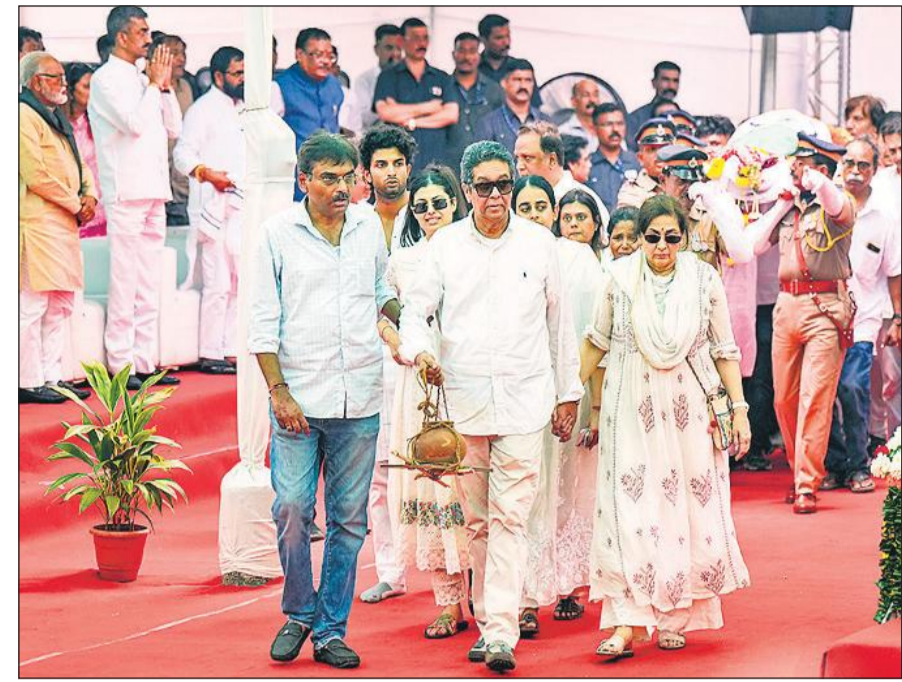
अंतिम संस्कार के लिए आशा भोसले के पार्थिव शरीर को ले जाते परिवार के लोग।