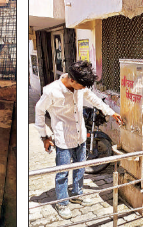
थैलेसीमिया वार्ड के बगल लगे आरओ के आउटपुट से निकलने वाले पानी का प्रयोग करता सख्स।