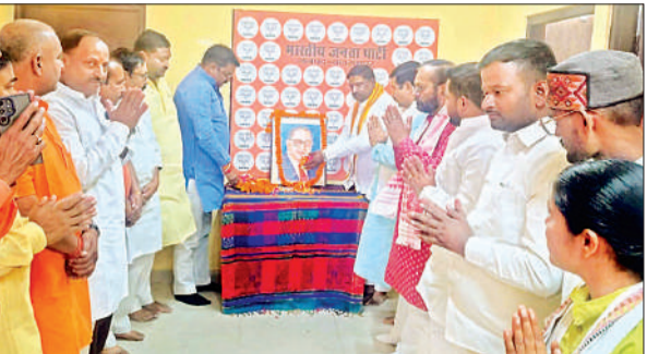
जयंती पर डॉ. भीमराव अंबेडकर के चित्र पर पुष्प अर्पित करते भाजपा के पदाधिकारी।