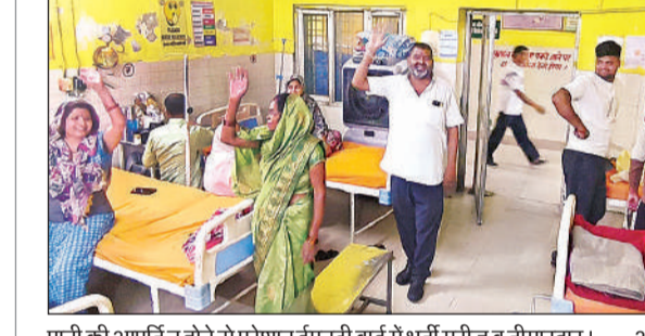
पानी की आपूर्ति न होने से परेशान ईपनटी वार्ड में भर्ती मरीज व तीमारदार।