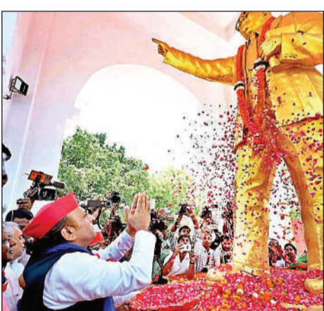
लखनऊ में बाबा साहेब को नमन करते अखिलेश यादव।