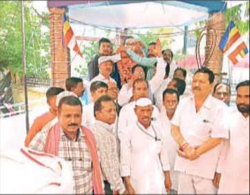
डॉ. अंबेडकर की प्रतिमा पर माल्यार्पण करते कांग्रेसी।