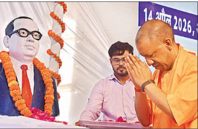
प्रतिमा पर माल्यार्पण करने के बाद डॉ. अंबेडकर को नमन करते योगी।

अमृत विचार: मुख्यमंत्री योगी आदित्यनाथ ने बाबा साहेब डॉ. भीमराव अंबेडकर की 135वीं जयंती पर समाजवादी पार्टी और कांग्रेस पर कड़ा प्रहार किया। उन्होंने कहा कि समाजवादी पार्टी ने स्टेट गेस्ट हाउस में महिलाओं के साथ बर्बर व्यवहार कर अपना वास्तविक चरित्र दिखाया था। कांग्रेस ने बाबा साहेब को चुनाव से वंचित रखने का प्रयास किया। उन्हें भारत रत्न न मिले, इसके लिए षडयंत्र रचे। कांग्रेस आज भले ही संविधान की प्रति लेकर घूम रही है, लेकिन उसकी असलियत को समझने की आवश्यकता को डॉ. अंबेडकर महासभा कार्यालय परिसर में आयोजित कार्यक्रम में स्मारिका का विमोचन किया और 75 जिलों में स्थापित बाबा साहेब