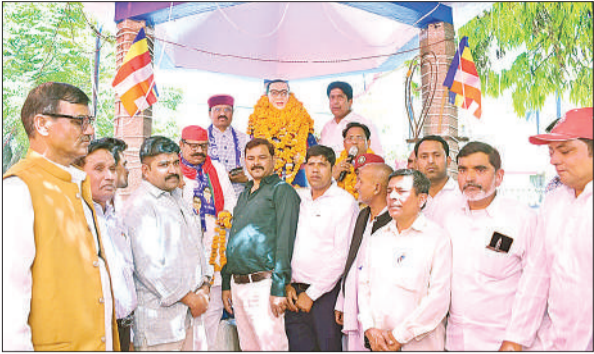
जयंती पर डॉ. भीमराव अंबेडकर की प्रतिमा पर माल्यार्पण करते सपा कार्यकर्ता।