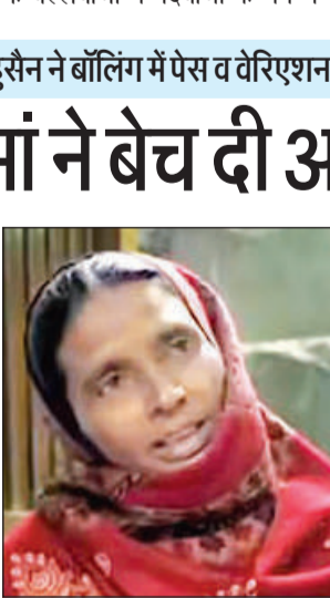
साकिब की मां।

बेंगलुरु की टीम शीर्ष पर काबिज राजस्थान रॉयल्स से दो अंक और पंजाब किंग्स से एक अंक हिंगे नई बॉल और यॉर्कर के साथ असरदार होंगे, जबकि साकिब अपनी वॉरिएशन से बीच के ओवरों को कंट्रोल कर सकते हैं। यह कॉम्बिनेशन उनके बॉलिंग अंटेक को कहीं ज्यादा कम्प्लीट बनाता है।