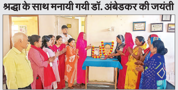
जयंती पर डॉ. भीमराव अंबेडकर के चित्र पर माल्यार्पण अर्पित करते लोग।