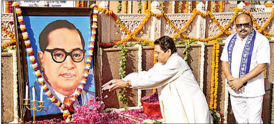
पार्टी कार्यालय पर डॉ. भीमराव अंबेडकर के चित्र पर माल्यार्पण करती बसपा सुप्रीमो मायावती, साथ में अन्य।

अखिलेश यादव ने नोएडा में हाल में हुए श्रमिक आंदोलन और हिंसा को लेकर भी प्रदेश सरकार को जिम्मेदार ठहराया। उन्होंने कहा कि प्रशासनिक विफलता के कारण हालात बिगड़े और सरकार अब इसे साजिश बताकर अपनी जिम्मेदारी से बचने की कोशिश कर रही है।