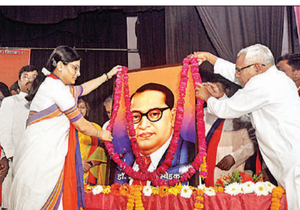
डॉ. अंबेडकर के चित्र पर माल्यार्पण करती केंद्रीय मंत्री अनुप्रिया पटेल व अन्य।

सुनिश्चित की जाएगी। मंत्री ने कहा कि प्रधानमंत्री नरेंद्र मोदी के नेतृत्व में महिला सशक्तिकरण को नई दिशा मिली है और यह अभियान उसी कड़ी को आगे बढ़ाने का प्रयास है।