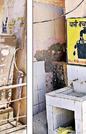
ब्लड बैंक के बगल लगे बंद वाटर कूलर के पास अपनी घ्यास बुझाने पहुंचा युवक।

कोई घर से ला रहा पानी तो कोई खरीद रहा, चरमराने लगी सफाई व्यवस्था