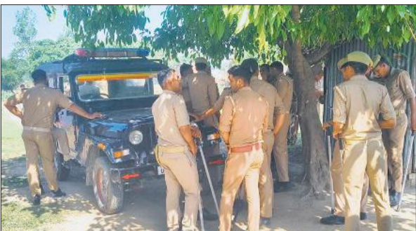
कबूलपुर गांव में शांति व्यवस्था बनाए रखने को तेनात पुलिस बल।

आंबेडकर की प्रतिमा संबंधित चबूतरे पर स्थापित कर दी गई। ये प्रतिमा एक मकान में बनवाकर कई दिन पूर्व ही रखी हुई थी। मंगलवार को आंबेडकर जयंती के अवसर पर यहां पर कार्यक्रम आयोजित किया जाना था। इससे एक दिन पूर्व तेरह अप्रैल को बिना अनुमति प्रतिमा स्थापित किए जाने की सूचना पुलिस तक पहुंची। जिसके बाद पुलिस प्रशासनिक अमले में तनाव के हालात बन गए। इसे लेकर