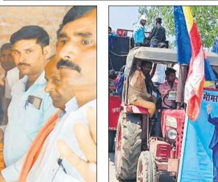
मुड़ा सवारान क्षेत्र के गांवों में रैली निकालते लोग।

आयोजित किए गए, जहां लोगों ने उनकी प्रतिमा पर माल्यार्पण कर उन्हें नमन किया। वक्ताओं ने डॉ. आंबेडकर के जीवन और उनके संघर्षों पर प्रकाश डाला। विद्यालयों, सामाजिक संगठनों और सरकारी संस्थानों में भी जयंती पर छात्रों ने भाषण, कविता और सांस्कृतिक प्रस्तुतियों के माध्यम से उनके विचारों को प्रस्तुत किया। लोगों ने उनके बताए मार्ग पर चलने का संकल्प