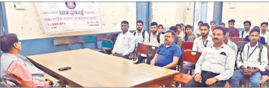
उपाधि कॉलेज में हुई संगोष्ठी में मौजूद प्राचार्य, प्रोफेसर व विद्यार्थी।

समाजवादी पार्टी ने भी बाबा साहेब की जयंती मनाई। जिला कार्यालय के साथ ही पूरनपुर विधानसभा क्षेत्र के गजरौला में कार्यक्रम हुआ। यूथ ब्रिगेड के