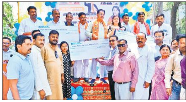
कर्मचारियों को प्रतीकात्मक चेक सौंपते अतिथि, चैयरमैन व अन्य।