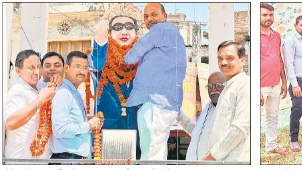
डॉ. आंबेडकर की प्रतिमा पर माल्यार्पण करते पालिकाध्यक्ष।