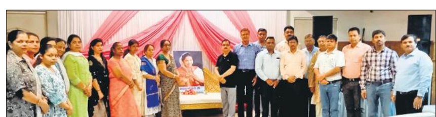
आशा भोसले को श्रद्धांजलि अर्पित करते लता मंगेशकर फैस क्लब के सदस्य।