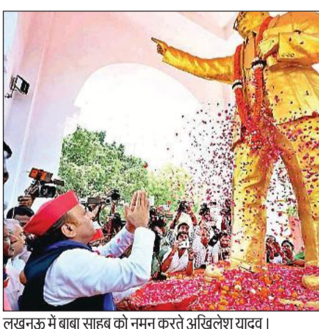
लखनऊ में बाबा साहेब को नमन करते अखिलेश यादव।