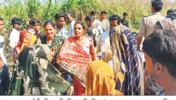
घटना स्थल पर राती-बिलखती परिवार की महिलाएं।