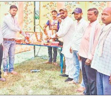
कुकरा में बाबा साहब के चित्र पर माल्यार्पण करते लोग।