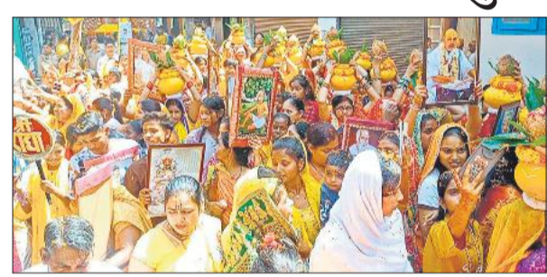
कलश यात्रा में शामिल श्रद्धालु।