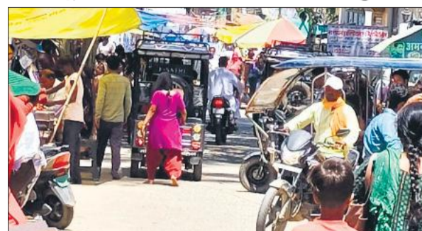
साप्ताहिक बाजार के नजदीक की सड़क पर बेतरतीब खड़े वाहन। ● अमृत विचार

अमृत विचार: शहर की बेपटरी यातायात व्यवस्था की बदहाल तस्वीर बाजार की साप्ताहिक बंदी के दिन भी बरकरार है। जामा मस्जिद घेर की जगह में लगने वाले साप्ताहिक बाजार की दुकानें शिकायतों के बाद जिम्मेदारों की दौड़-भाग और कार्रवाई के बाद भी सड़क पर ही सजाई जा रही हैं। जिसका असर आसपास चारों तरफ एक किमी के दायरे में मुख्य मार्गों पर पड़ रहा है। नगर पालिका-प्रशासन के जिम्मेदारों की ओर से कोई सुध नहीं ली जा रही है। वहीं, यातायात पुलिस की ओर से कर्मचारियों की तैनाती कर भी दी जाती है तो वह सिर्फ वाहनों की आवाजाही रोकने तक सीमित रहती है। नतीजतन दोपहर बाद खरीदारों की भीड़ बढ़ते ही हालात बदतर होना तय है। इसका स्थायी समाधान लंबे समय बाद भी नहीं निकल सका है। शहर एक बड़ी समस्या अतिक्रमण और बिना पार्किंग के प्रतिष्ठानों की वजह से मुख्य मार्गों पर लगने वाला जाम है। जिसमें स्कूली बच्चों के वाहन हो या फिर मरीजों को अस्पताल ले जा रही एंबुलेंस फंसी रह जाती है। अभियान और कार्रवाई के नाम पर सिर्फ दावे ही किए जा सके हैं। मंगलवार को शहर के बाजार