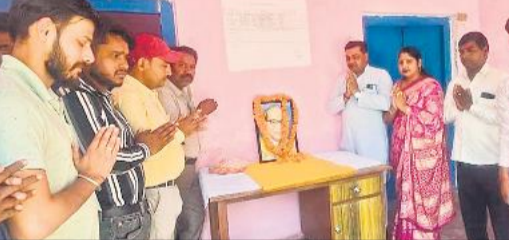
बाबा साहेब को नमन करते चैयरमैन बरखेड़ा व अन्य।