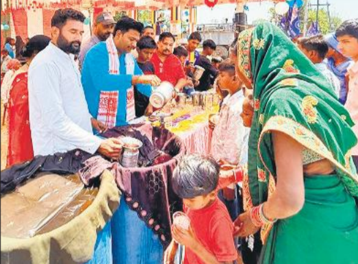
संपूर्णनगर में शर्वत का वितरण करते लोग।