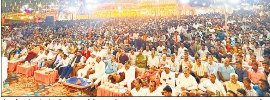
भोजपुरी कार्यक्रम देखने के लिए मौजूद अतिथि और दर्शक।