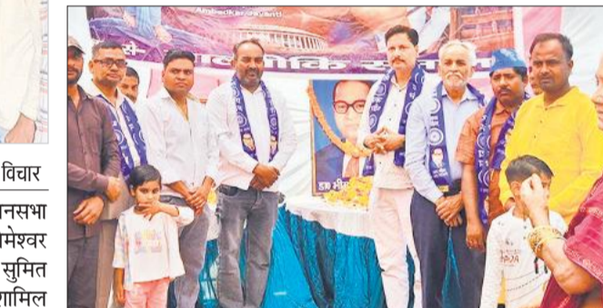
मोहल्ला डाकिन में बाबा साहब के चित्र पर माल्यार्पण के दौरान मौजूद लोग।

● अमृत विचार पलिया कलां। संविधान निर्माता डॉ. भीमराव आंबेडकर की 135वीं जयंती मंगलवार को पलिया नगर सहित आसपास के क्षेत्रों में श्रद्धा और उत्साह के साथ मनाई गई। इस अवसर पर विभिन्न स्थानों पर आयोजित कार्यक्रमों में नागरिकों व वक्ताओं ने बाबा साहब के चित्रों पर माल्यार्पण कर उन्हें नमन किया और उनके विचारों को साझा किया। श्री रामलाला मेला मैदान में डॉ. भीमराव आंबेडकर स्मारक समिति के तत्वावधान में आयोजित कार्यक्रम में मुख्य अतिथि हाईकोर्ट के सेवानिवृत्त वरिष्ठ न्यायमूर्ति एआर मसूदी ने बाबा साहब के संघर्षपूर्ण जीवन, उनके आदर्शों और सामाजिक न्याय के लिए किए गए योगदान पर विस्तार से बताया। समिति के अध्यक्ष एवं अधिवक्ता रामचन्द्र गौतम, धर्मराज शाक्य सहित कई वक्ताओं ने अपने विचार व्यक्त किए। उधर, नगर के मोहल्ला डाकिन