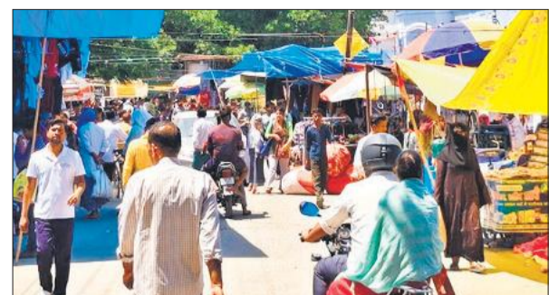
जामा मस्जिद के बाहर सड़क पर सजी साप्ताहिक बाजार की दुकानें। ● अमृत विचार