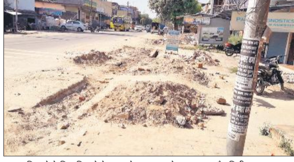
सड़क किनारे केबिल बिछाने के बाद छोड़ा गया नाले का मलबा और मिट्टी।

हालात यह है कि सड़क के एक ओर काम अधूरा छोड़कर दूसरी तरफ खुदाई शुरू कर दी गई है, जिससे आवागमन बुरी तरह प्रभावित हो रहा है। सड़क किनारे रहने वाले लोगों के साथ-साथ दुकानदारों को