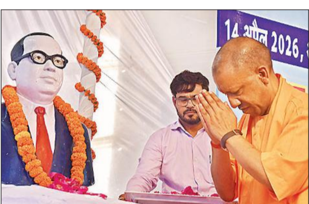
प्रतिमा पर माल्यार्पण करने के बाद डॉ. आंबेडकर को नमन करते योगी।

अमृत विचार: मुख्यमंत्री योगी आदित्यनाथ ने बाबा साहेब डॉ. भीमराव आंबेडकर की 135वीं जयंती पर समाजवादी पार्टी और कांग्रेस पर कड़ा प्रहार किया। उन्होंने कहा कि समाजवादी पार्टी ने स्टेट गेस्ट हाउस में महिलाओं के साथ बर्बर व्यवहार कर अपना वास्तविक चरित्र दिखाया था। कांग्रेस ने बाबा साहेब को चुनाव से वंचित रखने का प्रयास किया। उन्हें भारत रत्न न मिले, इसके लिए षडयंत्र रचे। कांग्रेस आज भले ही संविधान की प्रति लेकर घूम रही है, लेकिन उसकी असलियत को समझने की आवश्यकता को डॉ. आंबेडकर महासभा कार्यालय परिसर में आयोजित कार्यक्रम में स्मारिका का विमोचन किया और 75 जिलों में स्थापित बाबा साहेब की 75 मूर्तियों के सौंदर्यीकरण व संरक्षण कार्य का वरुंचल शुभारंभ किया। इसके पहले हजरतगंज चौक स्थित डॉ. आंबेडकर की प्रतिमा पर माल्यार्पण कर उन्हें नमन किया। मुख्यमंत्री ने लोगों को संबोधित करते हुए कहा कि दलितों के लिए घड़ियाली आंसू बहाने वाले गिनाएं कि बाबा साहेब के नाम पर