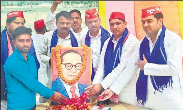
गजरौला में हुए कार्यक्रम में बाबा साहेब को नमन करते सपा नेता।