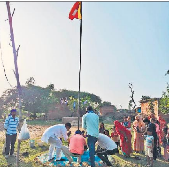
कबूलपुर गांव में संबंधित जगह पर कार्यक्रम में मौजूद लोग।