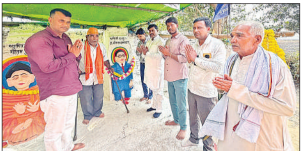
बाबा साहेब को श्रद्धांजलि अर्पित करते लोग।