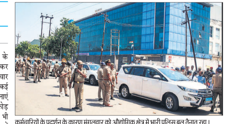
कर्मचारियों के प्रदर्शन के कारण मंगलवार को औद्योगिक क्षेत्र में भारी पुलिस बल तैनात रहा।

अमृत विचार: गौतमबुद्ध नगर के औद्योगिक क्षेत्र में वेतन वृद्धि को लेकर भड़का कर्मचारियों का आंदोलन मंगलवार को दूसरे दिन भी शांत नहीं हो सका। कई इलाकों में पथराव और तोड़फोड़ की घटनाएं हुईं। कुछ वाहनों और फैक्ट्रियों में तोड़फोड़ की गई और कर्मचारियों की पुलिस से भी झड़पें हुईं। हालांकि पुलिस ने इन्हें काबू में कर लिया। पुलिस ने दोपहर तक 300 से अधिक आरोपितों को गिरफ्तार कर लिया, 100 से ज्यादा लोगों को हिरासत में लेकर पूछताछ की जा रही है। पुलिस कमिश्नर लक्ष्मी सिंह ने कहा कि गंभीर मामलों में आरोपितों पर राष्ट्रीय सुरक्षा कानून (एनएसए) के तहत कार्रवाई की जाएगी। सोमवार की हिंसा के बाद मंगलवार सुबह 5 बजे से ही नोएडा-ग्रेटर नोएडा के औद्योगिक इलाकों में पुलिस और अर्द्धसैनिक बलों ने पत्तंगे मार्च शुरू कर दिया। पीएसो और आरएफए की 15 कंपनियों, 8 एडिशनल एसपी और 18 डीएसपी स्तर के अधिकारी तैनात किए गए हैं। झोन और