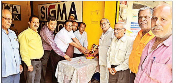
बाबा साहब के चित्र पर पुष्प अर्पित करते भाजपा कार्यकर्ता।