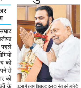
पटना में राजभा विधायक दल का नेता चुने जाने के बाद सम्राट चौधरी को बहाई देने नीतीश कुमार।

सकते हैं। नीतीश कुमार मंगलवार को सम्राट चौधरी और मंत्री विजय चौधरी के साथ इस्तीफा देने के लिए लोक भवन पहुंचे। इससे पहले मुख्यमंत्री रहे नीतीश ने मंत्रिमंडल सहयोगियों को मंत्रिपरिषद भंग करने के अपने निर्णय की जानकारी दी, जो राज्यपाल को इस्तीफा सौंपने से पहले की एक संवैधानिक प्रक्रिया है। बिहार की 243 सदस्यीय विधानसभा में 89 विधायकों के साथ भाजपा सबसे बड़ी पार्टी है।