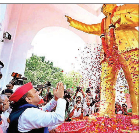
हजरतगंज में बाबा साहेब की नमन करते अखिलेश यादव।