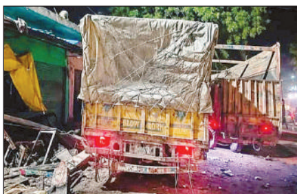
दुकानों में घुसा ट्रक।