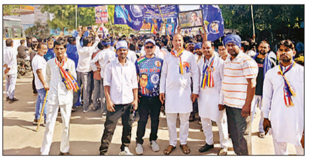
शोभायात्रा में शामिल ग्रामीण।