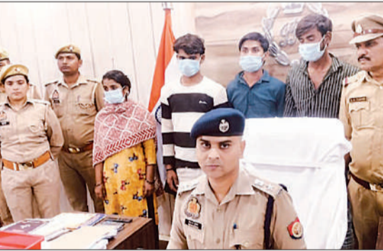
दोहरे हत्याकांड के गिरफ्तार आरोपियों के साथ एसपी और पुलिस टीम।