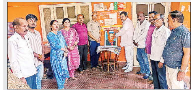
बूथ संख्या 341 पर बाबा साहेब के चित्र पर माल्यार्पण करते भाजपा के पदाधिकारी।

बूथ संख्या 341 पर मनायी गयी बाबा साहेब की जयंती