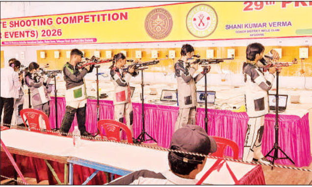
प्री-स्टेट शूटिंग प्रतियोगिता में लक्ष्य पर निशाना लगाते खिलाड़ी।