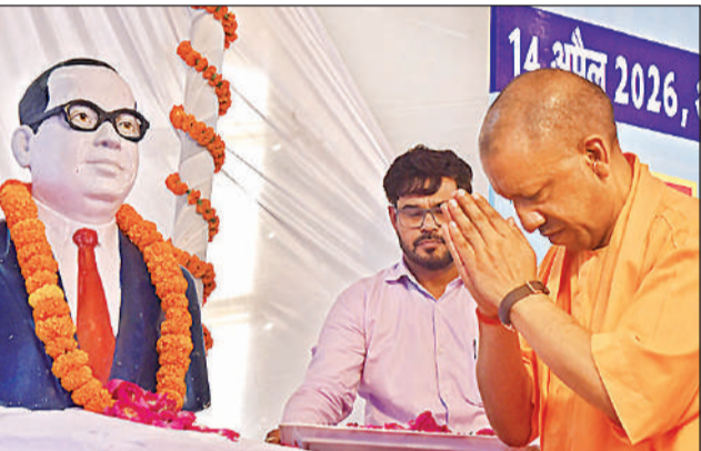
प्रतिमा पर माल्यार्पण करने के बाद डॉ. आंबेडकर को नमन करते योगी।

की 75 मूर्तियों के सौंदर्यीकरण व संरक्षण कार्य का वरुंचल शुभारंभ किया। इसके पहले हजरतगंज चौक स्थित डॉ. आंबेडकर की प्रतिमा पर माल्यार्पण कर उन्हें नमन किया। मुख्यमंत्री ने लोगों को संबोधित करते हुए कहा कि दलितों के लिए घड़ियाली आंसू बहाने वाले गिनाएं कि बाबा साहेब के नाम पर