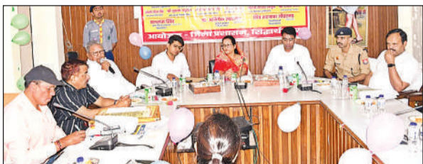
आंबेडकर जयंती पर आयोजित कार्यक्रम में मौजूद अतिथि।