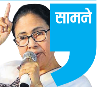
सामने -अमित शाह गृहमंत्री -ममता बनर्जी मुख्यमंत्री, पश्चिम बंगाल

19 राज्य और केंद्र सरकार भेरे खिलाफ एकजुट होकर लड़ रहे हैं। मैं अकेले आम लोगों के अधिकारों की लड़ाई पर नहीं हूँ। दिल्ली की ताकतों के सहारे भाजपा कभी बंगाल नहीं जीत पाएगी। मतदाता सतर्क रहें और लोकतांत्रिक अधिकारों का साथ प्रयोग करें।