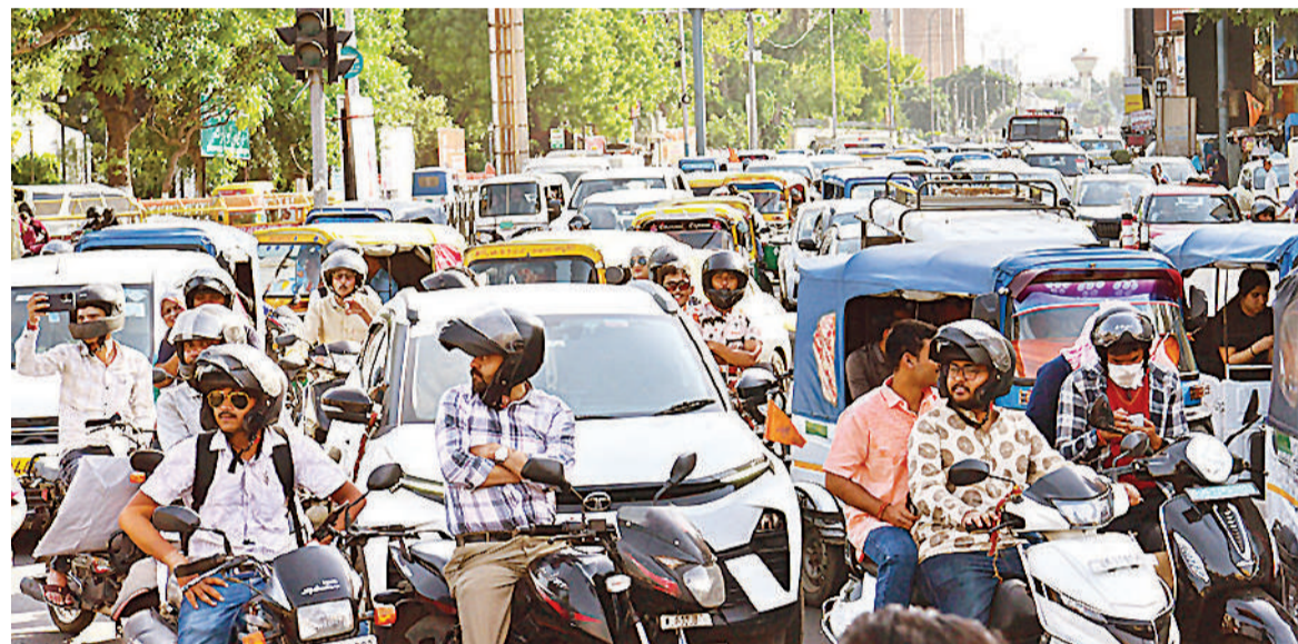
हजरतगंज में ट्रैफिक जाम के चलते रुक-रुक कर चलने को मजबूर राहगीर।