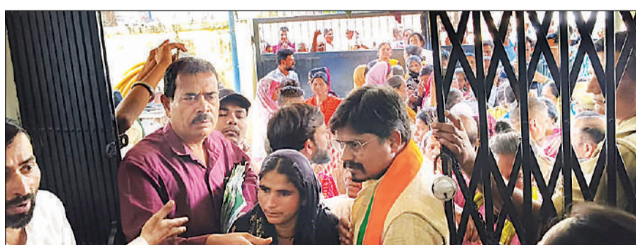
चिनहट स्थित लौलाई विद्युत उपकेंद्र पर प्रदर्शन करते स्मार्ट प्रीपेड मीटरमें अधिक बिल आने से परेशान उपभोक्त।

कांशीराम आवास योजना में रहने वाले लोगों का कहना था कि एक पंखा और एक लाइट के उपयोग पर ही 1500 से लेकर 7000 रुपये तक का बिल आ रहा है। ये उनकी आय के हिसाब से बेहद ज्यादा है। मौके पर स्थिति को संभालने और उपभोक्ताओं को अनुसार करीब 2900 मकानों ने स्मार्ट प्रीपेड मीटर को हटाकर पुराने पोस्टपेड मीटर फिर से बहाल किए जाने की मांग की, जिससे उन्हें