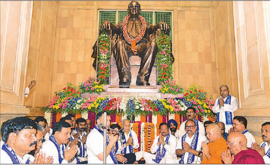
डॉ. भीमराव आंबेडकर सामाजिक परिवर्तन स्थल में बाबा साहेब की प्रतिमा पर माल्यार्पण करने के बाद नमन करते बसपाई व अन्य और दीपक जलाती महिलाएं।