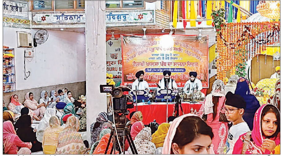
शब्द कीर्तन गायन करते सिख समुदाय के लोग।