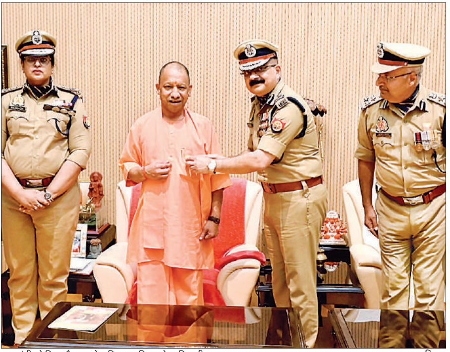
मुख्यमंत्री को पिन फ्लैग लगाते अग्निशमन विभाग के अधिकारी।

पीड़िता के अनुसार घर में लगे सीसीटीवी कैमरे तोड़ दिए गए और