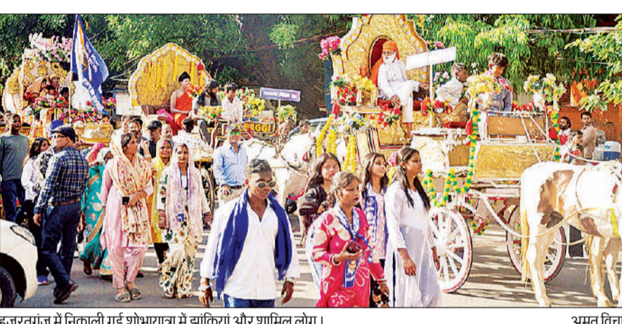
हजरतगंज में निकाली गई शोभायात्रा में झांझियां और शामिल लोग।