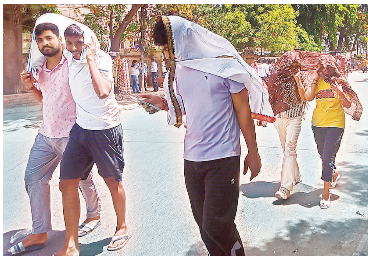
पार्क रोड पर तेज गमछे से खुद को तेज धूप से बचाने का प्रयास करते राहगीर।