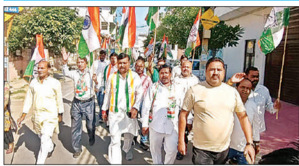
तिरंगा यात्रा निकालते कांग्रेस पदाधिकारी।