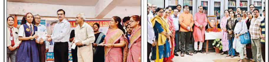
छात्रों को सम्मानित करते हुए मुख्य अतिथि व मौजूद शिक्षक।