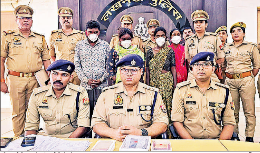
पुलिस की गिरफ्त में टप्पेबाजी गिरोह के सदस्य।