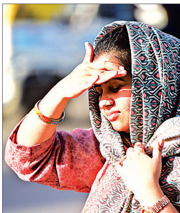
चेहरे को तेज धूप से बचाने का प्रयास करती युवती।

भी 1.2 डिग्री की बढ़ोत्तरी हुई है। अवकाश का दिन होने के कारण हालांकि सड़कों पर अन्य दिनों की अपेक्षा भीड़ कम रही, लेकिन बाहर निकले ज्यादातर लोग धूप से बचने का प्रयास करते दिखे। कोई छाता लेकर निकला तो किसी ने पेड़ की छांव का सहारा लिया। मौसम विभाग के अनुसार शुष्क मौसम और गर्म पछुआ हवा के प्रभाव से अधिकतम तापमान में 2-3 डिग्री सेल्सियस की बढ़ोत्तरी हुई है। कर्नाटक एवं महाराष्ट्र पर बने प्रतिचक्रवात के मध्य भारत की ओर खिसकने से तापमान में 3-4 डिग्री सेल्सियस तक क्रमिक बढ़ोत्तरी से लखनऊ और आस-पास अधिकतम तापमान 1-2 दिन में 40 डिग्री से पार करने की संभावना है।