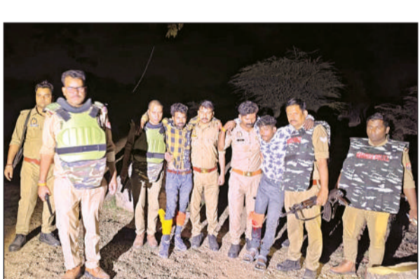
मुठभेड़ में घायल दोनों अभियुक्तों को जिला अस्पताल ले जाती पुलिस।