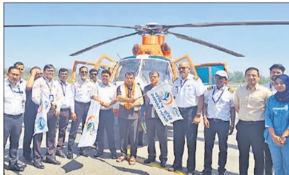
हेलीकॉप्टर को रवाना करते विधायक, डीएम और एयरपोर्ट अधिकारी।