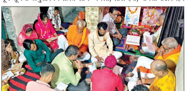
सुंदरकांड पाठ करते लोग।