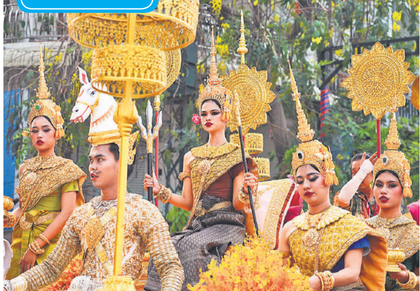
केंबोडिया के नोम-पेन्ह शहर में शाही महल के सामने एक मुख्य सड़क पर खमेर नव वर्ष के उपलक्ष्य में आयोजित संक्रांता परेड में प्रदर्शन करने के लिए अपनी बारी की प्रतीक्षा करते केंबोडियाई नर्तक।