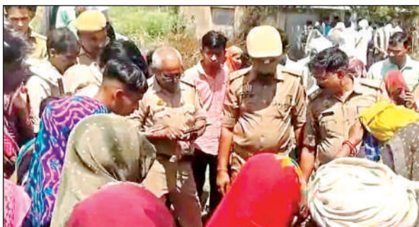
घटनास्थल पर मौजूद पुलिस और गांव के लोग।