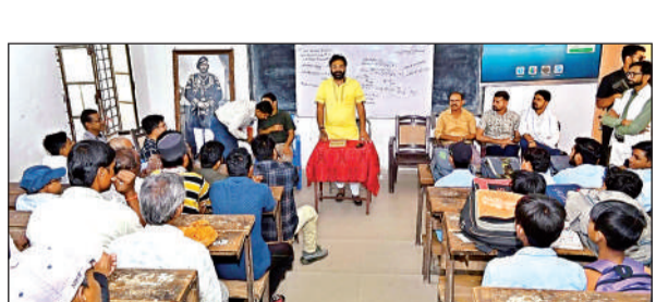
अभिभावकों व बच्चों से चर्चा करते चरखारी विधायक।