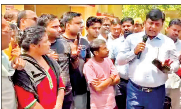
प्रदर्शनकारी उपभोक्ताओं को समझाते-बुझाते अधिकारी।

● बिजली विभाग के कार्यालय के बाहर नारेबाजी के साथ प्रदर्शन