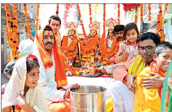
रामदरबार की शोभायात्रा निकालते श्रद्धालु। अमृत विचार

अमृत विचार। श्री महादेव मंदिर में रामदरबार की प्राण प्रतिष्ठा की बुधवार को शोभायात्रा के साथ शुरुआत हुई। कार्यक्रम में क्षेत्रीय विधायक, एसडीएम समेत बड़ी संख्या में श्रद्धालुओं ने भाग लिया। 16 अप्रैल को हवन-पूजन और भंडारे के साथ कार्यक्रम का समापन होगा।