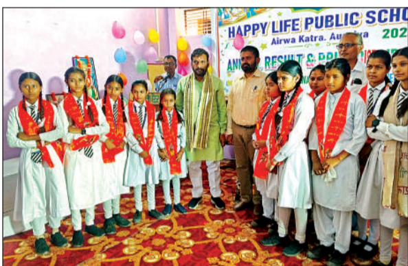
परीक्षा में स्थान प्राप्त करने वाले विद्यार्थी।