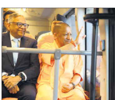
टाटा मोटर्स के लखनऊ प्लांट में 10 लाखवीं गाड़ी को फ्लैग ऑफ करने के बाद बस में बैठे मुख्यमंत्री योगी।

अमृत विचार: नोएडा में हुए बवाल के बीच मुख्यमंत्री योगी आदित्यनाथ ने कड़ा संदेश देते हुए साफ कहा कि किसी भी स्थिति में बाहरी तत्वों को औद्योगिक इकाइयों या संस्थानों के आंतरिक मामलों में हस्तक्षेप बर्दाश्त नहीं होगा। उन्होंने स्पष्ट किया कि संगठन की मजबूती के लिए टीमवर्क, ईमानदारी और कृतज्ञता सबसे अहम हैं। टाटा मोटर्स के लखनऊ प्लांट से बुधवार को 10 लाखवीं गाड़ी को फ्लैग ऑफ करने के दौरान मुख्यमंत्री योगी ने अप्रत्यक्ष रूप से नोएडा की