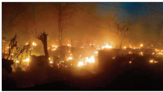
विकास नगर सेक्टर 12 में स्थित झोपड़ पट्टी में लगी भीषण आग।

मौके पर पहुंची दमकल विभाग की 18 गाड़ियां देर शाम तक आग बुझाने में जुटी हुई थीं। इसके साथ राहत और बचाव कार्य भी जारी है। मुख्यमंत्री योगी आदित्यनाथ ने अधिकारियों को तत्काल मौके पर पहुंचकर राहत कार्य में तेजी लाने के लिए निर्देश दिए हैं। डिप्टी सीएम ब्रजेश पाटक ने घटनास्थल पर पहुंचकर जायजा लिया और