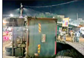
डाकबंगले के पास पलटा पड़ा डंपर।

अमृत विचार। पीडब्ल्यूडी डाकबंगले के समीप कानपुर-सागर नेशनल हाईवे पर डंपर चालक ने अचानक सामने आए शराबी को तो बचा लिया, लेकिन डंपर अनियंत्रित होकर सड़क पर पलट गया, जिससे डंपर बुरी तरह क्षतिग्रस्त हो गया। गनीमत रही कि रात होने के कारण भीड़भाड़ वाले इलाके में आवाजाही कम थी। डंपर पलटने से चालक व क्लीनर और शराबी को चोटें आ गईं। पुलिस ने घायलों को जिला अस्पताल में भर्ती कराया। बीच सड़क पर डंपर पलटने से यातायात कुछ घंटों के लिए प्रभावित रहा। कानपुर नगर के महाराजपुर थाना