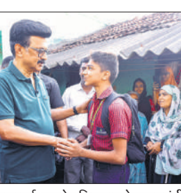
जनसम्पर्क करते तमिलनाडु के मुख्यमंत्री स्टालिन।

कोलकाता, एजेंसी केंद्रीय गृह मंत्री अमित शाह ने बुधवार को संकल्प जताया कि भाजपा, तृणमूल कांग्रेस द्वारा भ्रष्टाचार के माध्यम से बंगाल की जनता से लूटी गई एक-एक पाई वसूल करेगी। उन्होंने यह भी कहा कि प्रधानमंत्री नरेंद्र मोदी पर दो दशकों तक सत्ता में रहने के बाद भी भ्रष्टाचार का कोई दाग नहीं है। उत्तरी बंगाल के जलपाईगुड़ी जिले के राजगंज में एक चुनावी रैली को संबोधित करते हुए उन्होंने कहा कि मुख्यमंत्री ममता बनर्जी का सत्ता से जाना निश्चित है, लेकिन इस प्रक्रिया को शुरू करने का काम राज्य के उत्तरी क्षेत्रों से शुरू होगा। शाह ने कहा कि मोदी ने गुजरात पर 12 साल शासन किया और केंद्र में भी पिछले 12 साल से नेतृत्व कर रहे हैं, फिर भी उनके खिलाफ एक प्रक्रिया को शुरू करने का आरोप लगाते हुए कहा कि भाजपा राज्य चुनावों में जीत हासिल करने के लिए पूरी सरकार को यहां ले आये है।