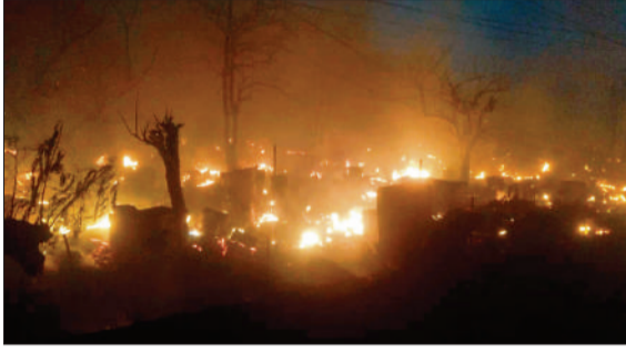
विकास नगर सेक्टर 12 में स्थित झोपड़ पट्टी में लगी भीषण आग।

अमृत विचार: विकासनगर के सेक्टर-14 स्थित झोपड़पट्टी में भीषण आग लग गई। लपटों ने करीब 200 झोपड़ियों को चपेट में ले लिया। आग की लपिश से झोपड़ियों में रखे सिलेंडर और रेफ्रिजरेटर के कंप्रेसर में ताबड़तोड़ धमाकों के साथ फटते तो इलाके में अफरातफरी मच गई। कई किलोमीटर दूर तक धुंए का गुबार और कंची लपटें दिखाई दीं। मौके पर पहुंचे दमकल विभाग की 18 गाड़ियां देर शाम तक आग बुझाने में जुटी हुई थीं। इसके साथ राहत और बचाव कार्य भी जारी है। मुख्यमंत्री योगी आदित्यनाथ ने अधिकारियों को तत्काल मौके पर पहुंचकर राहत कार्य में तेजी लाने के लिए निर्देश दिए हैं। डिप्टी सीएम ब्रजेश पाठक ने घटनास्थल पर पहुंचकर जायजा लिया और