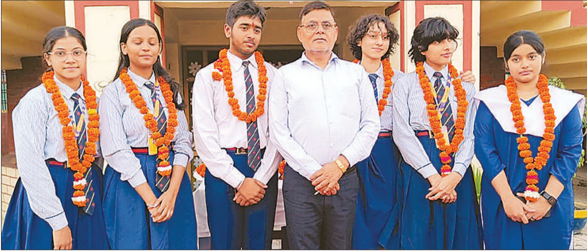
बेहतर परीक्षा परिणाम आने के बाद खुशी जताते विद्यार्थी और प्रधानाचार्य।