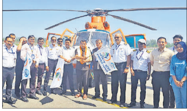
हेलीकॉप्टर को रवाना करते विधायक, डीएम और एयरपोर्ट अधिकारी।