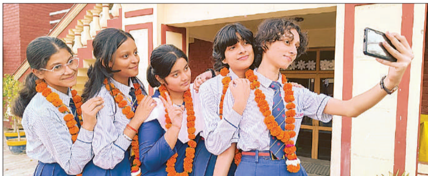
बेहतर परीक्षा परिणाम के बाद सेल्फी लेती छात्राएं।