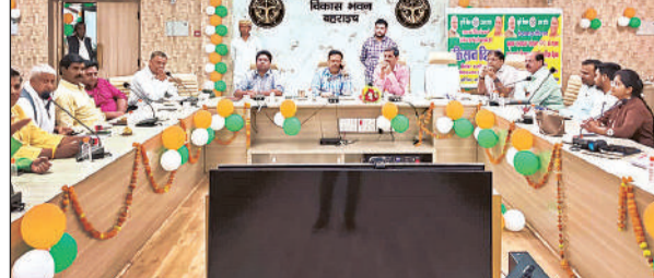
विकास भवन सभागार में बैठक करते अधिकारी।