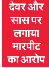
देवर और सास पर लगाया मारपीट का आरोप

बंद रहने के दौरान यातायात व्यवस्था को सुचारू बनाए रखने के लिए पुलिस प्रशासन को विशेष जिम्मेदारी सौंपी गयी है। बहराइच व बाराबंकी दोनों जिलों की पुलिस अपनी अपनी तरफ मुस्तैद रहेगी।