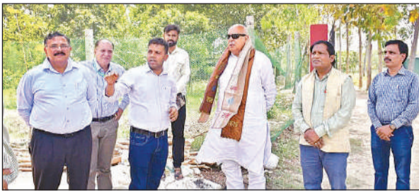
गोविंदनगर फार्म का निरीक्षण करते कृषि मंत्री सूर्य प्रताप शाही।

मंत्री सूर्य प्रताप शाही ने सबसे पहले परिसर स्थित टेक्नोलॉजी पार्क