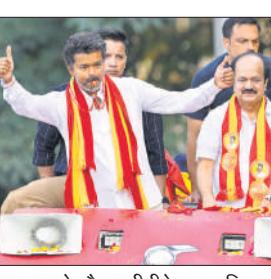
चुनाव प्रचार के दौरान टीवीके प्रमुख विजय।