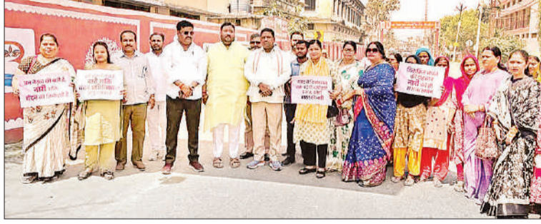
एमएलके पीजी कॉलेज में नारी शक्ति वंदन अभियान में शामिल लोग।

बलरामपुर अमृत विचार : नारी शक्ति वंदन अधिनियम के समर्थन में मंगलवार को एम.एल.के. कॉलेज के उत्तरी गेट पर महिलाओं द्वारा हस्ताक्षर अभियान एवं मानव श्रृंखला कार्यक्रम का आयोजन किया गया। कार्यक्रम में बड़ी संख्या में महिलाओं ने उत्साहपूर्वक भाग लेकर हस्ताक्षर किए और एकजुटता का परिचय देते हुए महिला सम्मान, अधिकार एवं सशक्तिकरण के पक्ष में अपनी मजबूत आवाज बुलंद की। इस अवसर पर उपस्थित महिलाओं ने कहा कि नारी शक्ति वंदन अधिनियम महिलाओं को राजनीति और समाज में नई पहचान देने वाला ऐतिहासिक कदम है। उन्होंने प्रधानमंत्री नरेंद्र मोदी के प्रति आभार व्यक्त करते हुए इस कानून को महिला सशक्तिकरण की दिशा में मील का पत्थर बताया। कार्यक्रम में सदर विधायक पट्ट