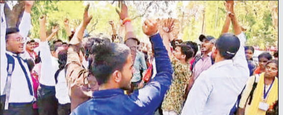
प्रदर्शन करते अखिल भारतीय विद्यार्थी परिषद के कार्यकर्ता।