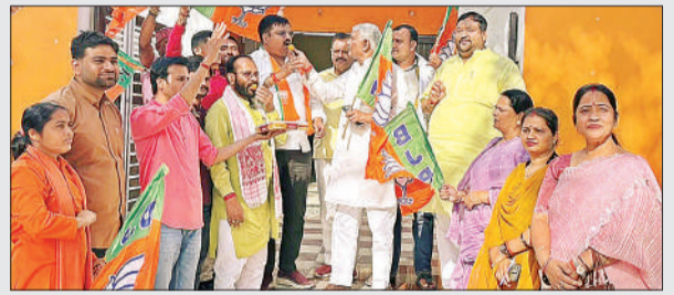
बिहार में भाजपा का मुख्यमंत्री बनने पर एक-दूसरे को मिठाई खिलाते भाजपाई।