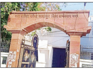
नगर पालिका परिषद जलालपुर।

अमृत विचार। जलालपुर नगर पालिका परिषद द्वारा क्षेत्र के लोगों की सुविधा, सुरक्षा और मनोरंजन को स्थान में रखते हुए कई महत्वपूर्ण विकास कार्य कराए जाने की योजना बनाई गई है। इन योजनाओं के पूरा होने से नगर क्षेत्र के नागरिकों को बेहतर सुरक्षा व्यवस्था के साथ-साथ सामाजिक और मनोरंजन से जुड़ी सुविधाएं भी मिल सकेंगी। नगर पालिका द्वारा जलालपुर चौराहे से बड़े पुल के पास स्थित पुराने चुंगी भवन को ध्वस्त कर 51.41 लाख रुपए की लागत से आधुनिक पुलिस बूथ का निर्माण कराया जाएगा। इस पुलिस बूथ के बन जाने से क्षेत्र में पुलिस की निगरानी