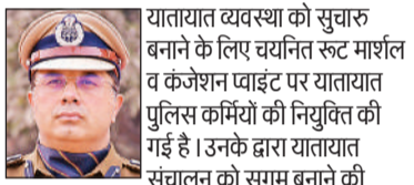
यातायात व्यवस्था को सुचारु बनाने के लिए चयनित रूट मार्शल व कंजेशन वाइडेंट पर यातायात पुलिस कर्मियों की नियुक्ति की गई है। उनके द्वारा यातायात संचालन को सुगम बनाने की

कार्रवाई की जा रही है। विशेष अभियान चलाकर मंगलवार को उपरोक्त मार्गों से अवैध अतिक्रमण हटाए गए। नो-पार्किंग जोन में वाहन खड़ा करने वालों के विरुद्ध कार्रवाई की गई। आमजन को निर्धारित पार्किंग स्थलों पर वाहन खड़ा करने तथा यातायात नियमों का पालन करने के लिए जागरूक किया गया। दुकानदारों को अवैध अतिक्रमण न करने की चेतावनी दी गई और नागरिकों को यातायात नियमों का पालन करने हेतु प्रेरित किया गया। प्रवर्तन कार्यवाही के अंतर्गत कुल 226 वाहनों का चालान किया गया व 2.26 लाख का जुर्माना तय किया गया।