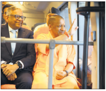
टाटा मोटर्स के लखनऊ प्लांट में 10 लाखवीं गाड़ी को फ्लैग ऑफ करने के बाद बस में बैठे मुख्यमंत्री योगी।

अमृत विचार: नोएडा में हुए बवाल के बीच मुख्यमंत्री योगी आदित्यनाथ ने कड़ा संदेश देते हुए साफ कहा कि किसी भी स्थिति में बाहरी तत्वों को औद्योगिक इकाइयों या संस्थानों के आंतरिक मामलों में हस्तक्षेप बर्दाश्त नहीं होगा। उन्होंने स्पष्ट किया कि संगठन की मजबूती के लिए टीमवर्क, ईमानदारी और कृतज्ञता सबसे अहम हैं। टाटा मोटर्स के लखनऊ प्लांट से बुधवार को 10 लाखवीं गाड़ी को फ्लैग ऑफ करने के दौरान मुख्यमंत्री योगी ने अप्रत्यक्ष रूप से नोएडा की