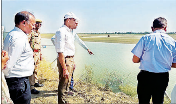
कटानरोधी कार्यों का निरीक्षण करते डीएम और अन्य अधिकारी। ● अमृत विचार

अधिकारियों ने बताया कि दोनों ग्रामों को नदी कटान से बचाने के लिए 220.53 लाख रुपये की लागत से कार्य कराया जा रहा है। परियोजना के तहत 400 मीटर लंबाई में जियो बैग के माध्यम से लॉन्गिंग एप्रन और स्लोप पिचिंग का निर्माण होगा, जिससे तट मजबूत होगा तथा आबादी