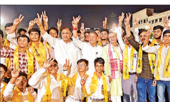
सरस्वती विद्या मंदिर में उत्कृष्ट नंबर से पास हुए मेधावी।