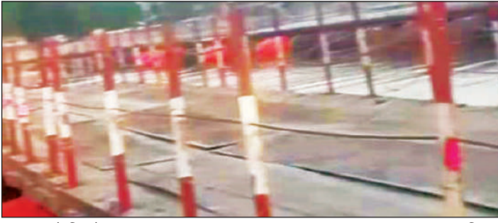
आवागमन के लिए तैयार पाण्डून पुल।