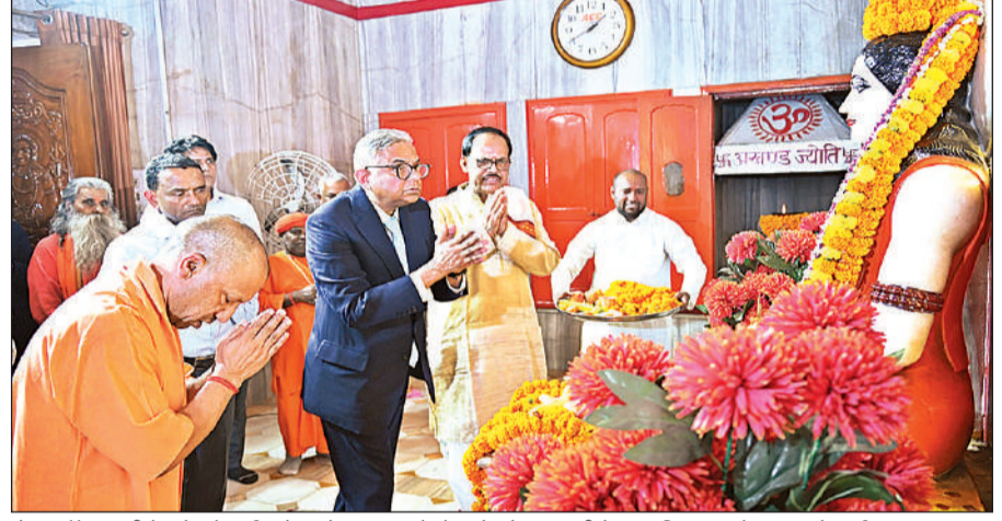
सेंटर ऑफ एक्सीलेंस के लोकार्पण से पहले टाटा संस के चेयरमैन ने मुख्यमंत्री के साथ किप गुरु गोरखनाथ के दर्शन।

वे बुधवार को पूर्वी उत्तर प्रदेश के पहले अत्याधुनिक सेंटर ऑफ एक्सीलेंस (सीओई) के लोकार्पण के अवसर पर बोल रहे थे। महाराणा प्रताप इंस्टिट्यूट ऑफ टेक्नोलॉजी (एमपीआईटी) में टाटा कंसल्टेंसी सर्विसेज (टीसीएस) के सहयोग से बने इस सेंटर की शुरुआत टाटा संस के चेयरमैन एन. चंद्रशेखरन और टीसीएस के सीईओ के. कृतिवासन की मौजूदगी में हुआ। मुख्यमंत्री ने कहा कि यह सेंटर युवाओं को इमर्जिंग टेक्नोलॉजी में दक्ष बनाकर उन्हें वैश्विक प्रतिस्पर्धा के लिए