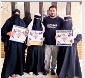
रक्तदाताओं को सम्मानित करते आयोजक।