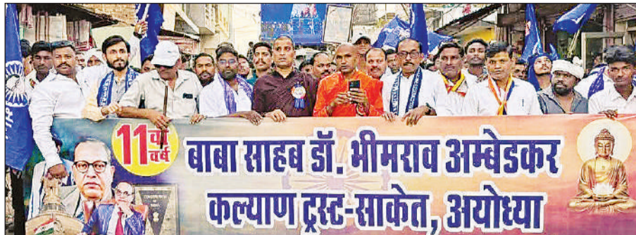
डॉ. भीमराव अम्बेडकर कल्याण ट्रस्ट द्वारा निकाली गई रैली में शामिल लोग।