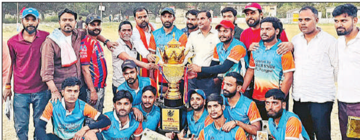
ट्रॉफी व पुरस्कार राशि के साथ विजेता टीम।