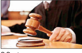
विधि संवाददाता, सुलतानपुर