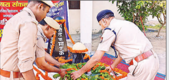
भिनगा में आयोजित कार्यक्रम में श्रद्धांजलि अर्पित करते अधिकारी।