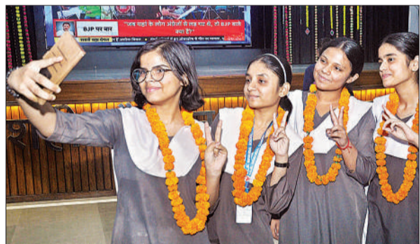
अच्छा रिजल्ट आने के बाद सेल्फी लेती आर एल बी स्कूल की छात्राएं ।