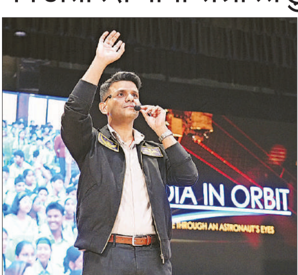
छात्रों से मुखातिब अंतरिक्ष यात्री शुभांशु शुक्ला ।

अमृत विचार: अंतरिक्ष यात्री शुभांशु शुक्ला एक बार फिर अपने स्कूल सिटी मोन्टेसरी स्कूल में पधारे और इंटरनेशनल डे ऑफ ह्यूमन स्पेस फ्लाइट के उपलक्ष्य में 'स्पेस फेस्टिवल-2026' के अन्तर्गत हजारों छात्रों से संवाद किया। इस अवसर पर शुभांशु शुक्ला को 'अशोक चक्र' अर्जित करने हेतु विशेष रूबरू से सम्मानित किया गया। इस अवसर पर सभी 22 कैम्पसों के छात्रों से प्रत्यक्ष एवं ऑनलाइन संवाद करते हुए शुभांशु शुक्ला ने अपने स्कूली दिनों को याद किया। इसके उपरान्त शुभांशु शुक्ला ने अपनी हालिया अंतरिक्ष यात्रा के अनुभवों को साझा करते हुए पॉवर प्वाइन्ट प्रजेंटेशन के माध्यम से छात्रों को अंतरिक्ष यात्रा के दौरान आने वाली चुनौतियों एवं अन्तराष्ट्रीय स्पेस स्टेशन में रहने के अनुभवों को विस्तार से बताया।