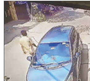
सीसीटीवी कैमरे में कैद हुआ आरोपी।