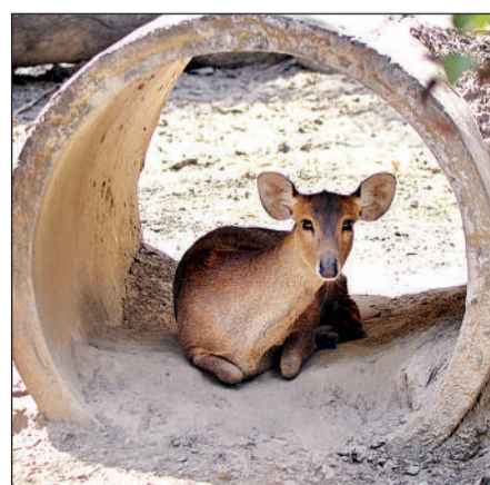
चिड़ियाघर में धूप से बचने के लिए पाइप के बीच बैठा चीतल और पानी में नहाता कबूतर।

अमृत विचार : अप्रैल माह में पड़ रही गर्मी और लू से जानवरों को बचाने के लिए चिड़ियाघर प्रशासन ने चाजिद अली शाह प्राणि उद्यान में जानवरों के बाड़े, पिंजडों में कूलर, चटाई और फव्वारें लगाने का काम जोंरों से चल रहा है। इसके साथ ही जानवरों को डिहाइड्रेशन से बचाने के लिए जूस और फल देने के साथ मौसमी सब्जियां भी दी जा रही हैं। वहीं हिरन के बाड़े में लगा सिंक्रलर के काम ना करने से हिरन गर्मी को झेलने को मजबूर है ऐसे में चिड़ियाघर प्रशासन की ओर से जानवरों को गर्मी से बचाने के लिये किये गये इंतजाम सवाल खड़ा कर रहे हैं।