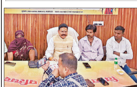
प्रसवार्ता करते राष्ट्रीय अध्यक्ष गोपाल राय।