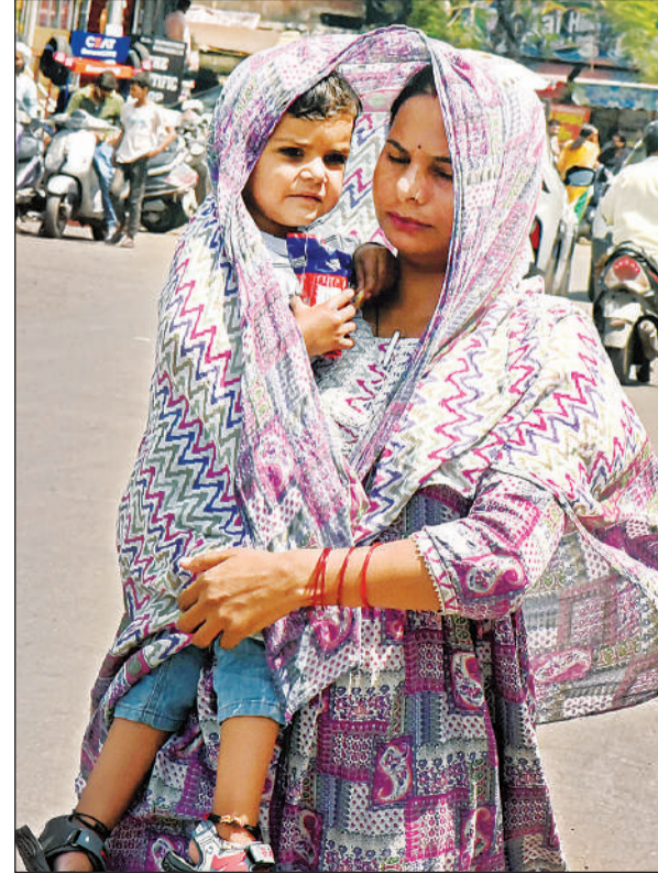
तेज धूप से बचने के लिए खुद और बच्चे को दुधुप से ढककर जाती महिला।