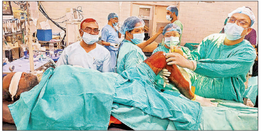
बलरामपुर अस्पताल में मरीज का ऑपरेशन करते डॉक्टर।