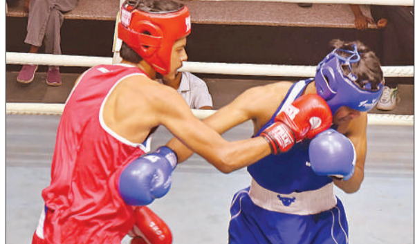
बॉक्सिंग प्रतियोगिता के दौरान मुकाबला करते प्रतिभागी ।

अमृत विचार: लखनऊ में आयोजित सांसद खेल महाकुंभ के अंतिम दिन खिलाड़ियों ने शानदार प्रदर्शन करते हुए विभिन्न प्रतियोगिताओं में जीत दर्ज की। बुधवार को मुकाबले केडी सिंह बाबू स्टेडियम और चौक स्टेडियम में आयोजित किए गए, जहां बॉक्सिंग और कबड्डी समेत कई खेलों में रोमांचक मुकाबले देखने को मिले। चौक स्टेडियम में आयोजित कबड्डी प्रतियोगिता के सीनियर महिला वर्ग में दयानंद कॉलेज (लखनऊ पूर्व) की टीम ने बेहतरीन प्रदर्शन करते हुए प्रथम स्थान हासिल किया। वहीं जूनियर बालिका वर्ग में जनता इंटर कॉलेज (कैंट) ने खिनात अपने नाम किया। बास्केटबॉल प्रतियोगिता में सीनियर बालक वर्ग में बीबीडी विश्वविद्यालय (पूर्व) की टीम विजेता रही, जबकि जूनियर बालक वर्ग में सेंट जोसेफ स्कूल (सीतापुर