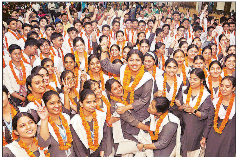
इंदिरानगर मुंशी पुलिया आर एल बी स्कूल में सीबीएसई कक्षा 10 का परीक्षा परिणाम घोषित होने पर खुशी मनाते छात्र-छात्राएं ।