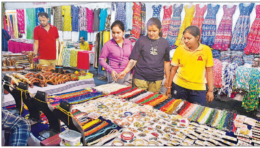
केंद्रीय संस्कृत विवि लगी हथकरघा हस्तशिल्प और ग्रामोद्योग प्रदर्शनी में एक स्टाल पर हस्तशिल्प देखती युवतियां। अमृत विचार

पत्ती व घाटी के फूलों से सजी हाथ की कड़ाई के कपड़े, पश्चिम बंगाल के तांत व कांथा, बालूचरी व भावलू, तनछुई जामदानी की साड़ियां, उड़ीसा के पारंपरिक मंदिर बाईर वाली सम्बलपुरी इक्कत के कपड़े, आन्ध्र प्रदेश की उप्पाड़ा व प्राकृतिक रंगों से बनी कलमकारी व जरी बाईर वाली मंगलगिरि व बिराला के कपड़े, कर्नाटक रॉ सिल्क एवं हुबली, बेलगाम की साड़ियां, तमिलनाडु की मद्रुई व सेलम व काजीवरम साड़ियां, असम की सेमी मूगा व सिल्क की साड़ियां तथा अनेक प्रकार की आर्टिफिशियल ज्वेलरी व सजावटी आइटम के स्टाल भी लगाए गए हैं।