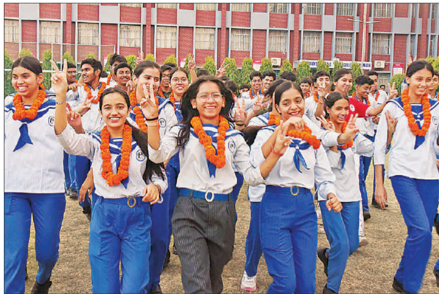
गोमतीनगर कटौता झील स्थित एलपीएस परिसर में दौड़ कर खुशी मनाते सबसे सर्वाधिक अंक पाने वाले छात्र छात्राएं ।