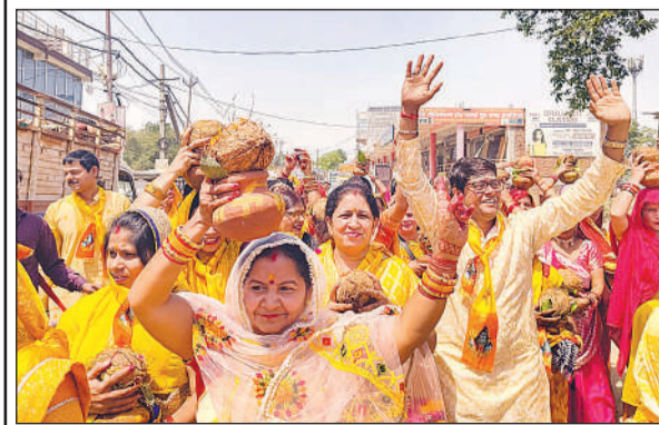
मंदिर में मूर्तियों की स्थापना के पहले कलश यात्रा निकालते भक्त।