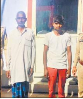
पुलिस हिरासत में हत्यारोपी।

इंटरनेशनल स्कूल और रियान जीआईसी स्कूल का भी निरीक्षण कर संबंधित अधिकारियों को आवश्यक दिशा-निर्देश दिए गए। डीएम ने बताया कि प्रशिक्षण के बाद मूल्यांकन परीक्षा कराई जाएगी, जिससे यह सुनिश्चित किया जा सके कि सभी कार्मिकों ने आवश्यक जानकारी हासिल कर ली है। प्रशिक्षण की निगरानी के लिए वरिष्ठ अधिकारियों को विभिन्न तहसीलों में नोडल पर्यवेक्षक बनाया गया है, जो अलग-अलग बैचों में निरीक्षण करेंगे। उन्होंने स्पष्ट कहा कि सूचना के बावजूद प्रशिक्षण में अनुपस्थित रहने वाले प्रगणकों और पर्यवेक्षकों के खिलाफ जनगणना अधिनियम-1948 के तहत कार्रवाई की जाएगी।