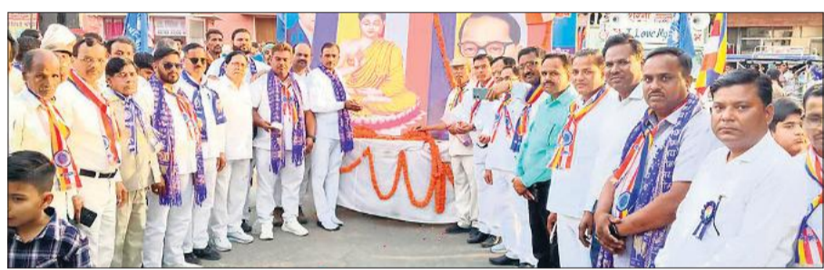
भगवान बुद्ध, डॉ आंबेडकर, संत गाडगे और संत गुरु रविदास की प्रतिमाओं के समक्ष वंदना करते सदस्य।