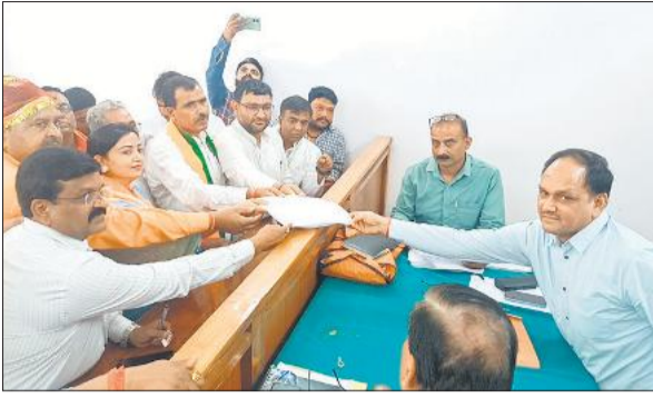
तिलहर तहसील में नामांकन पत्र दाखिल करती भाजपा प्रत्याशी।