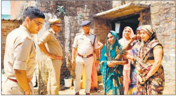
घटनास्थल का निरीक्षण करते एएसपी सिटी।