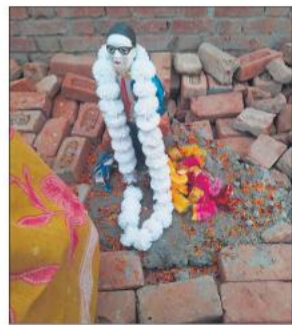
ग्राम समाज की जमीन पर स्थापित की गई बाबा साहब की प्रतिमा।

तीन थानों की पुलिस का गांव में डेरा, विधायक और सीओ ने ग्रामीणों को समझाया