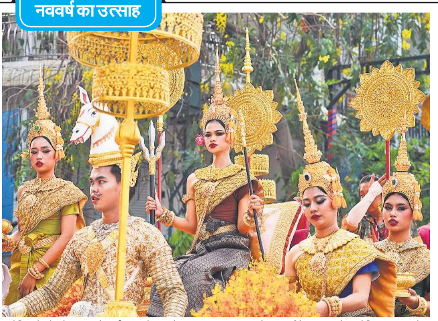
केंबोडिया के नोम पेंह शहर में शाही महल के सामने एक मुख्य सड़क पर खमेर नव वर्ष के उपलक्ष्य में आयोजित संक्रांता परेड में प्रदर्शन करने के लिए अपनी बारी की प्रतीक्षा करते केंबोडियाई नर्तक।