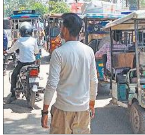
लाल इमली चौराहे पर लगा जाम।

41.07 करोड़ रुपये से 13 स्थानों पर लगाई गई थीं लाइटें, केवल दो जगह संचालित