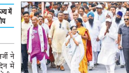
चुनाव प्रचार के दौरान रोड शो करती ममता बनर्जी।

उन्होंने कहा कि जब मैं आज कोलकाता हवाई अड्डा जा रही थी तो केंद्रीय बलों ने मेरी कार की तलाशी लेने की कोशिश की। अगर वास्तव में हिम्मत है, तो आप हर दिन मेरी कार की जांच करें। तृणमूल कांग्रेस ने मंगलवार को आरोप लगाया था कि केवल उसके नेताओं,