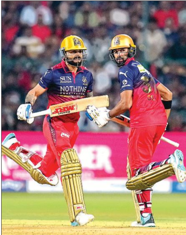
रन लेते रॉयल चैलेंजर्स बंगलुरु के विराट कोहली और देवदत्त पडिक्कल।

इस जीत से बंगलुरु की टीम पांच मैच में चार जीत से आठ अंक के साथ शीर्ष पर पहुंच गई है। राजस्थान रॉयल्स के भी आठ अंक हैं लेकिन रॉयल चैलेंजर्स बंगलुरु की टीम बेहतर नेट रन रेट के कारण शीर्ष पर है। रसिख (24 रन पर चार विकेट) और भुवनेश्वर (27 रन पर तीन विकेट) की धारदार गेंदबाजी के सामने सुपर जायंट्स की टीम पारी की अंतिम गेंद पर 146 रन पर