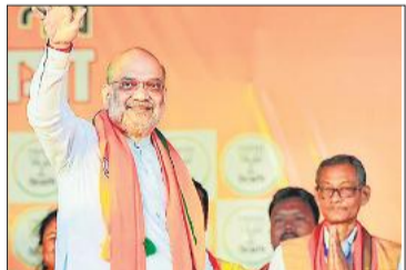
जनसभा को संबोधित करते गृहमंत्री अमित शाह।

शाह ने कहा कि मोदी ने गुजरात पर 12 साल शासन किया और केंद्र में भी पिछले 12 साल से नेतृत्व कर रहे हैं, फिर भी उनके खिलाफ एक प्रक्रिया को शुरू करने का काम राज्य के उत्तरी क्षेत्रों से शुरू होगा। शाह ने रैली को संबोधित करते हुए कहा कि बंगाल में भाजपा को सत्ता में लाएं और