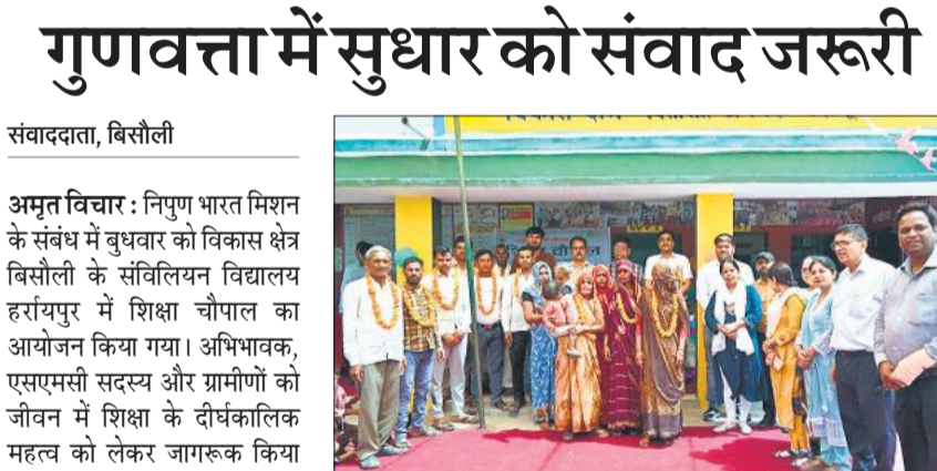
शिक्षा चौपाल के दौरान विद्यालय में मौजूद अभिभावक और स्टाफ।