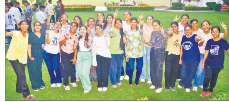
परिणाम घोषित होने के बाद बरेली के जीआरएम स्कूल में जश्न मनाते छात्र-छात्राएं। ● हरदीप सिंह टोनी

केंद्रीय माध्यमिक शिक्षा बोर्ड (सीबीएसई) ने कक्षा 10 की पहली बोर्ड परीक्षा में 93.70 प्रतिशत से अधिक छात्र उत्तीर्ण हुए, जिनमें से 55,000 से अधिक छात्रों ने 95 प्रतिशत से अधिक अंक प्राप्त किए। कुल 2.20 लाख से अधिक छात्रों ने 91 प्रतिशत से अधिक अंक हासिल किए। 1.47 लाख से अधिक अभ्यर्थियों को 'कमपासमेंट' श्रेणी में रखा गया है। परीक्षा में एक बार फिर लड़कियों ने लड़कों को पीछे छोड़ दिया है। इस बार 94.99 प्रतिशत