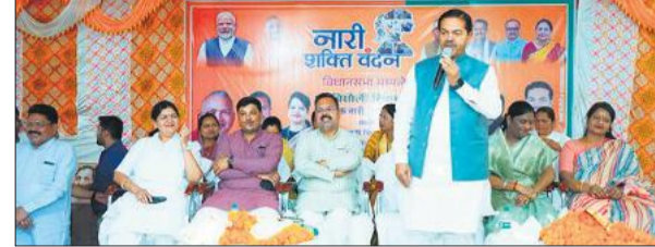
सम्मेलन को संबोधित करते केंद्रीय राज्यमंत्री बीएल वर्मा।