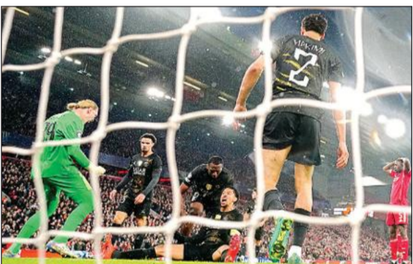
गोल बचाने के बाद जगन मनाती पीएसजी की टीम।

बार्सिलोना दूसरे चरण में जीत के बावजूद क्वार्टर फाइनल में एटलेटिको मैड्रिड से कुल स्कोर में 3-2 से हारने के कारण चैंपियंस लीग फुटबाल टूर्नामेंट के सेमीफाइनल में पहुंचने में नाकाम रहा। एटलेटिको मैड्रिड ने क्वार्टर फाइनल के पहले चरण का मैच 2-0 से जीता था जो आखिर में निर्णायक साबित हुआ। बार्सिलोना ने दूसरे चरण का मैच 2-1 से जीता लेकिन यह आगे बढ़ने के लिए पर्याप्त नहीं था। इस बीच मौजूदा चैंपियन पेरिस सेंट जर्मेन (पीएसजी) ने लिवरपूल को 4-0 से हराकर सेमीफाइनल में जगह बनाई और इस तरह से अपने खिताब का बचाव करने की तरफ कदम बढ़ाए। पीएसजी ने क्वार्टर फाइनल के पहले चरण के मैच की तरह दूसरे चरण के मैच में भी 2-0 से जीत हासिल की। बार्सिलोना