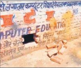
पंचर की दुकान में लगाया नकब।