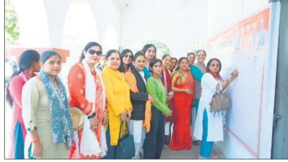
अधिनियम के संबंध में हस्ताक्षर करके प्रधानमंत्री का किया गया अभिनंदन।