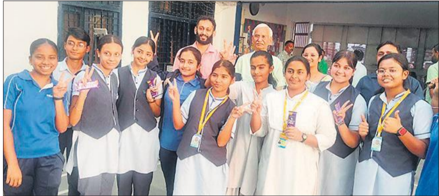
खुशी जताते जिले में टॉप स्थान प्राप्त करने वाले तक्षशिला पब्लिक स्कूल के बच्चे।