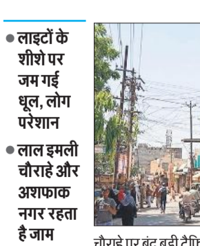
चौराहे पर बंद बड़ी ट्रैफिक लाइटें।

अमृत विचार : स्मार्ट सिटी में ट्रैफिक व्यवस्था को सुचारु रखने और यातायात नियमों का पालन करने के उद्देश्य से प्रत्येक चौराहे और तिराहे पर ट्रैफिक सिग्नल लाइटें लगाई गई थीं। 13 स्थानों में मात्र 02 स्थानों पर ट्रैफिक सिग्नल लाइटें काम कर रही हैं और बाकी जगह बंद पड़ी हैं। बंद पड़ी लाइटों को नगर निगम ने ठीक कराने की जरूरत तक नहीं समझी है। इसी वजह से चौराहे और तिराहे पर जाम लगता है। शहर में 2022 में 41.07 करोड़ रुपये की ट्रैफिक सिग्नल लाइटें अशफाकनगर चौराहे, लालइमली चौराहे, खिरनीबाग चौराहे, घंटाघर, हथौड़ा चौराहे, नगर निगम कार्यालय के निकट त्रिमूर्ति कवि