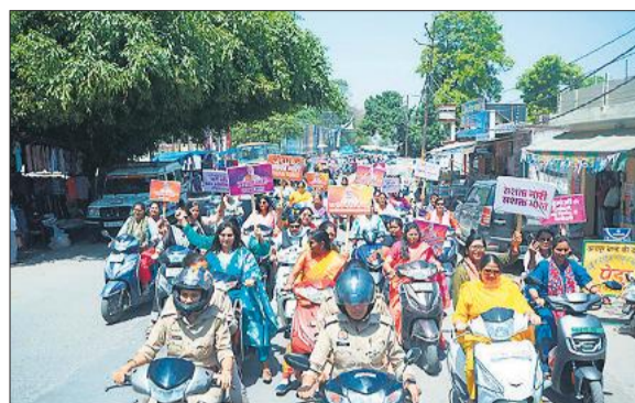
नारी शक्ति वंदन अधिनियम के संबंध में जागरूकता रैली निकालती महिलाएं।