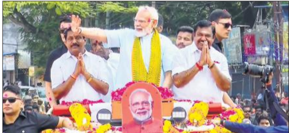
नागरकोइल में राजग प्रत्याशी के पक्ष में रोड शो करते प्रधानमंत्री नरेन्द्र मोदी।

ऑल इंडिया अन्ना द्रविड़ मुनेत्र कषमम (अन्नाद्रमुक) के महासचिव एडप्पाडी के. पलानीस्वामी, भाजपा के प्रदेश अध्यक्ष नैनार नागेंद्रन और उनके पूर्ववर्ती के. अन्नामलार्ई के साथ कन्याकुमारी जिले के नागरकोइल में मोदी एक सजे-धजे वाहन के ऊपर खड़े होकर, सड़क के दोनों ओर बढ़ी संख्या में मौजूद लोगों