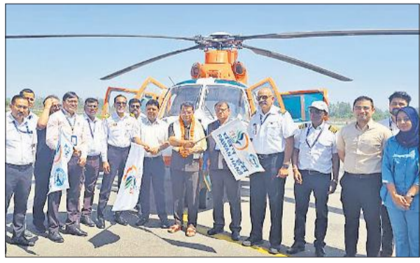
हेलीकॉप्टर को रवाना करते विधायक, डीएम और एयरपोर्ट अधिकारी।