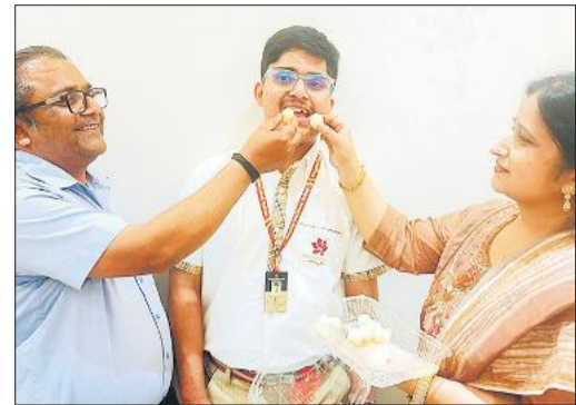
दर्श को मिटाई खिलते माता-पिता।