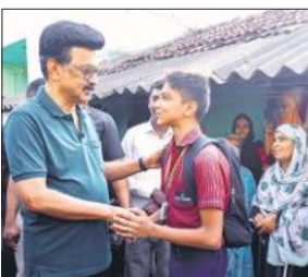
जनसम्मर्क करते तमिलनाडु के मुख्यमंत्री स्टालिन।

चेन्नई, एजेंसी। तमिलनाडु के मुख्यमंत्री एम. के. स्टालिन ने प्रस्तावित परिसीमन अध्याय के खिलाफ 16 अप्रैल को पूरे राज्य में काले झंडे दिखाकर प्रदर्शन की घोषणा की और केंद्र को चेतावनी दी कि यदि उसने तमिलनाडु की आवाज पर ध्यान नहीं दिया तो उसे गंभीर परिणाम भुगतने होंगे और भारी कीमत चुकानी पड़ेगी। सत्तारूढ़ द्रविड़ मुनेत्र कषमम (द्रमुक) के अध्यक्ष स्टालिन ने परिसीमन पर वीडियो कॉन्फ्रेंस के माध्यम से पार्टी सांसदों और पार्टी जिला सचिवों की एक आपात बैठक की अध्यक्षता करने के बाद कहा कि हमारे सिर पर लटकी तलवार अब हम पर आ गिरी है। कहा- द्रमुक सभी राज्यों के सांसदों से संपर्क साध रही है और इस गंभीर खतरे का मुकाबला करने के लिए समन्वित रणनीति तैयार कर रही है। स्टालिन ने आरोप लगाया कि केंद्र में भाजपा के नेतृत्व वाली सरकार द्वारा बृहत्पतिवार को संसद में लाया जाने वाला परिसीमन संशोधन तमिलनाडु और दक्षिणी राज्यों के खिलाफ एक घोर पैंतहासिक अन्याय है।