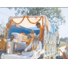
शोभायात्रा में शामिल श्रद्धालु।

अमृत विचार : ब्लॉक मुख्यालय परिसर में नवनिर्मित सिद्धेश्वर नाथ शिव मंदिर में शिवलिंग स्थापना से पहले नगर में शोभा यात्रा निकाली गई। शोभायात्रा बुधवार दोपहर 12 बजे से ब्लॉक प्रांगण से शुरू होकर नगर के तिकुनिया चौराहा स्थित त्रिलोकनाथ शिव मंदिर, मैलानी रोड स्थित प्राचीन बालाजी धाम, बाबा बगियाबाग मंदिर, देवस्थान मंदिर, बाबा गुलराहनाथ मंदिर से होकर पुनः ब्लॉक मुख्यालय प्रांगण पहुंची। जहां पर विद्वान पंडितों के द्वारा विधि विधान से हवन पूजन कर नवनिर्मित सिद्धेश्वर नाथ शिव मंदिर में शिवलिंग, भगवान गणेश और नंदी महाराज की प्रतिमा स्थापित की गई। इस दौरान