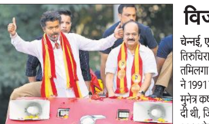
चुनाव प्रचार के दौरान टीवीके प्रमुख विजय।