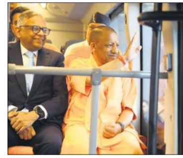
टाटा मोटर्स के लखनऊ प्लांट में 10 लाखवीं गाड़ी को पलैंग ऑफ करने के बाद बस में बैठे मुख्यमंत्री योगी।

मुख्यमंत्री ने कहा कि टाटा मोटर्स का 10 लाखवीं गाड़ी का उत्पादन केवल एक उपलब्धि नहीं, बल्कि उत्तर प्रदेश की औद्योगिक प्रगति का प्रतीक है। उन्होंने इसे ऐतिहासिक उड़ान का लॉन्च पैड बताते हुए कहा कि प्रदेश तेजी से ग्लोबल मैन्युफैचरिंग हब के रूप में उभर रहा है। उन्होंने कहा कि बेहतर कानून-व्यवस्था, मजबूत इंफ्रास्ट्रक्चर और निवेश अनुकूल माहौल के कारण आज उत्तर प्रदेश उद्योगों के लिए आकर्षक गंतव्य बन चुका है। से अपील की कि वे ऐसे तत्वों से सतर्क रहें, जो संगठन की एकता और औद्योगिक शांति को नुकसान पहुंचाने की कोशिश करते हैं। योगी ने कहा कि किसी भी संस्था को सफलता का आधार