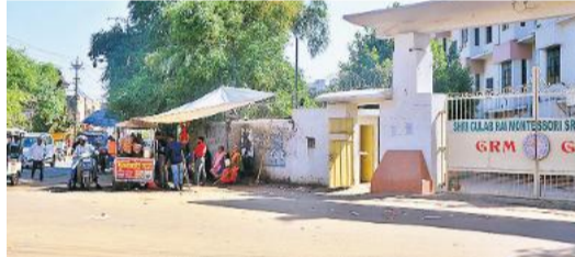
बरेली, अमृत विचार : कोहाड़ापीर-कुदौशिया रोड के चौड़ीकरण को लेकर नगर निगम ने कमर कस ली है। अफसरों का कहना है जो निर्माण राह की बाधा बन रहे हैं, उन्हें 15 दिन में अतिक्रमण खुद हटाने को कहा गया है। इसके बाद निगम एक्शन लेगा और हर्जानी भी वसूलेगा। नैनीताल रोड पर जीआरएम स्कूल का गेट और बाउंड्रीवॉल का हिस्सा सहित कई प्रतिष्ठान चौड़ीकरण की जद में हैं और मुख्यमंत्री की प्राथमिकता वाली परियोजना के चलते में निगम के तैवर सख्त है। बीते दिनों कोहाड़ापीर से नैनीताल रोड तक नगर निगम की निर्माण विभाग की टीम ने कुल 386 छोट-बड़े अवैध कब्जे चिह्नित किए हैं। इनमें जीआरएम के सामने वाली पट्टी पर स्थित करीब 80 दुकानदारों और भवन स्वामियों को 15 दिन का अंतिम नोटिस चरचा किया गया है। सरकारी जमीनों पर अतिक्रमण माने गए प्रतिष्ठानों को नोटिस जारी होने के बाद हड़कंप की स्थिति नजर आ रही है। मंत्री, सांसद और विधायकों की सिफारिश भी काम नहीं आ रही। सोमवार को वन मंत्री डॉ. अरुण कुमार के हस्तक्षेप पर निगम ने फिलहाल ध्वस्तीकरण रुक गया है। मंत्री ने अफसरों से कहा है कि सभी पक्षों के साथ बैठक कर कार्रवाई आगे बढ़ाई जाए। हालांकि, निगम के अफसरों का कहना है कि 15 दिन की नोटिस अवधि बीतने के बाद कार्रवाई फिर शुरू कर दी जाएगी। फिर चाहे वो स्कूल-बारांघर हो या अन्य प्रतिष्ठान, एक्शन समान रूप से होगा।