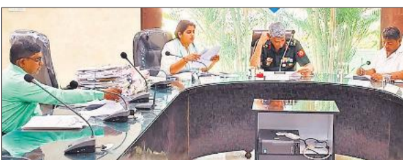
छवनी बोर्ड बैठक में मौजूद अफसर।