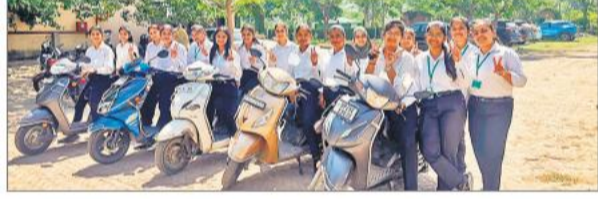
स्कूटी रैली निकालती छात्राएं।