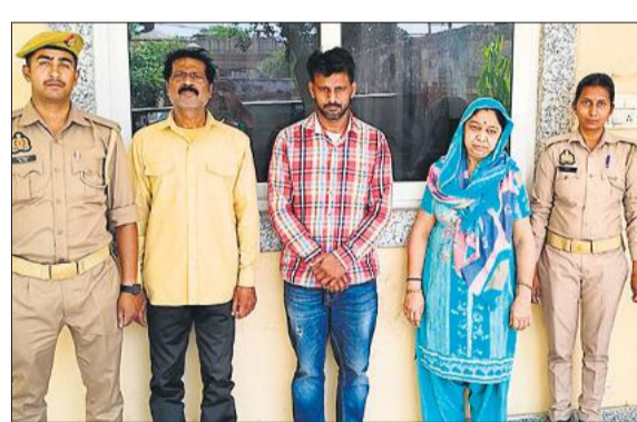
पुलिस हिरासत में आरोपी।