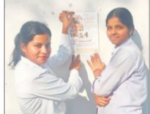
पंपलेट चिपकाती छात्राएं।

यूनिवर्सिटी के बीआईयू कॉलेज ऑफ ह्यूमैनिटीज एंड जर्नलिज्म एवं बीआईयू कॉलेज ऑफ मैनेजमेंट द्वारा नारी शक्ति वंदन अधिनियम के समर्थन में बुधवार को विशेष मिस्ट कॉल अभियान की शुरुआत की गई। अभियान के तहत लोगों से 9667173333 नंबर पर मिस्ट कॉल देकर अपना समर्थन दर्ज कराने की