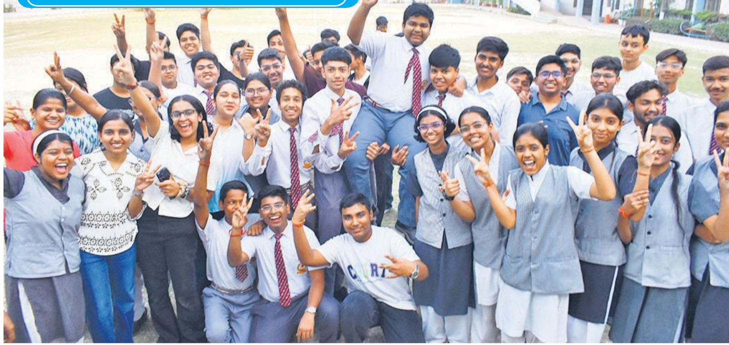
सीबीएसई 10 वीं का परिणाम आने पर स्कूलों में जश्न का माहौल रहा। इस दौरान बीबीएल पब्लिक स्कूल में स्टूडेंट खुशी से झूम उठे। (संबंधित खबर पेज IV पर)