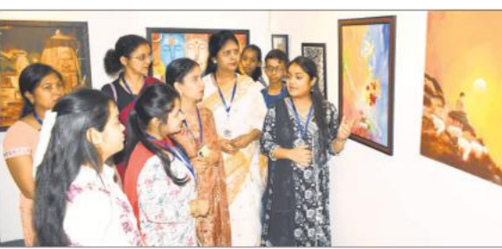
यामिनी आर्ट गैलरी में कला प्रदर्शनी में पेंटिंग देखते कलाप्रेमी।