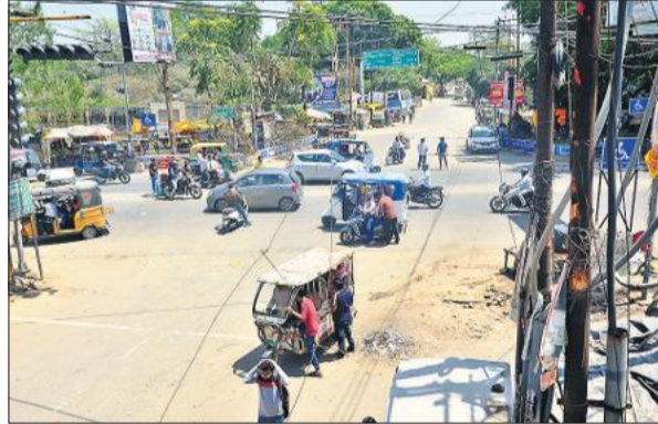
बीसलपुर चौराहे पर बनेगा पुल।