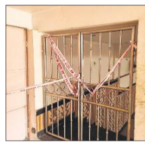
बीडीए ने आम जन को सचेत किया है कि संपत्ति खरीदते समय विक्रेता से मानचित्र स्वीकृति संबंधी अभिलेख मांग कर यह संतुष्टि कर लें कि संपत्ति नियमानुसार प्राधिकरण से स्वीकृत है या नहीं।