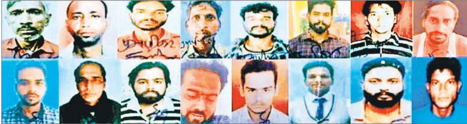
बरेली पुलिस ने तीन दिन के अंदर क्रिमिनल रिकार्ड वाले 42 लोगों की हिस्ट्रीशीट खोली।