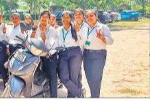
स्कूटी रैली निकालती छात्राएं।