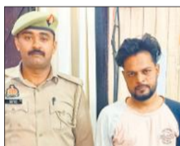
पुलिस गिरफ्तार में आरोपी।