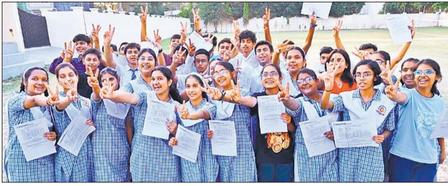
परीक्षा परिणाम आने के बाद जश्न मनाते माधवराव सिंधिया के स्टूडेंट्स।

छात्रों की विश्लेषणात्मक क्षमता और तार्किक सोच को जांचने पर था। यही कारण रहा कि कई मेधावी छात्र भी अपेक्षित अंक नहीं ला सके। एचओटीएस प्रश्नों में छात्रों को एक से अधिक कान्सेप्ट को जोड़कर उत्तर देना पड़ा, जिससे समय प्रबंधन भी प्रभावित हुआ। जनपद में गणित विषय में मेधावी छात्रों के अधिकतम अंक भी 96 के आसपास ही सिमट गए, जबकि पिछले वर्षों में कई छात्र 98-100 तक अंक हासिल करते रहे हैं। इससे यह स्पष्ट होता है कि प्रश्नपत्र ने टॉपर्स की राह भी आसान नहीं छोड़ी।