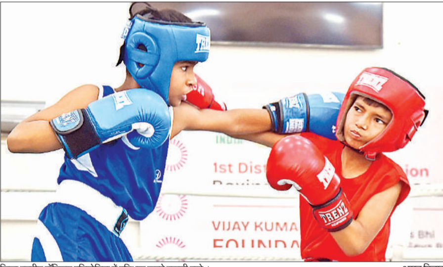
जिला स्तरीय बॉक्सिंग प्रतियोगिता में प्रतिभाग करते स्कूली बच्चे।