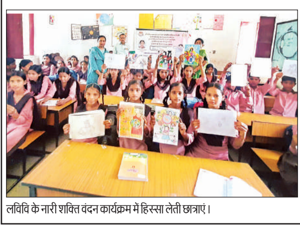
लविवि के नारी शक्ति वंदन कार्यक्रम में हिस्सा लेती छात्राएं।