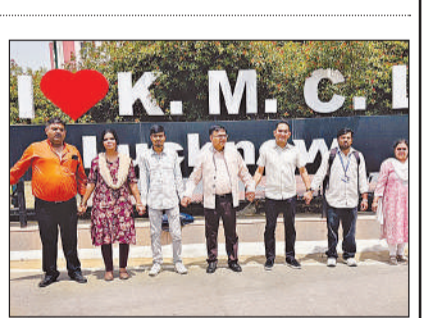
मानव श्रृंखला बनाने कुलपति व अन्य।

अमृत विचार, लखनऊ: सिटी मोटेर्सरी स्कूल, राजाजीपुरम प्रथम केम्पस में आयोजित मॉडल यूनाइटेड नेशनल में छात्रों ने वैश्विक समस्याओं पर चर्चा-परिचर्चा करते हुए संदेश दिया कि सर्वश्रेष्ठ विश्व व्यवस्था के लिए एकता व शांति ही अंतिम विकल्प है। विभिन्न देशों का प्रतिनिधित्व करते हुए प्रतिभागी छात्रों ने संयुक्त राष्ट्र संघ की कार्यवाही का हृदय नजारा प्रस्तुत किया और विभिन्न वैश्विक समस्याओं पर खुलकर अपने विचार रखे। संयुक्त राष्ट्र संघ की विभिन्न शाखाओं का प्रतिनिधित्व करती हुई छात्रों की आठ समितियों का गठन किया गया। छात्र प्रतिनिधियों ने जोरशोर से मानवाधिकारों की कालांतर की द सेलेस्टियल कार्डसिल, हिस्टोरिकल ज्वाइंट क्राइसिस कमेटी के अंतर्गत ईरान, फिलिस्तीन एवं इजराइल के संघर्ष पर गंभीर चर्चा हुई। जबकि 'लोकसभा' नामक कमेटी में प्रतिभागी छात्रों ने राजनीतिक दलों का प्रतिनिधित्व करते हुए अपने विचार रखे।