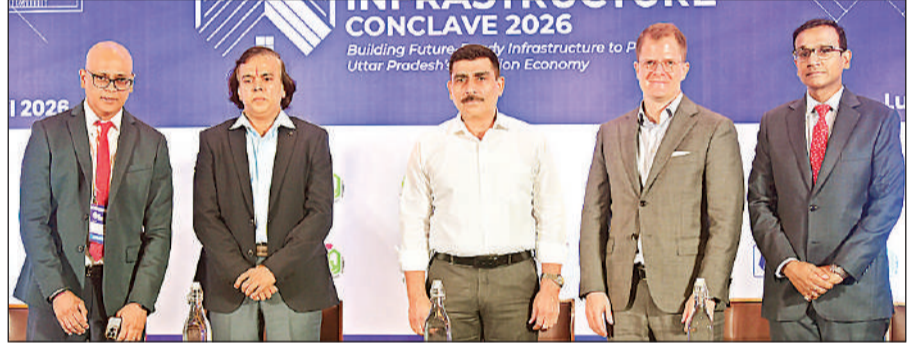
भारतीय उद्योग परिसंघ कॉन्क्लेव में मौजूद पदाधिकारी।