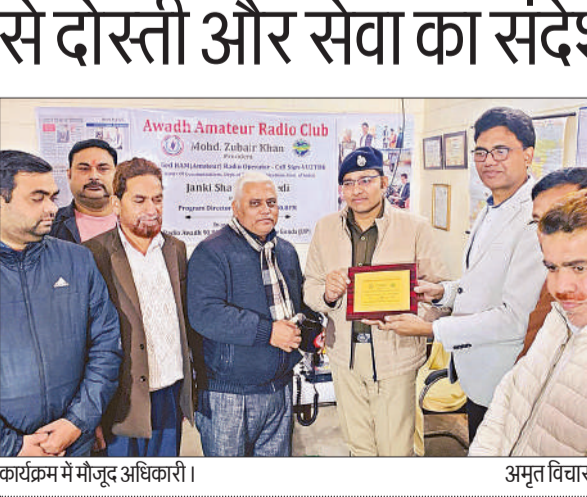
कार्यक्रम में मौजूद अधिकारी।