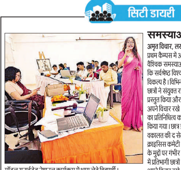
मॉडल यूनाईटेड नेशनल कार्यक्रम में भाग लेते विद्यार्थी।