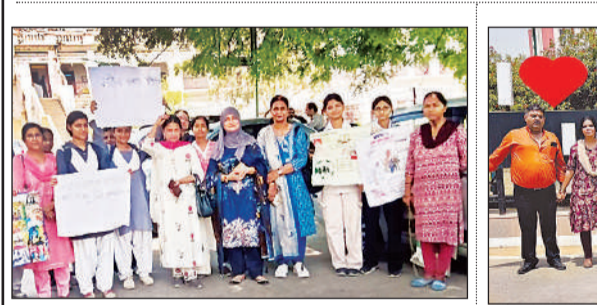
नारी शक्ति वंदन कार्यक्रम में प्रतिभाग करती महिलाएं।