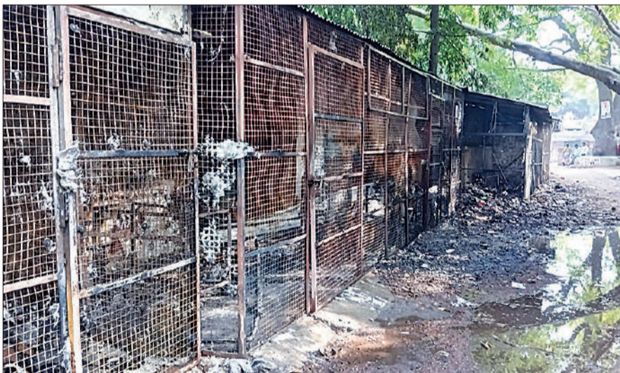
आग लगने के बाद वकीलों के जले हुए चैबर।