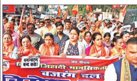
प्रदर्शन करते विश्व हिन्दू परिषद, बजरंगदल पदाधिकारी व सदस्य।