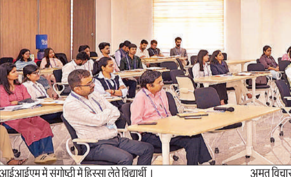
आईआईएम में संगोष्ठी में हिस्सा लेते विद्यार्थी।