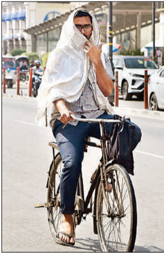
तेज धूप से बचने के लिए गमछे से खुद को ढककर जाते राहगीर।

आवेदन जमा करने की तिथि से तीन माह के अंदर निस्तारण होगा। डिफाल्ट अवधि के लिए दंड ब्याज से पूरी राहत। केवल साधारण ब्याज लिया जाएगा, इसकी गणना साँपटवेयर से होगी। ओटीएस की पूरी राशि 30 दिन में जमा करने पर तीन प्रतिशत छूट मिलेगी। ओटीएस की रकम 50 लाख रुपये से अधिक है तो एक तिहाई भुगतान 30 दिन में और बाकी तीन द्विमासिक किस्त में छह माह में देना होगा। समय से पैसा न देने पर अतिरिक्त दंड ब्याज के साथ एक माह में जमा करने का मौका मिलेगा।