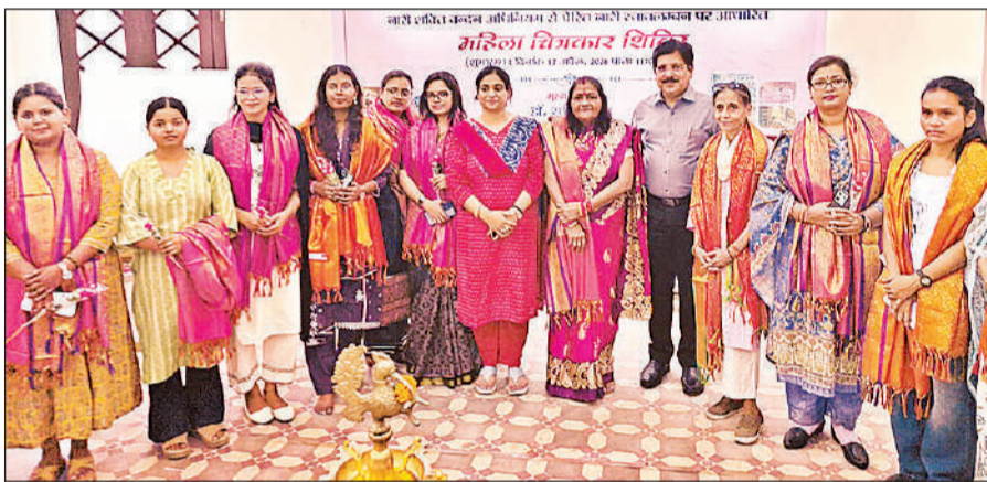
महिला चित्रकार शिविर में महिलाएं और अन्य।

योगी आदित्यनाथ की सोच के अनुरूप यह अभियान महिलाओं की रचनात्मक क्षमता को मंच प्रदान कर रहा है। प्रदेश के विभिन्न शहरों में कला आधारित कार्यक्रमों के माध्यम से जागरूकता फैलायी जा रही है। इसी कड़ी में लाल