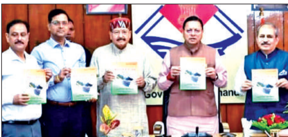
पुस्तिका का विमोचन करते सीएम पुष्कर सिंह धामी व कैबिनेट मंत्री सतपाल महाराज

मुख्यमंत्री ने कहा कि यह पुस्तिका राज्य में बुनियादी ढांचे को विकसित करने, सशक्त और सुरक्षित, भविष्य को सुनिश्चित करने का मार्ग है। राज्य में विकास की संभावनाओं एवं विकसित भारत-2047 के संकल्पों को पूरा करने में यह मास्टर प्लान पुस्तिका अहम भूमिका निभाएगी। कहा कि प्रधानमंत्री नरेंद्र मोदी के मार्गदर्शन में राज्य में इंफ्रास्ट्रक्चर के कार्य तेजी से बढ़े हैं। बीते वर्षों में राज्य में व्यापक स्तर पर सड़कों का निर्माण हुआ है। राज्य सरकार बुनियादी ढांचे के विकास में नवाचार को प्राथमिकता दे रही है। भविष्य की आवश्यकताओं को ध्यान में रखते हुए विकास कार्यों को आगे बढ़ाया जा रहा है। हमारा संकल्प है कि राज्य को तय लक्ष्यों के साथ आगे बढ़ाया जाए और विजन के साथ विकास किया जाए। पर्यटन हब बन रहा राज्य: