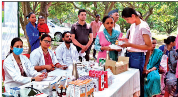
चोरगलिया में आयोजित शिविर में मौजूद टीम व जांच को पहुंचे लोग। ● अमृत विचार

यहां तीन नर्सिंग अधिकारी और दो एएनएम की तैनाती की गई है, जिससे अब क्षेत्र में 24 घंटे प्रसव सेवा उपलब्ध रहेगी। उन्होंने बताया कि हल्द्वानी ब्लॉक के अंतर्गत आने वाले सभी क्षेत्रों में स्वास्थ्य शिविर आयोजित किए जाएंगे। इन शिविरों में गर्भवती महिलाओं की जांच, टीबी