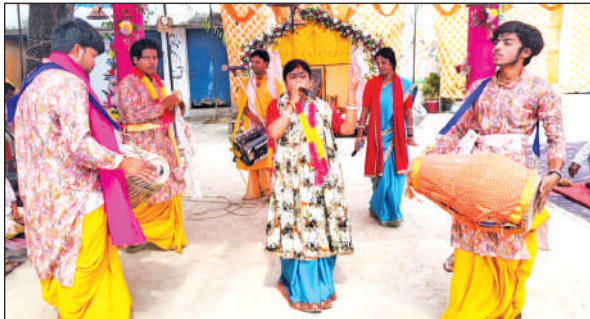
दिनेशपुर में श्री हरि नाम संकीर्तन प्रस्तुत करती कीर्तन मंडली।