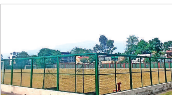
हल्द्वानी स्टेडियम। ● अमृत विचार

अमृत विचार: खेल विभाग की लापरवाही का खामियाजा अब सीधे खिलाड़ियों को भुगतान पड़ रहा है। 15 अप्रैल से शुरू होने वाला नया खेल सत्र अभी तक पटरी पर नहीं आ सका है, क्योंकि विभाग में तैनात कोच पिछले चार महीने से वेतन न मिलने के कारण प्रशिक्षण देने से पीछे हट गए हैं। नतीजतन, स्टेडियम में सननाटा पसर रही है और सैकड़ों खिलाड़ियों