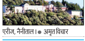
एरीज, नैनीताल। ● अमृत विचार