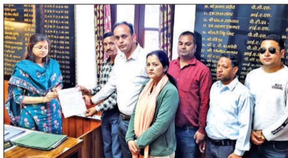
रानीखेत में जर्जर सड़कों को लेकर ज्ञापन सौंपते कांग्रेसी।

अमृत विचार: नगर कांग्रेस कार्यकर्ताओं ने रानीखेत क्षेत्र की जर्जर सड़कों की मरम्मत को लेकर संबंधित अधिकारियों को ज्ञापन सौंपा। ज्ञापन में कहा गया कि केएमयू स्टेशन से धिंधारखाल सहित अन्य क्षेत्रीय सड़कों की स्थिति अत्यंत दयनीय हो चुकी है। कार्यकर्ताओं ने बताया कि सड़कों पर गड्ढों की भरमार, टूटी सतह और जल निकासी की उचित व्यवस्था न होने के कारण आम जनता, वाहन चालकों और राहगीरों को भारी परेशानियों का सामना करना पड़ रहा है। बरसात के मौसम में स्थिति और भी गंभीर