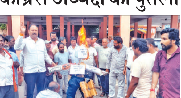
संजय नगर खेड़ा में कांग्रेस प्रदेश अध्यक्ष का पुतला फूंकते बंगाली समाज के लोग।