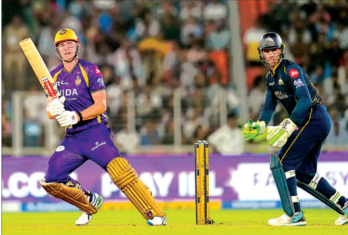
शॉट लगाते कोलकाता नाइट राइडर्स के बल्लेबाज कैमरून ग्रीन।