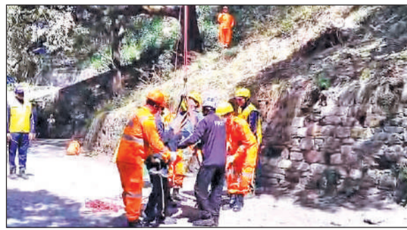
मल्लीताल रोपवे क्षेत्र में आयोजित मॉक ड्रिल के दौरान रेस्क्यू करते जवान।

मॉक ड्रिल के तहत यह परिदृश्य तैयार किया गया कि रोपवे अचानक सात नंबर स्टॉप हाउस के समीप रुक गया है और उसमें चार पर्यटक