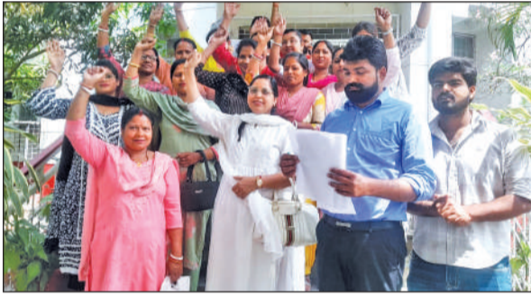
कलेक्टर परिसर में प्रदर्शन करती महिलाएं।