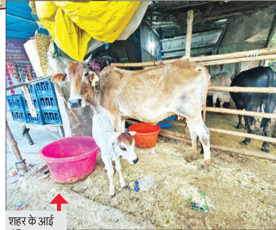
शहर के आई हॉस्पिटल चौराहे के नजदीक छंव के नीचे मौजूद गौवंश