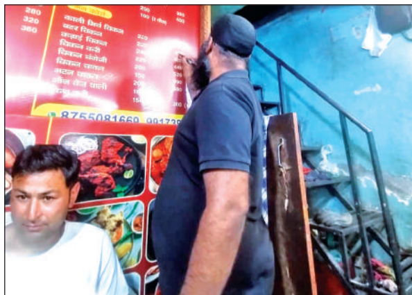
शहर के एक रेस्टोरेंट में रेट लिस्ट में डिशों की कीमतों की सूची में संशोधन करते संभालक।