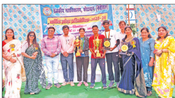
कॉलेज में ओवरऑल चैंपियनों को सम्मानित करते मुख्य अतिथि।