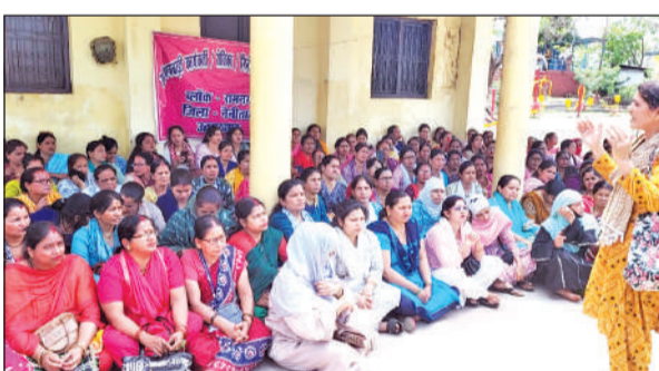
रामनगर में आंदोलन के दौरान सभा को संबोधित करती एक कार्यकर्त्री।

आंगनबाड़ी कार्यकर्त्रियों का कहना है कि वे लंबे समय से मानदेय बढ़ाने की मांग कर रही हैं, लेकिन सरकार की ओर से अब तक कोई ठोस कदम नहीं उठाया गया है। उन्होंने कहा कि 2 अप्रैल से वे दोबारा आंदोलनरत हैं, बावजूद इसके उनकी मांगों पर कोई सकारात्मक पहल नहीं हुई है। कार्यकर्त्रियों ने कहा कि वर्तमान में उन्हें मात्र 9,300 रुपये प्रतिमाह मानदेय मिल रहा है, जो परिवार के भरण-पोषण के लिए बेहद कम है। उन्होंने सरकार से मानदेय बढ़ाकर 18,000 से 24,000 रुपये प्रतिमाह करने की मांग की। उनका