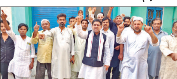
चाइनीज मांड्रे के विरोध में प्रदर्शन करते लोग।