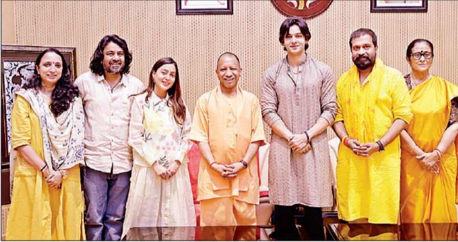
लखनऊ : मुख्यमंत्री योगी से मुलाकात करती फिल्म कृष्णावतारम की टीम।