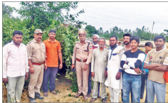
गांव नहनूवाला में तेंदुआ को पकड़ने के लिए वन विभाग द्वारा लगाया गया पिंजरा।