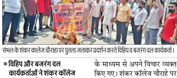
संभल के शंकर कॉलेज चौराहा पर पुतला जलाकर प्रदर्शन करते विश्व हिंदू व बजरंग दल कार्यकर्ता।