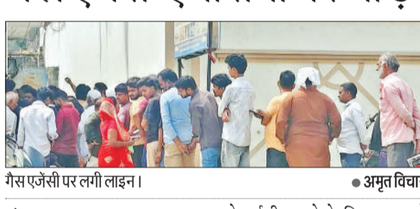
गैस एजेंसी पर लगी लाइन।