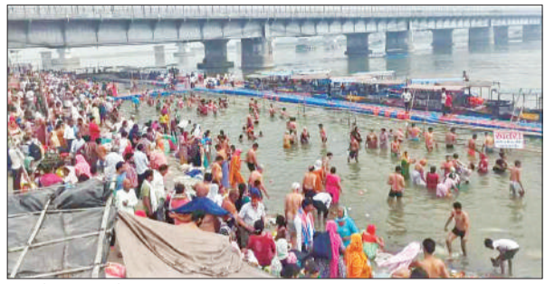
गंगा में स्नान करते श्रद्धालु।