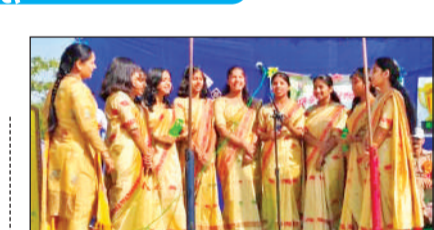
नवोदय विद्यालय में दो दिवसीय क्लस्टर मीट का समापन