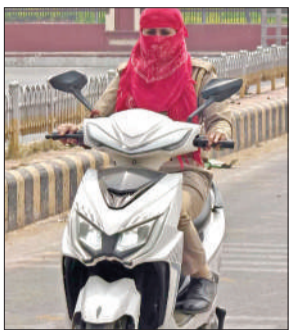
स्कूटी से जाती युवती।