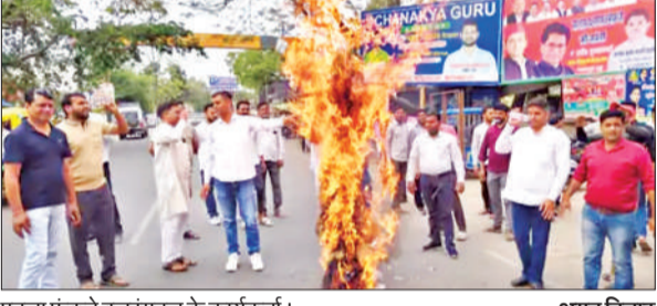
पुतला फूंकते बजरंगदल के कार्यकर्ता।