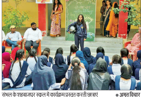
संभल के शहबाजपुर स्कूल में कार्यक्रम प्रस्तुत करती छात्राएं