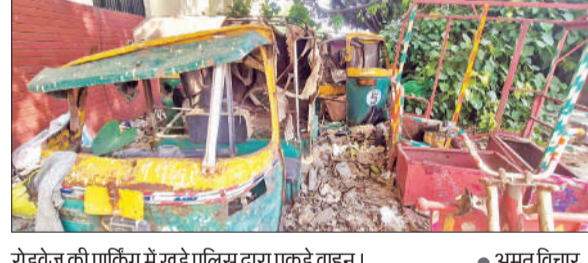
रोडवेज की पार्किंग में खड़े पुलिस द्वारा पकड़े वाहन। ● अमृत विचार

अमृत विचार : गलशहीद थाना क्षेत्र स्थित रोडवेज चौकी के पीछे मुरादाबाद रोडवेज डिपो के यात्रियों के लिए बनी पार्किंग पर पुलिस का कब्जा है। इसे पुलिस ने माल मुकदमाती (जब्त) वाहनों को खड़ा करने का स्थायी ठिकाना बना लिया है। इससे यात्रियों को दिक्कतें हो रही हैं। यह पार्किंग मूल रूप से रोडवेज बस अड्डे पर आने-जाने वाले यात्रियों के वाहनों को खड़ा करने के लिए बनाई गई थी। पिछले कई वर्षों से गलशहीद थाने में जब्त वाहन यहां खड़े कर दिए गए हैं। इससे पार्किंग का मैदान पूरी तरह भर चुका है और