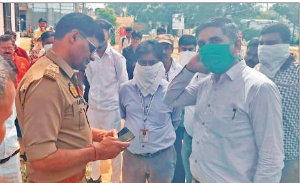
फार्मासिस्ट का शव मिलने के बाद सीएचसी प्रभारी से जानकारी लेते कोतवाल।