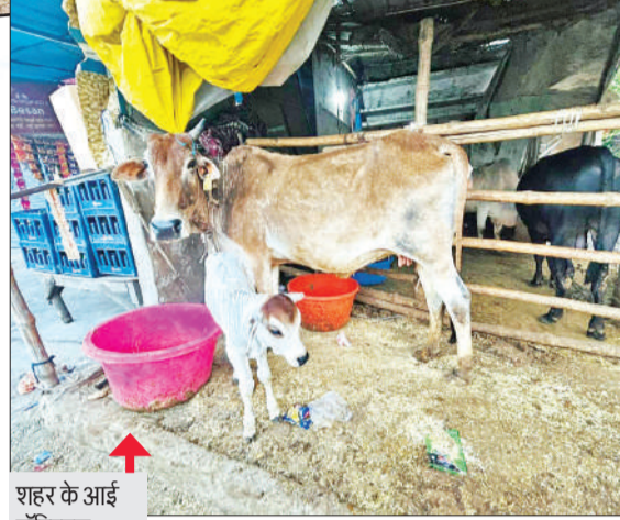
शहर के आई हॉस्पिटल चौराहे के नजदीक छंव के नीचे मौजूद गौवंश