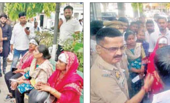
विवाद के बाद घायलों से जानकारी लेते बहुजन समाज पार्टी के कार्यकर्ता।