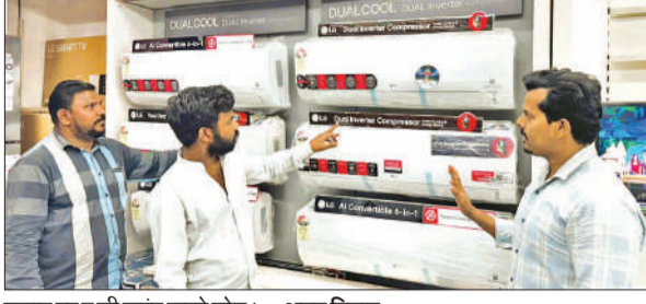
दुकान पर ए सी पसंद करते लोग। ● अमृत विचार

शुक्रवार को सुबह बादलों के बाद धूप निकली तो फिर समय के साथ सूरज की तपिश बढ़ती गई। दोपहर में तापमान बढ़ने के चलते हवा गर्म लगने लगी। दोपहिया वाहन चालकों को इससे मुश्किल हुई। कई लोग सड़क पर जहां भी पेड़ों की छांव मिली वहां गाड़ी रोककर आराम करने के बाद फिर आगे बढ़े। सिविल लाइंस के ग्रीन बेल्ट में पेड़ों की छांव में चार पहिया व दोपहिया वाहन चालक रुक कर तपिश से राहत पाने में जुटे रहे। बाजार में दोपहर में चहल पहल कम रही। बाजार में तरबूज, खरबूज, ककड़ी,