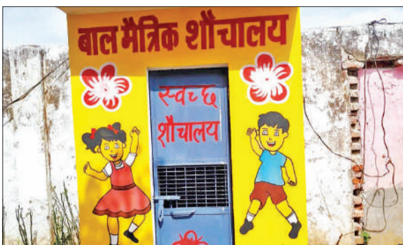
प्राथमिक और कम्पोजिट विद्यालयों के शौचालयों में लगने वाला बाल मैत्री गेट।

दरअसल, पूर्व में कई जनपदों से ऐसी घटनाएं सामने आई थीं, जहां छोटे बच्चे शौचालय के अंदर बंद हो गए थे और समय पर मदद न मिलने से वे घबरा गए थे। इन्हें घटनाओं