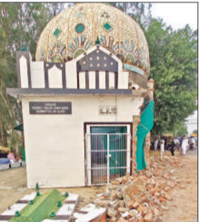
मोहल्ला विशारतनगर में दरगाह के मतवल्लियों ने स्वयं हटाया निर्माण।