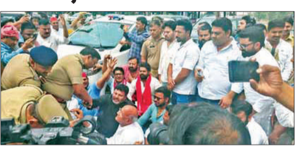
नोएडा जाने के दौरान रोके गए सपा प्रतिनिधिमंडल के नेता।

प्रस्थान से पूर्व पुलिस प्रशासन द्वारा नेताओं को उनके आवास पर नजरबंद करने का प्रयास किया गया, लेकिन सभी नेता निर्धारित कार्यक्रम के अनुसार नोएडा के लिए निकल पड़े। हालांकि रास्ते में ही पुलिस ने प्रतिनिधिमंडल को रोक दिया और वापस भेज दिया, जिसे सपा नेताओं ने लोकतांत्रिक