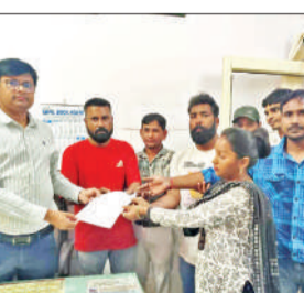
ज्ञापन सौंपते आउटसोर्सिंग कर्मचारी।

अमृता विचार: सामुदायिक स्वास्थ्य केंद्र असमोली पर कार्यरत आउटसोर्सिंग कर्मचारियों ने लंबे समय से वेतन न मिलने से परेशान होकर विरोध जताया और मुख्य चिकित्सा प्रभारी को ज्ञापन सौंपकर जल्द भुगतान की मांग की। कर्मचारियों का आरोप है कि उन्हें पिछले आठ माह से वेतन नहीं मिला है, जिससे उनके सामने आर्थिक संकट खड़ा हो गया है। परिवार के भरण-पोषण से लेकर दैनिक खर्चों तक को पूरा करना मुश्किल हो रहा है। कर्मचारियों ने बताया कि बार-बार संबंधित अधिकारियों से गुहार लगाने के बावजूद समस्या का समाधान नहीं हो सका, जिसके चलते मजबूर होकर उन्हें ज्ञापन सौंपना पड़ा। उन्होंने चेतावनी दी कि यदि जल्द