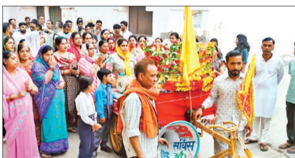
प्रभातफेरी निकालते ब्राह्मण समाज के लोग।

अखिल भारतीय ब्राह्मण महासभा पंजीकृत के तत्वावधान में शुक्रवार की सुबह पांच बजे नगर व क्षेत्र से ब्राह्मण समाज की महिला, पुरुष और बच्चे नगर के मोहल्ला विशनपुरा स्थित पंडित बाबू राम शर्मा क्षेत्रीय ब्राह्मण धर्मशाला में एकत्र हुए। यहां भगवान परशुराम के चित्र पर माल्यार्पण करते हुए