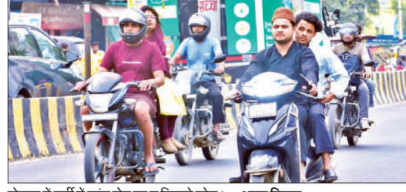
दोपहर में गर्मी में कांट रोड पर यूनिक्ले लोग। ● अमृत विचार

के अलावा रात में भी कई बार बिजली की आवाजाही चल रही है, जिससे रात की नींद में खलल पड़ रहा है। इसको देखते हुए बहुत से ग्राहक इनवर्टर बैटरी खरीदने में लगे रहे। इसके चलते इनवर्टर की बैटरी खराब हो गई वह उसे बदलकर नया लेने के लिए दुकानों पर पहुंचे। हरथला