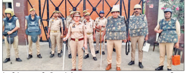
फैक्ट्री के बाहर खड़ी पुलिस फोर्स।

अमृत विचार : नोएडा में वैतन बढ़ाने की मांग को लेकर श्रमिकों द्वारा किए गए बवाल के बाद जनपद की पुलिस पूरी तरह सतर्क हो गई है। शुक्रवार की सुबह पुलिस अधीक्षक लखन सिंह यादव के निर्देशन में शहर के औद्योगिक क्षेत्र में संभावित मजदूर आंदोलन की आशंका को लेकर दर्जनभर फैक्ट्रियों के बाहर कई थानों का पुलिस फोर्स और अधिकारी अलर्ट पर रहे। वहीं बवाल में शांति एवं सुरक्षा व्यवस्था बनाए रखने तथा आमजन में सुरक्षा का भाव स्थापित करने के उद्देश्य से पल्लेग मार्च का आयोजन किया गया। पल्लेग मार्च का मुख्य उद्देश्य यह सुनिश्चित करना था कि किसी भी प्रकार की अफवाह या