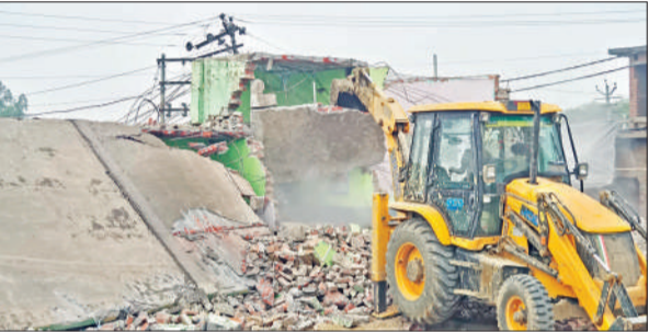
संभल के मुबारकपुर बंद गांव में मदरसे का निर्माण ध्वस्त करता बुलडोजर।

अमृत विचार : संभल जनपद में सरकारी जमीनों पर अवैध निर्माण के खिलाफ प्रशासन का अभियान लगातार तेज हो रहा है। बिछोली गांव में इमामबाड़ा और ईदगाह पर कार्रवाई के बाद शुक्रवार को असमोली थाना क्षेत्र के मुबारकपुर बंद गांव में मदरसे और मस्जिद पर ताबडतोड़ बुलडोजर एक्शन किया गया। कार्रवाई के दौरान करीब 40 फीट ऊंची मीनार को गिरा दिया गया, जबकि मस्जिद के शेष ढांचे को भी ध्वस्त कर दिया गया। राजस्व प्रशासन की टीम सुबह करीब 8:30 बजे नाथ्व तहसीलदार और राजस्व कर्मियों के साथ भारी पुलिस बल लेकर गांव पहुंची। सबसे पहले सरकारी भूमि पर बने मदरसे को बुलडोजर से ढहाया गया। इसके बाद मस्जिद परिसर को खाली कराया गया और अंदर रखे धार्मिक सामान को सुरक्षित बाहर निकालने