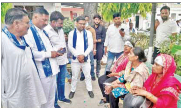
विवाद के बाद घायलों से जानकारी लेते बहुजन समाज पार्टी के कार्यकर्ता।