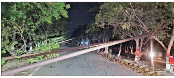
पाकबड़ा में तेज आंधी में गिरे बिजली के खंभे। ● अमृत विचार