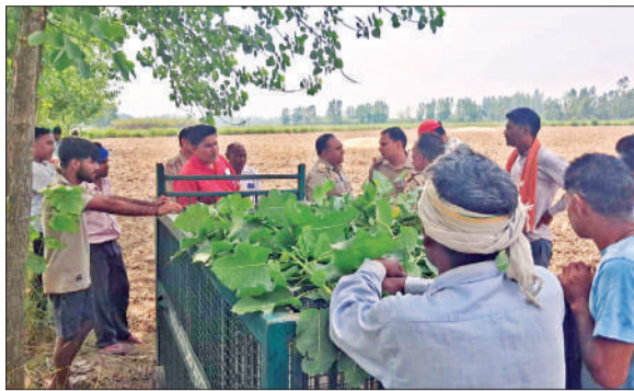
पिंजरा लगाती वन विभाग की टीम।