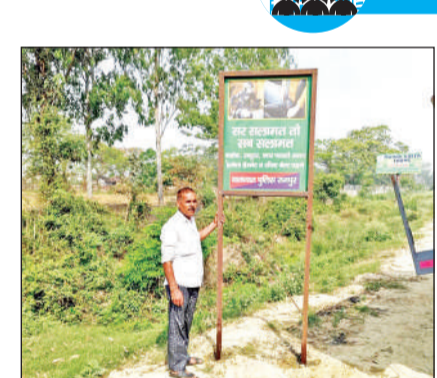
● सुरक्षा के लिए जाएंगे पुख्ता इंतजाम

सामाजिक मूल्यों एवं राष्ट्रीय व स्थानीय योगदानकर्ताओं के प्रति सम्मान को दर्शाती हैं। प्रदेश सरकार की ओर से मूर्तियों की सुरक्षा के साथ ही उन्हें सम्मानजनक स्वरूप प्रदान करने का निर्णय किया गया है। इसके लिए प्रदेश सरकार की ओर से डॉ. भीमराव आंबेडकर मूर्ति विकास योजना शुरू की गई है। इसके तहत मूर्ति व स्मारक स्थलों का सौंदर्यीकरण किया जाएगा। साथ ही यह भी तय किया जाएगा कि उस स्थल पर किसी भी तरह का अतिक्रमण न हो। योजना के तहत नगर विधानसभा क्षेत्र में ऐसे करीब 50 से अधिक स्थलों को चिन्हित किया गया है।