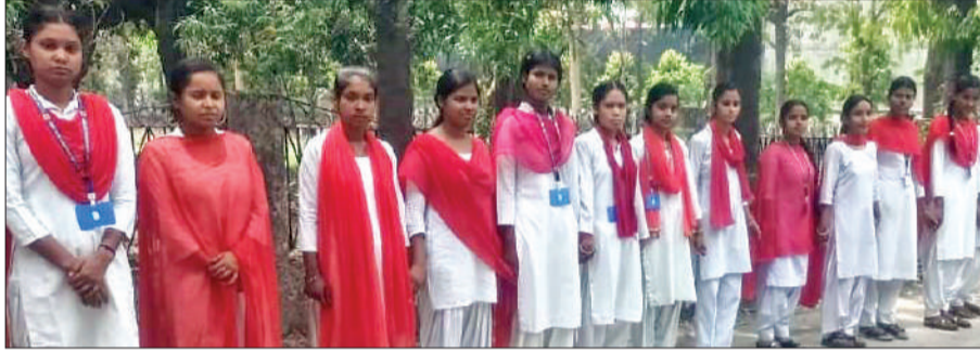
रामलुभाई कॉलेज में मानव शृंखला बनाती छात्राएं।