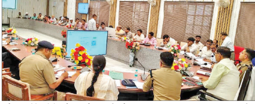
गांधी सभागार में बैठक में मौजूद डीएम-एसपी व अन्य अधिकारी।