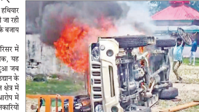
चिरांग में वन विभाग कार्यालय में आग लाने के बाद तोड़फोड़ करते प्रदर्शनकारी।