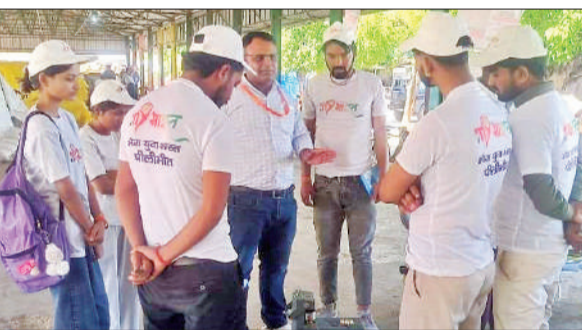
मंडी समिति पहुंचकर जानकारी करते युवा।