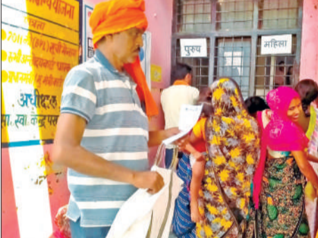
पर्वा बनवाने के लिए खड़े मरीज व तीमारदार।