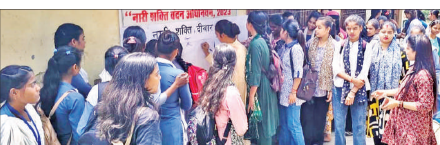
उपाधि कॉलेज में हुए कार्यक्रम में मौजूद छात्राएं।