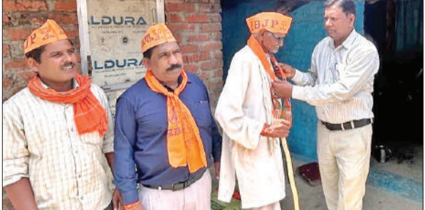
ग्रामीणों को पटकता पहनाकर किया जाता अभिन्नंदन ● अमृत विचार

सुनी। उज्ज्वला योजना, प्रधानमंत्री आवास आदि योजना के लाभार्थियों से मुलाकात की। उनसे फीडबैक लिया गया। साथ ही लोगों को केंद्र और राज्य सरकार की उपलब्धियों के बारे में भी बताया। इस दौरान पटकता पहनाकर अभिन्नंदन भी किया गया।