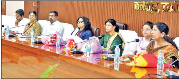
कलक्ट्रेट सभागार में प्रेस वार्ता करती प्रबुद्ध महिलाएं।