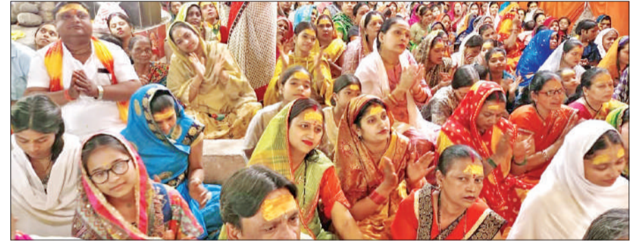
श्रीमद् भागवत कथा सुनते पहुंचे श्रद्धालु।