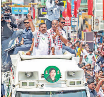
रोड शो के दौरान अनाद्रमुक के पलानीस्वामी।

हो गए हैं कि दो साल के बच्चे भी सुरक्षित नहीं हैं और वे यौन हिंसा और हत्या का शिकार हो रहे हैं। अगर तमिलनाडु में महिलाओं को सुरक्षित रखना है तो अनाद्रमुक को सत्ता में लाना होगा। उन्होंने कहा कि जनता की सुरक्षा का जिम्मा संभालने वाला पुलिसकर्मी भी मौजूदा सरकार में सुरक्षित नहीं है। पलानीस्वामी ने कहा कि पिछले छह महीनों में ही छह पुलिसकर्मियों की हत्या कर दी गई है। पलानीस्वामी ने आरोप लगाया कि नशाखोरों द्वारा हत्या, लूटपाट और यौन हिंसा की घटनाएं हर दिन होती हैं। अनाद्रमुक प्रमुख ने कहा कि 525 चुनावी वादे करने के बावजूद द्रमुक उनमें से एक चौथाई भी पूरे नहीं कर पाई है।