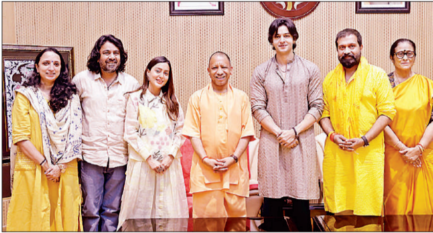
लखनऊ : मुख्यमंत्री योगी से मुलाकात करती फिल्म कृष्णावतारम की टीम।

की पहली उड़ान 22 अप्रैल को फ्लाइनास एयरलाइंस के माध्यम से रवाना होगी। इसके पहले हज हाउस में सुबह 7 बजे एक कार्यक्रम आयोजित किया जाएगा। इस कार्यक्रम में मंत्री दानिश आजाद अंसारी हज समिति के सदस्य, मुस्लिम धर्मगुरु और अन्य गणमान्य लोग उपस्थित रहेंगे। कार्यक्रम के बाद पहले लखनऊ को लेकर जाने वाली बस को मंत्री व अन्य अतिथियों द्वारा हरी झंडी दिखाकर रवाना किया जाएगा।