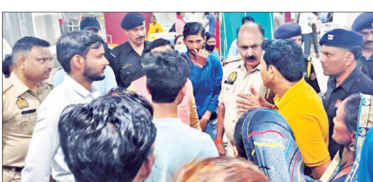
जिला अस्पताल पहुंचकर जानकारी करती पुलिस।