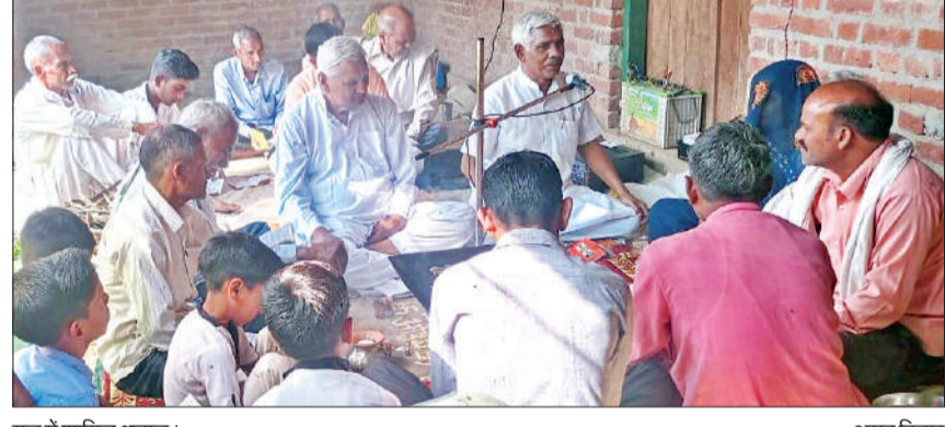
यज्ञ में शामिल श्रद्धालु।