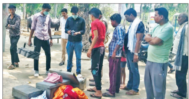
घर से कुछ दूरी पर वैज्ञानिक साक्ष्य जुटाती फॉरेंसिक टीम।