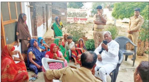
मोतीपुर गांव में पूर्व सांसद भाजपा नेता को आपबीती बताती महिलाएं।