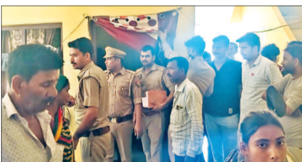
घटना स्थल की जांच कर परिजनों से जानकारी लेती पुलिस।