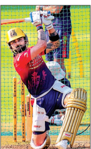
अर्शदीप सिंह के दौरान विराट कोहली।

आरसीबी की टीम में अभी तक सारा ध्यान विराट कोहली पर केंद्रित रहा है और इस दिग्गज बल्लेबाज ने भी अपने प्रशंसकों को निराश नहीं किया है। उन्होंने अब तक टूर्नामेंट में सर्वाधिक रन बनाए हैं और ऑरेंज कैप उनके पास है। लेकिन कोहली भी यह स्वीकार करेंगे कि आरसीबी की बल्लेबाजी अब पूरी तरह से उन पर निर्भर नहीं है। कप्तान रजत पाटीदार, देवदत्त पडिक्कल, फिल साल्ट और टिम डेविड ने इस सत्र में अपनी तूफानी बल्लेबाजी से विशेष छाप छोड़ी है और वे दिल्ली के खिलाफ इसे जारी रखना चाहेंगे।