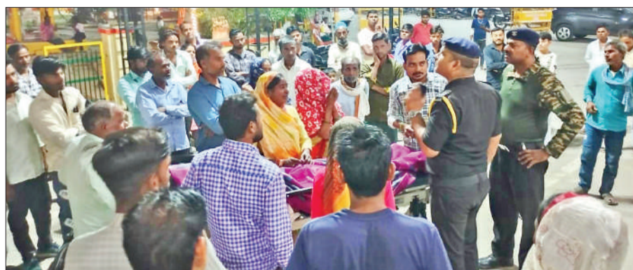
इमरजेंसी गेट पर विरोध दर्ज कराते मृतक के परिजन।