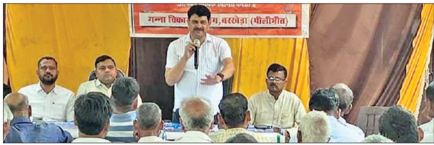
कार्यक्रम में मौजूद किसान।