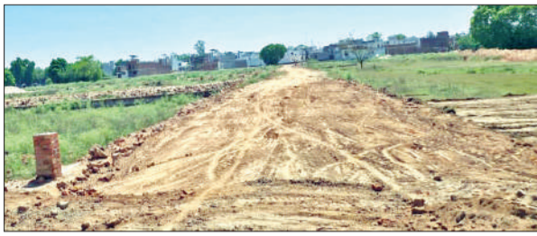
टनकपुर हाईवे से सटे बेशकीमती इलाके में स्थापित की जा रही कॉलोनी। ● अमृत विचार

अमृत विचार: अवैध कॉलोनिनों के खिलाफ प्रशासन का अभियान थम चुका है। चिन्हित की गई 11 अवैध कॉलोनिनों में किए गए निर्माण पर बुल्डोजर चलाने के किए गए दावे हवाहवाई साबित हो गए। कार्रवाई करने के लिए जारी किए गए आदेश दफ्तरों में पड़ी फाइलों में दबकर रह गए हैं। वहीं, बेधड़क होकर नियम ताक पर रखकर कॉलोनिनों स्थापित कराई जा रही है। मिट्टी का पटान कराने से लेकर रास्ते तक तैयार करा दिए गए हैं। ताकि विकसित होने वाली कॉलोनिनों के प्लाट महंगे दाम पर बेचे जा सकें। महज छिटपुट निर्माण को ढहाने के बाद मुहिम ठंडे बस्ते में चली गई। इसके पीछे रसूखदारों की कॉलोनिनों में संलिप्तता को मुख्य कारण माना जा रहा है। फिलहाल जिम्मेदार अभी भी अग्रिम कार्रवाई का रुख स्पष्ट नहीं कर पा रहे हैं। जिसके चलते तमाम तरह की चर्चाएं तेज हैं। पिछले कुछ समय में तेजी से कॉलोनिनों का मकड़जाल फैलता