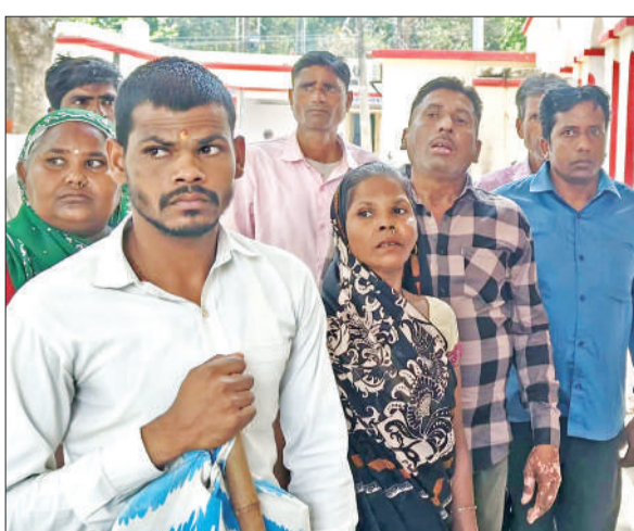
डीएम से शिकायत करने पहुंचे ग्रामीण।