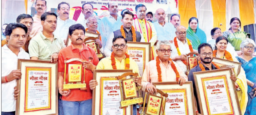
मेला समापन पर गोला गौरव से विभूषित विशिष्ट प्रतिभाएं।