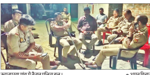
रूपनपुरवा गांव में तैनात पुलिस बल।

अमृत विचार: भीरा थाना क्षेत्र के रूपनपुरवा गांव में गुरुवार देर शाम तेज रफ्तार बाइक चलाने को लेकर दो पक्षों के बीच जमकर मारपीट हो गई। विवाद इतना बढ़ गया कि लाठी-डंडे चलने लगे, जिसमें दोनों पक्षों के चार लोग घायल हो गए। सभी घायलों को सीएचसी बिजुआ में भर्ती कराया गया है।