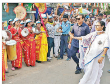
रोड शो के दौरान मुख्यमंत्री ममता बनर्जी।

हासन ने एक सभा को संबोधित करते हुए कहा कि मेरे कार्यकर्ता आज यहां इस सरकार की वापसी की नैक इच्छा से आए हैं। यह लालच नहीं है; यह एक नैक इच्छा है, जो देश के लिए आवश्यक है। कमल हासन ने द्रमुक के साथ अपने गठबंधन को आपसी सम्मान और सुशासन पर आधारित साझेदारी बताया और कहा कि सत्तारूढ़ पार्टी द्वारा उनके सुझावों को अपनाने की तत्परता भी उसे समर्थन देने के उनके निर्णय में एक महत्वपूर्ण कारक थी।