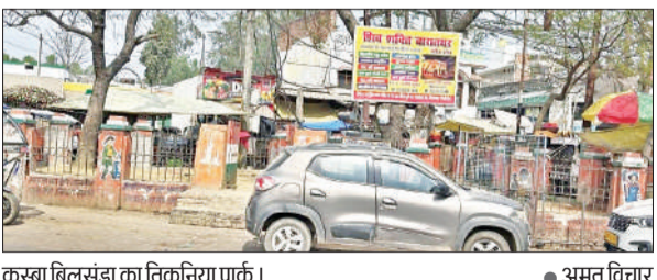
कस्बा बिलसंडा का तिकुनिया पार्क। ● अमृत विचार

अमृत विचार: नगर का तिकुनिया पार्क जल्द ही भगवान परशुराम चौक के रूप में विकसित होगा। यहां पर 47 लाख रुपये की लागत से सौंदर्यीकरण कार्य कराए जाएंगे। बीस फिट ऊंची भगवान परशुराम की मूर्ति भी स्थापित कराई जाएगी। बीते दिनों हुई बोर्ड बैठक में इसे लेकर प्रस्ताव पास किया जा चुका है। बता दें कि नगर में स्थित तिकुनिया पार्क के पास वर्तमान में काफी अतिक्रमण है। जिसकी वजह से जाम की दिक्कत बनी रहती है। इसके अलावा अन्य अव्यवस्थाएं भी हावी हैं। मगर, अब इस तिकुनिया पार्क के सौंदर्यीकरण की दिशा में