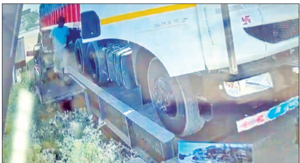
राजस्थान में श्याम धर्म कांटे पर तौल कराता पीड़ित युवक।

पुलिस का दावा है कि आगजनी, तोड़फोड़ करते समय उपद्रवी सरकारी गाड़ियों से कागजात, लाउडहेलर, चार्जर आदि के साथ ही सरकारी कागज भी उठा ले गए। इस उपद्रव में चौकी इंचार्ज