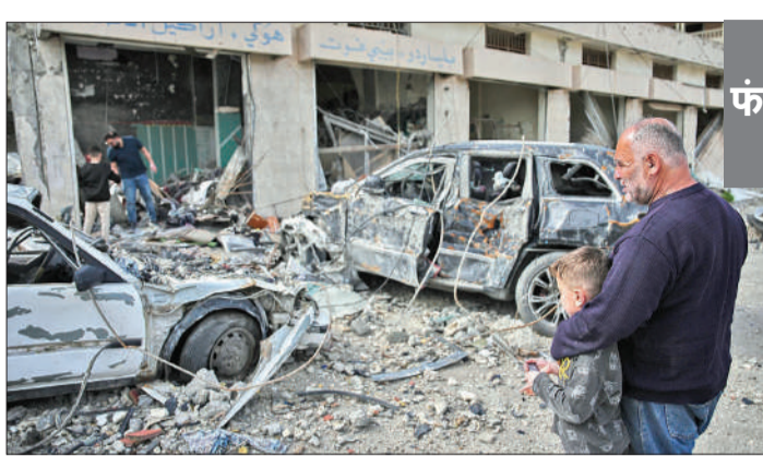
बेरूत में इजराइली हमले से क्षतिग्रस्त हुई इमारत और वाहनों को देखता एक लेबनानी नागरिक।

पाकिस्तान में आधिकारिक सूत्रों ने शुक्रवार को बताया कि दोनों पक्षों को फिर से वार्ता की मेज पर लाने के लिए तेज कूटनीतिक गतिविधियां शुरू की गई हैं। अधिकारियों के मुताबिक पाकिस्तान के असैन्य और सैन्य नेताओं की वार्ता के परिणाम पर आधिकारिक तौर पर कुछ नहीं बताया गया है, लेकिन बृहस्पतिवार शाम से अचानक तैयारियां शुरू कर दी गईं। इस्लामाबाद और रावलपिंडी में सुरक्षाकर्मियों की तैयारियों को इसी नजरिए से देखा जा रहा है। आमतौर पर इस्लामाबाद प्रशासन बड़े सुरक्षा इंतजामों के समय प्रांतों से कानून-व्यवस्था बनाए रखने में मदद मांगता है। पहले दौरे की वार्ता के दौरान इस्लामाबाद में 10,000 से अधिक सुरक्षाकर्मी तैनात किए गए थे। अमेरिका और ईरान ने सप्ताहात में पाकिस्तान में ईरान में संघर्ष समाप्त किए लिए प्रत्यक्ष वार्ता की थी, लेकिन यह 21 घंटे चली यह बातचीत बिना किसी