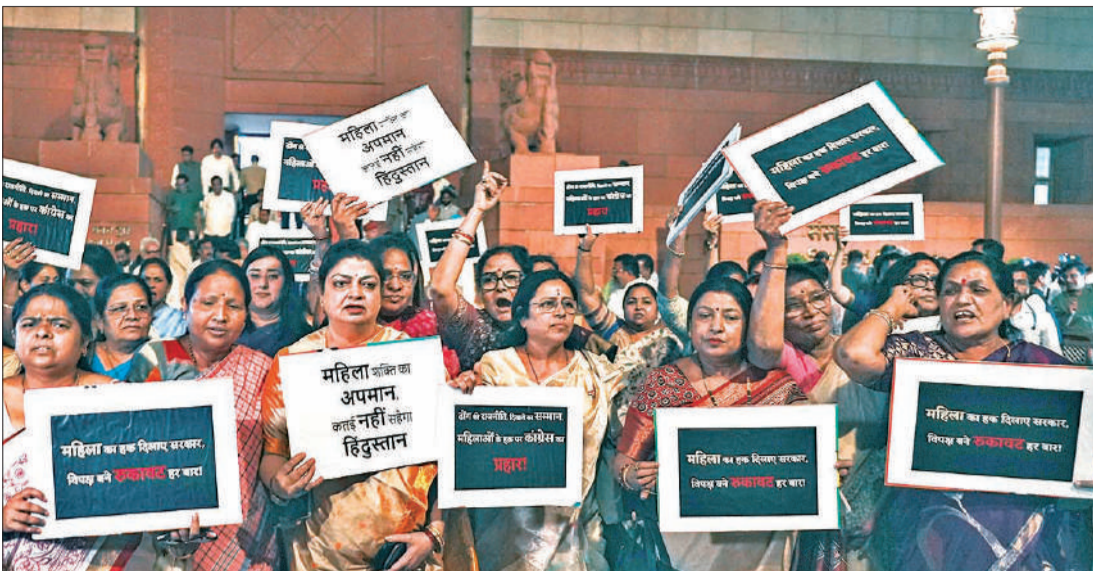
महिला आरक्षण संशोधन विधेयक लोकसभा में पारित न होने के बाद भाजपा की महिला सांसदों ने संसद के बाहर विपक्ष के खिलाफ प्रदर्शन किया।

इस कानून के तहत, यह आरक्षण 2027 की जनगणना के बाद होने वाली परिसीमन प्रक्रिया पूरी होने से पहले लागू नहीं किया जा सकता था, जिसके कारण इसके 2034 से पहले लागू होने की संभावना नहीं थी। विशेष सत्र बुलाकर लोकसभा में चर्चा के लिए लाए गए तीन विधेयक संविधान (131वां संशोधन) विधेयक, 2026, परिसीमन विधेयक 2026 और केंद्र शासित प्रदेश कानून (संशोधन) विधेयक, 2026 इस उद्देश्य से लाए गए थे 2011 की जनगणना के आधार पर परिसीमन कर लोकसभा सीटें 543 से बढ़ाकर 850 की जा सकें और आरक्षण 2029 में लागू किया जा सके।