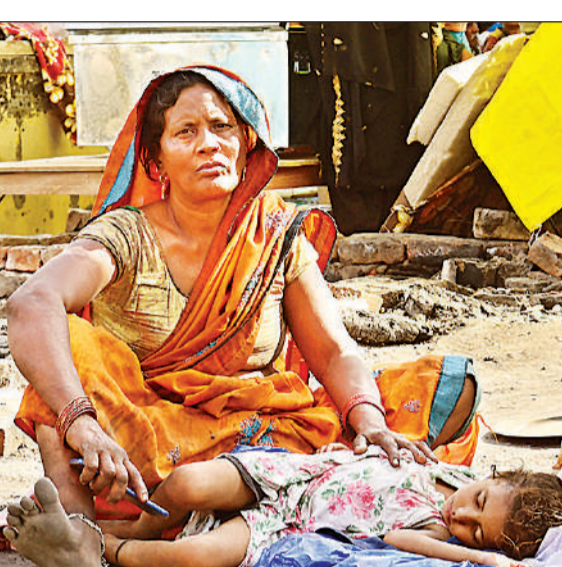
भीषण अग्निकांड में राख हुई विकासनगर के विनायकपुरम सेक्टर-12 की झुग्गी बस्ती में पीड़ितों ने नए सिर से जिंदगी शुरू कर दी है, तिरपाल के नीचे आग में बची गृहस्थी समेटती, बच्चे को भोजन कराती और सुलाती महिलाएं।