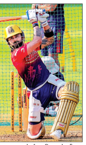
अर्शदीप सिंह के दौरान विराट कोहली।

रॉयल चैलेंजर्स बंगलुरु (आरसीबी) की टीम इंडियन प्रीमियर लीग (आईपीएल) के मौजूदा सत्र में एक ऐसी टीम है जिसने खेल के हर विभाग में अच्छा प्रदर्शन किया है और वह शनिवार को दिल्ली कैपिटल्स के खिलाफ यहां होने वाले मैच में भी अपना दबदबा बनाए रखने की कोशिश करेगी। आरसीबी की टीम में अभी तक सारा ध्यान विराट कोहली पर केंद्रित रहा है और इस दिग्गज बल्लेबाज ने भी अपने प्रशंसकों को निराश नहीं किया है। उन्होंने अब तक टूर्नामेंट में सर्वाधिक रन बनाए हैं और ऑरेंज कैप उनके पास है। लेकिन कोहली भी यह स्वीकार करेंगे कि आरसीबी की बल्लेबाजी अब पूरी तरह से उन पर निर्भर नहीं है। कप्तान रजत पाटीदार, देवदत्त पडिक्कल, फिल साल्ट और टिम डेविड ने इस सत्र में अपनी तूफानी बल्लेबाजी से विशेष छाप छोड़ी है और वे दिल्ली के खिलाफ इसे जारी रखना चाहेंगे।