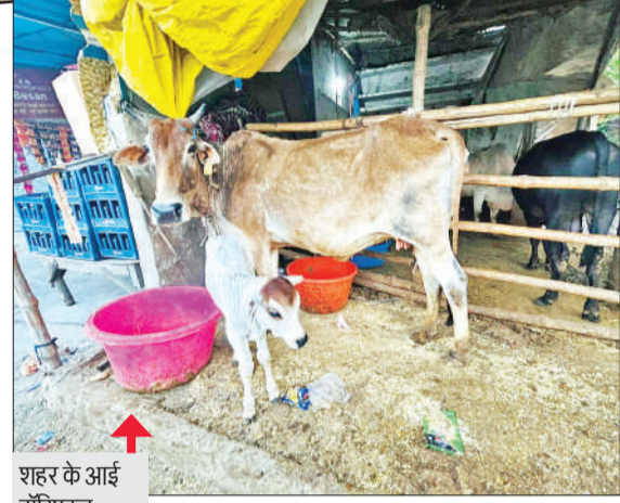
शहर के आई हॉस्पिटल चौराहे के नजदीक छंव के नीचे मौजूद गौवंश

महिला और उनके बच्चों ने हर गौवंश का नाम रखा गया है। राजा, गणेश, गौरी, शंकर, गौरा, यशोदा, ममता, मंत्र, काली, रघु, भरत, आदि, छोटू, चंदू, बिल्लो सहित अन्य नामों से पुकारे जाने वाले गौवंश नाम सुनते ही दौड़ पड़ते हैं।