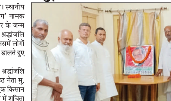
पूर्व प्रधानमंत्री चंद्रशेखर के जन्म शताब्दी समारोह के क्रम में आयोजित श्रद्धांजलि कार्यक्रम में मौजूद लोग।