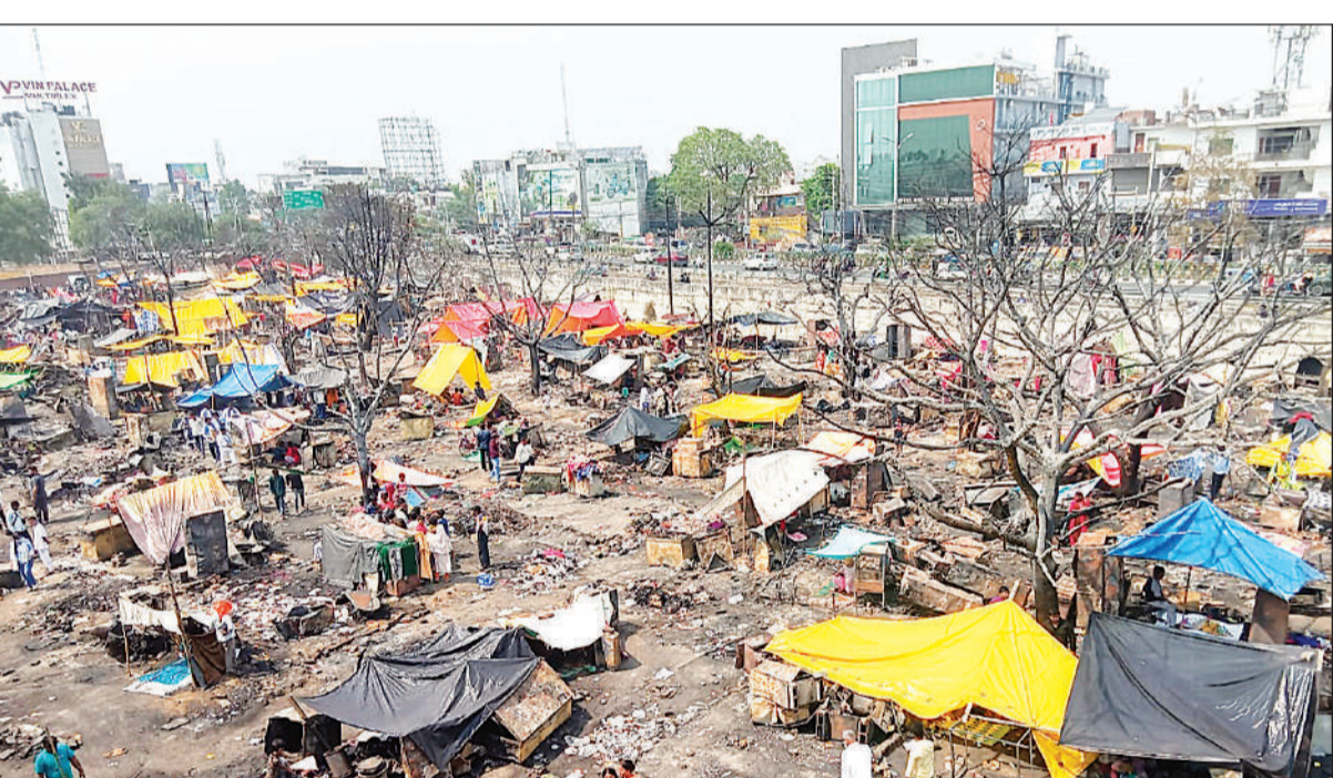
भीषण अग्निकांड में राख हुई विकासनगर के विनायकपुरम सेक्टर-12 की झुगियों के अवशेष समेटने के बाद तिरपाल तानकर बनाए गए आशियाने।

अमृत विचार: रिंग रोड विकासनगर के विनायकपुरम सेक्टर-12 स्थित झुग्गी बस्ती अग्निकांड में राख झुग्गी बस्ती में आह और कराह के बीच शुक्रवार को फिर जिंदगी शुरू हो गई। राख में बचे अवशेषों और समाजसेवियों व राजनीतिक दलों की ओर से मिली मदद और कुछ जुगाड़ सहारे लोगों ने तिरपाल तानकर गुजर बसर शुरू कर दी है। भोजन और पानी की व्यवस्था नगर निगम और जिला प्रशासन की ओर से भी की जा रही है। अग्निकांड पीड़ितों को प्रशासन ने सर्वे भी शुरू करा दिया है। इससे पीड़ितों में कुछ राहत मिलने की उम्मीद बढ़ गई है।