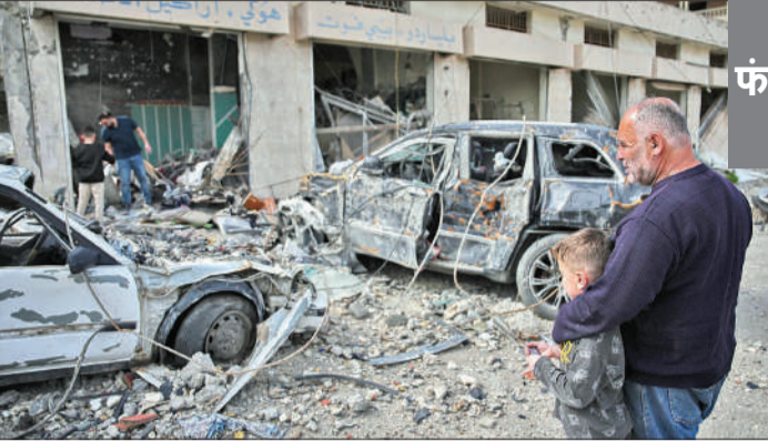
बेरूत में इजराइली हमले से क्षतिग्रस्त हुई इमारत और वाहनों को देखता एक लेबनानी नागरिक।

पाकिस्तान में आधिकारिक सूत्रों ने शुक्रवार को बताया कि दोनों पक्षों को फिर से वार्ता की मेज पर लाने के लिए तेज कूटनीतिक गतिविधियां शुरू की गई हैं। अधिकारियों के मुताबिक पाकिस्तान के असैन्य और सैन्य नेताओं की वार्ता के परिणाम पर आधिकारिक तौर पर कुछ नहीं बताया गया है, लेकिन बृहस्पतिवार शाम से अचानक तैयारियां शुरू कर दी गईं। इस्लामाबाद और रावलपिंडी में सुरक्षाकर्मियों की तैयारियों को इसी नजरिए से देखा जा रहा है। आमतौर पर इस्लामाबाद प्रशासन बड़े सुरक्षा इंतजामों के समय प्रांतों से कानून-व्यवस्था बनाए रखने में मदद मांगता है। पहले दौर की वार्ता के दौरान इस्लामाबाद में 10,000 से अधिक सुरक्षाकर्मी तैनात किए गए थे। अमेरिका और ईरान ने सप्ताहात में पाकिस्तान में ईरान में संघर्ष समाप्त के लिए प्रत्यक्ष वार्ता की थी, लेकिन यह महिंपार और बच्चे गंभीर रूप से झुलस गए हैं और बचाव कार्य जारी है।