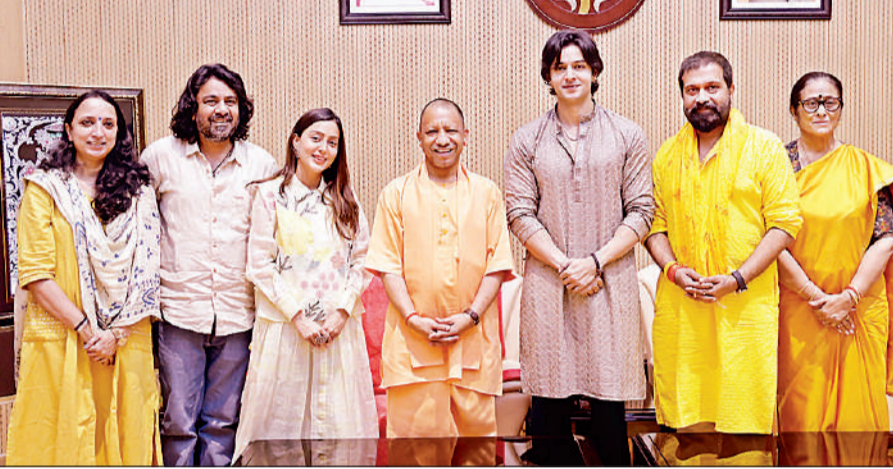
लखनऊ : मुख्यमंत्री योगी से मुलाकात करती फिल्म कृष्णावतारम की टीम।

प्रभावी होगी और इसका भुगतान मई माह में किया जाएगा। सरकार ने यह भी स्पष्ट किया है कि इपीएफ और ईएसआई के अतिरिक्त किसी अन्य प्रकार की कटौती मान्य नहीं होगी। ओवरटाइम का भुगतान दोगुनी दर से किया जाएगा और बोनस व प्रेच्युटी जैसे सभी वैधानिक लाभ सुनिश्चित किए जाएंगे।