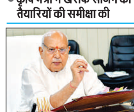
कृषि मंत्री सूर्य प्रताप शाही