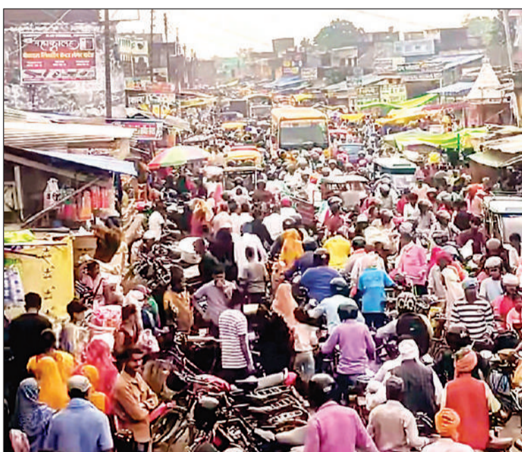
ककरहवा बाजार में उमड़ी लोगों की भीड़।

ककरहवा, सिद्धार्थनगर, अमृत विचार। भारत-नेपाल सीमा पर नेपाल सरकार द्वारा भंसार (कस्टम) नियमों में हालिया सख्ती का असर अब सीमावर्ती क्षेत्रों में साफ दिखाई देने लगा है। ककरहवा में लगने वाले साप्ताहिक बाजार के दौरान इस बार असामान्य रूप से भारी भीड़ देखने को मिली, जिससे पूरे बाजार क्षेत्र में घंटों जाम की स्थिति बनी रही। बाजार में खरीदारी के लिए आए लोगों की संख्या में अचानक बढ़ोतरी हो गई है। स्थानीय व्यापारियों के अनुसार, नेपाल की ओर से कस्टम नियम कड़े किए जाने के कारण सीमापार से आने-जाने वाले लोगों ने पहले ही आवश्यक सामान खरीदना शुरू कर दिया है, जिससे बाजार में लोगों की भारी भीड़ बढ़ गयी। भीड़ के चलते सड़कों पर पैदल चलना तक मुश्किल हो गया। दोपहिया और चारपहिया वाहनों की लंबी कतारें लग गईं, वहीं यातायात व्यवस्था पूरी तरह से चरमरा गई प्रशासन ने काफी मशकूत कर स्थिति को संभाला। स्थानीय दुकानदारों ने नेपाल सरकार से मांग की है की सीमाई इलाकों में भंसार नियम सख्त ना किया जाये।