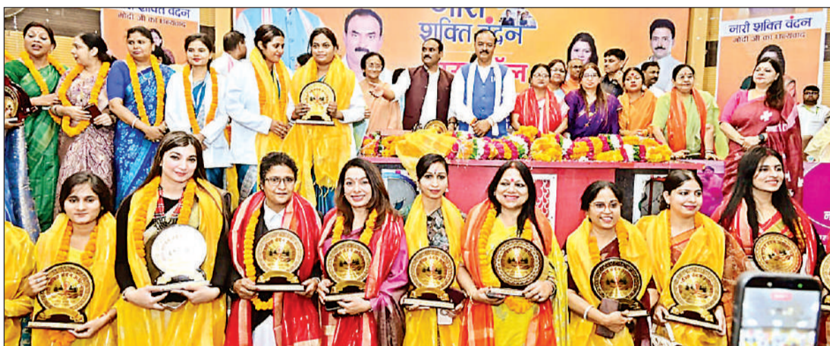
प्रयागराज में नारी शक्ति वंदन अधिनियम-2023 संबंधी कार्यक्रम में सम्मानित की गई महिलाओं के साथ उप मुख्यमंत्री केशव प्रसाद मौर्य।

13,006, 14,306 और 16,025 रुपये की दरें निर्धारित हैं। तृतीय श्रेणी में शेष जिलों के लिए 12,356, 13,590 और 15,224 रुपये की मजदूरी तय की गई है। इन सभी दरों में मूल वेतन के साथ परिवर्तनीय महंगाई भत्ता (वीडीए) शामिल है। सरकार के अनुसार, 2019 और 2024 में प्रस्तावित संशोधन लागू न होने से मजदूरी में अंतर बढ़ गया था। अब उपभोक्ता मूल्य सूचकांक के आधार पर लंबित पुनरीक्षण को ध्यान में रखते हुए यह निर्णय लिया गया है। इसका उद्देश्य श्रमिकों को राहत देने के साथ औद्योगिक शांति बनाए रखना और उत्पादन चक्र को सुचारु रखना है। सरकार ने स्पष्ट किया है कि नई दरों के उल्लंघन पर सख्त कार्रवाई की जाएगी।