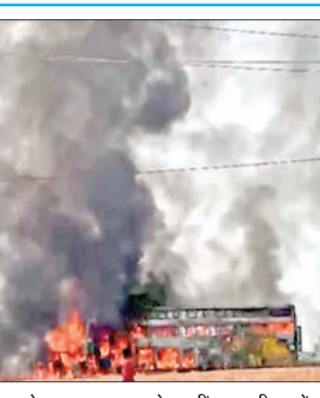
दुर्घटना के बाद बस-कार से उदतीं आग की लपटें।