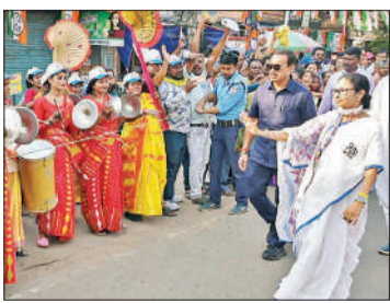
रोड शो के दौरान मुख्यमंत्री ममता बनर्जी। के दौरान पूरे मार्ग पर टीएमसी के झंडे दिख रहे थे। कई लोगों के हाथों में नीले और सफेद रंग के गुब्बारे थे। पश्चिम बंगाल में 23 और 29 अप्रैल को दो चरण में मतदान होगा।

दुर्गापुर। पश्चिम बंगाल की मुख्यमंत्री ममता बनर्जी ने शुक्रवार को यहां दुर्गापुर में तृणमूल कांग्रेस के उम्मीदवार के समर्थन में रोडशो किया। इस दौरान लोगों ने सड़क के दोनों तरफ और बालकनी व छतों पर खड़े होकर टीएमसी प्रमुख का अभिवादन किया और मुख्यमंत्री ने हाथ जोड़कर उनका अभिवादन स्वीकार किया। बनर्जी ने स्टील मार्केट से चलना शुरू किया और लगभग दो किलोमीटर दूर भिरिगी मोड़ तक पहुंचीं। इस दौरान दुर्गापुर और आसपास के निर्वाचन क्षेत्रों के टीएमसी उम्मीदवार उनके साथ थे। पार्टी समर्थकों ने दीदी-दीदी और 'जय बाल्ला' के नारों के बीच फूल बरसाकर व स्कार्फ पहनाकर बनर्जी का अभिवादन किया। रोडशो