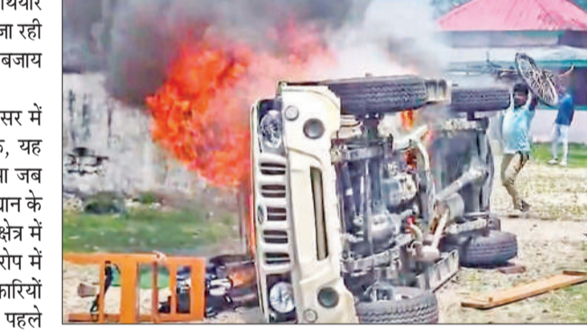
चिरांग में वन विभाग कार्यालय में आग लाने के बाद तोड़फोड़ करते प्रदर्शनकारी।